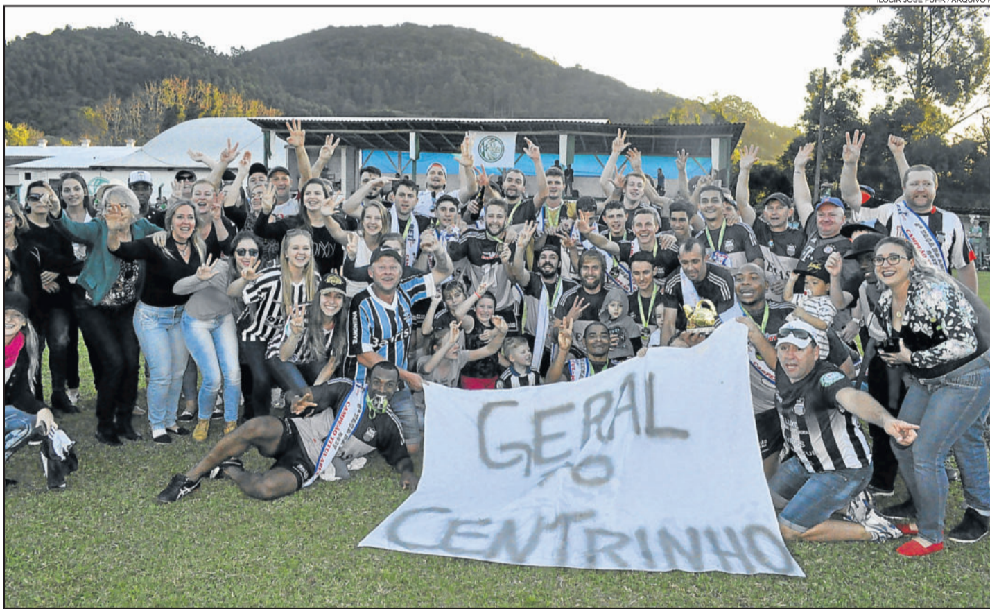
ECAS, de Imigrante, foi o campeão da Taça da Amizade de 2017