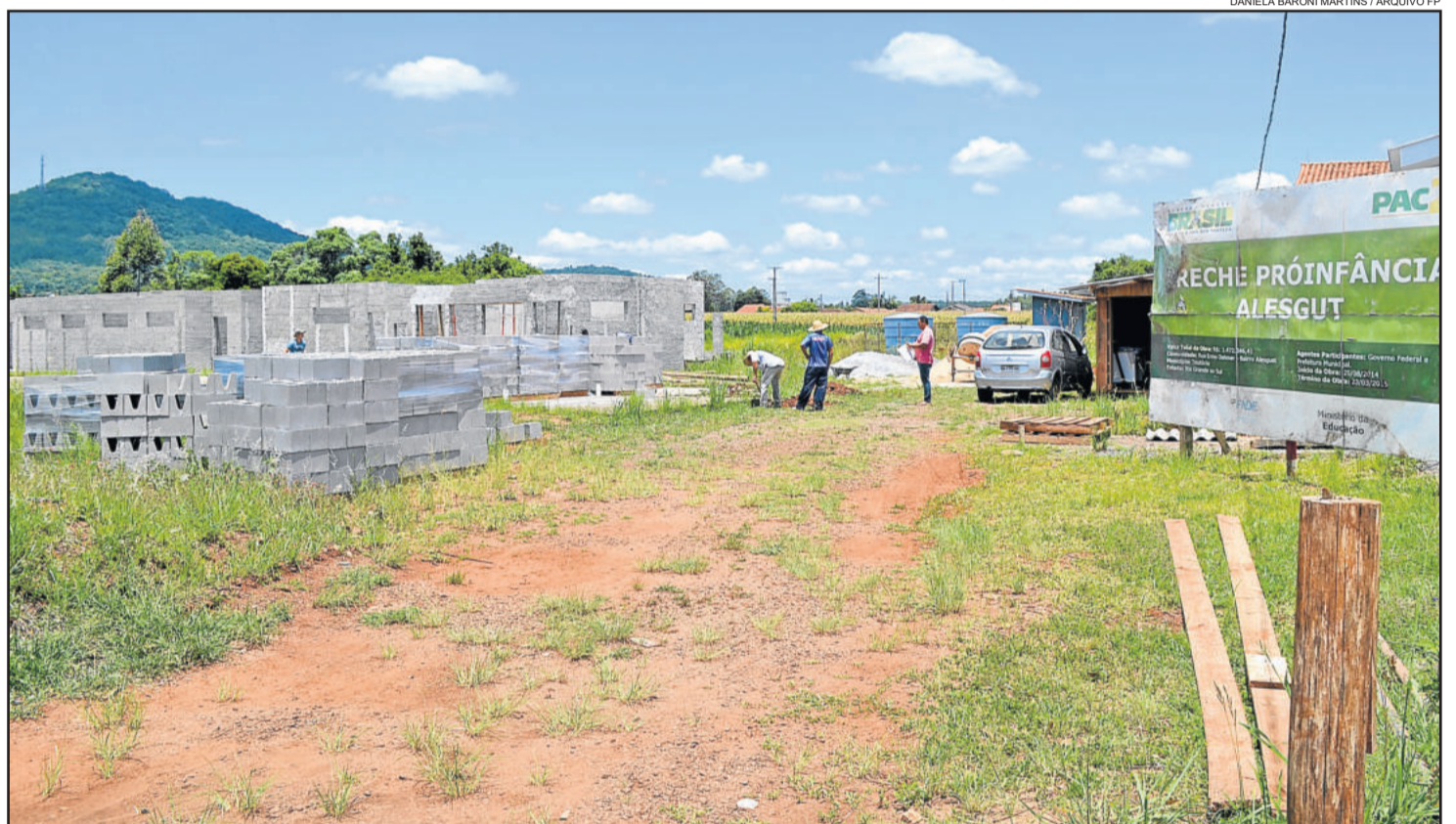
Nova Proinfância no Bairro Alesgut deve ajudar a diminuir a lista de espera

Hoje a maior demanda por vagas fica no Bairro Canabarro. A Administração estuda a locação de um imóvel para implantação de uma escola infantil para diminuir a fila de espera. A nova escola de educação infantil do Bairro Alesgut também deve contribuir para a redução da fila.