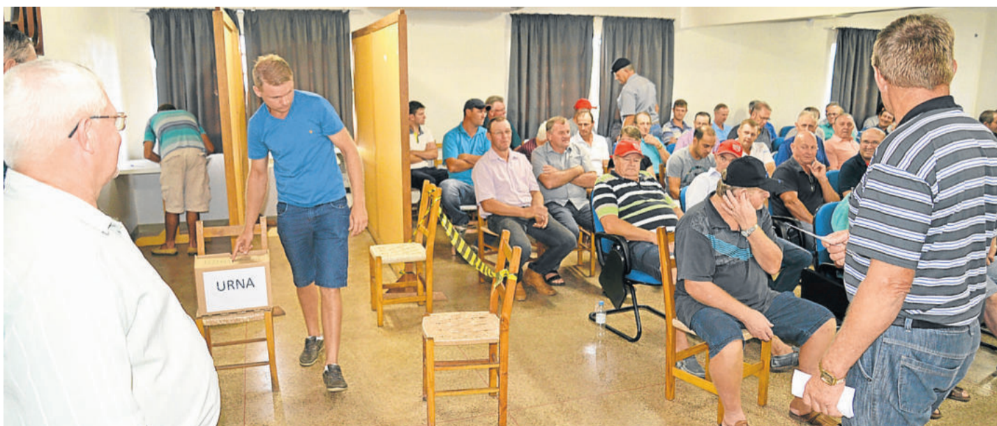
Líderes de núcleo definiram integrantes de composição de chapa do Conselho Fiscal a ser apresentada na Assembleia Geral Ordinária de fevereiro

Entre decisões que serão tomadas pelos associados na AGO de fevereiro, Bayer falou da correção do capital social dos associados e do pagamento da conta movimento, entre outros detalhes da Ordem do Dia para esse evento.