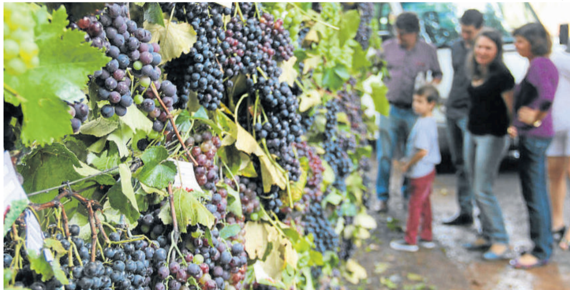
Tradicional festa em Marcorama é a atração deste domingo