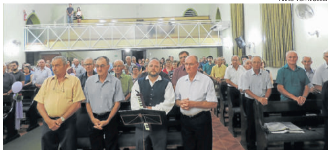
Culto abriu a programação no sábado