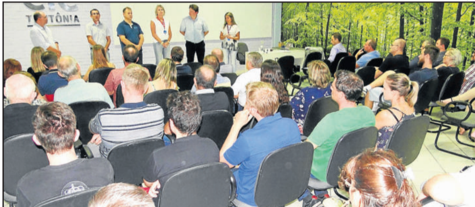
Evento reuniu empresários do ramo moveleiro no Auditório 01 da CIC Teutônia

Após o processo de seleção das empresas, ocorre a primeira reunião de trabalho entre os envolvidos. A continuidade será com encontros pré-agendados, com treinamentos e consultorias nas empresas.