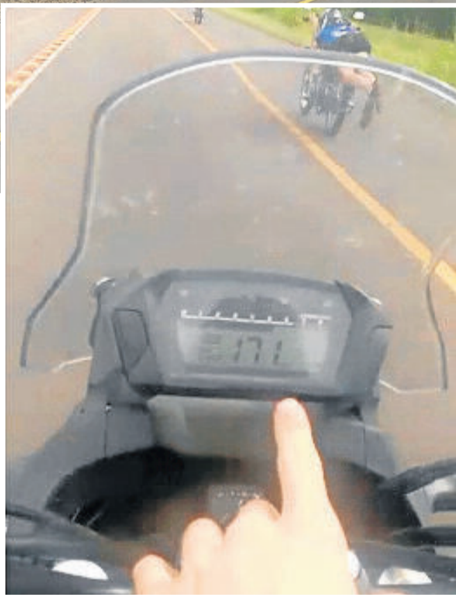
Em vídeo, jovens registram a velocidade atingida