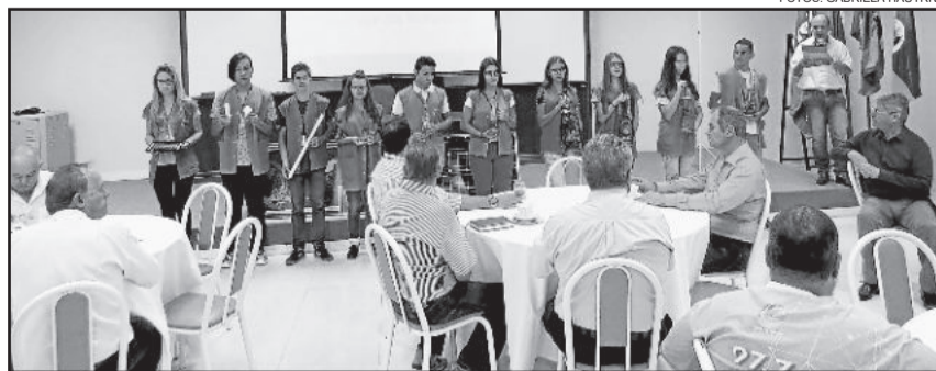
Lançamento do projeto ocorreu na manhã de ontem (02/02) na sede administrativa da Certel

Como teste para a implantação, a Certel instalou 78 placas de painéis solares em sua sede administrativa. Além disso, já conta com 50 instalações particulares, nas quais o associado implantou o sistema em sua casa ou empresa. O diretor Salecker lembra que para adquirir o sistema fotovoltaico é preciso consumir mais de 300 a 400 kw/h por mês para que se tenha vantagem. “Quem gasta menos que isso, a princípio, não terá retorno financeiro, apenas estará investindo seu dinheiro no projeto”, explica. Isto porque a Certel tem a menor tarifa de