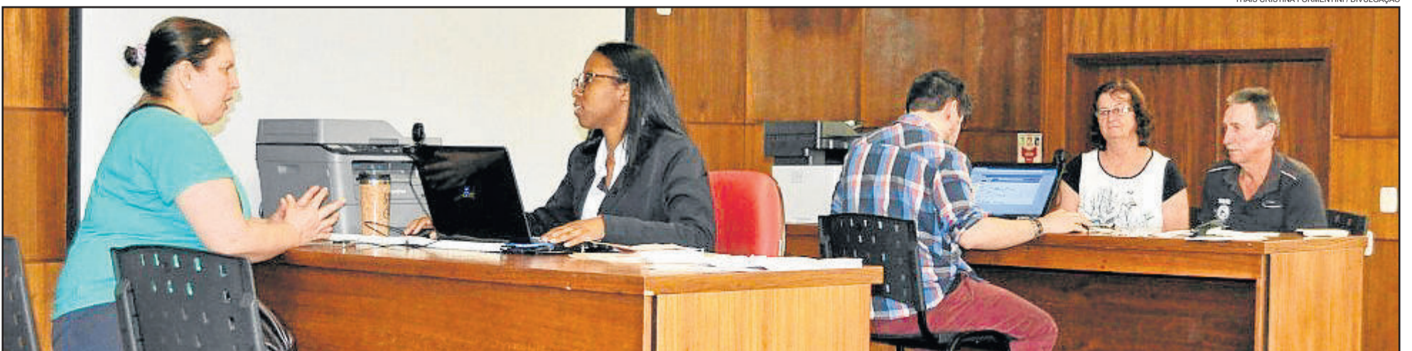
Processo iniciou em setembro de 2017 e se estendeu até janeiro de 2018