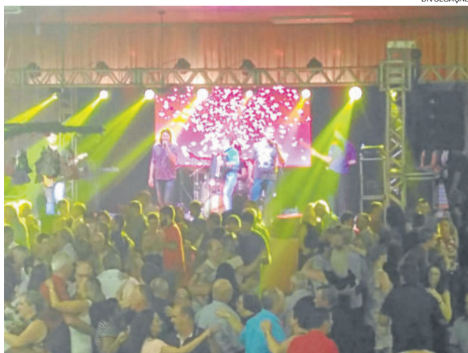
Alma Nova animou o Baile de Kerb