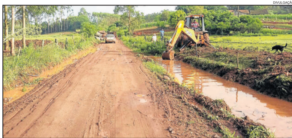
Diversas estradas receberam obras de recuperação

Ao todos, a Administração Municipal investiu mais de R$ 3,4 milhões, por meio da Secretaria de Obras, Serviços Públicos e Trânsito, em obras de melhoria.