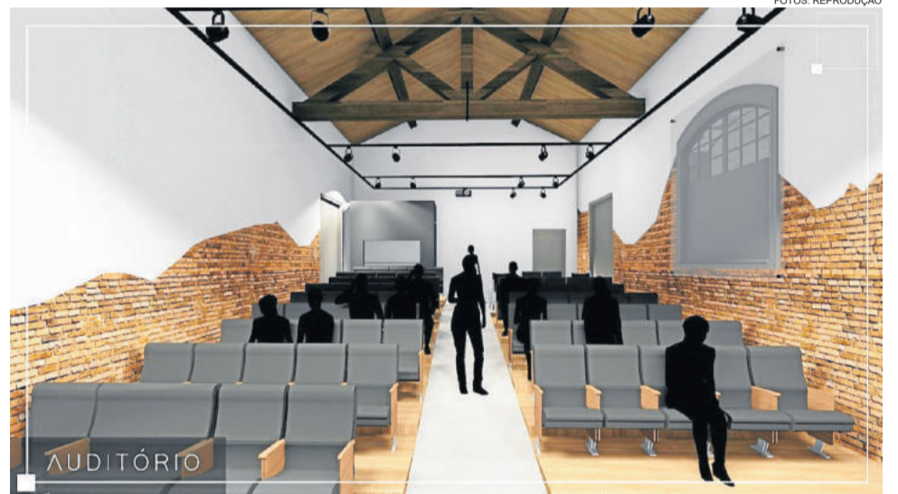
Melhorias e espaços como auditório estão previstos no projeto