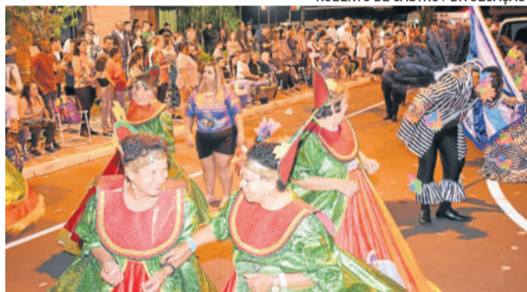
Foliões conferiram os desfiles de escolas de samba e blocos carnavalescos