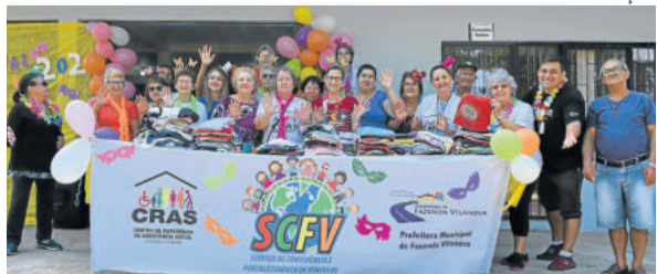
Carnaval Solidário divulgou a rouparia do CRAS