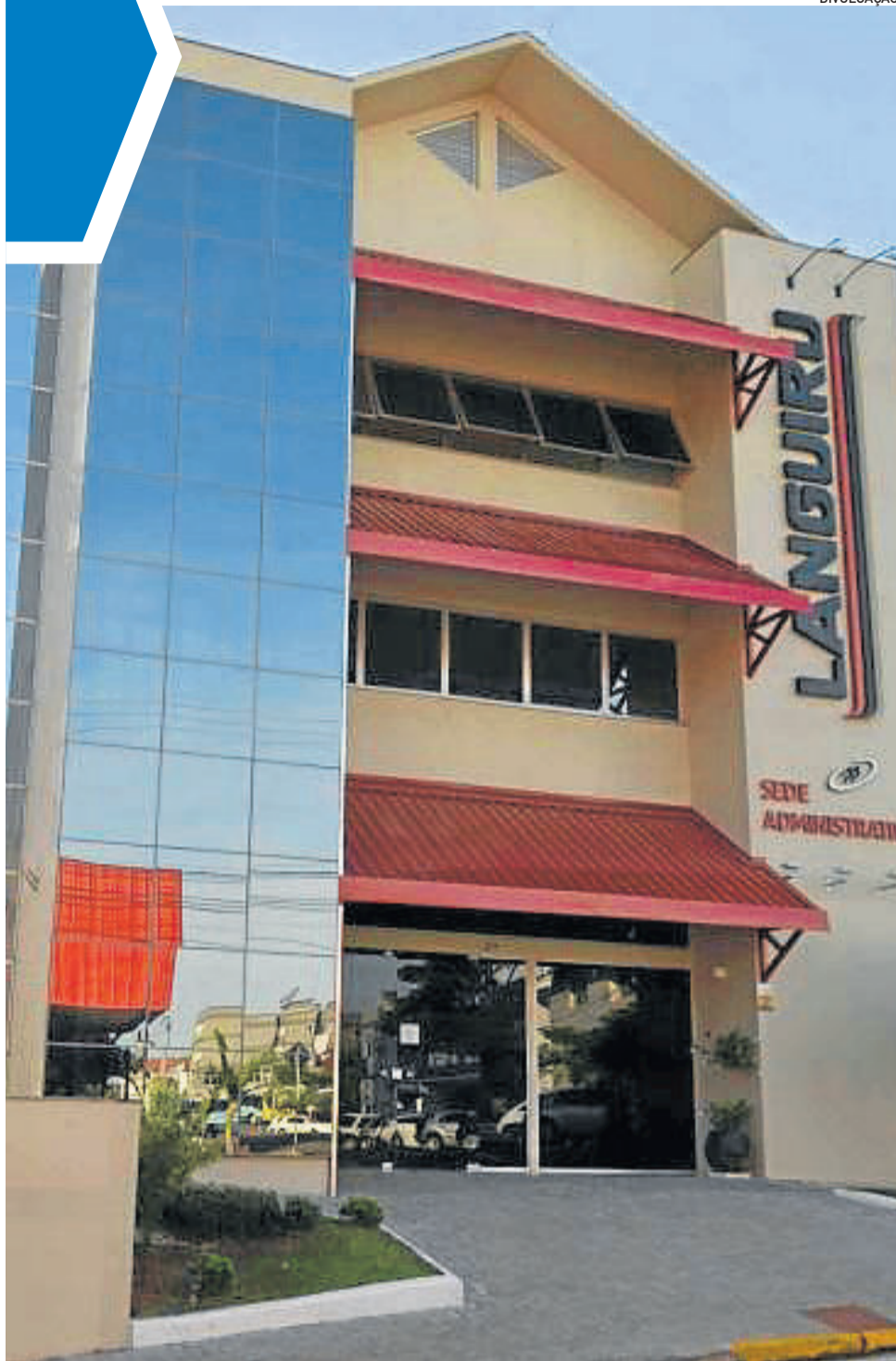
Sede Administrativa da Languiru