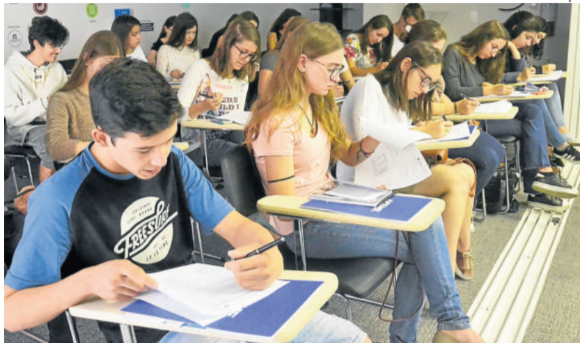
Projeto tem como público-alvo os jovens de 14 a 20 anos