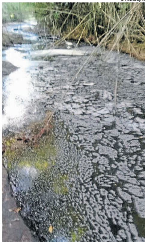
Imagem disponibilizada pelo denunciante mostra espuma branca

A água do arroio deságua no Arroio Boa Vista, onde, conforme relatos, há banhistas, além de animais que bebem água no local. Em contato com a administração municipal, a reportagem foi informada de que o departamento está procedendo com a investigação.