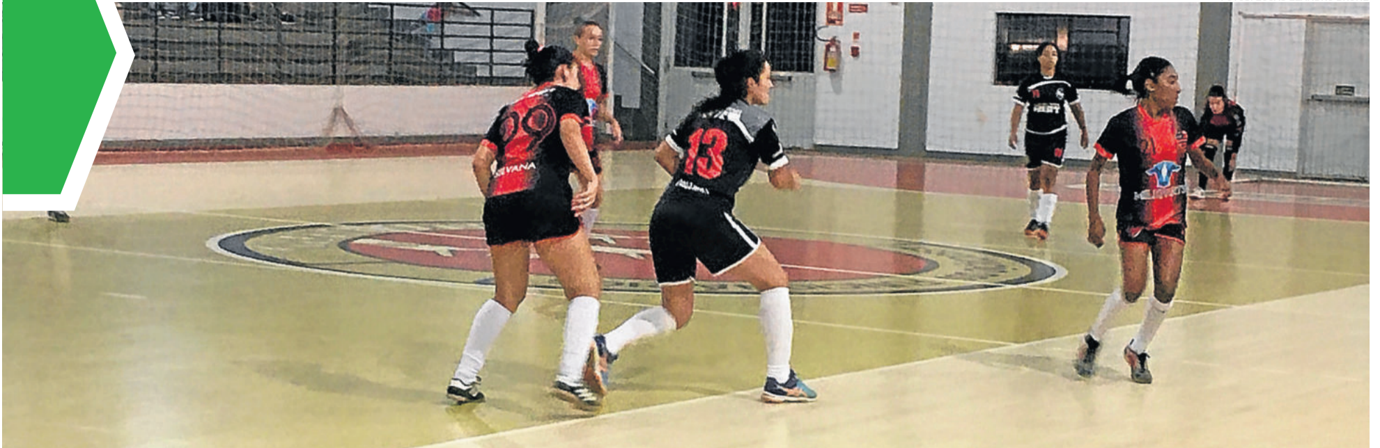
No Futsal, jogos semifinais já serão na sexta