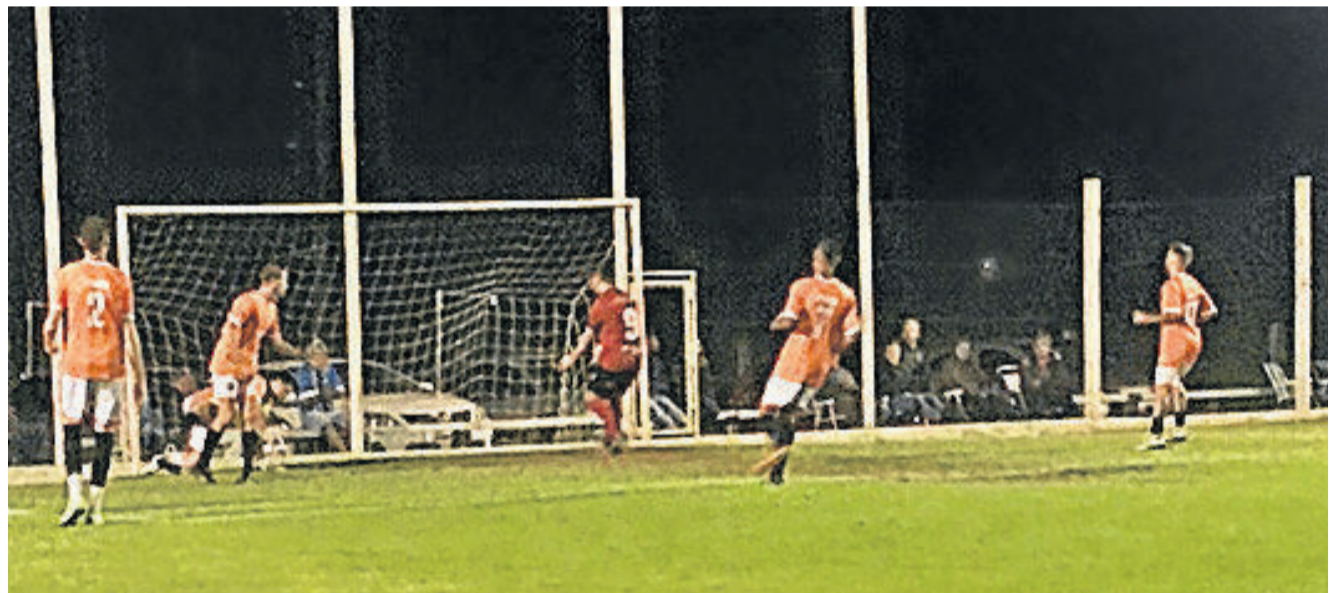
No Futebol Sete, quartas de final do Força Livre estão definidas

O Futsal Masculino e Feminino encerrou a etapa classificatória e também já projeta as semifinais para a próxima sexta-feira (06/03). No Vôlei de Areia em Duplas, as categorias Masculino e Feminino já entram nas quartas de finais, enquanto que o Misto ainda terá dois jogos classificatórios.