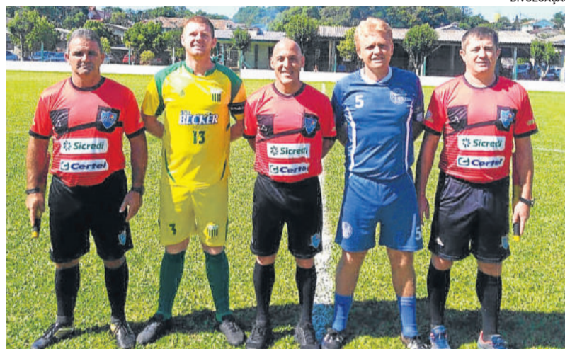
No Bairro Alesgut, Ouro Verde superou o Alto Taquari e segue com 100%