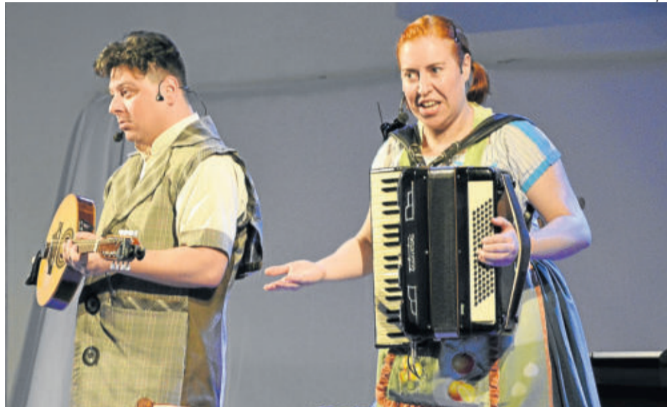
Atividades culturais estão inclusas na programação da feira

11º Concurso de Fotografias "Westfália em Foco". Com o tema "Riquezas da tua cultura", as três primeiras colocadas serão selecionadas por um corpo de jurados. Já a quarta colocada será escolhida pela comunidade