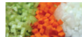
BRUNOISE (3MM DE LADO)

* Concassé: Ferver água em uma panela, largar os tomates com um leve corte na casca em forma de X, deixar por alguns minutos e retirar e colocar em uma tigela com água e gelo, após retirar a casca.