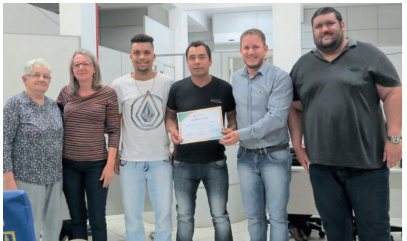
Equipe do União da Germano recebeu homenagem pelo título da Série B