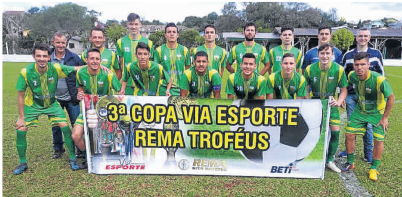
Aspirantes do Ouro Verde é líder da categoria