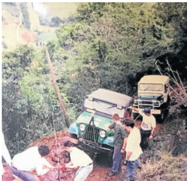
Trilha da Subida do Céu - Lajeado - 1995

Em 2017, os dois voltam a fazer suas expedições juntos e vão ao Chile de moto numa viagem de 15 dias e uns 8.000 km. Em 2018, vão juntos ao extremo sul do Chile para conhecerem a Carretera Austral e chegar a Villa O'Higgins, o último povoado chileno acessível por terra no sul do Chile. Do total de 9.800 km desta viagem, uns 1.700 foram de estrada de terra e lama.