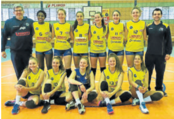
Languiru/Martin Luther/AVATES "A" lidera a competição