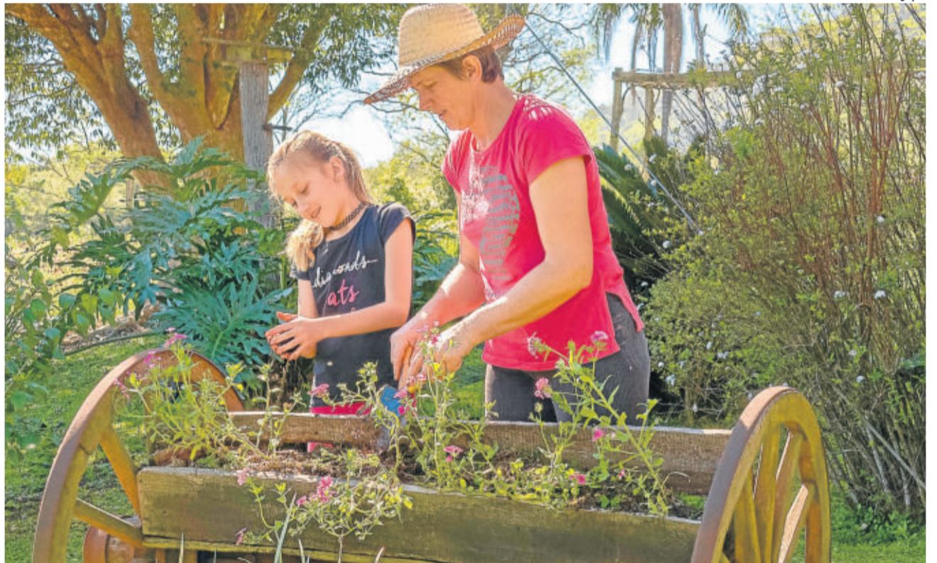
5º lugar 2018- Plante o seu jardim e decore sua alma