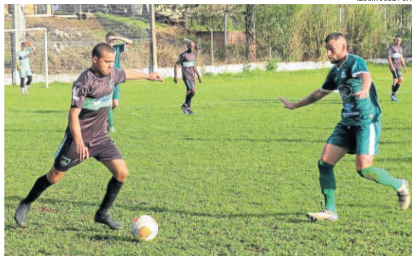
Em Estrela, Juventude venceu o Imigrante por 3 a 0

No segundo tempo, as duas equipes continuaram buscando o gol, mas não conseguiram balançar as redes. Com o resultado, o Juventude-We subiu para 4 pontos, ultrapassando o Imigrante, que permanece com seus 3 pontos na competição.