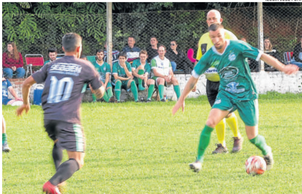
Juventude da Berlim conquistou sua primeira vitória no domingo