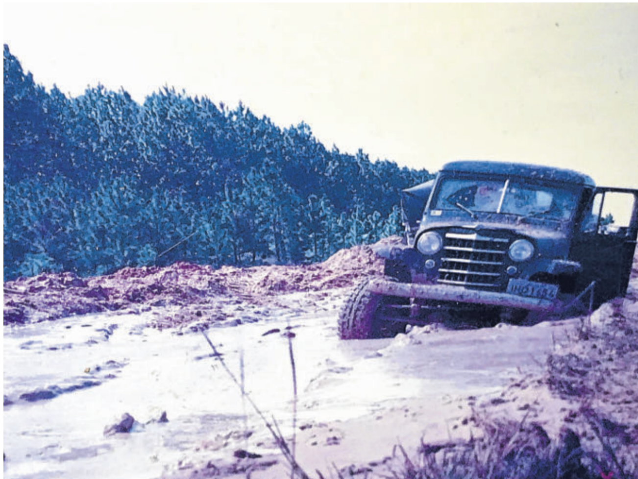
Aventuras de Barilli e Gerhardt foram muitas, como na Estrada do Inferno - Mostardas início anos 1990