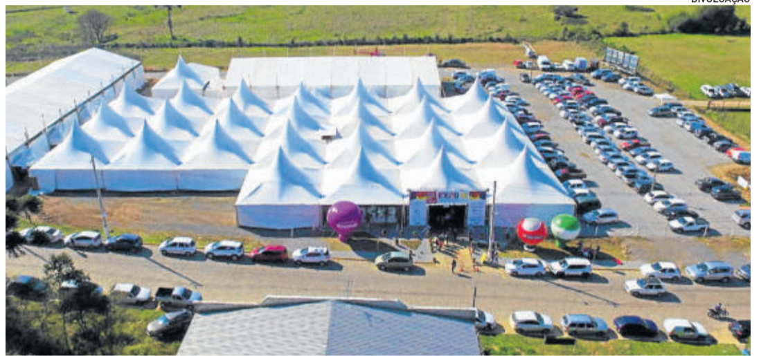
Multifeira de Carlos Barbosa acontece em dois finais de semana

06/09: das 19h às 21h 07/09: das 13h às 21h 08/09: das 13h às 19h 13/09: das 17h às 21h 14/09: das 13h às 21h 15/09: das 13h às 19h * A programação completa está disponível em: www.multifeira-aci.com.br