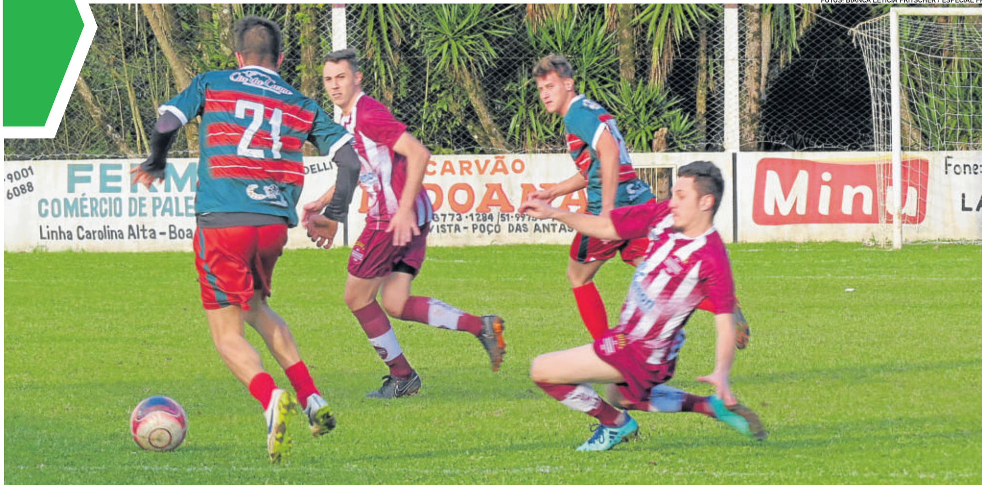
Boavistense e União Santo André estão garantidos na próxima fase