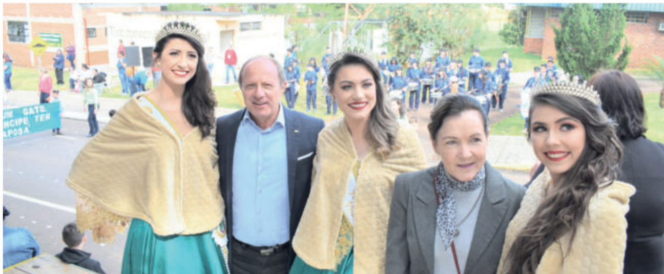
Entidades participaram do desfile