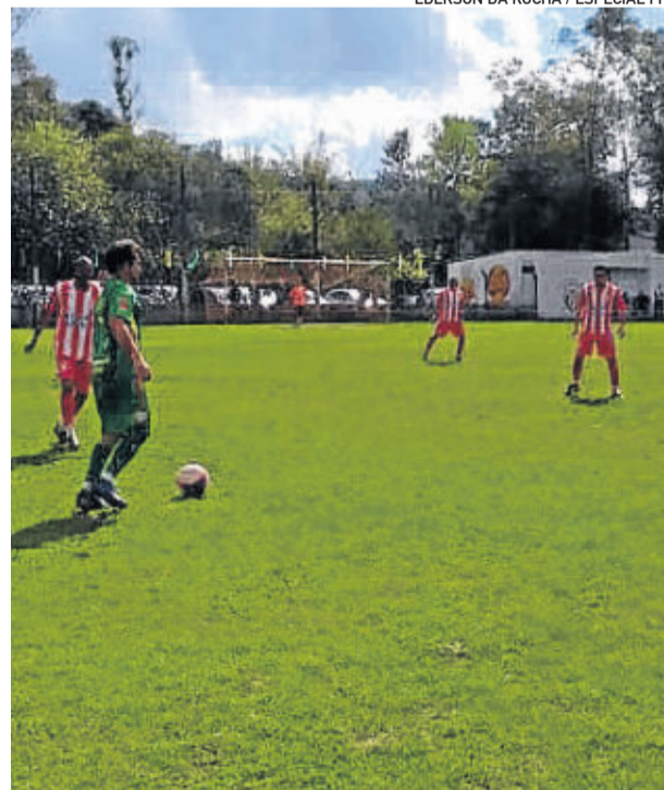
Ribeirense marcou primeiros gols e obteve a primeira vitória com goleada de 5 a 1