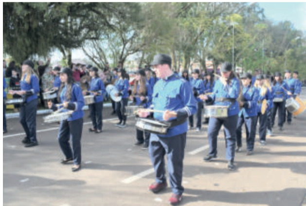
Desfile foi regido pela Banda Marcial Fazenda Vilanova