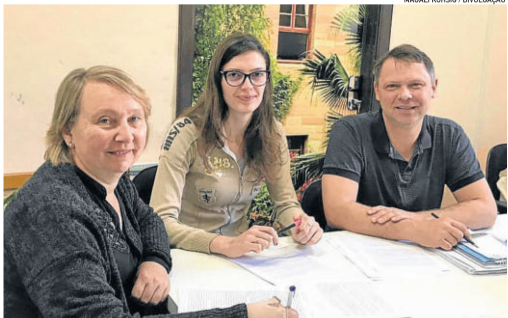
Jurados selecionaram os textos