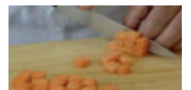
JARDINIÈRE (6MM DE LADO)