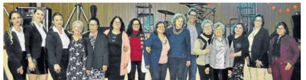
Diretoria do Clube de Mães com representantes da Cirandinha e do Opa Haus