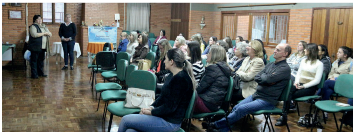
Técnicas do CREAS palestraram