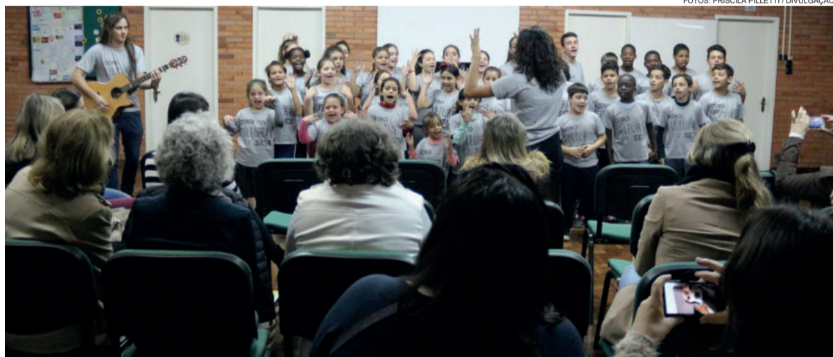
Apresentação Coro Cultural Seja foi uma das atrações