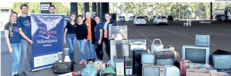
Voluntários receberam materiais em posto de coleta instalado junto ao Pavilhão Multiuso, no Centro Administrativo de Teutônia