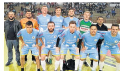
Timão - Morganti Eletrônica