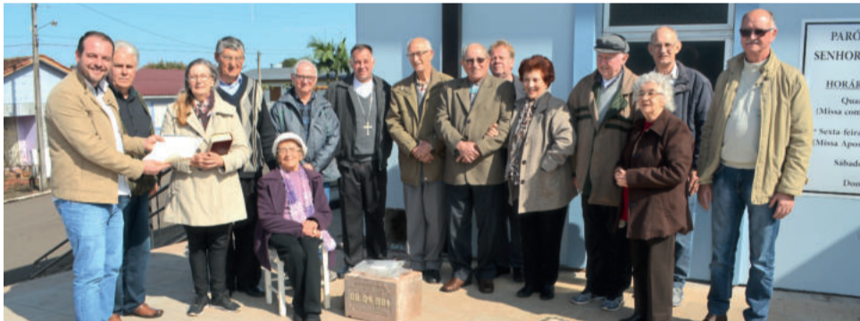
A pedra angular foi aberta com a presença de pessoas que participaram da fundação da primeira igreja

Foi feita também uma visita à primeira igreja de Canabarro, junto com as pessoas que participaram do período em que ela iniciou os seus trabalhos. “Contaram a história ao Dom Carlos e fizemos também a abertura da pedra angular, a pedra fundamental. Que foi colocada há 35 anos na fundação e dentro dela havia vários documentos e registro daquela época. Então abrimos estes documentos passados 35 anos”, conta.