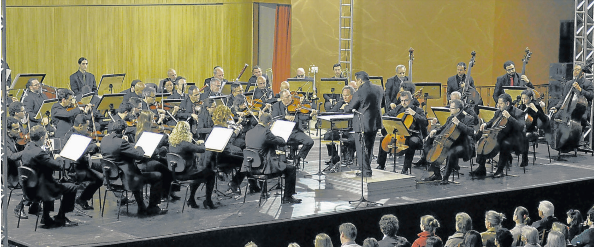
Ospa apresentou sua série Interior em Teutônia