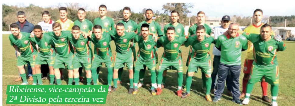
Ribeireense, vice-campeão da 2ª Divisão pela terceira vez