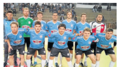
Saidera - Terrasol Pneus