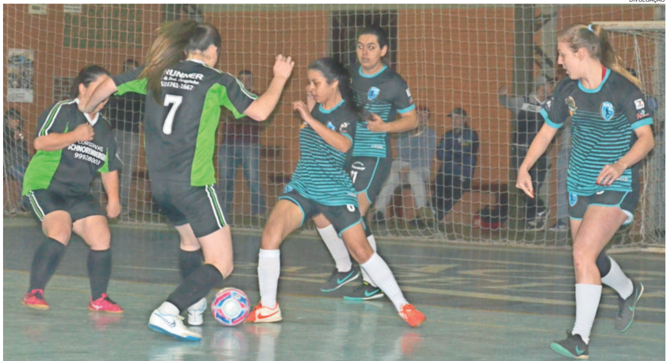
Jogos são disputados no Ginásio Católico do Centro

Com um grande público, a 2ª edição do Municipal de Futsal iniciou com grandes partidas no dia 23 de julho. Em quatro jogos foram registrados 22 gols, uma média de 5,5 tentos por partida.