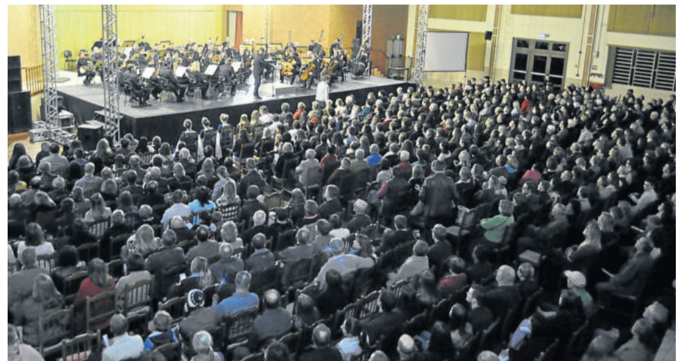
Público lotou a Associação da Água para acompanhar o concerto

A apresentação em Teutônia faz parte da série Interior da Ospa. Neste projeto, como o nome já diz, a orquestra percorre cidades do interior levando seu concerto. No repertório, diversos clássicos. O concerto foi iniciado com a abertura da ópera “O Barbeiro de Sevilha”, de Gioacomo Rossini. A apresentação contou ainda com a ária “Qual Fiamme Avea Nel Guardo”, de Ruggero Leoncavallo; “As Bodas de Fígaro”, de Wolfgang Amadeus Mozart; “O Mio Babbino Caro”, de Giacomo