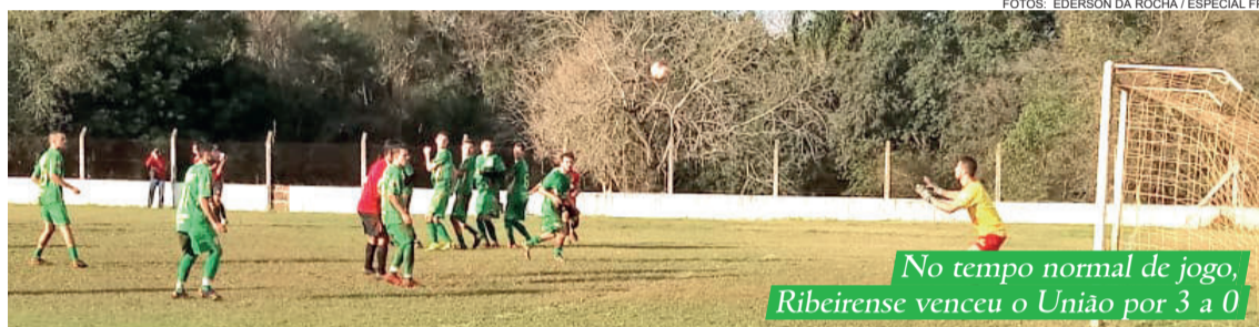
No tempo normal de jogo, Ribeiense venceu o União por 3 a 0