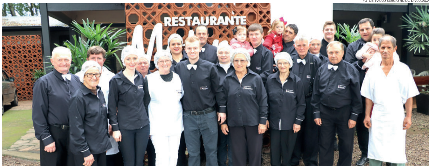
Família e colaboradores do Restaurante Matinho