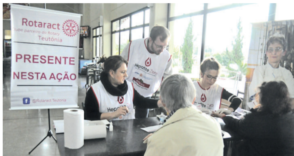
Foram disponibilizados 125 testes para a comunidade