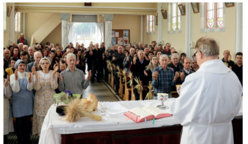
Evento iniciou com celebração religiosa