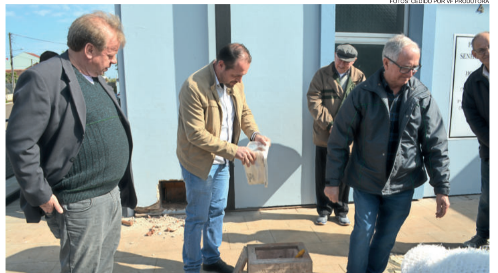
Diversos documentos foram encontrados dentro da pedra angular