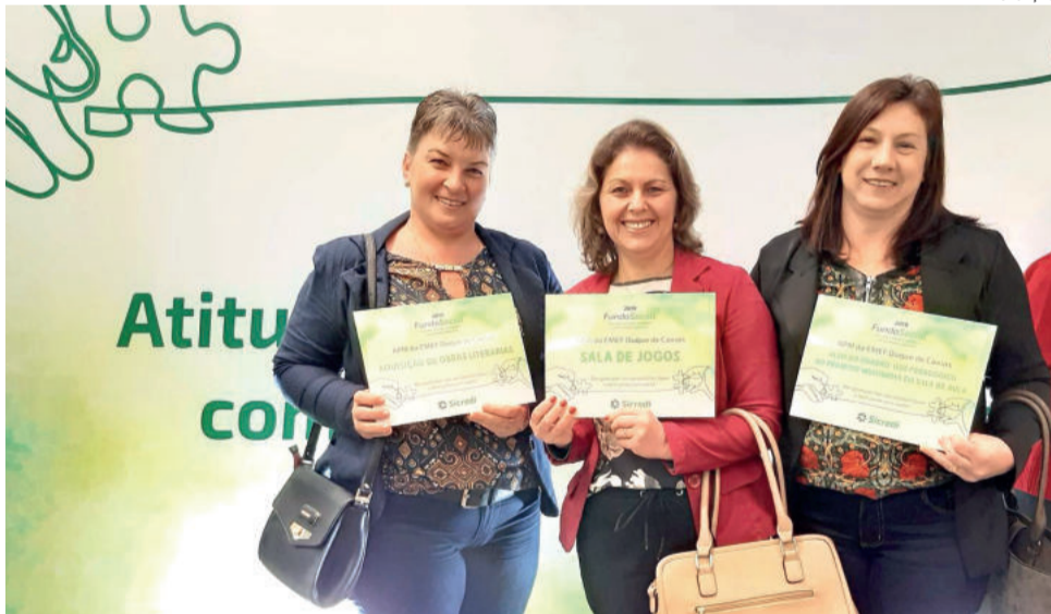
Representantes recebem premiação