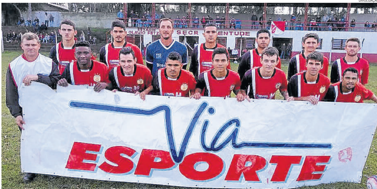
Recreativo venceu o clássico na estreia

Folgam: Flamengo (Westfália) e Ouro Verde (Teutônia)