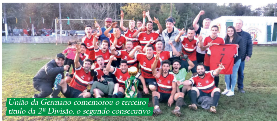
União da Germano comemorou o terceiro título da 2ª Divisão, o segundo consecutivo

Nas cobranças de pênaltis, o União da Germano foi competente e converteu suas quatro primeiras batidas. Já o Ribeiense converteu dois e desperdiçou dois, fechando a vitória do União por 4 a 2. O grupo comemorou bastante a conquista, inclusive com carreatas em direção à comunidade.