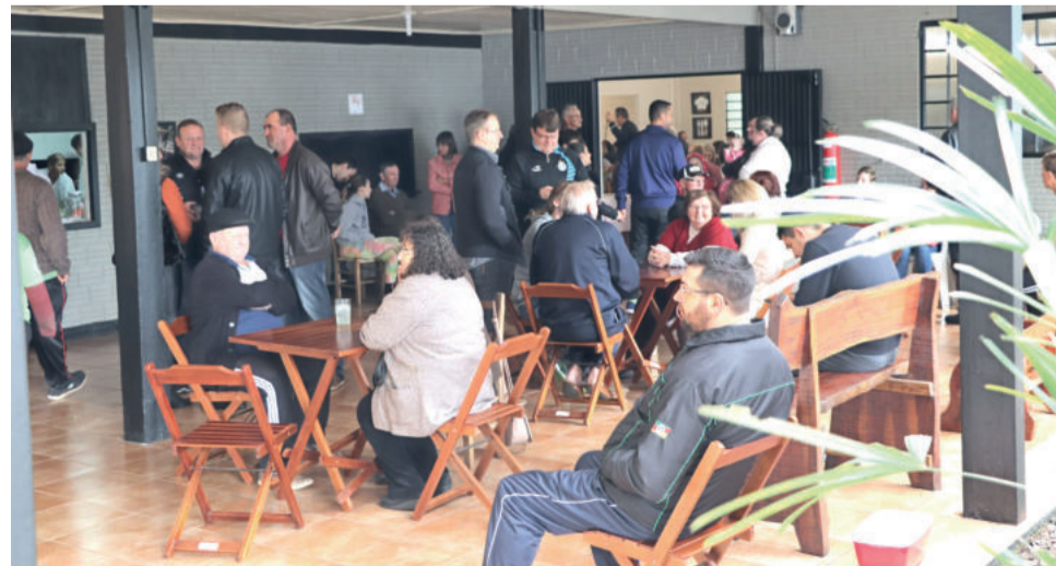
Movimento foi intenso no Restaurante Matinho no domingo

Nos arredores, é possível apreciar a natureza e ter uma visão panorâmica do Bairro Canabarro, bem como ter contato com ovelhas, galinhas-da-angola e pavões. Também há a edificação em estilo enxaimel, que agora abriga a casa de carnes do empreendimento. Em outros dias da semana, o restaurante abre mediante reserva, com a opção do café colonial. Reservas podem ser feitas pelos telefones (51) 3762-8313 ou 98114-5112.