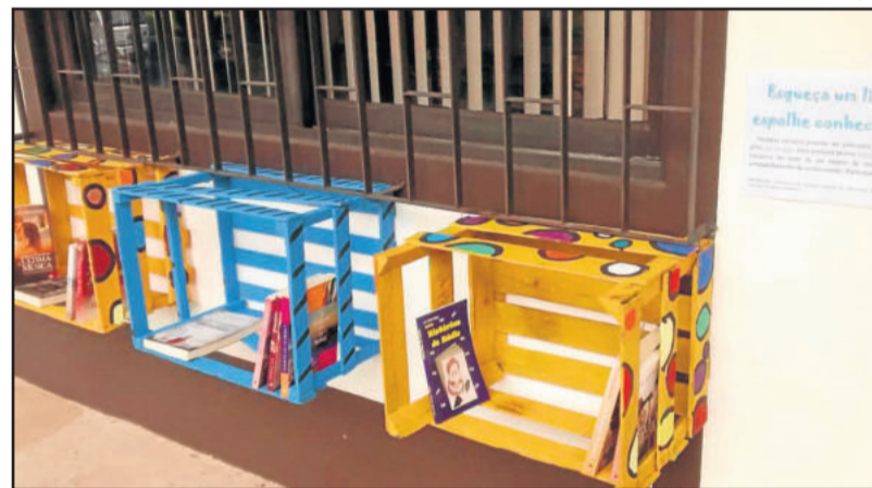
Caixas foram instaladas em pontos estratégicos como STR e a Emater