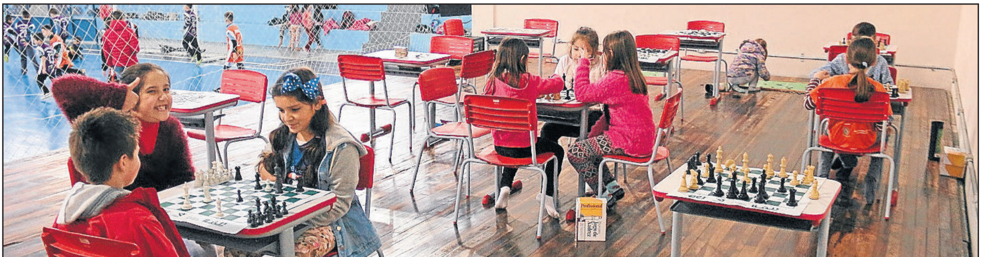
Jogos de tabuleiro e futsal fizeram parte das brincadeiras