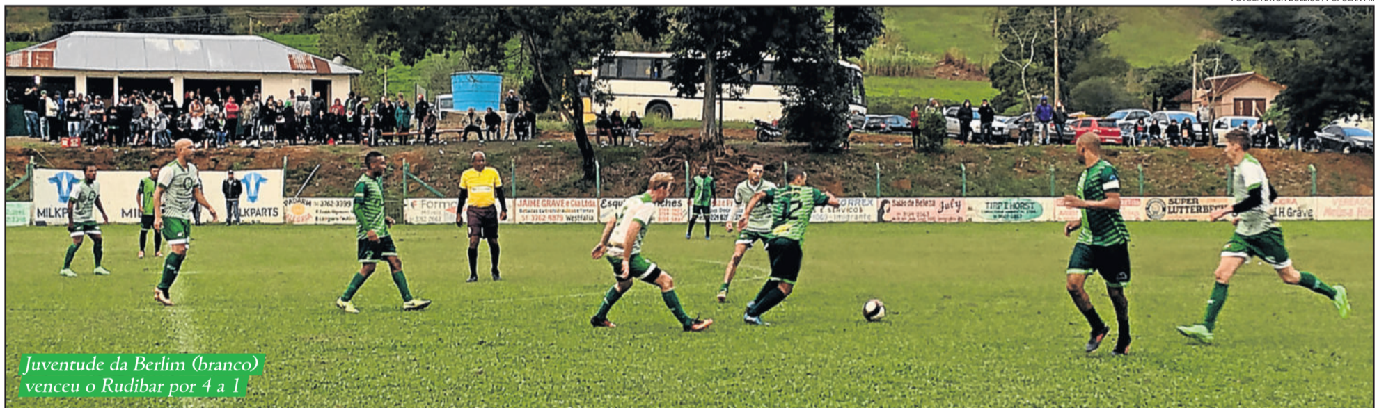
Juventude da Berlim (branco) venceu o Rudibar por 4 a 1