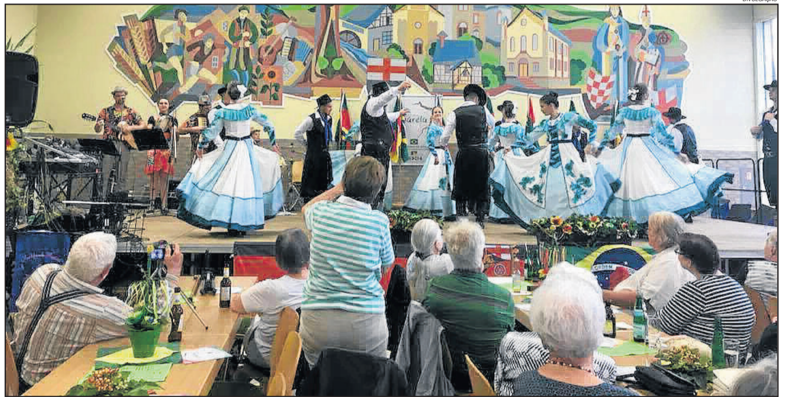
Cia Cultural Aquarela já apresentou ritmos brasileiros na Europa

Até o momento, a Cia Cultural Aquarela já realizou quatro apresentações: na abertura do Mose-lauen Fest, no município de Bernkastel-Kues; em um asilo em Schweich; no município de Lau-fersweiler e no sábado (28/07) realizaram apresentação no sul da Alemanha. Nos demais dias, os dançarinos visitaram pontos tu-