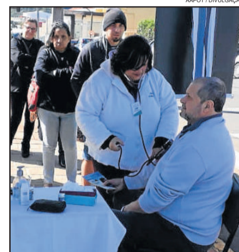
Durante a ação em Teutônia, houve medição de pressão arterial e testes de glicose (HGT)

O trabalho da associação não se restringe somente a situação já instalada da doença, mas também na realização de ações de prevenção, educação e qualidade de vida. Sua área de atuação é nas comunidades da 2ª, 8ª, 13ª e 16ª Coordenadorias Regionais de Saúde, que compreende as regiões dos Vales do Rio Pardo e Taquari e Região Carbonífera.