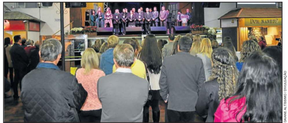
Cerimônia de encerramento do FestiQueijo teve pronunciamentos de autoridades

Ao final da cerimônia, foram entregues troféus para os colaboradores, apoiadores e expositores do evento.