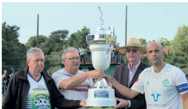
Juventude, vice-campeão regional da Aslivata