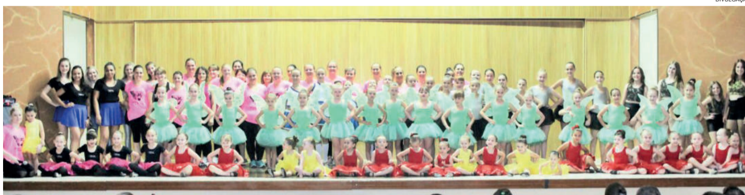
Cerca de 80 bailarinas apresentaram suas danças