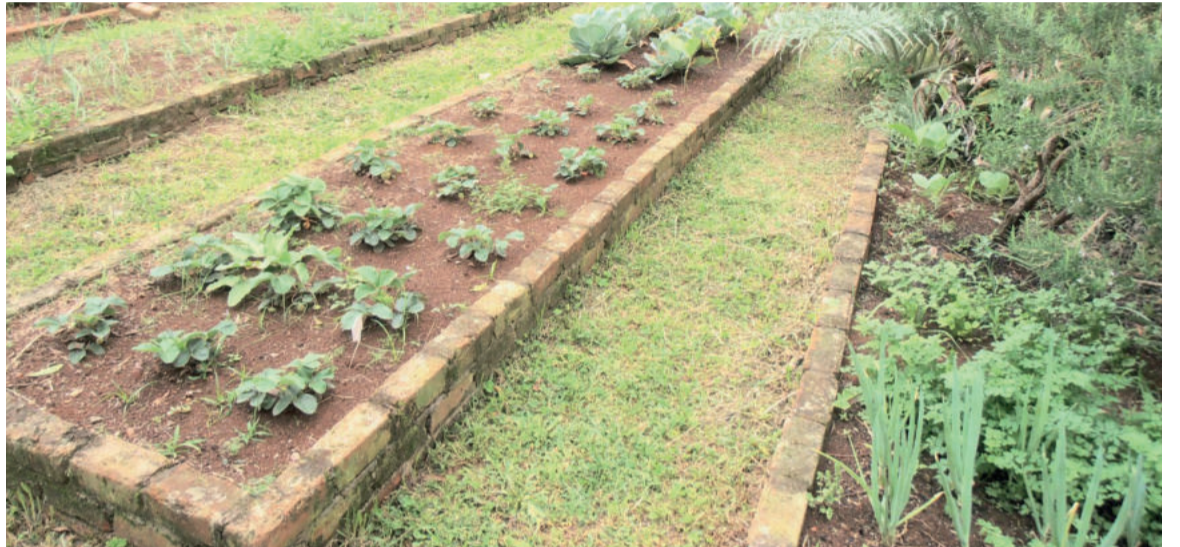
IEE Irmã Teofânia conta com a horta com o maior número de culturas, são 29 tipos

Entre os benefícios proporcionados pelas hortas escolares, ainda estão as atividades ligadas à culinária na escola, troca de conhe-