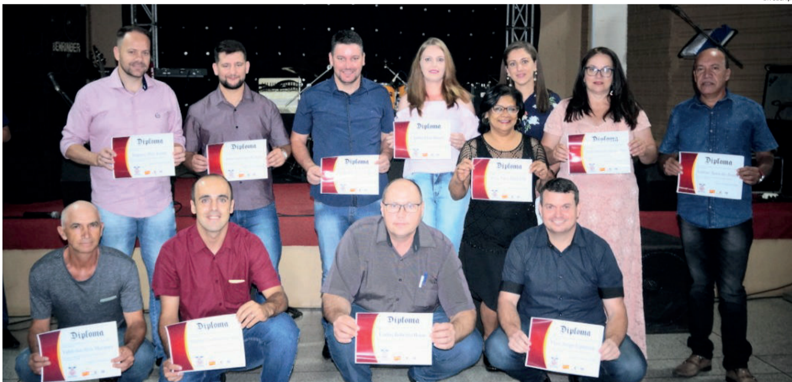
Nova Diretoria do Sindicomerciários toma posse para um mandato de quatro anos