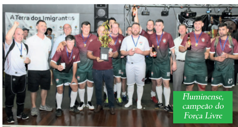
Fluminense, campeão do Força Livre