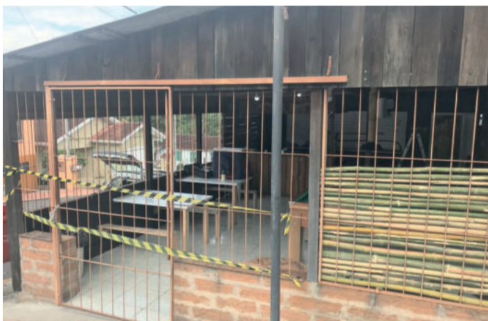
Bar chegou a ser lacrado no Bairro Teutônia

A segunda fase ocorreu na sexta-feira (30/11), com o cumprimento de um mandado de busca na localidade de Linha Ribeiro, em Teutônia, e no Presídio Estadual de Lajeado (PEL). Foi preso