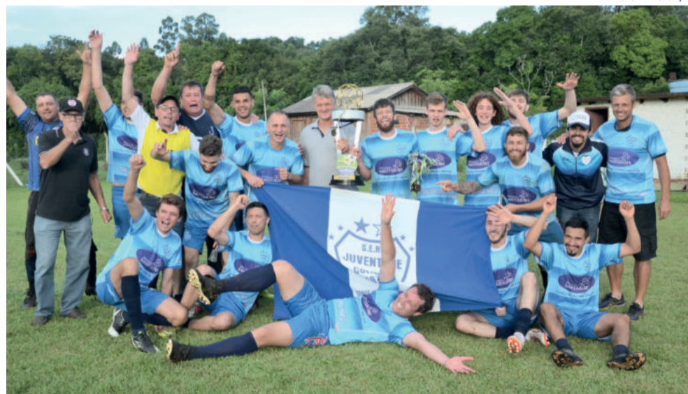
Juventude de Colinas comemorou o título