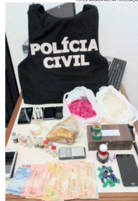
Drogas foram apreendidas durante a Operação Golden