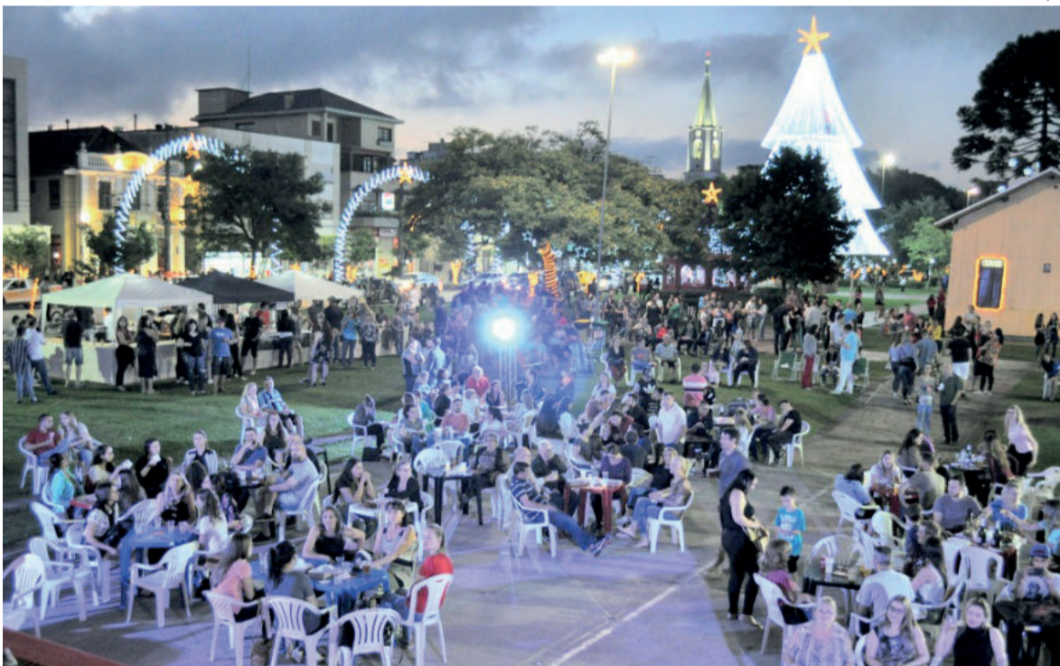
Parque da Estação recebeu o público para o Happy Hour de Natal