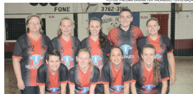
Flamengo - campeão no Feminino