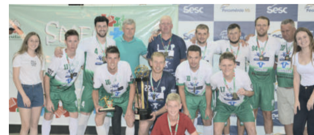
Palmeiras - campeão no Força Livre