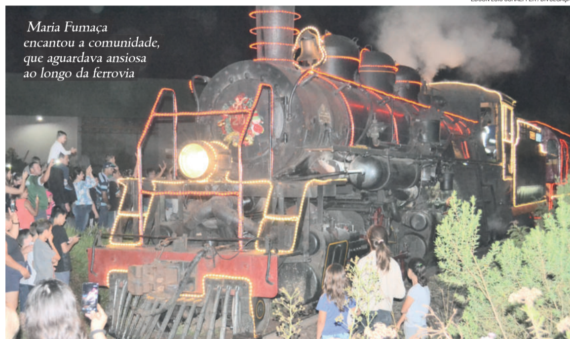
Maria Fumaça encantou a comunidade, que aguardava ansiosa ao longo da ferrovia

Teutônia foi o penúltimo município que recebeu a Maria Fumaça neste fim de semana, quase à meia-noite. Depois, ela seguiu até Paverama, onde pernitoitou. O próximo passeio da Maria Fumaça de Natal será no dia 12 de dezembro, saindo de Colinas em direção a Muçum.