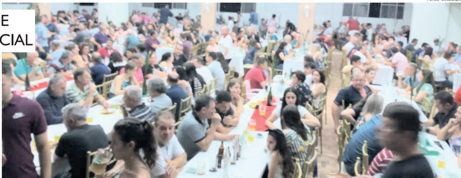
Bingo realizado na sexta-feira marcou a reinauguração do espaço

O Grêmio Recreativo Canabarrense, de Teutônia, reinaugurou seu salão social na noite de sexta-feira (30/11), quando também realizou o tradicional Bingo em benefício da entidade. O salão social fica na Rua Dom Pedro II e estava fechado há alguns meses. Depois de reformas estruturais, o local recebeu um evento do Canabarrense. Conforme a diretoria, a intenção é retomar os eventos no espaço e gradualmente estruturar o restante da área. Um dos projetos está na realocação do campo de futebol no antigo espaço, que entre 1996 e 1997 foi transformado em área de lazer, com piscinas, quiosques e quadras.