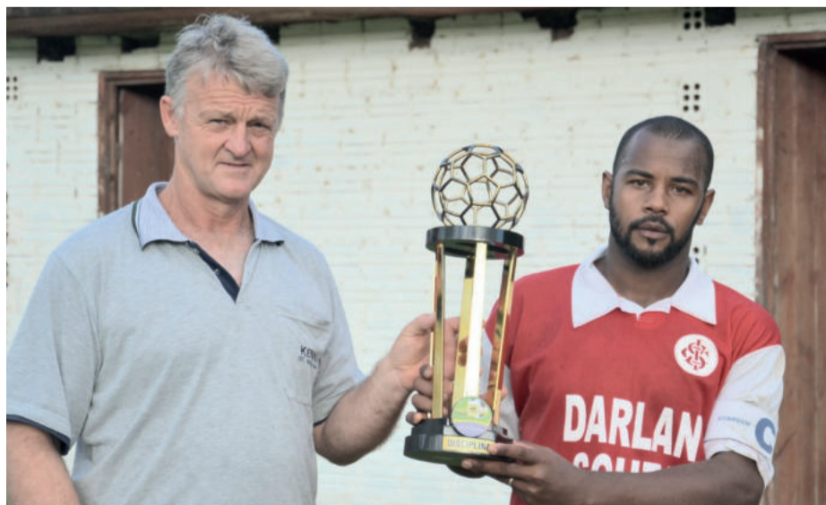
Inter, vice-campeão e campeão da disciplina