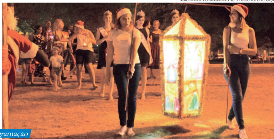
Passeio das Lanternas faz parte da programação