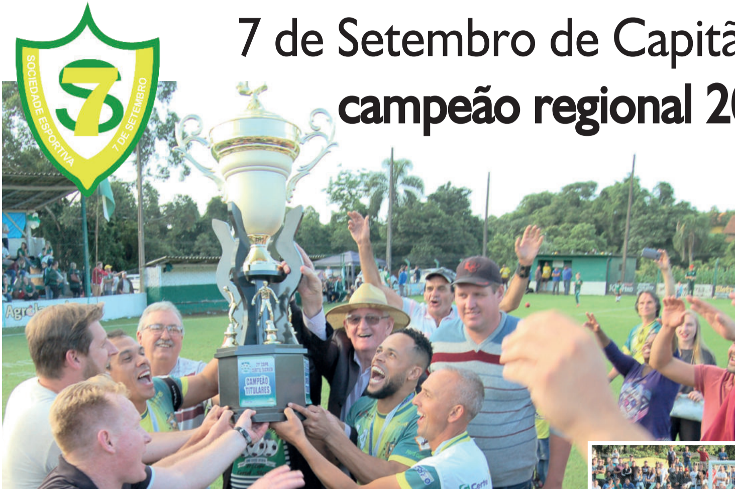
7 de Setembro de Capitão levantou o troféu de campeão regional