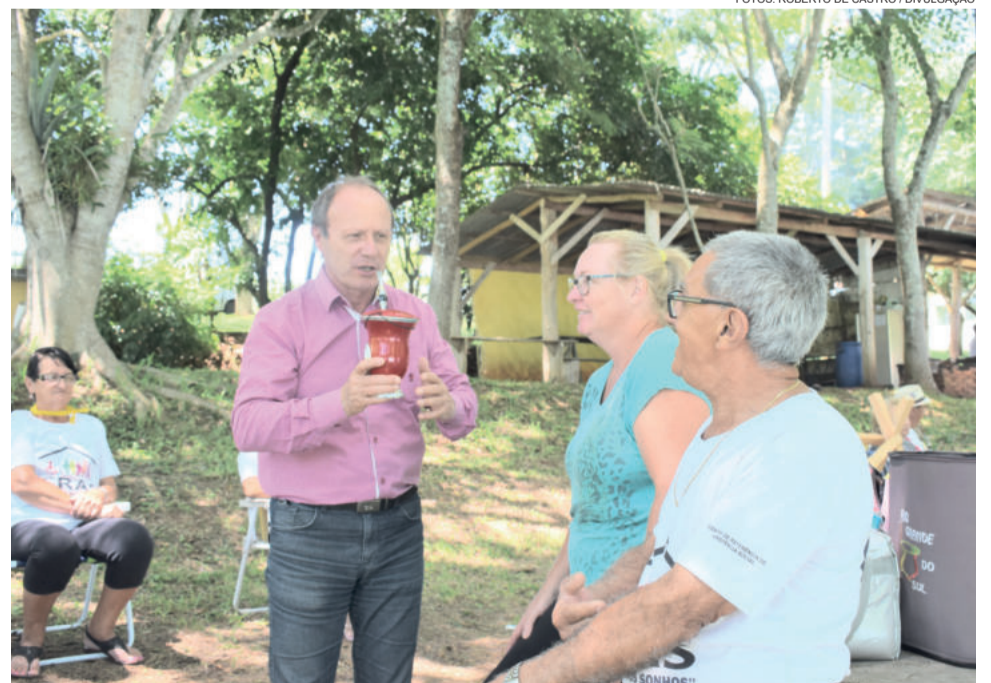
O prefeito José Luiz Cenci participou do encontro e interagiu com os participantes