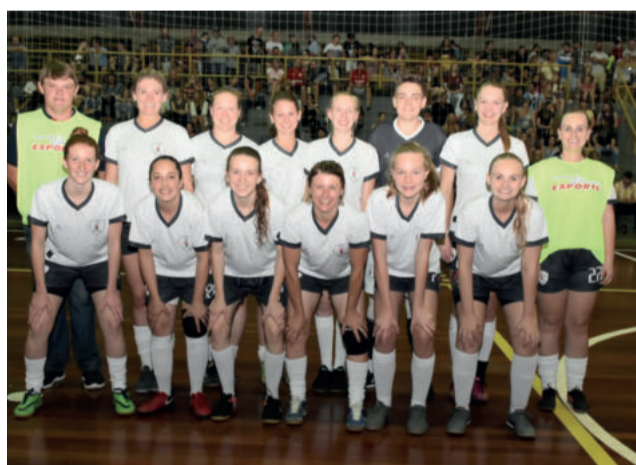
Morro das Alemoas, campeã do Feminino