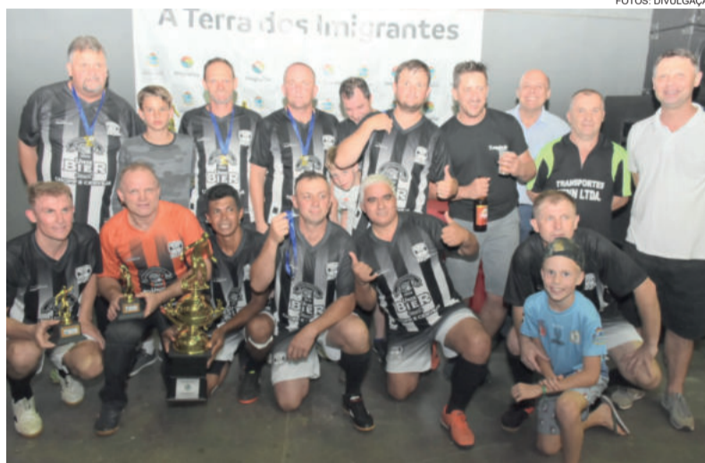
Amigos do Tito, campeão do Veterano