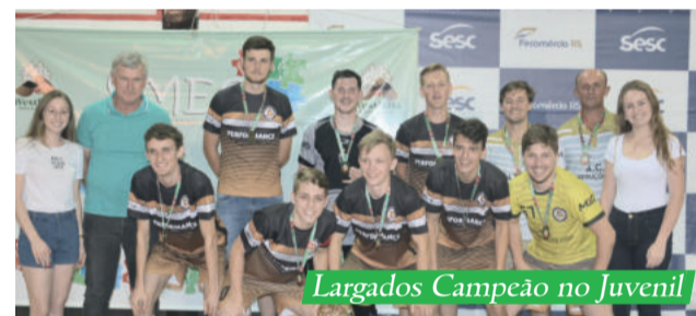
Largados Campeão no Juvenil