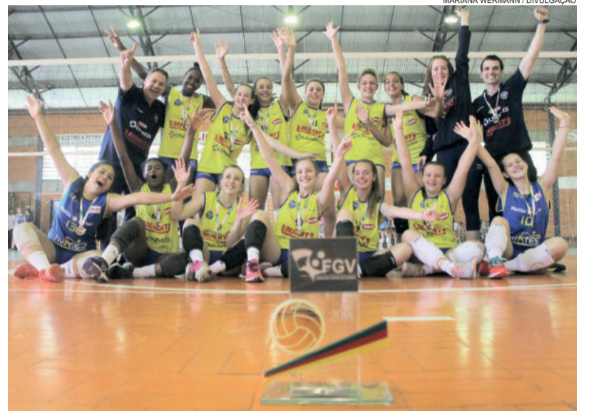
O time conquistou o campeonato estadual da categoria de forma invicta