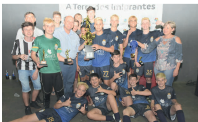
Corona, campeão do Sub-16