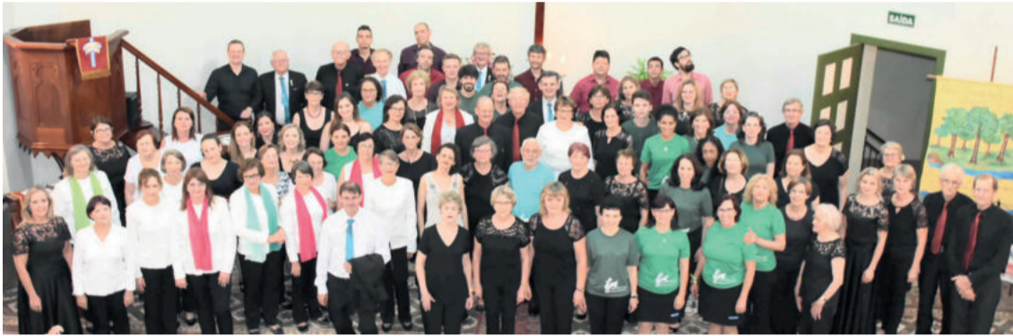
Cinco coros marcaram presença no encontro