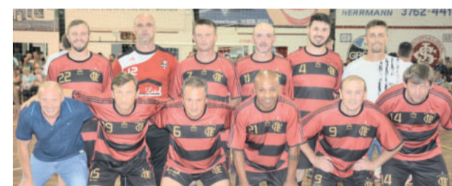
Flamengo - campeão no Veterano