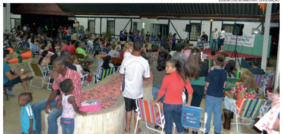
Famílias prestigiam várias apresentações culturais