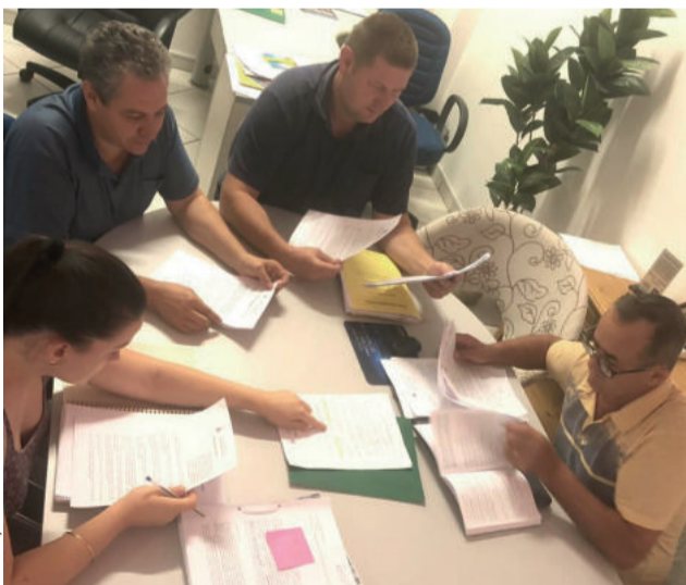
Comissões Permanente se reunirão nas segundas-feiras