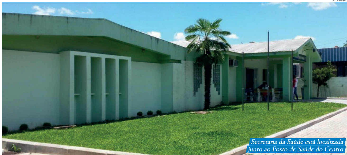
Secretaria da Saúde está localizada junto ao Posto de Saúde do Centro

A Prefeitura de Paverama recebeu na última semana a confirmação de um importante recurso para área da saúde. O deputado federal Alceu Moreira, da Bancada Gaúcha do MDB, realizou a destinação de recursos para o Município.