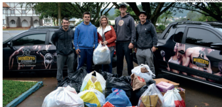
Doações das academias Momento Fitness Personal

reforça que todos podem doar roupas, agasalhos e calçados em bom estado, principalmente em tamanhos infantis.