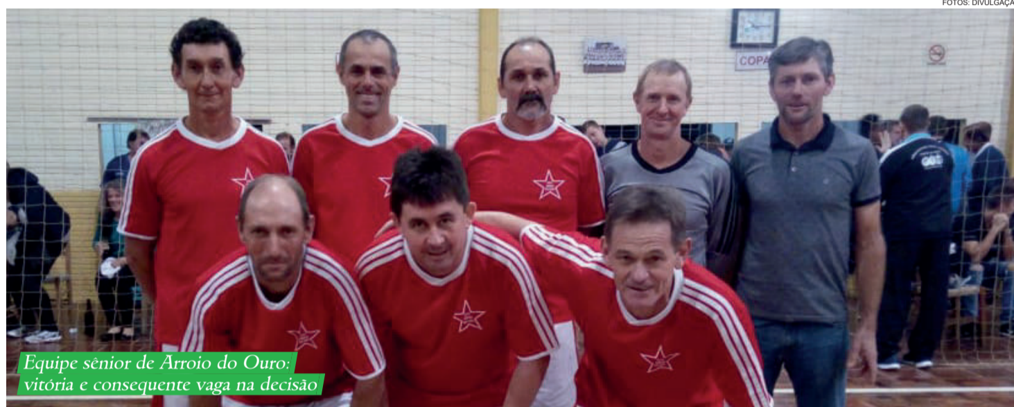
Equipe sênior de Arroio do Ouro: vitória e consequente vaga na decisão

Antepenúltima rodada classificatória do 21º Jogos Intercomunitários de Estrela também provocou mudanças em outras categorias