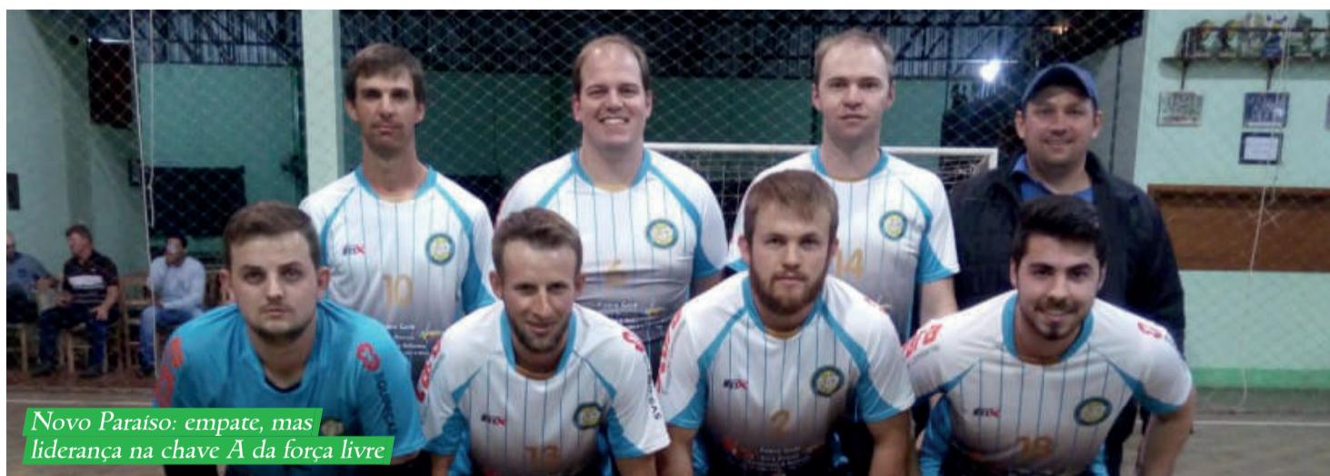
Novo Paraíso: empate, mas liderança na chave A da força livre