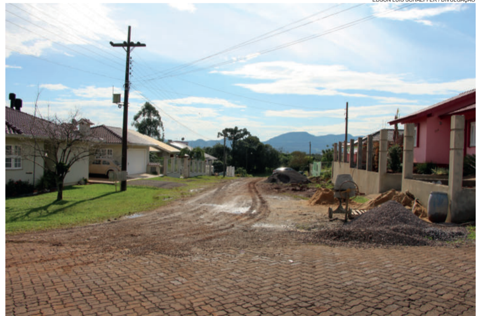
Primeira pavimentação comunitária será na Rua Gustavo Ahlert

Neste modelo de pavimentação, a participação do Município se dará através da elaboração do projeto técnico; fixação dos níveis, gabaritos e alinhamentos; serviços de preparação do solo (cancha); remoção de eventuais materiais inadequados para a base; fornecimento do material para assentamento (areia ou pó de brita); fornecimento