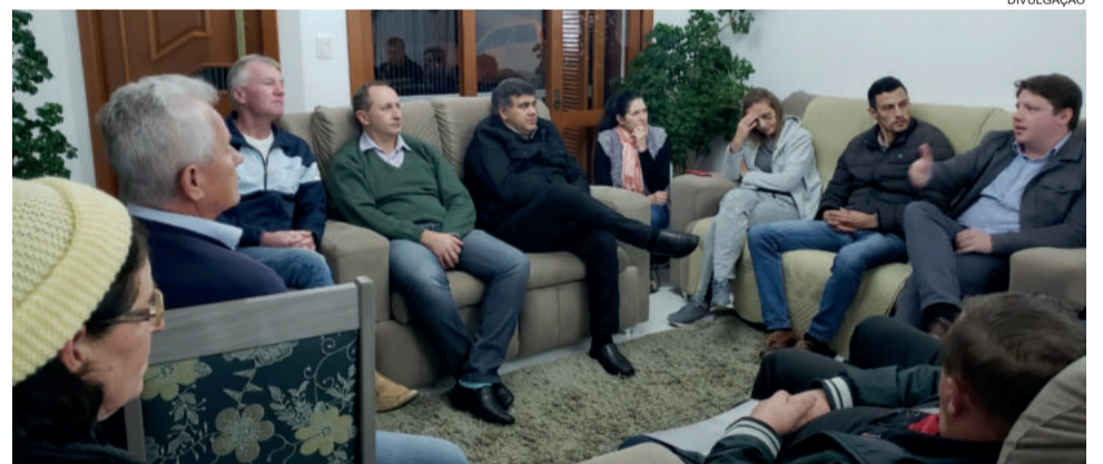
Executivo se reuniu com os moradores na semana passada

de meio fio; abertura e reaterro de valas; fornecimento de canos e maquinário para canalização das águas pluviais nas ruas onde não há canalização; mão de obra para assentamento da canalização; material e mão de obra para construção das bocas de lobo e poço de visita (pedras e grades).