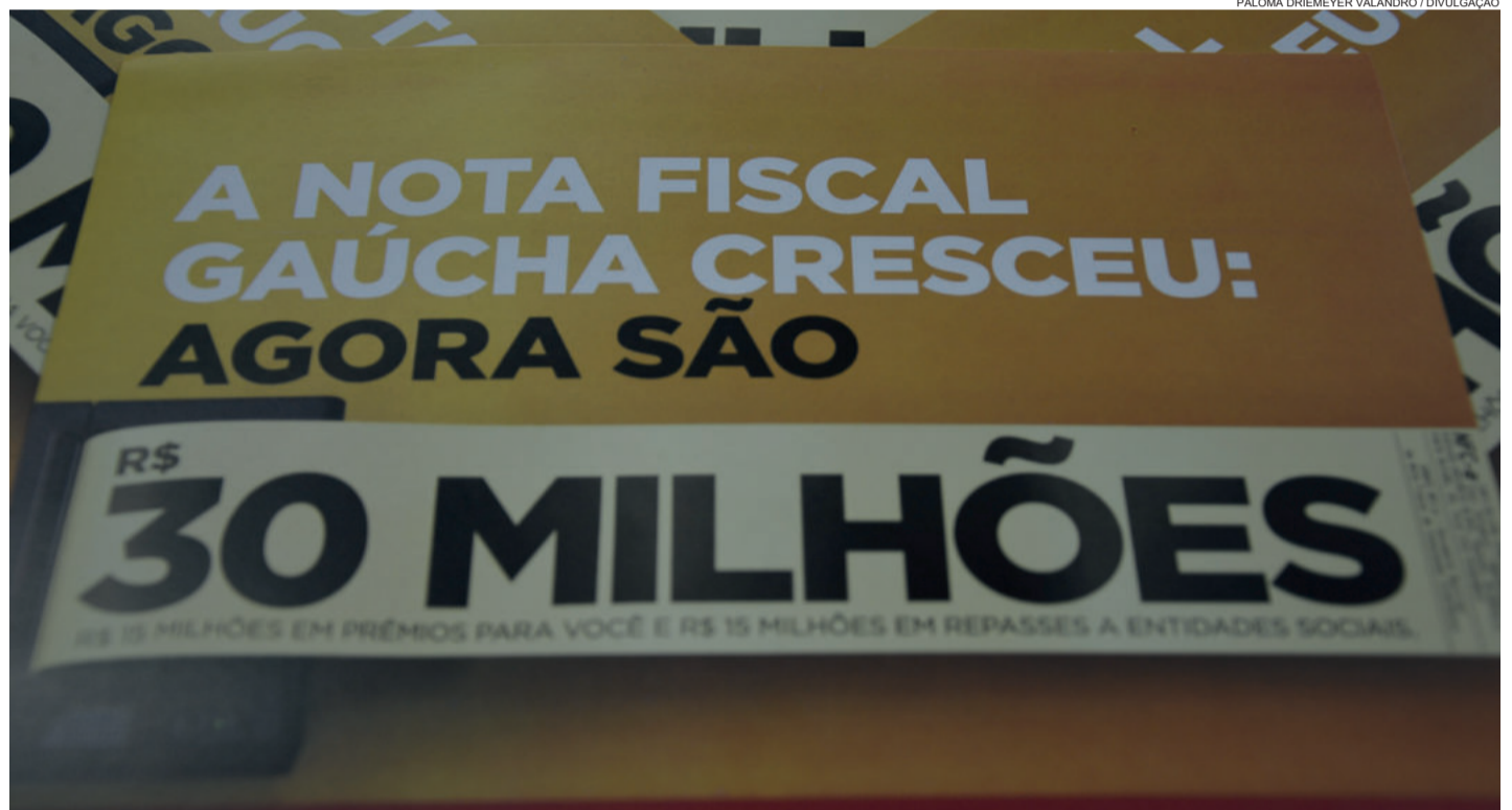
Em junho, sorteio foi realizado no dia 28, contemplando mais três pessoas

Para participarem dos sorteios, os municípios devem fazer o cadastro no site do NFG ( www.notafiscalgaucha.rs.gov.br ) e sempre que realizarem uma compra precisam informar seu número de CPF. Assim, os consumidores concorrerão automaticamente aos prêmios municipais e estaduais, ambos mensais.