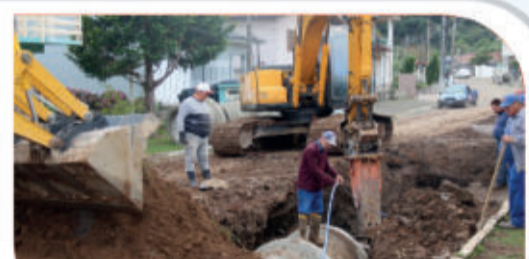
Rua Siqueira Campos