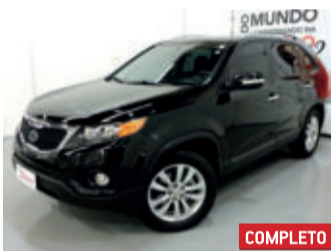
Kia Sorento EX 4X2 2.4 16V 2011 Preto, 4 portas, Automático, Gasolina, 113230km.