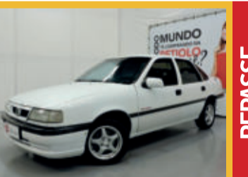
Chevrolet Vectra GLS 2.0 MPFI 8V 1996 Branco, 4 portas, Gasolina, 215.576km.