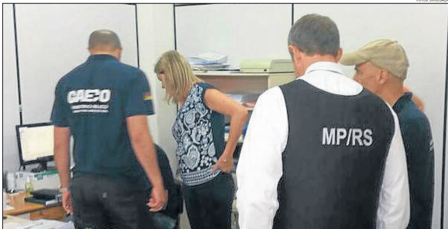
Operação Schmutzige Hände foi realizada dia 28 de março na Prefeitura de Teutônia

Apesar da liberdade, os três denunciados têm medidas restritivas a cumprir para evitar que voltem a ser presos. Caso descumpram um dos itens, o benefício da liberdade será revogado e terão que retornar ao Presídio: