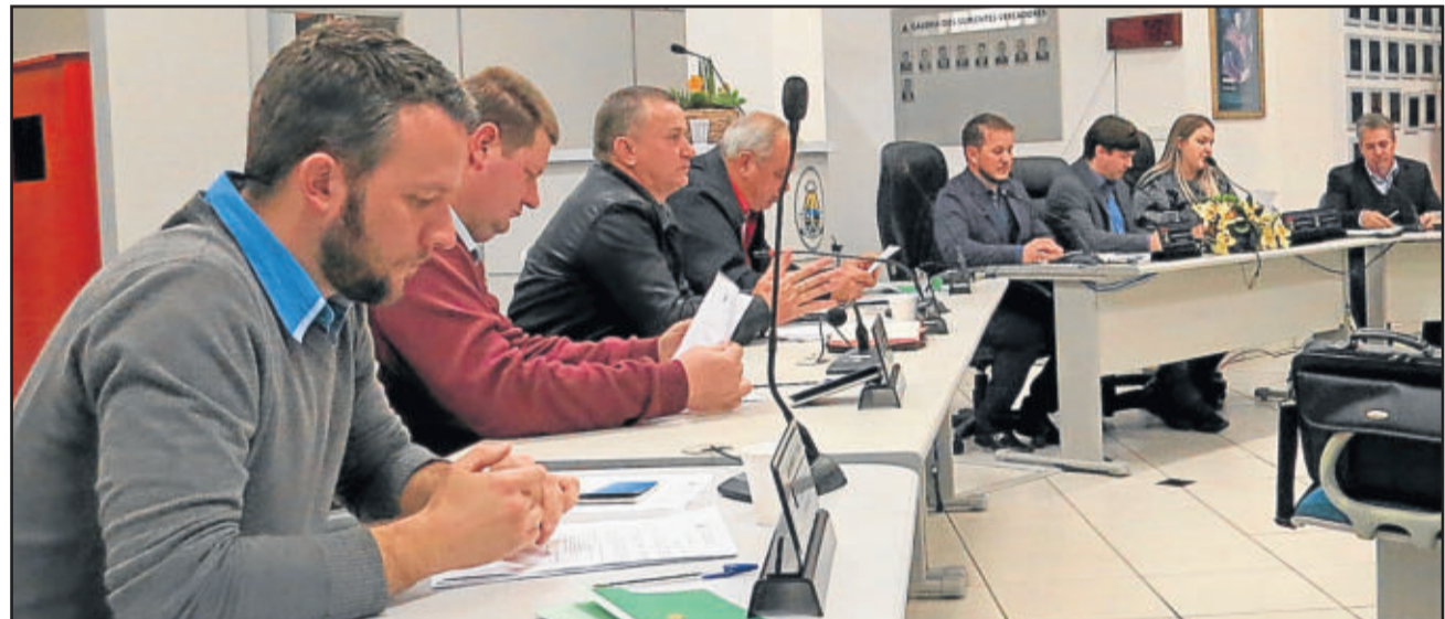
Câmara se reuniu nesta quinta-feira (02/08)