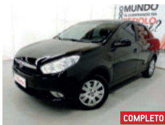
Fiat Grand Siena Attractive 1.4 Flex 2016 Preto, 4 portas, Manual, Flex, 75994km.