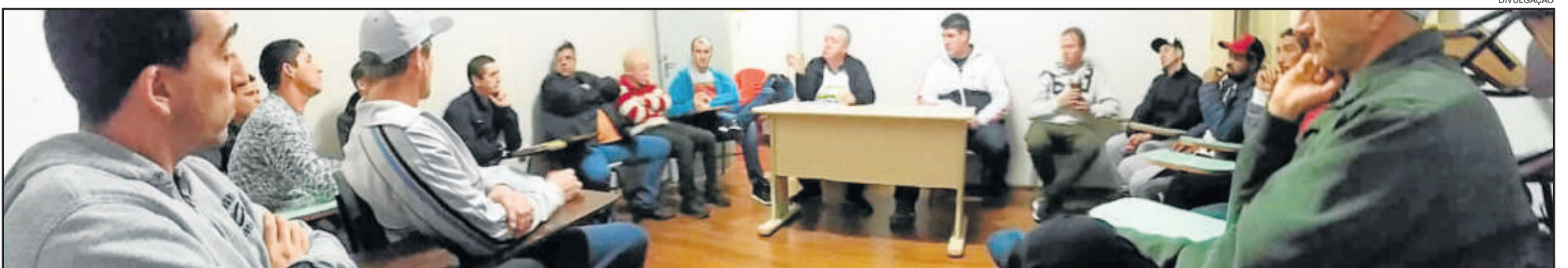
Durante a reunião desta quinta-feira foi definida a Série B