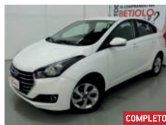
Hyundai HB20S Comfort Style 1.6 16V Flex 2016 Branco, 4 portas, Manual, Flex, 44924km.