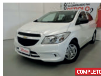
Chevrolet Onix Joy 1.0 MPFI 8V 2017 Branco, 4 portas, Manual, Flex, 11729km.