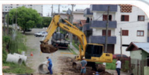
Banhado do São Francisco