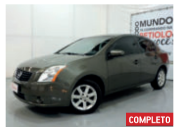
Nissan Sentra S 2.0 16V 2009 Cinza, 4 portas, Automático, Gasolina, 104830km.