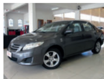
Toyota Corolla GLI 1.8 16V Flex 2010 Cinza, 4 portas, Automático, Flex, 105000km.