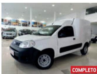
Fiat Fiorino Furgão Hard Working 1.4 EVO 8V Flex 2017 Branco, 2 portas, Manual, Flex, 83142km.