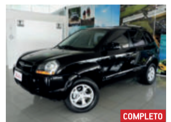
Hyundai Tucson GLS 2.0 MPFI 16V 2014 Preto, 4 portas, Automático, Gasolina, 84000km.