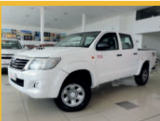
Toyota Hilux SR 4X4 Cabine Dupla 3.0 Turbo Intercooler 16V 2015 Branco, 4 portas, Diesel.