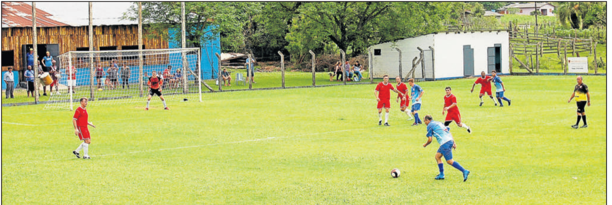
Em 2017, ASSESPE e Gaúcho decidiram o título regional de Veteranos