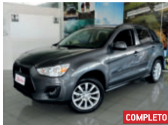
Mitsubishi ASX CVT 4X2 2.0 16V 2016 Cinza, 4 portas, Automático, Gasolina, 79500km.