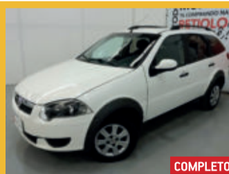
Fiat Palio Weekend Trekking 1.6 16V Flex 2015 Branco, 4 portas, Flex, 228.502km.