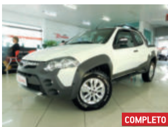
Fiat Strada Adventure Cabine Dupla 1.8 MPI 16V Flex 2013 Branco, 2 portas, Manual, Flex, 62394km.