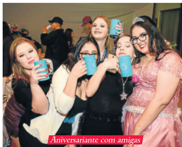
Aniversariante com amigas