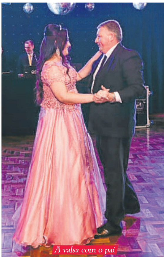
A valsa com o pai