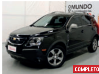
Chevrolet Captiva Sport 2.4 16V 2016 Preto, 4 portas, Automático, Gasolina, 66871km.