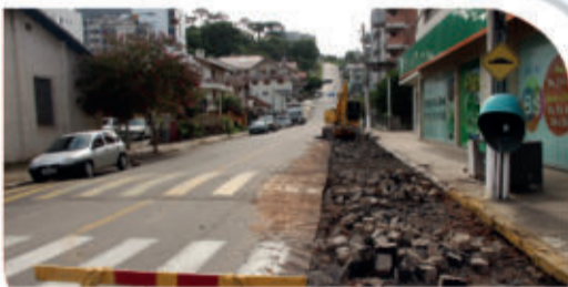
Rua João Pessoa

As obras de drenagem são fundamentais para o escoamento adequado das águas, reduzindo o risco de inundações.