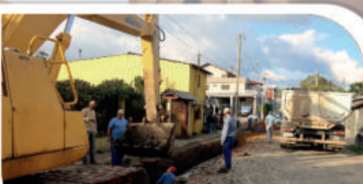
Rua Victório de Negri

Cobertas pela pavimentação das ruas e calçadas, estas obras não são vistas depois de concluídas, mas recebem grande investimentos da Administração Municipal e trazem melhorias permanentes onde são realizadas.