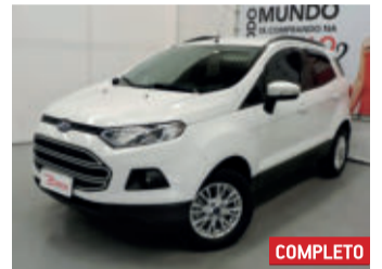
Ford Ecosport S 1.6 16V Flex 2017 Branco, 4 portas, Manual, Flex, 24240km.