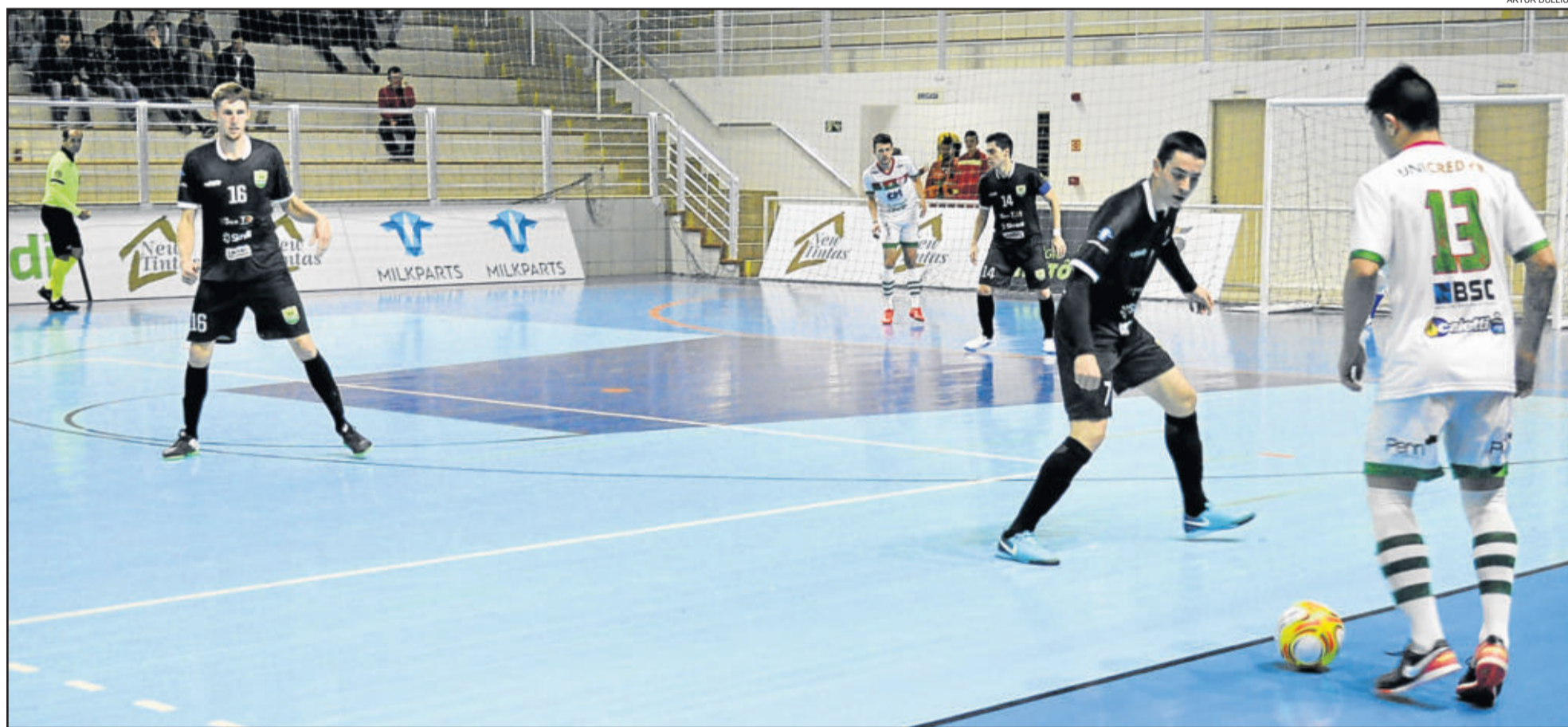
Teutônia Futsal terá três jogos fora de casa, dos quais precisa vencer ao menos um