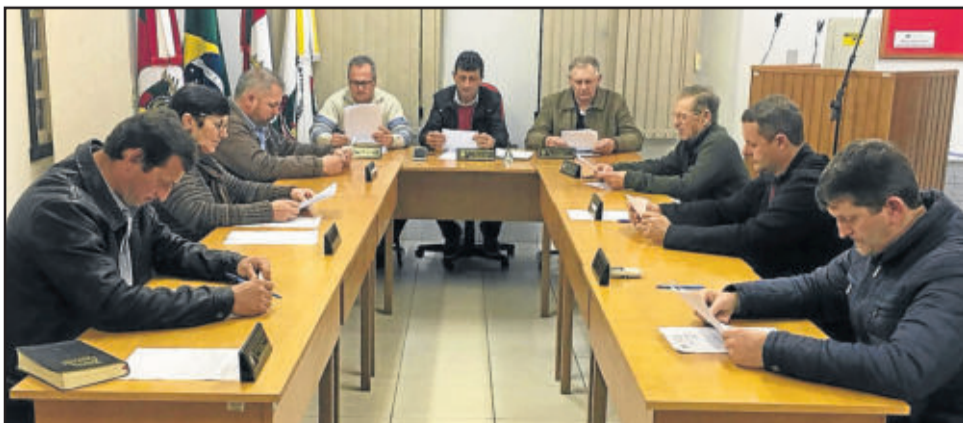
Vereadores tiveram uma sessão rápida nesta semana