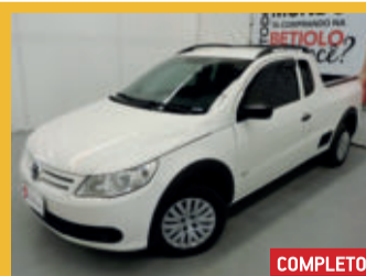
Volkswagen Saveiro CE 1.6 Mi 8V Total Flex 2011 Branco, 2 portas, 72.806km.