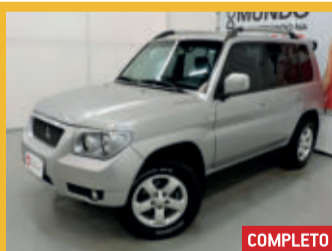
Mitsubishi Pajero TR4 4X4 2.0 16V 2007 Prata, 4 portas, Automático, Gasolina, 110.922km.