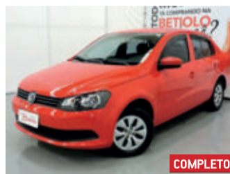
Volkswagen Voyage 1.0 Mi 8V Total Flex 2015 Vermelho, 4 portas, Manual, Flex, 70404km.