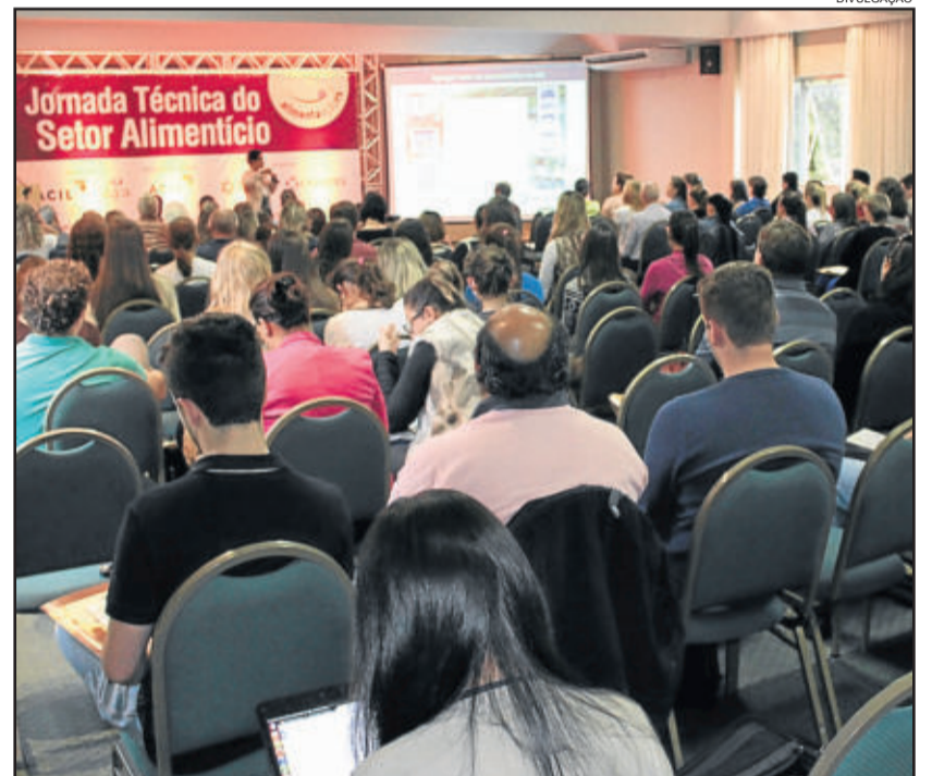
Assim como em 2017, evento vai reunir fabricantes, fornecedores, distribuidores e demais envolvidos com a produção de alimentos

A Jornada Técnica do Setor Alimentício 2018 é uma realização da Associação Comercial de Lajeado (Acil), GTA e Agea Marketing e Comunicação, com o patrocínio de Bremil, Bring Solutions, Takasago, Duas Rodas, Sicredi Vale do Taquari e Univates. Mais informações podem ser obtidas no site do evento.