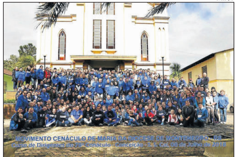
MOVIMENTO CENÁCULO DE MARIA DA DIOCESE DE MONTENEGRO - RS Curso de Dirigentes do 78º Cenáculo - Conceição - S. S. Car. 06 de Julho de 2018