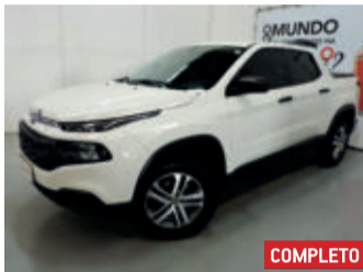
Fiat Toro Freedom 2.4 AT9 2017 Branco, 4 portas, Automático, Gasolina, 18439km.