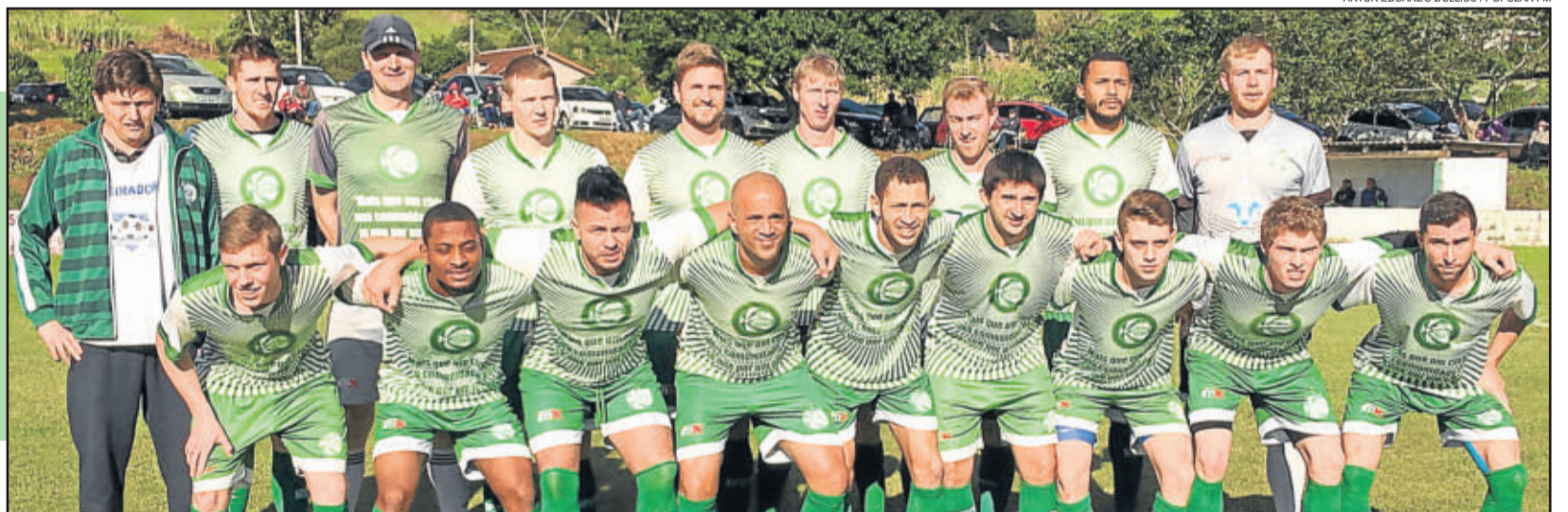
ARTUR EDUARDO DULLIUS / POPULAR FM

Brasil de Marques de Souza joga em casa e tenta segunda vitória