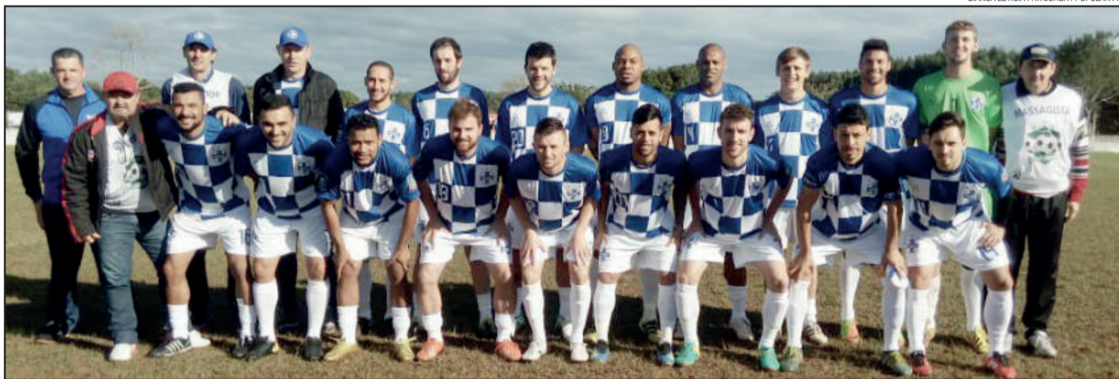
BIANCA LETÍCIA FRITSCHER / POPULAR FM

Brasil de Marques de Souza joga em casa e tenta segunda vitória