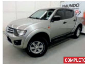
Mitsubishi L200 Triton HLS 4x2 Cabine Dupla 2.4 16V Flex 2015 Prata, 4 portas, Manual, Flex, 59908km.