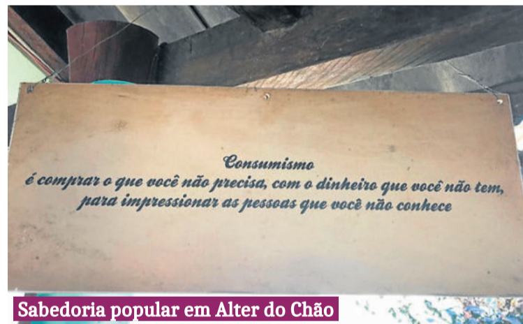
Sabedoria popular em Alter do Chão