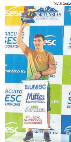
Kommer levantou o troféu de campeão

Circuito dos Vales, em Estrela, sendo necessário conquistar o segundo lugar geral para ficar com o título do circuito”, pontua. O atleta é treinado pelo ex-atleta olímpico Fabiano Peçanha, e tem patrocínio de Miller Supermercados, Aroma Bem Estar, UNISC, Flex Nutrição e Infit Run.