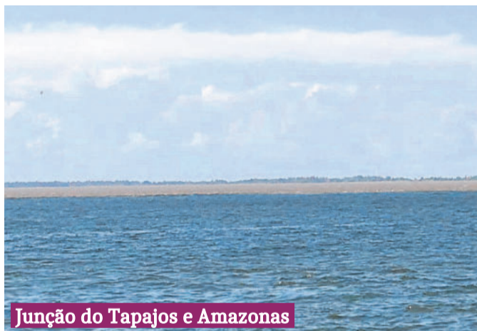
Junção do Tapajós e Amazonas

Lindo, tranquilo, acolhedor e simpático, assim é Alter do Chão. Era a segunda vez que fui até lá, mas não será a última. Nos hospedamos numa simpática pousada e depois fomos para a beira do rio Tapajós para apreciar o visual matar a fome e molhar a garganta.