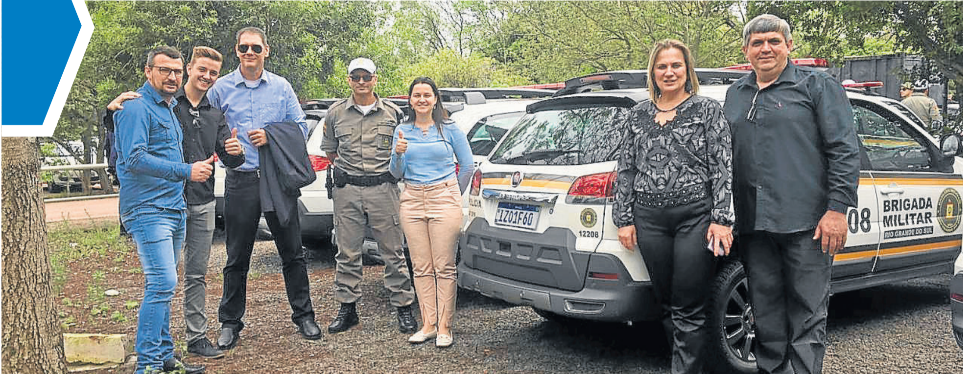
Representante de Teutônia e Westfália participaram da cerimônia de entrega dos veículos, em Porto Alegre