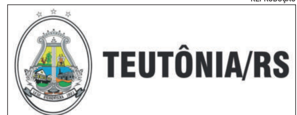
Modelo de adesivo que será distribuído