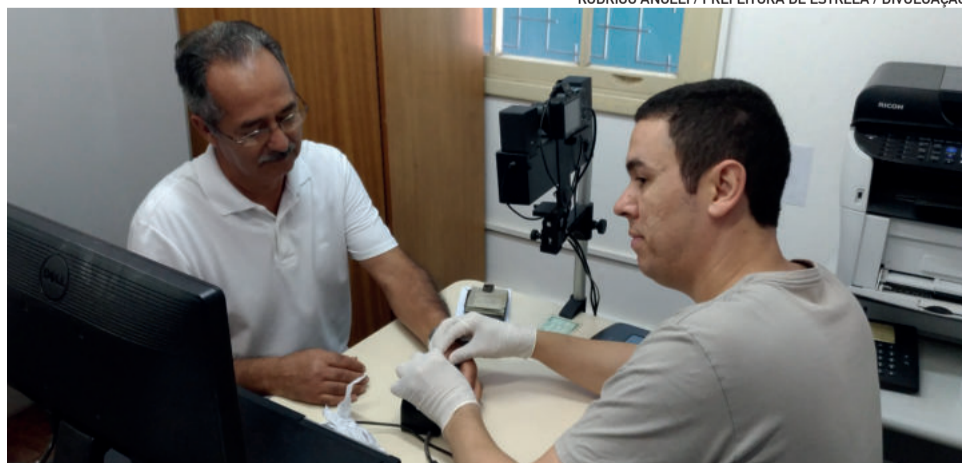
Movimento na unidade do Poupa Tempo tem sido mais intenso