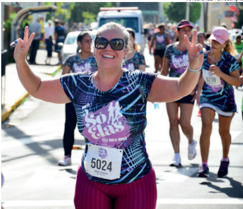
Prova reunirá mais de 1,1 mil mulheres no domingo