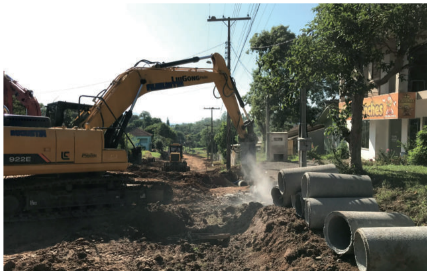
Rua Pedro Dieter está recebendo manutenção com alargamento da pista