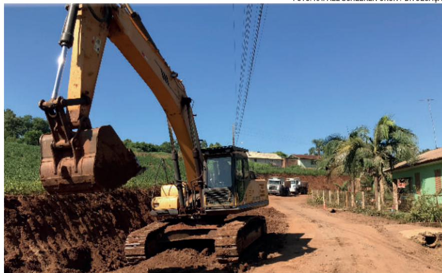
Rompedor hidráulico é utilizado para quebra de laje na Av. Rio Grande do Norte