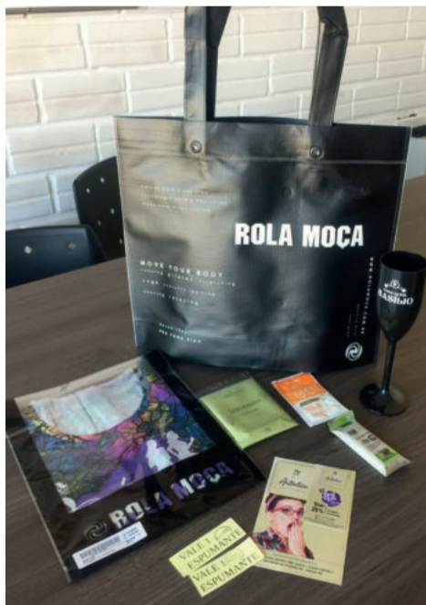
Kits, com diversos itens, poderão ser retirados já a partir de sexta-feira