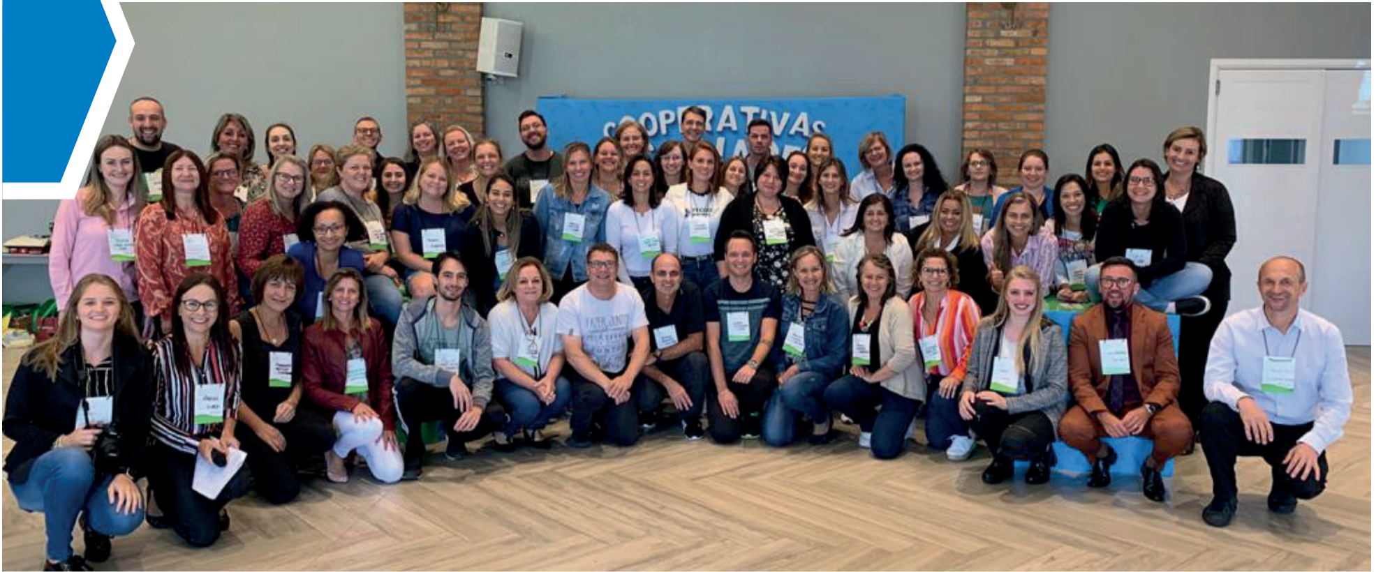
Tertúlia das Cooperativas Escolares ocorreu em Vila Flores