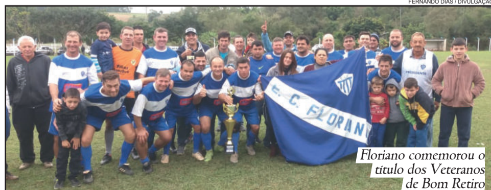
Floriano comemorou o título dos Veteranos de Bom Retiro