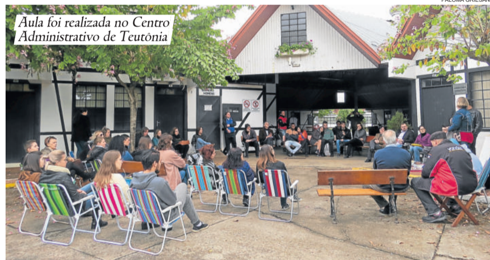
Aula foi realizada no Centro Administrativo de Teutônia

do tempo. “A ideia é fazer outros atos, ações e trabalhar em prol da cidadania, educação e meio ambiente. Que o coletivo seja um espaço público, que as pessoas possam se apropriar para dialogar sobre as demandas sociais”, pontua.