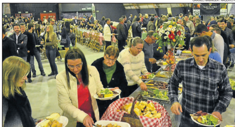
Em 2017 o evento reuniu cerca de 3.600 pessoas, batendo recorde de público

O Festival Colonial Italiano nasceu em 1981, com o objetivo de divulgar a primeira Fenachamp. No início, o bosque, que ocupa boa parte da área do Parque da Fenachamp, foi escolhido como cenário do evento. As pessoas sentavam em mesas distribuídas em vários pontos cercadas por árvores e ao som de músicas do folclore italiano se serviam em diversos buffets.