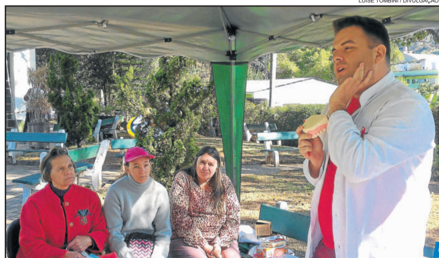
Orientações sobre saúde bucal

A campanha de vacinação contra a gripe segue até o dia 15 de junho, em qualquer unidade de saúde do município. Cerca de 500 pessoas que pertencem aos grupos de risco já foram imunizadas. São elas crianças maiores de 6 meses e menores de 5 anos de idade, gestantes e puérperas (mulheres até 45 dias após o parto), pessoas com 60 anos ou mais, trabalhadores da saúde, professores de escolas públicas, e pessoas com doenças crônicas.