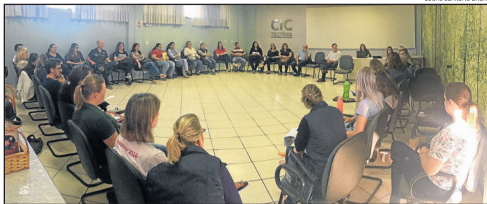
Encontro realizado na CIC Teutônia, dia 29 de maio, evoluiu aspectos do repasse de recursos

A partir deste cenário, as escolas comunitárias infantis e a Administração Municipal já realizaram dois encontros – uma audiência pública em 15 de maio e uma reunião no dia 29 de maio – com o propósito de encontrar uma maneira viável para custear vagas às crianças nas escolas comunitárias, inclusive com a participação de advogados para analisar os aspectos legais. O formato ainda não está definido e a principal situação a configurar é o valor do repasse por aluno, bem como o modelo de participação dos pais e das empresas.