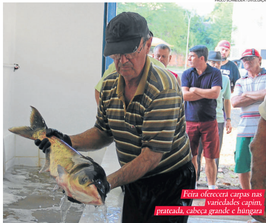
Feira oferecerá carpas nas variedades capim, prateada, cabeça grande e húngara