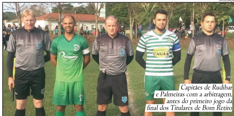
Capitães de Rudibar e Palmeiras com a arbitragem, antes do primeiro jogo da final dos Titulares de Bom Retiro

O Campeonato Municipal de Veteranos, de Bom Retiro do Sul, foi definido na manhã deste domingo (03/06), entre Floriano e Laranjeiras. A decisão ocorreu no Estádio Teodoro Manoel da Silva, na localidade de Pinhal, onde o Floriano venceu