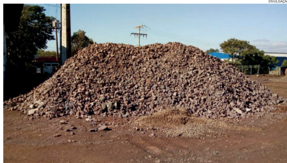
Rachão teve redução de quase 40% em comparação com valor licitado em 2017