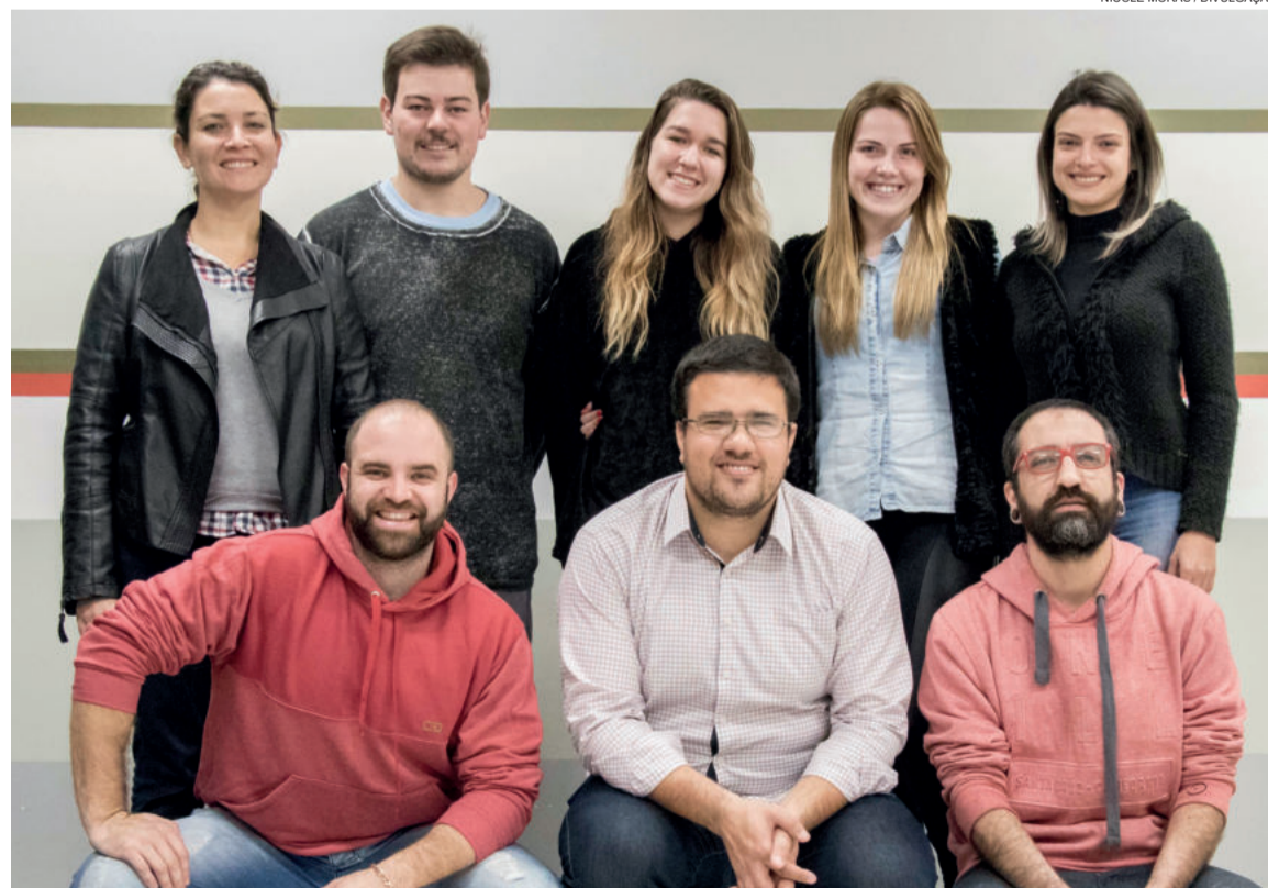
Parte do grupo de alunos e professores de Odontologia que apresentará os trabalhos na 53ª Reunião da Abeno

A 53ª Reunião da Associação Brasileira de Ensino Odontológico (Abeno) ocorre de 11 a 13 de julho em Brasília com o objetivo de discutir o ensino em Odontologia no País. Com 27 trabalhos aprovados, 12 estudantes e cinco professores do curso de Odontologia da Univates participaram mais uma vez do evento.