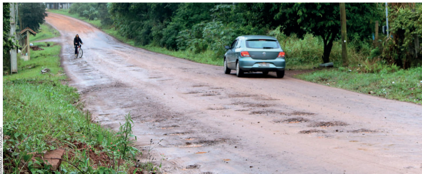
Pavimentação de trecho da RS 129 é uma das muitas conquistas da atual administração

Com este trabalho, Bom Retiro do Sul, em 18 meses, se contemplados os dois financiamentos, estará captando mais de R$ 11 milhões em investimentos diretos.