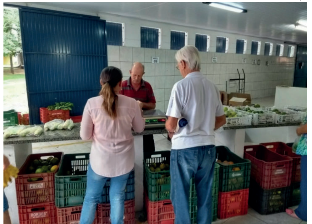
Produtos das agroindústrias, inspecionados pelo SIM, são comercializados na Feira do Produtor