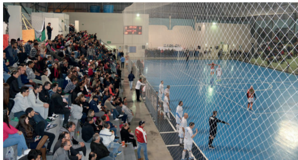
VALÉRIA LOCH / DIVULGAÇÃO