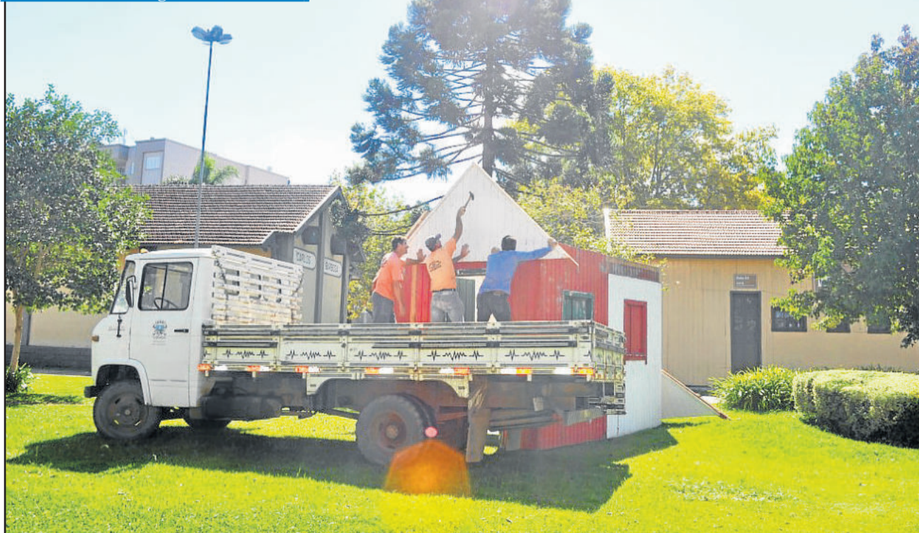
Casinha do Coelho da Páscoa foi instalada nesta segunda-feira (05/03)