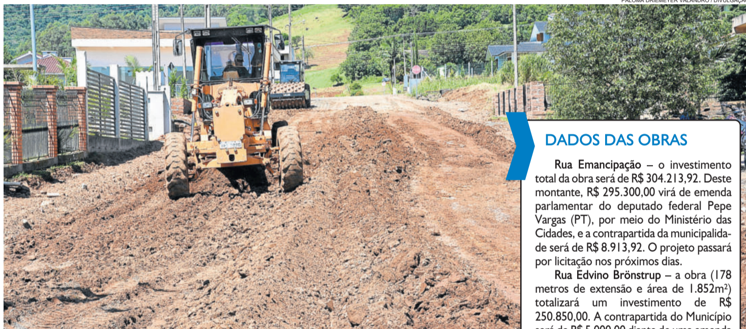
Na Rua Emancipação, base já foi ajustada em 2017 pela equipe da Secretaria de Obras, Viação e Interior

Em Linha Frank, a Transcitrus é uma via bastante acessada por caminhões. Lá, receberá asfalto o trecho que passou por elevação e aterramento no ano passado. “A intenção, com a pavimentação asfáltica de mais um trecho, é ligar Westfália e Poço das