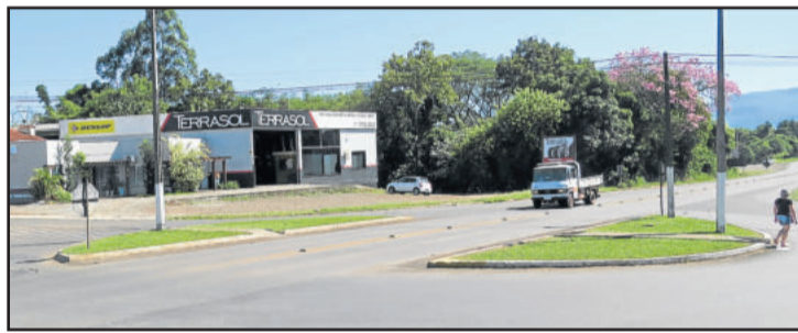
Rótula da Major Bandeira (bairros Languiru e Alesgut) também receberá alteração