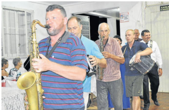
Festa contou com muita música e animação

conhecer os melhores atiradores de 2018/2019. Na oportunidade, cada participante terá três chances de acertar o alvo, e o melhor tiro do dia é coroadado com o título do Rei e Rainha. Aquele que tiver a melhor pontuação na soma dos três tiros será o Melhor Atirador. O Tiro Rei ocorre desde 1910, mas foi desativado em 1938 e reativado novamente em 1953. São 65 anos de realização ininterrupta, 93 edições realizadas e 108 anos de início da tradição.