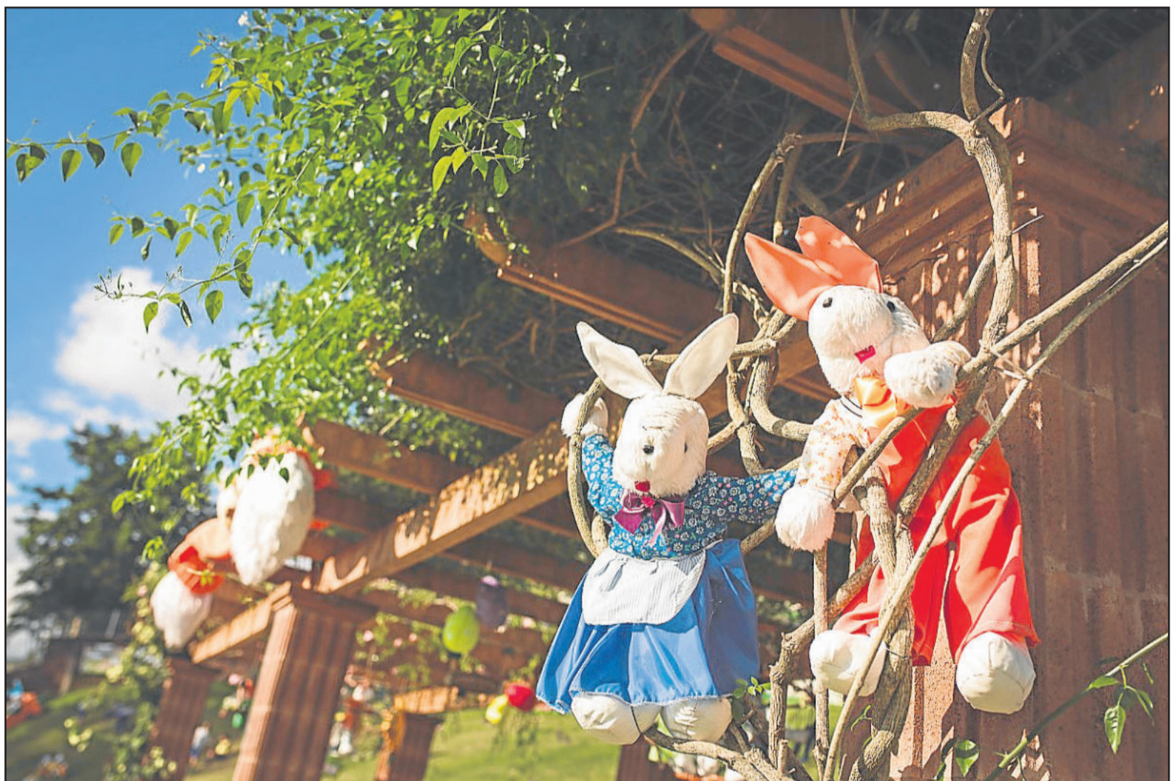
A decoração deve estar instalada até o dia 18 de março