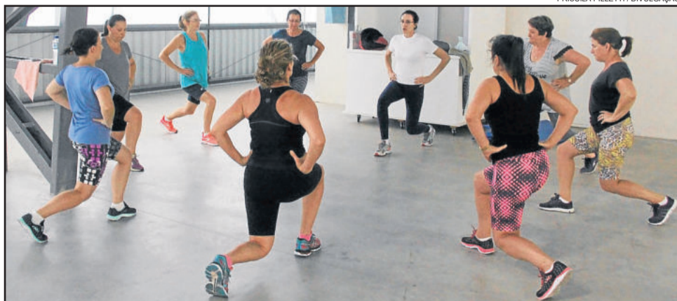
No ano passado, o programa mobilizou mais de 200 pessoas

As aulas têm uma hora de duração e são focadas em fortalecimento muscular e alongamento