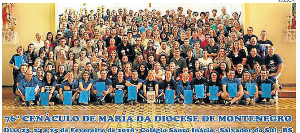
76º CENÁCULO DE MARIA DA DIOCESE DE MONTENEGRO Dias 23, 24 e 25 de Fevereiro de 2018 - Colégio Santo Inácio - Salvador do Sul - RS