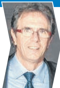
Expoagro foi lançada em almoço na sexta-feira