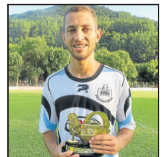
Amarelo, do Poço das Antas, craque dos Titulares