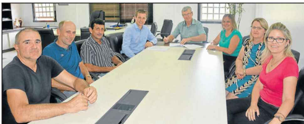
Contratos com a Caixa Econômica Federal foram assinados na manhã de segunda-feira, dia 26 de fevereiro

Transcitrus – a segunda etapa de asfaltamento da Transcitrus (aproximadamente 400 metros de extensão – do trecho existente até o final da mudança de leito e aterramento) totalizará um investimento de R$ 350.000,00. Deste, R$ 341.250,00 será repassado via Ministério do Turismo e R$ 8.750,00 será de contrapartida da municipalidade. É importante ressaltar o auxílio do ministro do Desenvolvimento Social e Agrário, Osmar Terra, para a conquista do recurso federal. A assinatura do contrato, com a Caixa Econômica Federal, também já está efetuada.