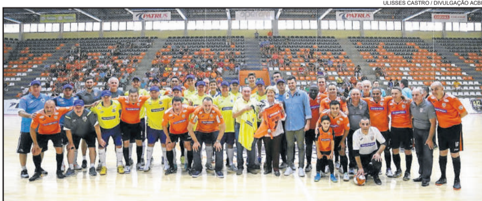
Amistoso reuniu atletas do passado

A Seleção Brasileira venceu por 4 a 1 o amistoso da categoria Máster com a ACBF, jogo disputado na manhã deste sábado (03/03), no Centro Municipal de Eventos Sérgio Luiz Guerra. Porém, o placar foi o que menos importou. O evento, que reuniu os craques do passado, também marcou as comemorações pelo título da Capital Nacional do Futsal para Carlos Barbosa.