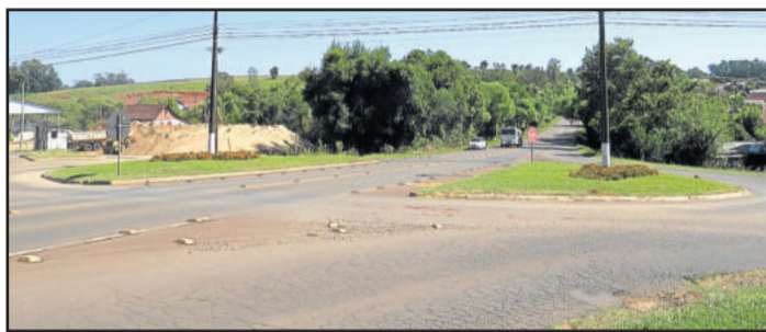
Rótula de Linha Ribeiro e Bairro Canabarro já tinha um anteprojecto previsto