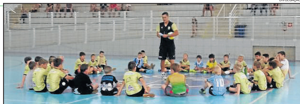
Núcleo social de Languiru, na Associação da Água, iniciou as atividades

é o técnico da equipe adulta da Teutônia Futsal. Nos próximos dias, a ASTF também deve dar início aos núcleos sociais em outros bairros da cidade. No ano passado, em torno de 500 crianças foram atendidas nos núcleos sociais, de maneira totalmente gratuita.