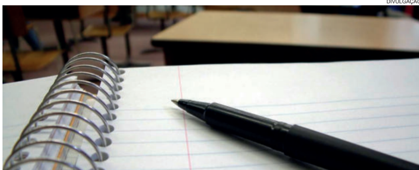
Seleção parte da análise de currículos

Podem concorrer estudantes de Magistério, Pedagogia ou outro curso de Graduação ou Pós-graduação na área de Educação