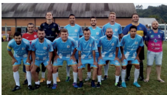
Timão Los Blefes