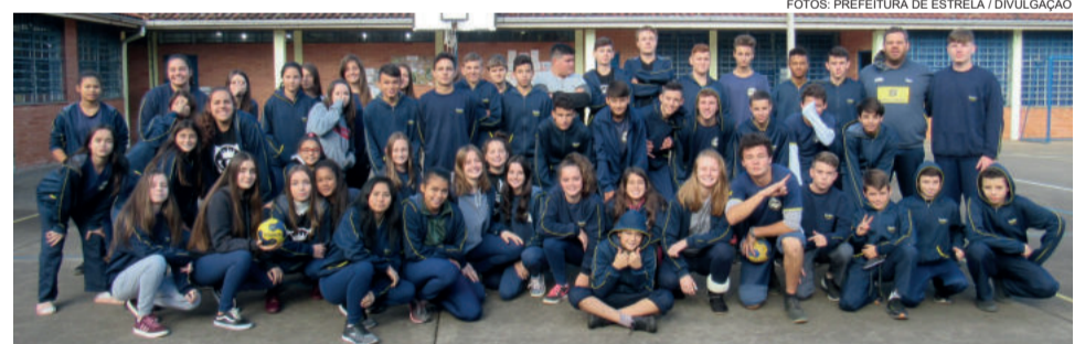
Emef Leo Joas participará com quatro equipes e 56 alunos

Além do handebol, o calendário dos Jogos Escolares programa a realização do tênis de mesa, vôlei, futsal, basquete, futebol sete, atletismo, natação e o xadrez, que inclui junto o tradicional Torneio Estudantil de Xadrez, este de abrangência regional, já em sua 11ª edição. A expectativa é de, nas nove modalidades programadas, contar com até 2,3 mil participantes de até 18 escolas, sendo que muitos alunos disputam mais de uma modalidade.