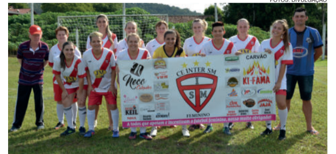
Inter de Santa Manoela