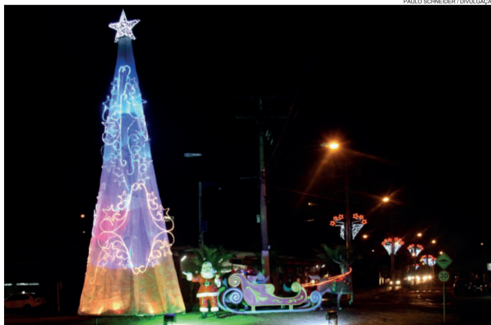
Decoração chama a atenção dos visitantes durante o período do Natal em Estrela