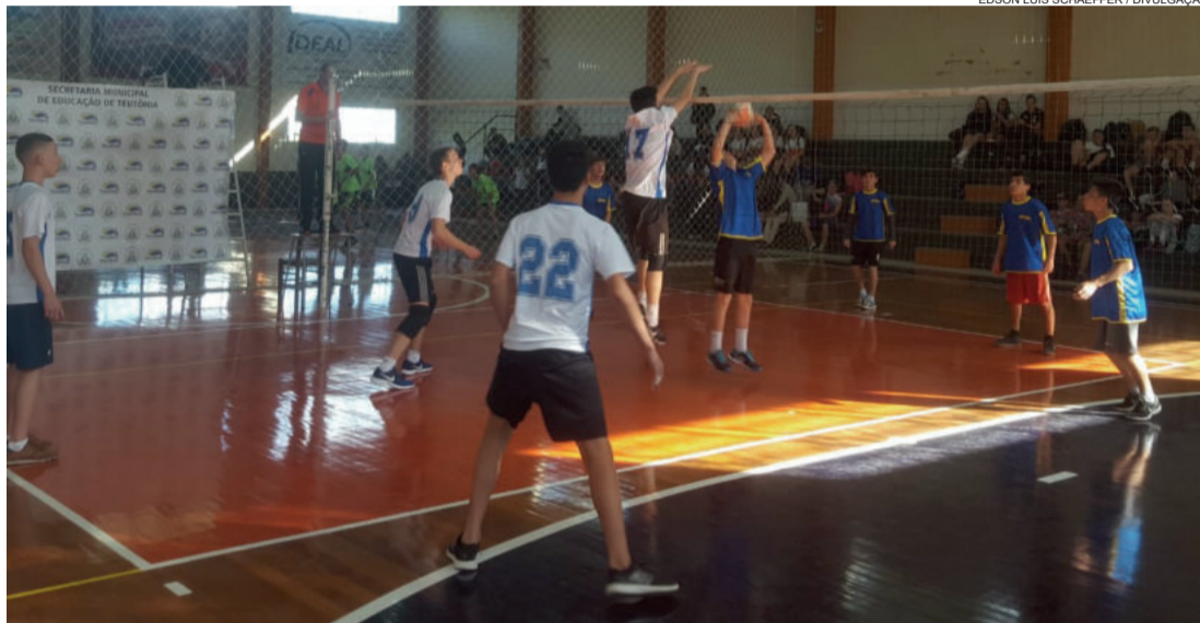
Jogos movimentaram dois ginásios do Bairro Teutônia

Durante todo o dia, as equipes disputaram jogos nas categorias mirim (masculino e feminino), infantil (masculino e feminino) e juvenil (masculino e feminino). Ao meio-dia, todos os participantes receberam almoço na EMEF Professor Alfredo Schneider, preparado e servido pelas merendeiras da Secretaria de Educação, e, ainda, foram disponibilizadas frutas durante todo o dia aos atletas.