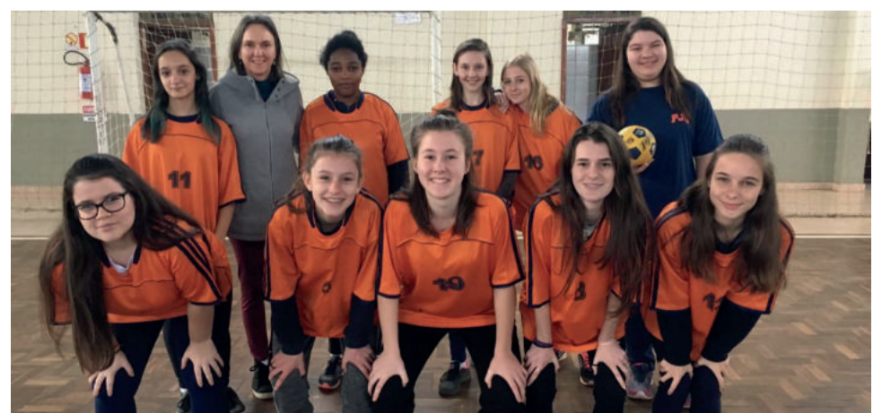
Emef Pedro Jorge Schmidt também terá quatro times. Um deles o infantil feminino, que intensifica os treinos