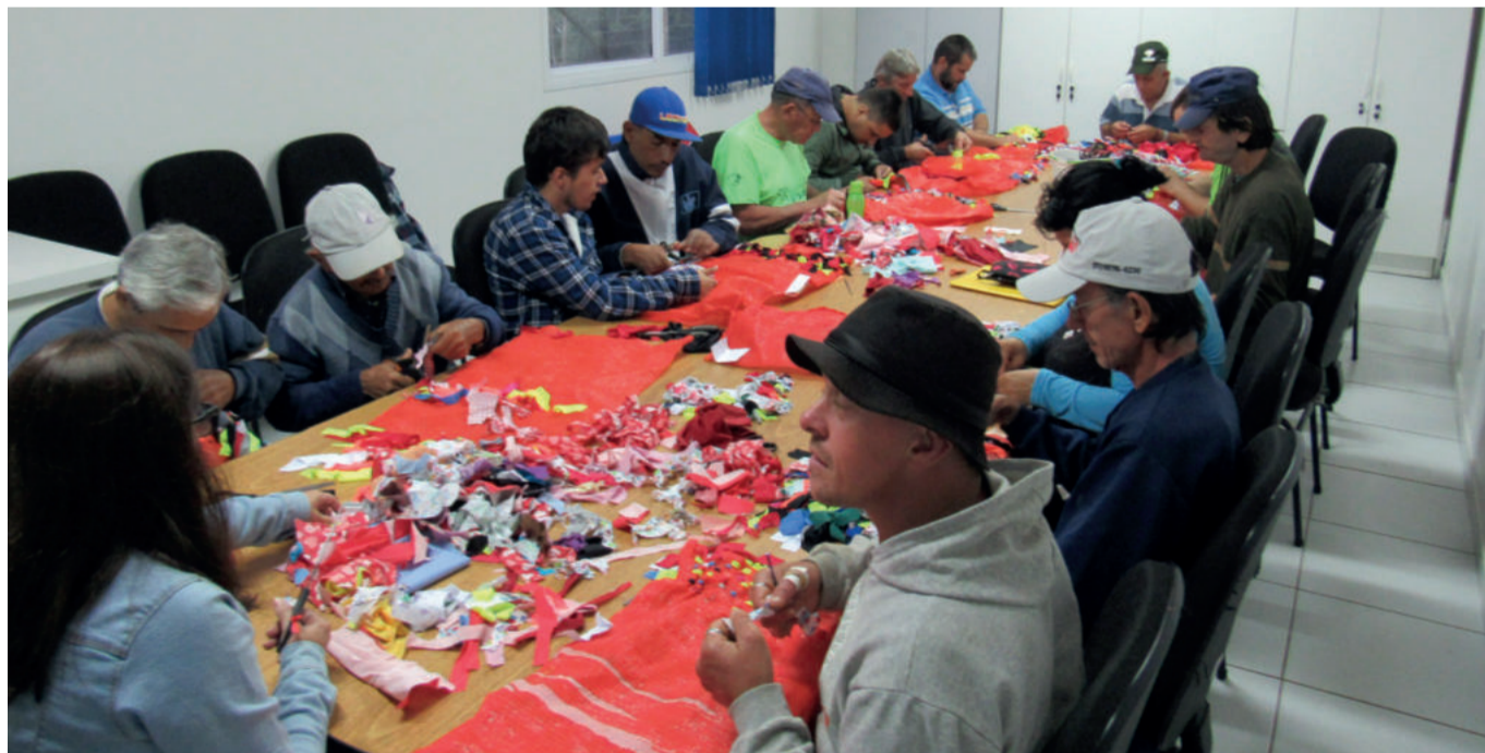
O espaço do grupo configura uma oportunidade de socialização