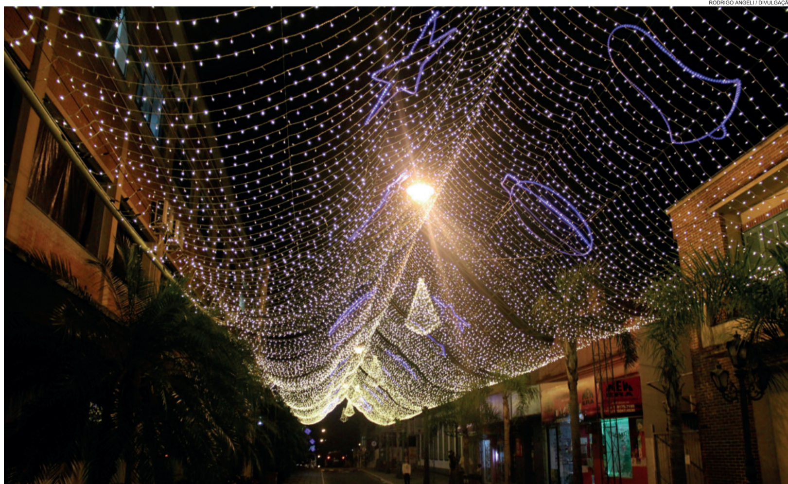
Calçada será uma das ruas por onde passarão os desfiles temáticos

Atração vai ocorrer em quatro datas, durante a programação de fim de ano do município