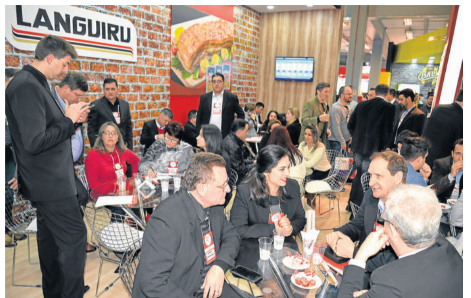
Estande recebeu a visita de clientes gaúchos e de outros estados que encaminharam compras nas linhas de carnes de aves e suínos, industrializados e lácteos