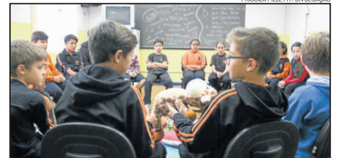
Educação de Garibaldi superou as metas projetadas