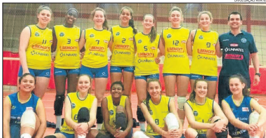
Com as três vitórias, equipe é a primeira do grupo e joga a próxima etapa em casa