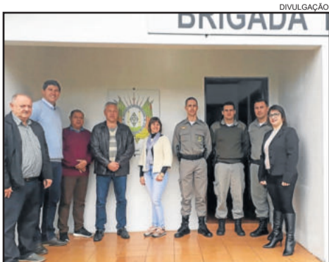
Consepro apresenta a autoridades nova sede da Brigada Militar de Paverama

Com o intuito de mostrar as novas instalações da Brigada Militar e apresentar a chapa reeleita ao executivo, o Conselho Comunitário Pró-Segurança Pública (Consepro) convidou autoridades municipais para conhecerem a nova sede da BM do município.