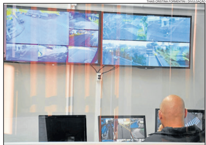
Central de videomonitoramento de Carlos Barbosa

Imigrante e Fazenda Vilanova, segundo reportagens já publicadas pela Folha Popular, pretendiam ou pretendem implantar o sistema até o final de 2018.