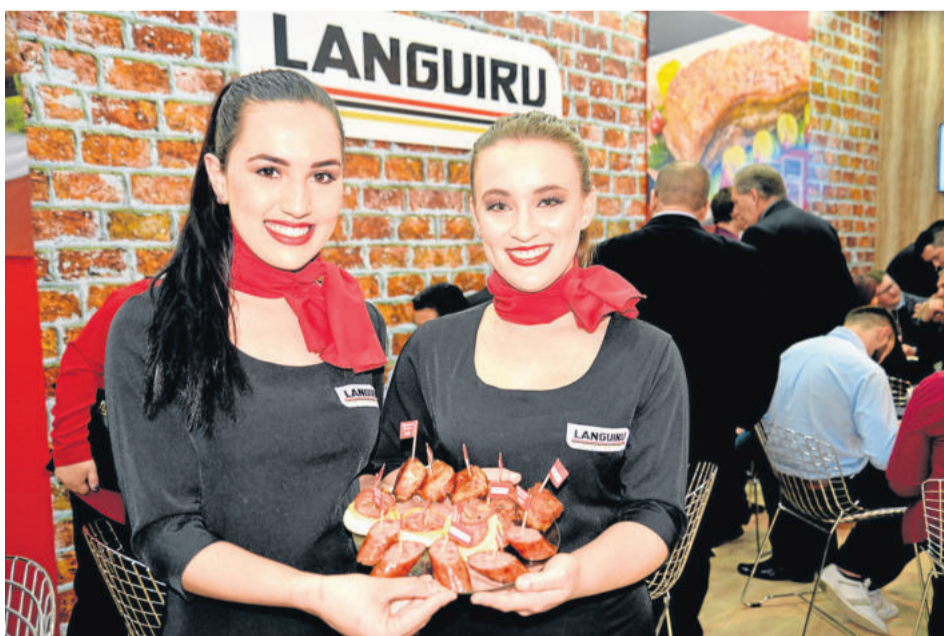
Cardápio especial para cada período do dia foi elaborado com muito carinho para receber clientes, consumidores e visitantes