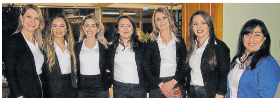
Algumas das colaboradoras da Cirandinha fazendo a recepção no evento