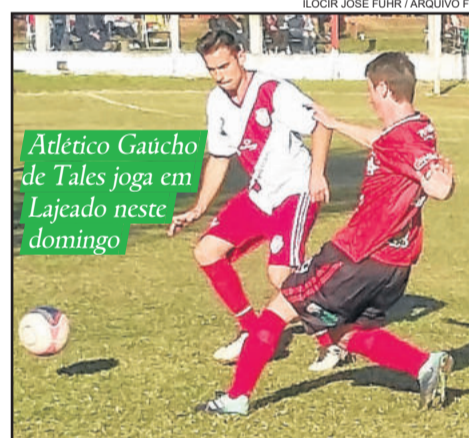
Atlético Gaúcho de Tales joga em Lajeado neste domingo

A Chave C terá o Rui Barbosa fazendo jogo decisivo, em casa, frente a ASSESPE de Venâncio Aires. Em Encantado, o Ouro Verde almeja a segunda vitória e pega o lanterna Pouso Novo, que vai para um duelo chave. Em Lajeado, São Cristóvão e Atlético Gaúcho se enfrentam de olho nas melhores campanhas.