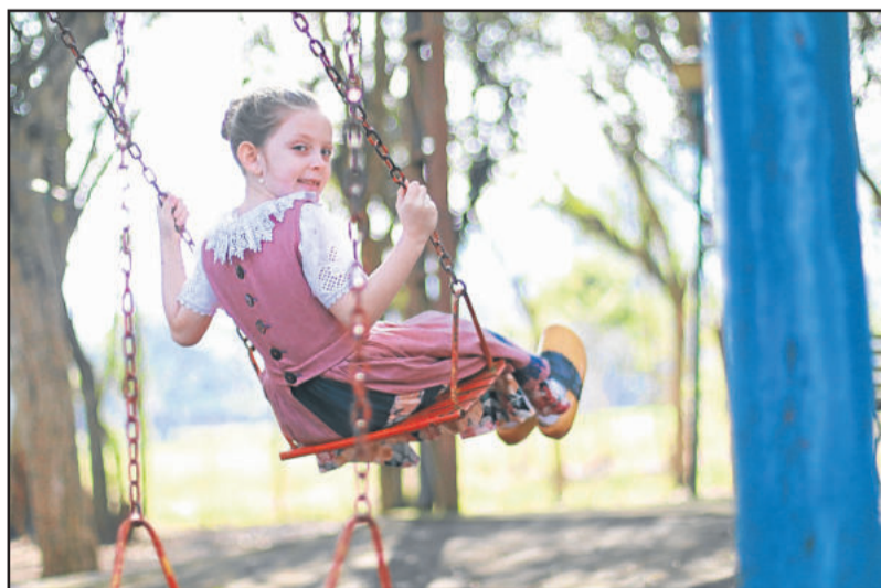
3º lugar do 10º Concurso de Fotografias: ‘Longe de qualquer tecnologia, um balanço funciona como as memórias de infância - vem, vão e nos enchem de alegria’, de Jenifer Kunzler Beckenbach