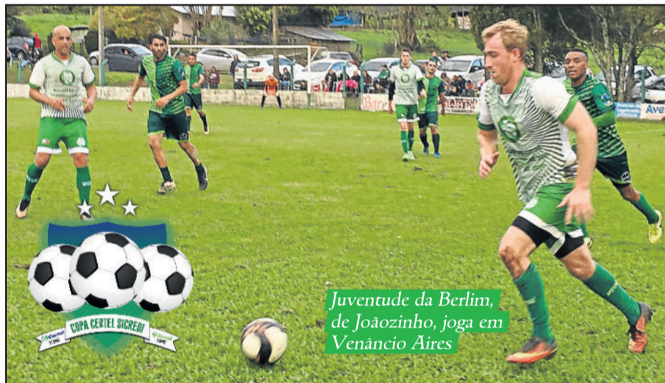
Juventude da Berlin, de Joãozinho, joga em Venâncio Aires

No próximo domingo, oito jogos fecham a 7ª rodada da primeira fase. Pela Chave A, Rudibar e Imigrante entram em campo em jogos distintos brigando por uma vaga. O Imigrante atua em casa e recebe o Esperança de Arroio do Meio. O Rudibar vai a Brochier enfrentar o Juventude.