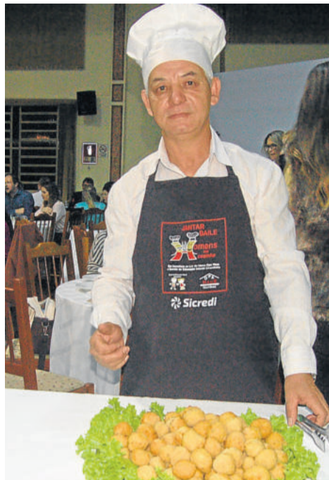
Peixe à moda da casa, oferecido pela Escola Cirandinha