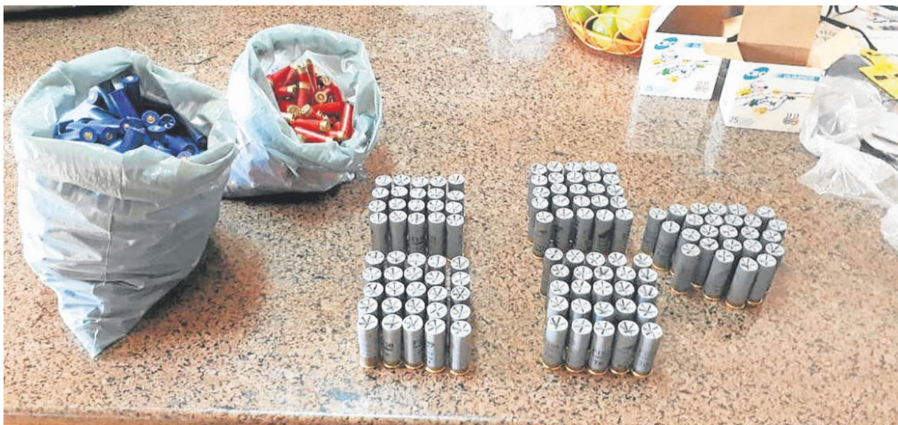
No Comércio de Carnes Daltro Filho foi encontrada grande quantidade de munição