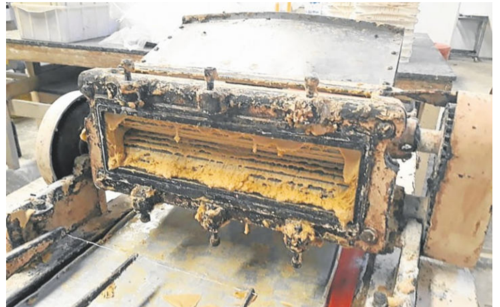
A fábrica de biscoitos Konrad foi interdita por apresentar condições de higiene inadequadas

A empresa elaborou uma nota de esclarecimento que foi encaminhada à redação do Grupo Popular. Nela, o estabelecimento reafirma que não comercializa carnes “sem procedência”, contradizendo a alegação do Ministério Público. Segundo a nota, a empresa “adquire carcaças inteiras de bois e suínos abatidos em frigoríficos, fracionando os mesmos em seu açougue”. Aliás, a empresa alega que não houve a interdição da padaria por falta de higiene, “e sim, porque não havia uma parede de isolamento entre o açougue e a padaria, o que está sendo providenciado”.