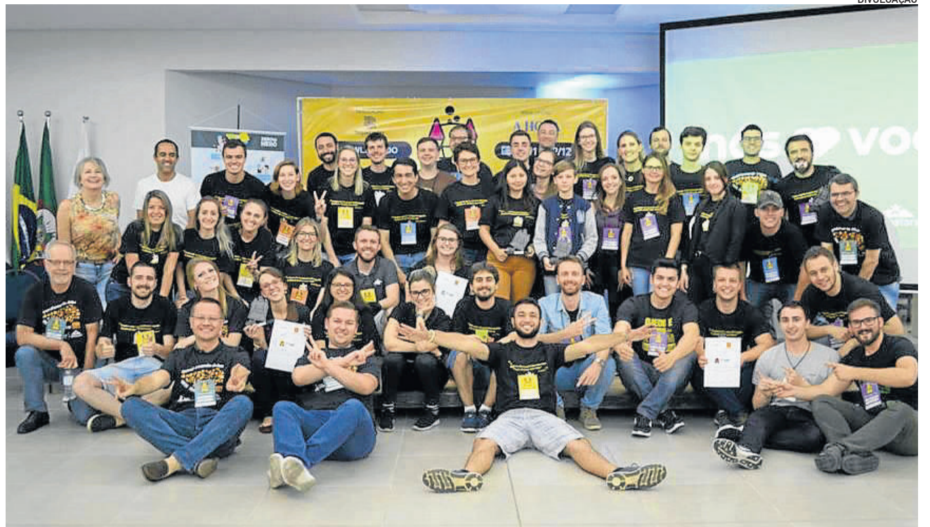
Turma que participou do evento em 2018

O especialista está mais aberto a novas possibilidades, apresenta foco na busca pelo conhecimento técnico, para atingir resultados mais expressivos e se destacar no mercado de trabalho.