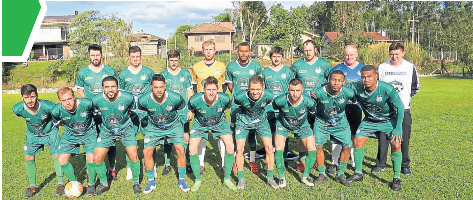
Juventude de Westfália jogará em casa sua segunda partida no campeonato