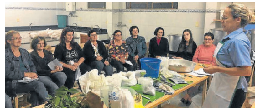
Orientações sobre plantas e alimentos