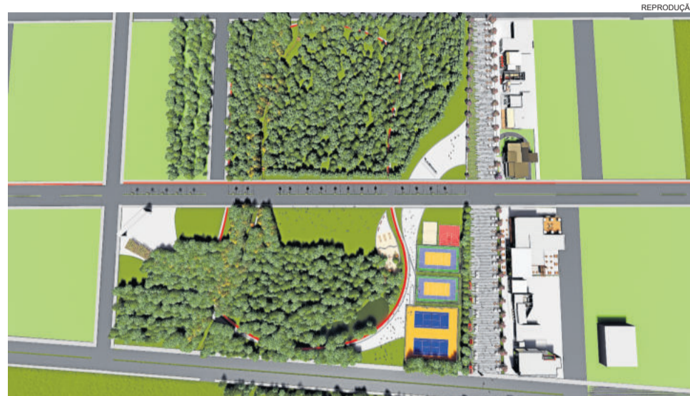
Perspectiva do TeutoPark

Já a segunda etapa do projeto, entre a Avenida 1 Oeste e a rodovia Via Láctea, prevê mais lotes destinados à gastronomia, quadras esportivas (de várias modalidades), calçadão, ampliação das pistas de caminhada e da ciclovia, lago artificial, pórtico, iluminação, playground. O valor do investimento previsto nesta etapa é de aproximadamente R$ 2 milhões, recurso que também será arrecadado com o leilão dos lotes.