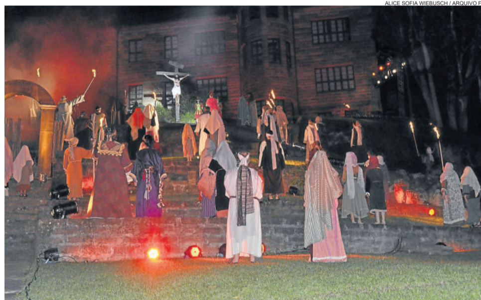
Encenação deste ano atraiu mais de 10 mil pessoas para as duas noites

A edição de 2020 já está confirmada para os dias 3 e 4 de abril. E o prefeito garante que mais novidades virão por aí. Ele cita inclusive que muitas excursões de fora do estado já confirmaram presença para o próximo ano.