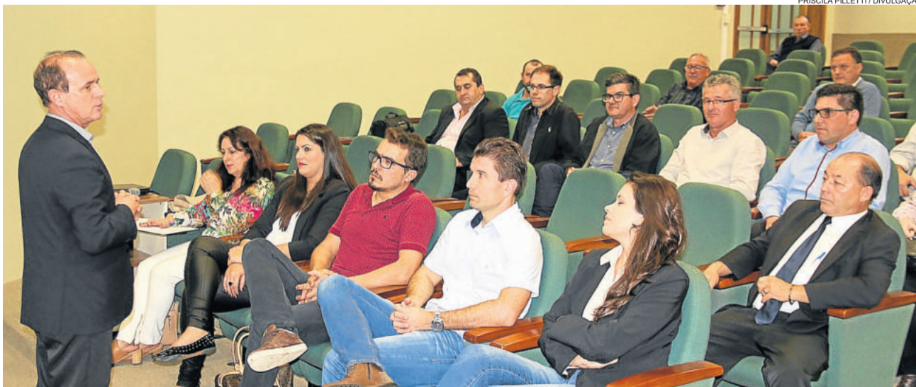
Proposta foi explicada durante audiência pública