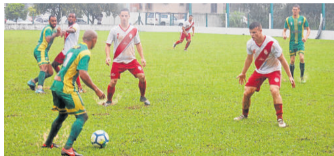
Jogo disputado no Bairro Alesgut teve campo com muita água e barro por causa da chuva