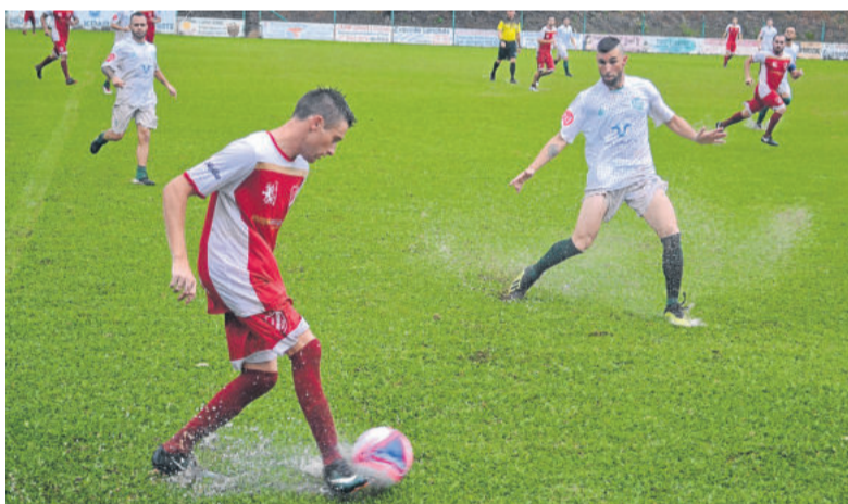
Jogo de ida foi disputado sob muita chuva no domingo