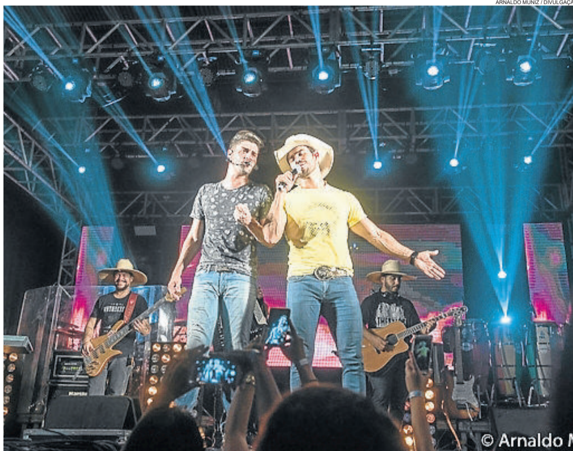
O show principal, da dupla Munhoz e Mariano, acontece no sábado (11/05) a partir das 23h30

A abertura oficial do evento está marcada para as 19h30 de sexta-feira (10/05). A solenidade oficial contará com a presença de autoridades e parceiros. A feira e a festa, porém, iniciam já pela manhã. A partir das 10h de sexta-feira a exposição comercial já estará aberta. Também às 10h, a banda típica Quebra Galho circulará pelo parque animado o ambiente. E às 13h a terceira idade tem encontro marcado na Sascepa, com o Baile da