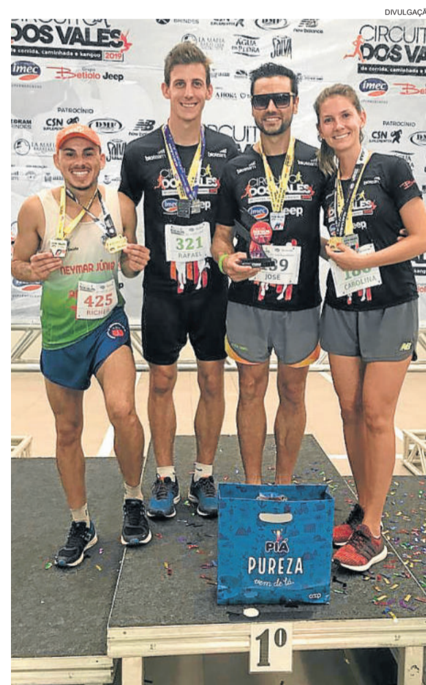
Atletas de Teutônia comemoraram resultados em Lajeado