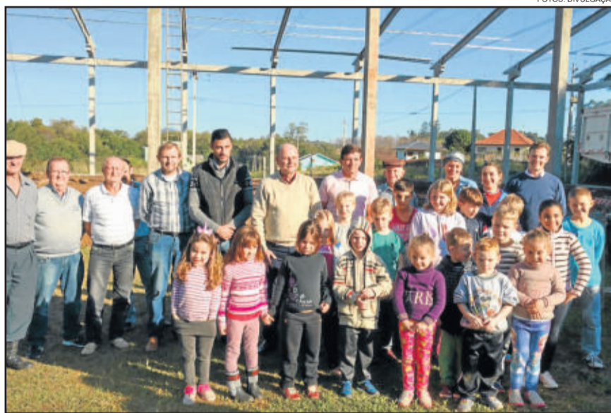
Em Linha Harmonia, construção de pavilhão com recursos destinados por Bohn Gass

O deputado federal Elvino Bohn Gass (PT) esteve, recentemente, em Teutônia, para visitar entidades e acompanhar o investimento de emendas parlamentares destinadas. Acompanhado do suplente de vereador André Böhmer, o parlamentar visitou a comunidade de Linha Harmonia, onde está sendo construído um pavilhão com emenda de R$ 250 mil, próximo à escola e ao campo do Fluminense. No Hospital Ouro Branco, Bohn Gass confirmou o empenho de emenda parlamentar de R$ 200 mil.