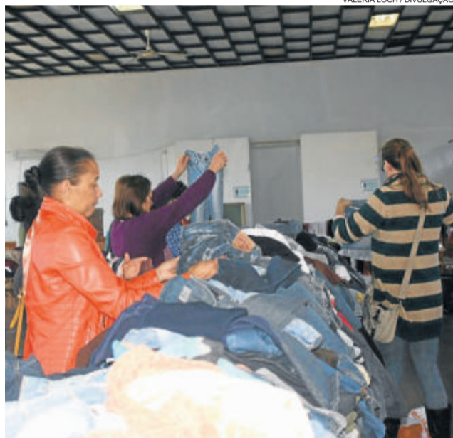
A comercialização será na União de Moços Católicos, das 8h às 16h