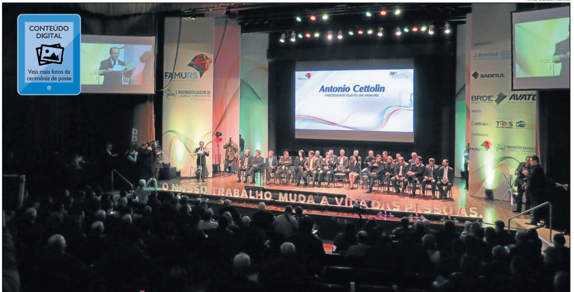
Posse de Cettolin aconteceu no Teatro Dante Barone da Assembleia Legislativa do Rio Grande do Sul