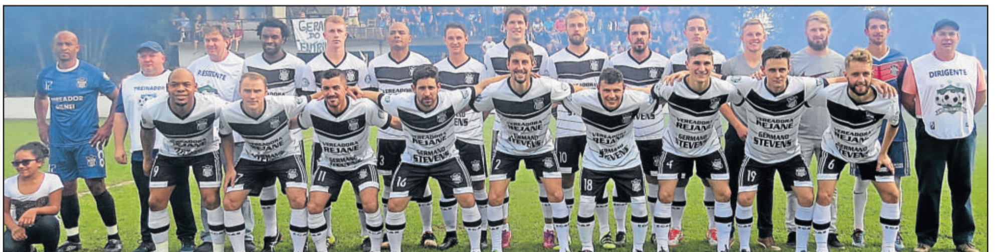
ECAS - Imigrante