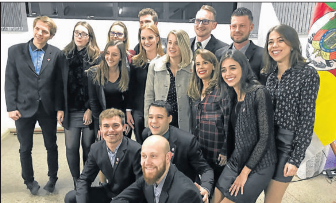
Nova diretoria do Rotaract Club de Teutônia