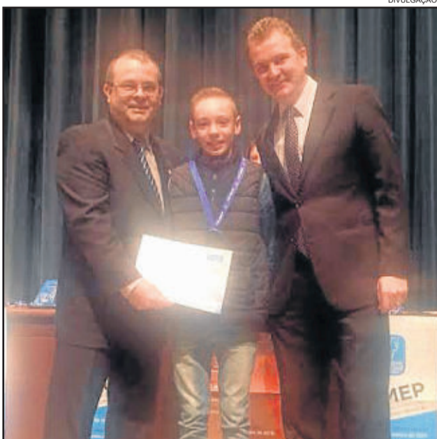
A solenidade ocorreu na manhã de sábado, dia 30 de junho, no Salão de Atos da Reitoria da UFRGS

do Instituto de Matemática Pura e Aplicada (Impa), com apoio da Sociedade Brasileira de Matemática (SBM) e promovida com recursos do Ministério da Ciência, Tecnologia, Inovações e Comunicações (MCTIC) e do Ministério da Educação (MEC).