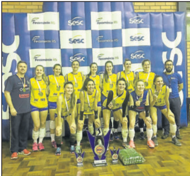
Equipe infanto-juvenil campeã do SESC no domingo