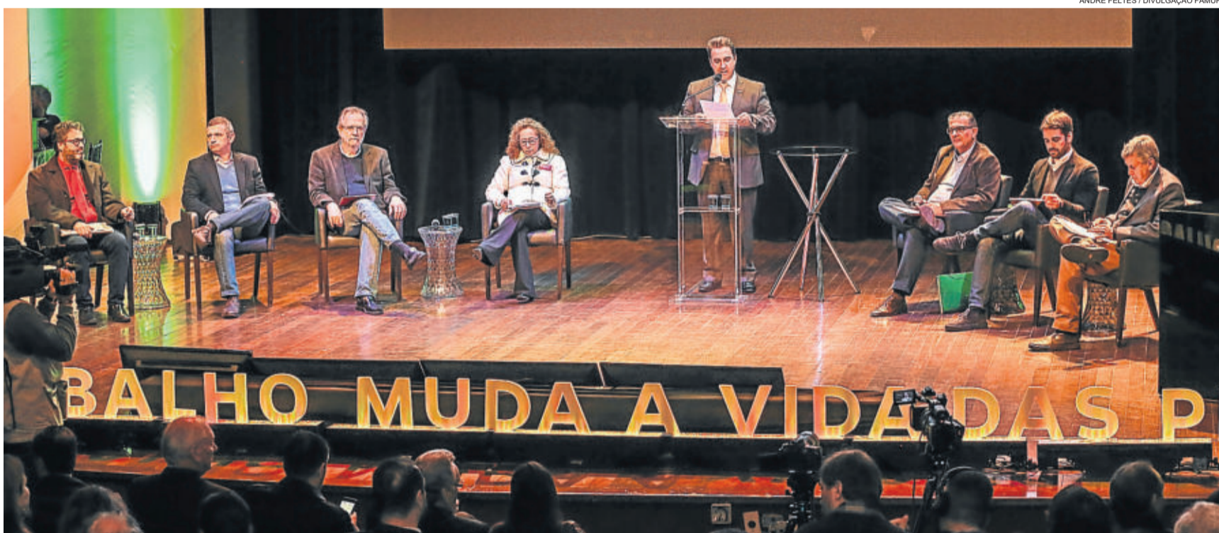
Sete pré-candidatos participaram do painel promovido pela Famurs