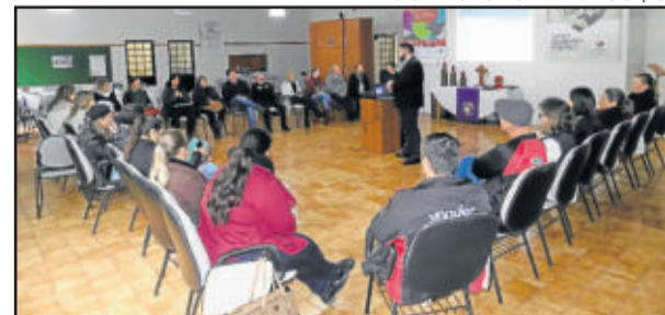
Reunião ocorreu na sede do Sínodo Vale do Taquari