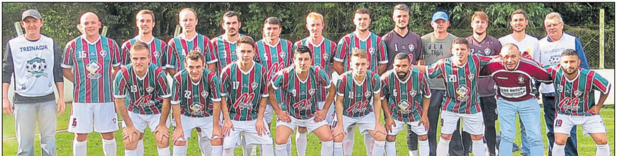
Fluminense - Westfália