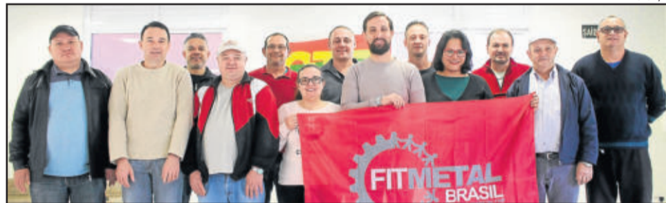
Com chapa única venceu o lema "Fortalecer nossa luta e nossos direitos"

compromisso é fortalecer a cada dia nosso sindicato e lutar pelos direitos da categoria, mas também pelos direitos específicos das mulheres trabalhadoras, que além de cumprir com sua jornada nas empresas, ainda cuidam da família, estudam, enfim, são guerreiras que devem receber toda nossa atenção no sentido de ampliar conquistas por mais igualdade, melhores condições de trabalho e salário, contra o machismo, a violência e a opressão", explica.