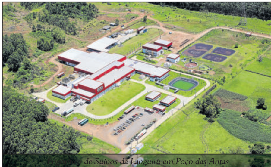
de Suínos da Languiru em Poço das Antas

Estão abertas as inscrições, junto à Secretaria da Agricultura e Meio Ambiente de Poço das Antas, das famílias interessadas em participar do Programa Municipal de Compostagem Doméstica. Para participar, as famílias devem residir na área urbana do município e comparecer a Secretaria com um documento de identificação. No programa as famílias receberão orientações e apoio técnico no processo de compostagem.