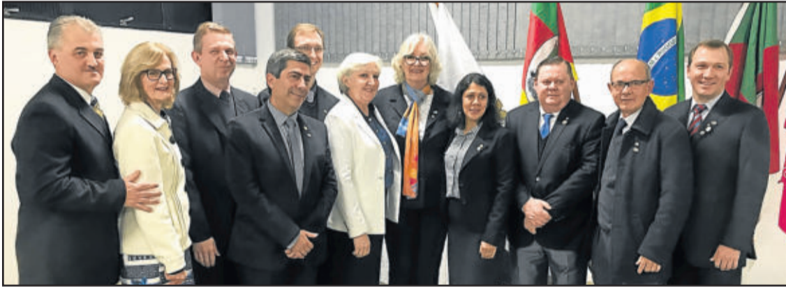
Novo conselho diretor do Rotary Club Teutônia