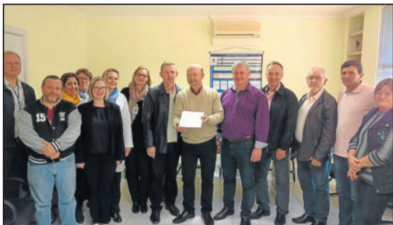
No Hospital Ouro Branco, encaminhamento de emenda

O deputado federal Elvino Bohn Gass (PT) esteve, recentemente, em Teutônia, para visitar entidades e acompanhar o investimento de emendas parlamentares destinadas. Acompanhado do suplente de vereador André Böhmer, o parlamentar visitou a comunidade de Linha Harmonia, onde está sendo construído um pavilhão com emenda de R$ 250 mil, próximo à escola e ao campo do Fluminense. No Hospital Ouro Branco, Bohn Gass confirmou o empenho de emenda parlamentar de R$ 200 mil.