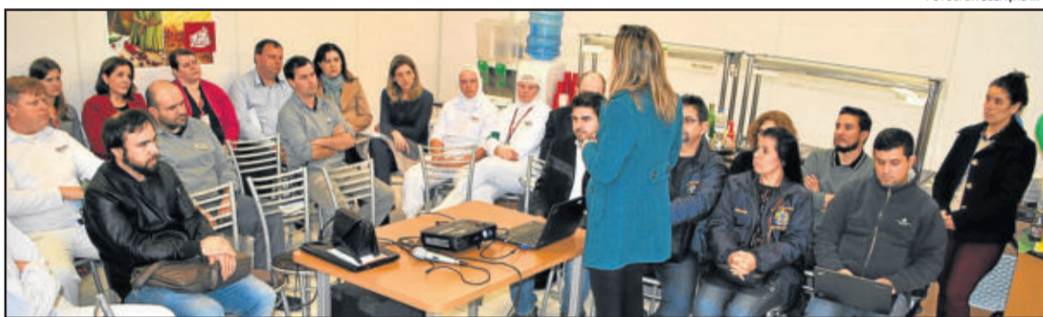
Força-tarefa avaliou 71 itens e apresentou resultado da reinspeção realizada aos líderes da Languiru

A operação começou, às 11h de segunda-feira (25/06), quando a equipe do grupamento operativo se reuniu em Poço das Antas, município localizado a 95 km da Capital gaúcha, Porto Alegre. Foram parceiros do MPT a Rede Nacional de Atenção Integral à Saúde do Trabalhador no Rio Grande do Sul (Renast-RS) e o Conselho Regional de Engenharia e Agronomia do Estado do Rio Grande do Sul (CREA-RS). O movimento sindical dos trabalhadores também participou com a Confederação Nacional dos Trabalhadores nas Indústrias de Alimentação e Afins