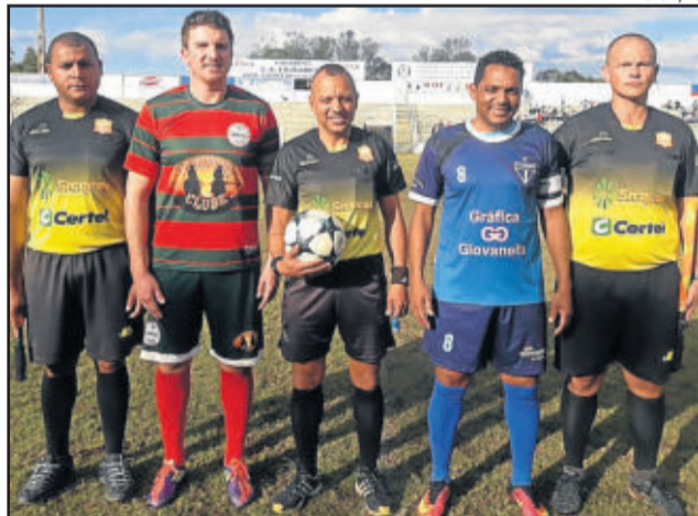
Capitães com a arbitragem antes do jogo de Titulares