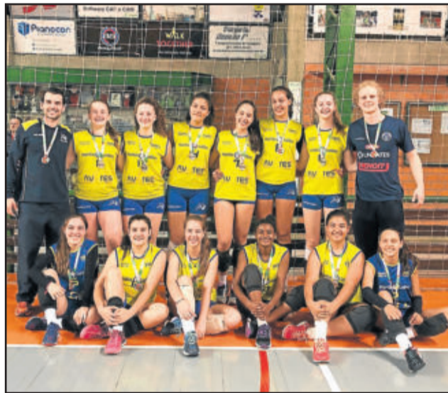
Equipe pré-infantil vice-campeã da Copa Cláudio Braga Infantil-Série Prata