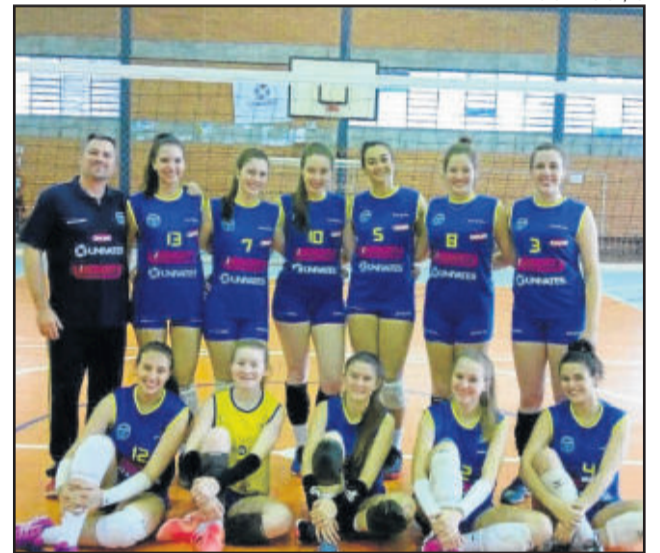
Equipe Estudantil do Colégio Martin Luther, campeã do CERGS