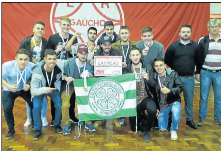
Celtic foi campeão no Sub-20