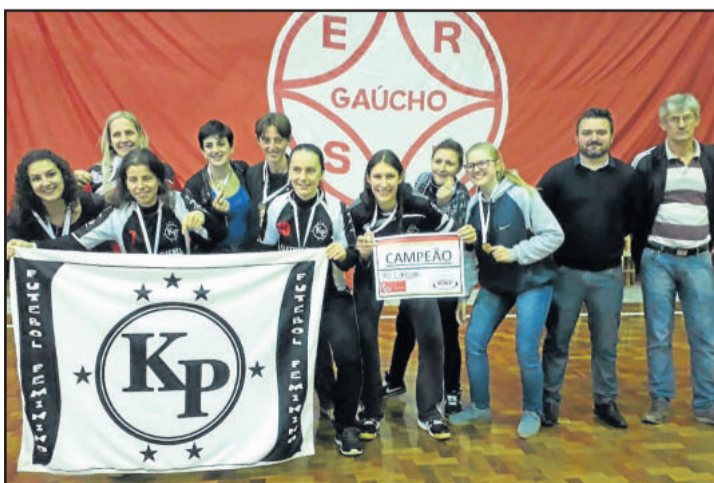
Eletro Diesel Hirt, campeã no Feminino