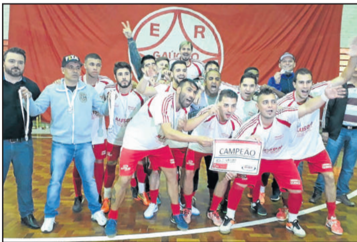
Amaral DPVAT campeão do Força Livre