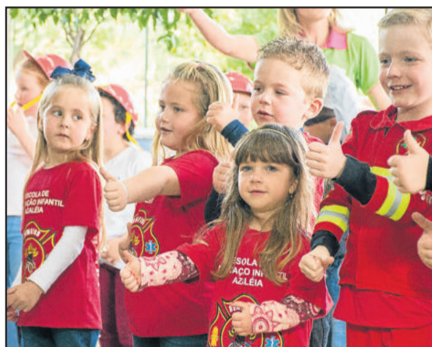
Bombeiros Mirins homenagearam os bombeiros através de música e dança