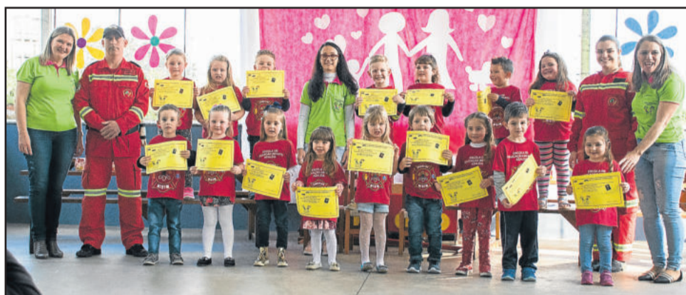
Bombeiros Mirins receberam certificados de formação