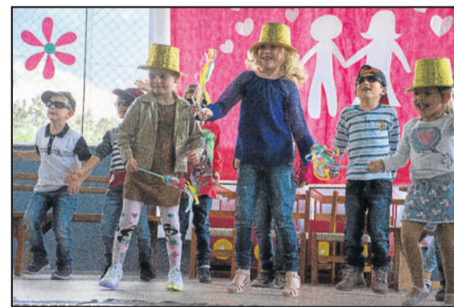
Turmas realizaram apresentações artísticas