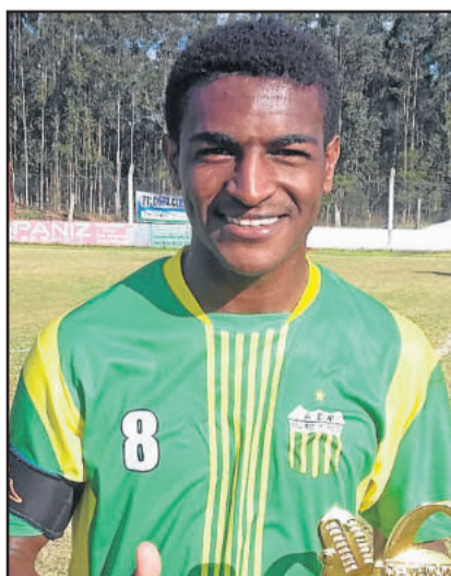
Pelé, do Atlético Gaúcho, craque nos Aspirantes