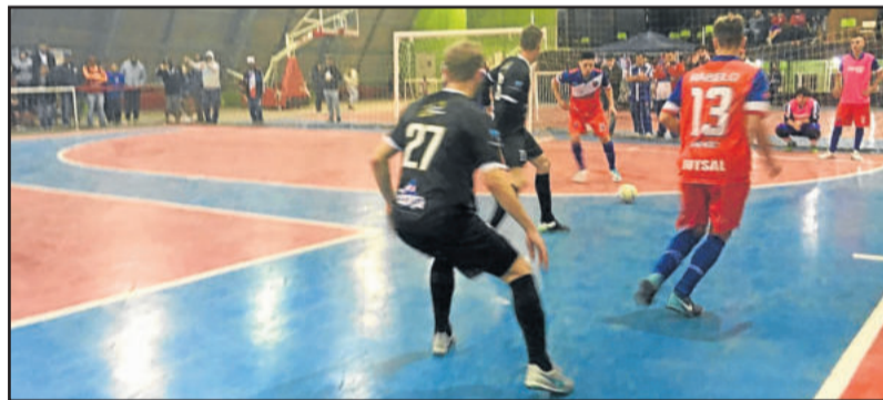
Teutônia Futsal saiu ganhando, tomou a virada e buscou o empate no segundo final