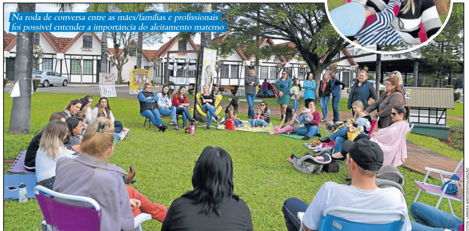
Na roda de conversa entre as mães/famílias e profissionais foi possível entender a importância do aleitamento materno

A programação integrou a Semana Mundial do Aleitamento Materno, que ocorreu de 1º agosto e prossegue até dia 7 de agosto. A iniciativa é da Aliança Mundial para Ação em Amamentação.