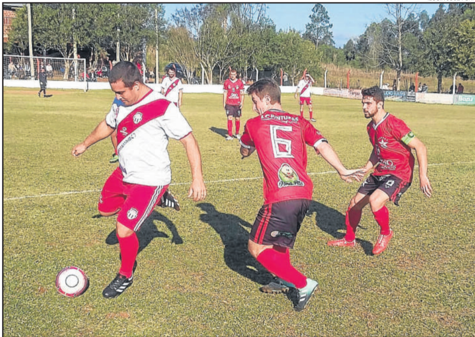
Índio com a bola fez dois gols na estreia do Atlético Gaúcho