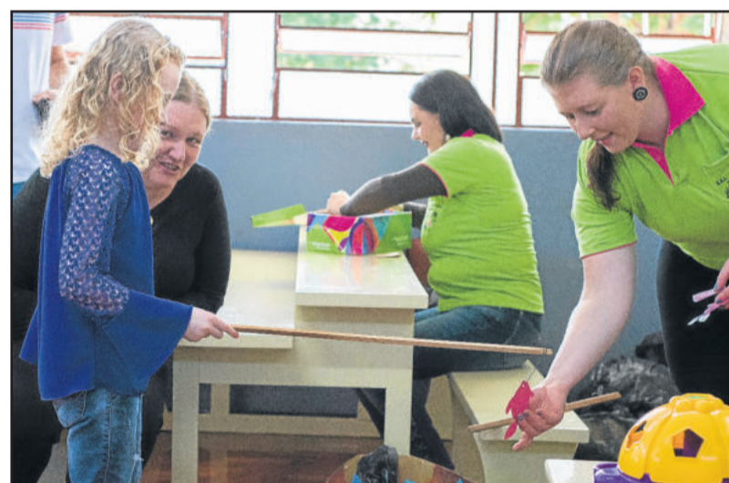
Evento contou com diversas atrações, uma delas foi a pescaria