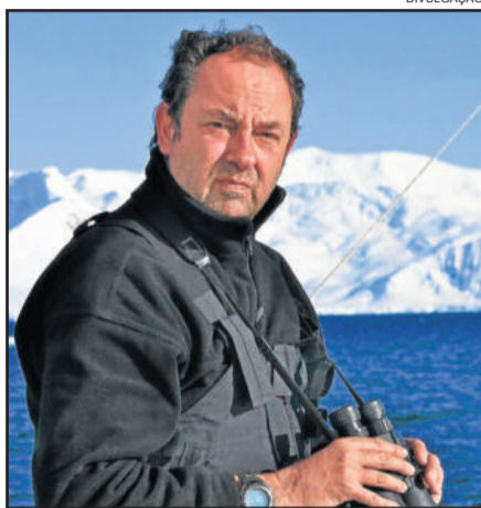
Amyr Klink é economista, pós-graduado em Administração, comandou 22 expedições à Antártica e é autor de seis best-sellers

A habilidade de Amyr Klink para velejar e atuar sob condições adversas pode ser comparada ao mundo dos negócios. A personalidade brasileira será trazida pela Associação de Pequenas e Médias Empresas de Garibaldi (Apeme), em sua 11ª Palestra Show, no dia 11 de abril de 2019, em comemoração aos 24 anos da entidade. O evento será realizado no Ginásio da Associação dos Motoristas de Garibaldi (rua Antonio Bortolini, 400, bairro São José).