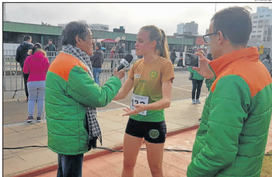
Após a prova, a campeão concedeu entrevistas