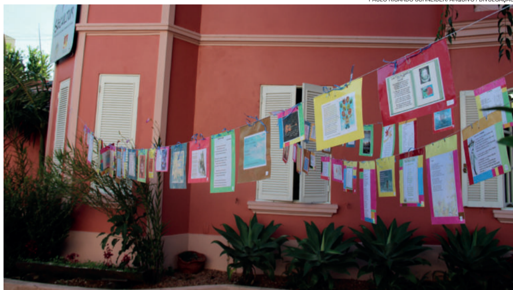
Poesias estarão expostas no Centro de Cultura e Turismo de Estrela