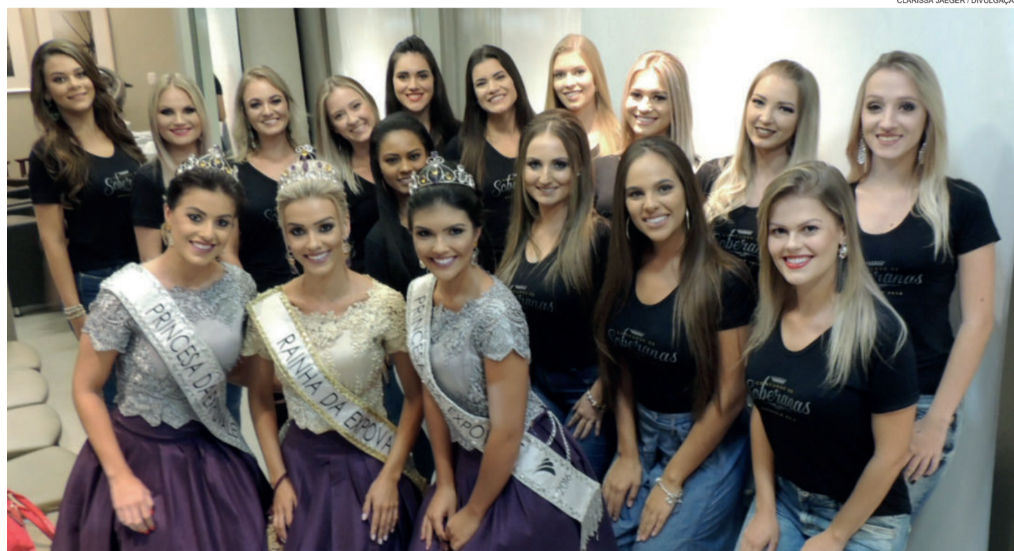
Corte de 2016 também participa das atividades com as candidatas