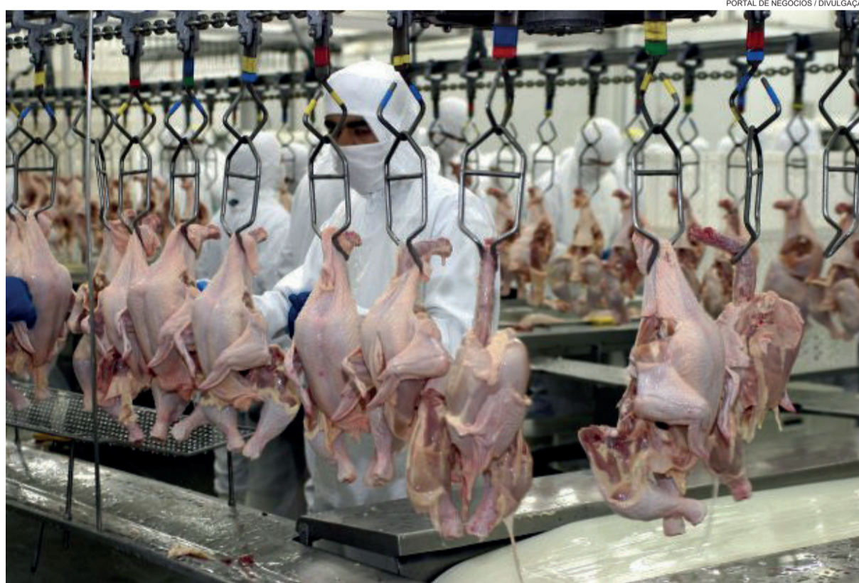
A operação atinge principalmente a carne de frango