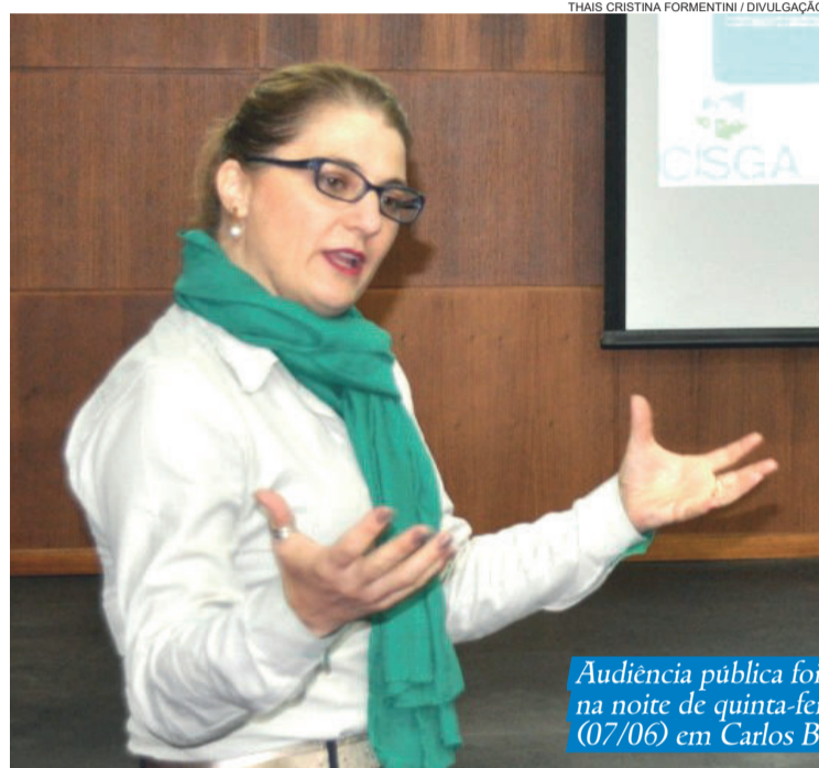
Audiência pública foi realizada na noite de quinta-feira (07/06) em Carlos Barbosa

ações e metas para diminuir a geração de resíduos sólidos. Outra questão é trabalhar para aumentar a quantidade