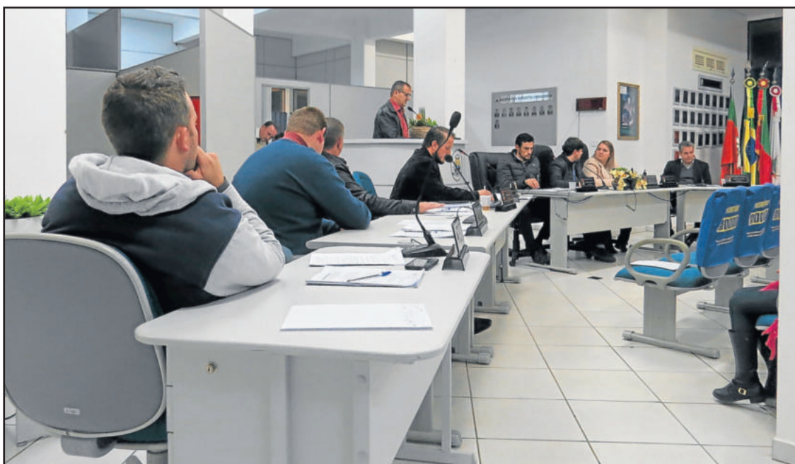
Fechamento da unidade da Piccadilly repercutiu na tribuna