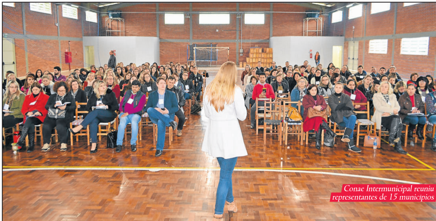
Conae Intermunicipal reuniu representantes de 15 municípios