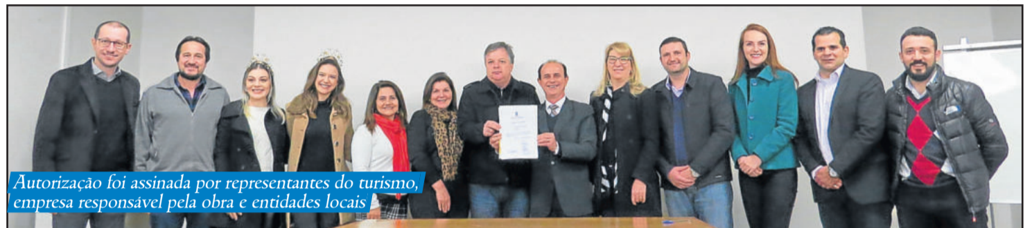
Autorização foi assinada por representantes do turismo, empresa responsável pela obra e entidades locais