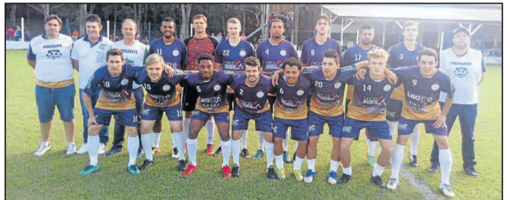
Juventude de Linha Frank