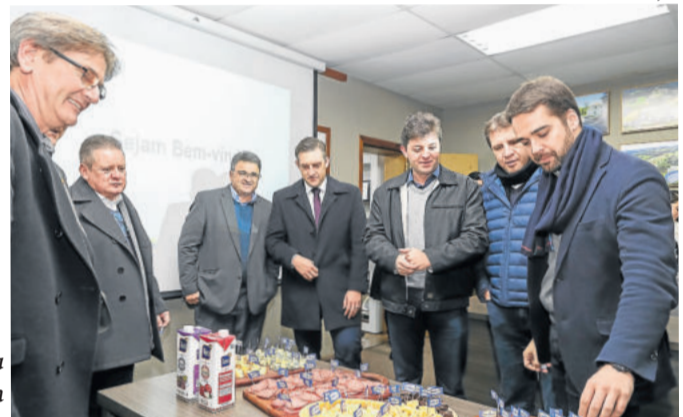
Governador conheceu a estrutura da Cooperativa

Laticínios da Santa Clara, na próxima sexta-feira (12/07), em Casca. À noite, Eduardo Leite e Ranolfo Vieira Júnior também visitaram o Festiqueijo.