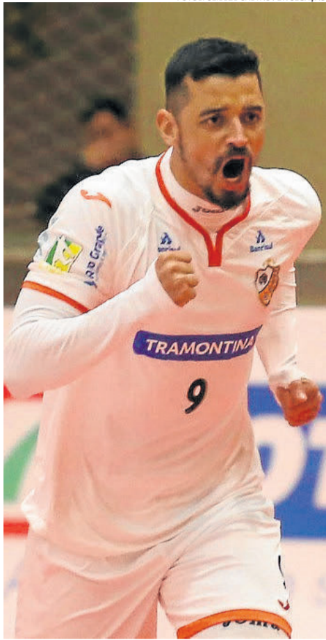
Pesk marcou o gol da vitória na sexta-feira