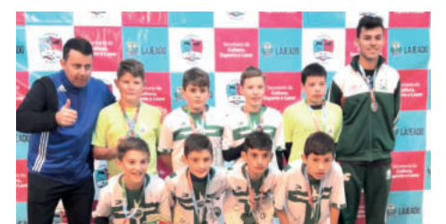
Categoria 2007 da Juventus faturou a Copa Piá