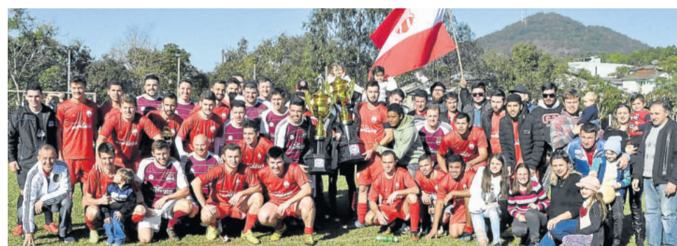
Nos Aspirantes, Atlético Gaúcho conquistou o título e Boavistense ficou com o vice. No final, ambos posaram juntos para a foto histórica