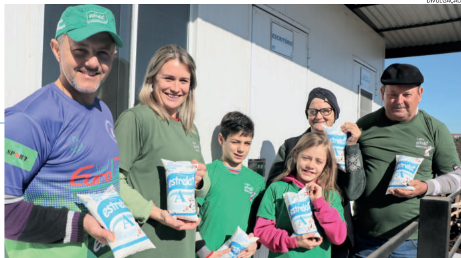
Dos 2.800 litros de leite diários, 1.200 são embalados na propriedade para serem vendidos como A. Granja tem 40 anos de experiência na produção leiteira