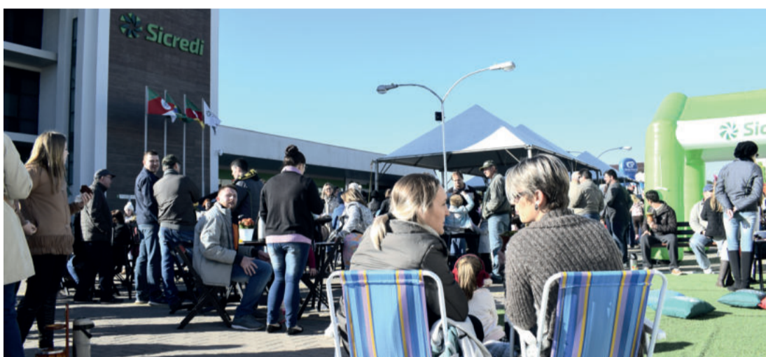
Evento reuniu comunidade e entidades

Evento entidades durante comemoração do Dia Internacional do Cooperativismo, comemorado em 6 de julho