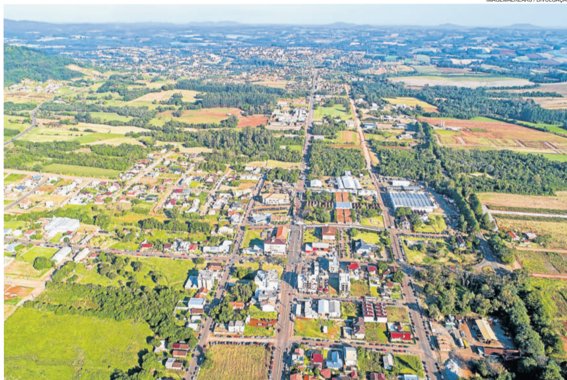
Teutônia segue como segunda maior economia do Vale do Taquari e 53ª no Estado