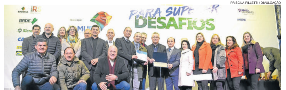
Prêmio foi recebido durante o 39º Congresso de Municípios

com o prêmio na área de Turismo, pela revitalização do centro histórico. O Garibaldi Vintage é uma realização da Prefeitura Municipal de Garibaldi, organizado pela equipe da Secretaria de Turismo e Cultura e conta com o apoio das demais Secretarias.