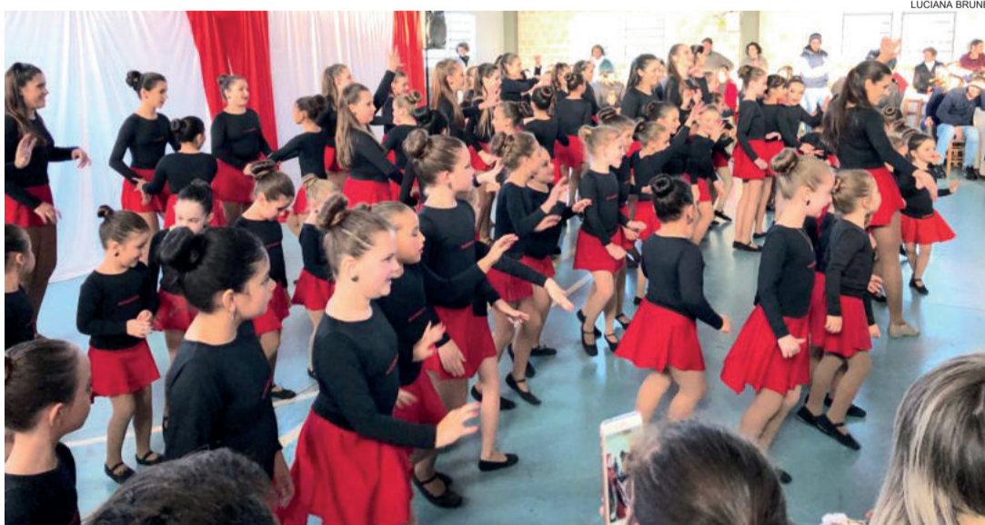
Todas alunas dançaram um samba em conjunto