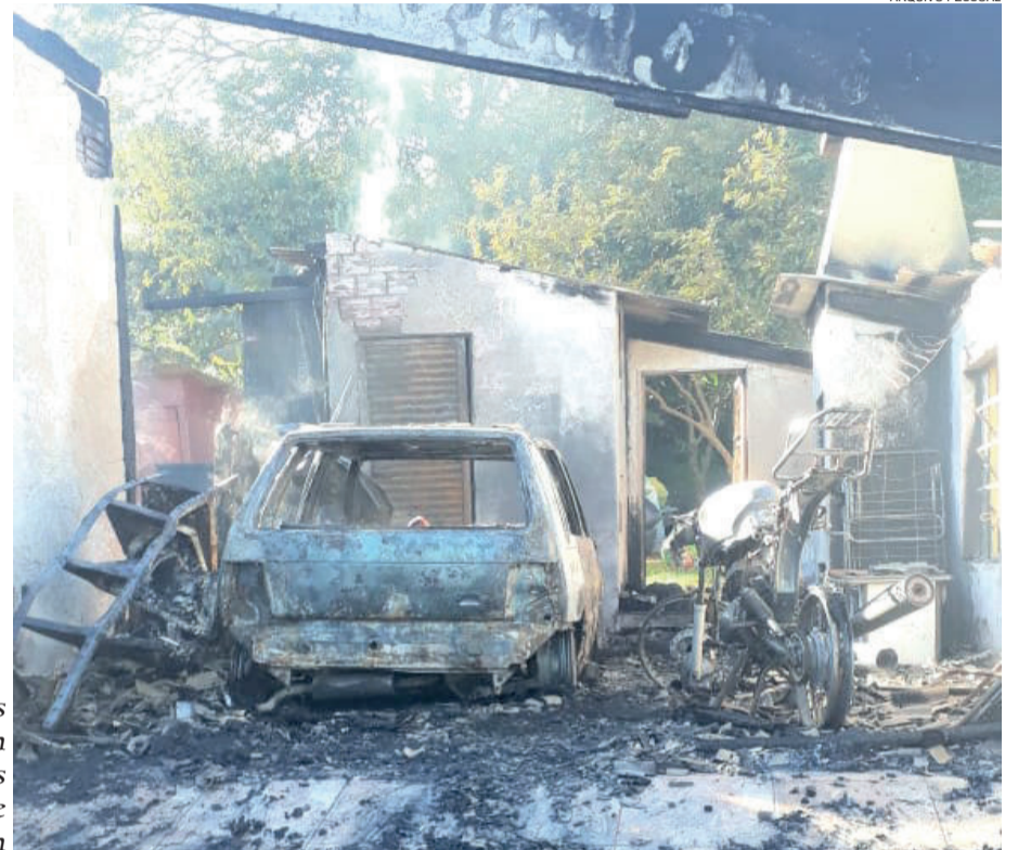
Moradores perderam tudo, mas não se feriram

Ainda de acordo com ele, o casal está, no momento, na casa do pai de Eder. Douglas e seu pai estão trabalhando na arrecadação de materiais para ajudar o casal, como roupas, calçados, móveis, colchão, produtos de higiene e limpeza, alimentos e material de construção. Os materiais podem ser entregues na residência dos pais de Neide, na Rua Décio Böhmer, 405, no Bairro Teutônia. Eles utilizam calça nº 42 ou 44, e calçado feminino nº 38 e masculino nº 44.