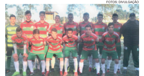
Sub-15 da Juventus conquistou duas vitórias e um empate no Gauchão