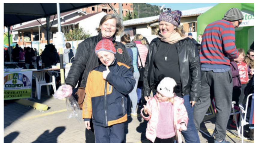
Luft também compareceu na oportunidade com os filhos