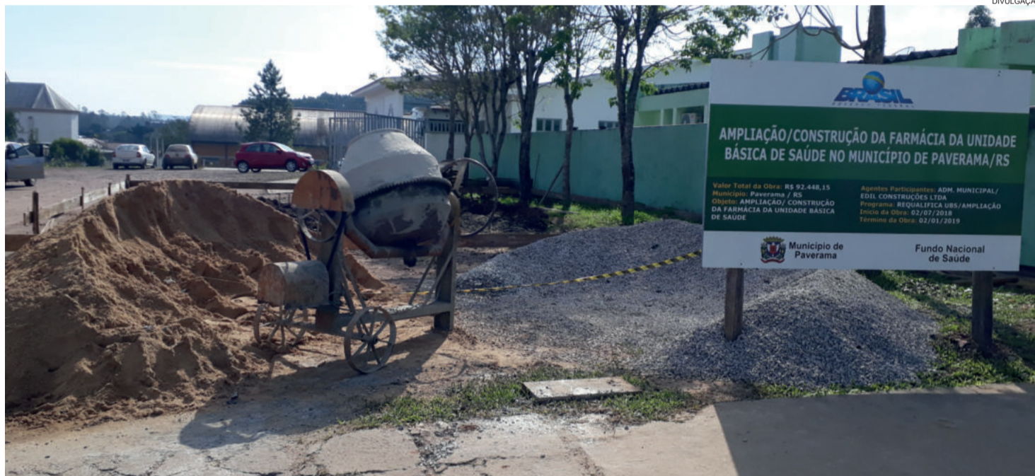
Obras da nova farmácia está sendo construída ao lado do Posto de Saúde