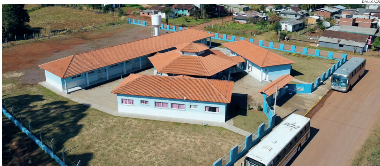
EMEF Reinaldo Markus, do Bairro Fazenda São José é uma das escolas que recebeu videomonitoramento