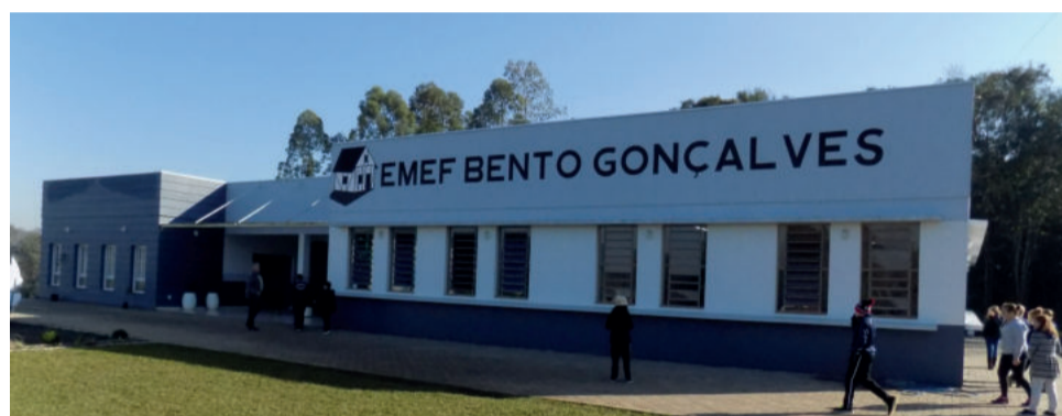
Prédio será oficialmente inaugurado neste sábado

no, devido à importância desta escola à toda comunidade de Boa Vista e arredores. Entregar esta escola é mais um dos nossos compromissos, de investir nas pessoas”, observa.