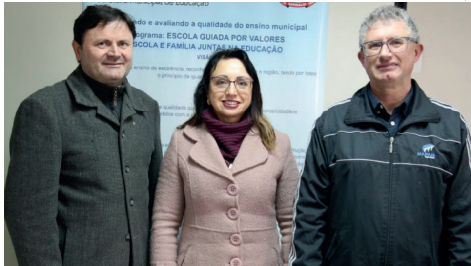
Representantes do Rotary