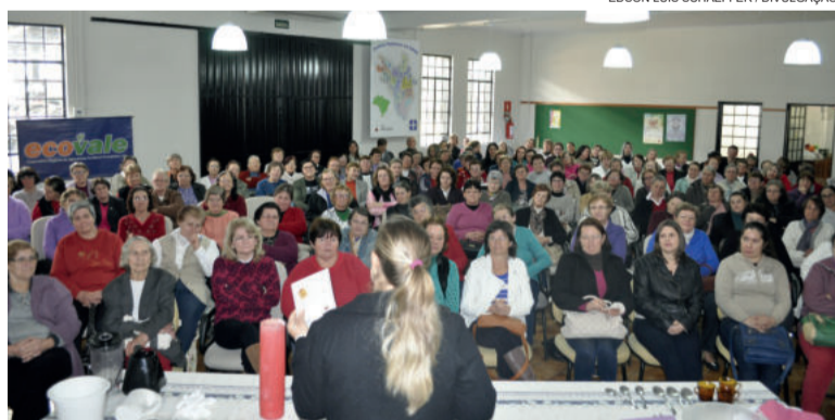
Encontro anual debate questões referentes à saúde e alimentação saudável

Foi com o propósito de oferecer qualidade de vida às pessoas que nasceu o Capa há 40 anos, quando um grupo de pastores da Igreja Evangélica de Confissão Luterana no Brasil (IECLB) percebeu que a população estava adoecendo muito cedo, além da preocupação com o meio ambiente e o êxodo rural. Entre os anos 2000 e 2003, surge a ideia dos Grupos de Saúde Comunitária, iniciativa que se mantém forte, não somente em Teutônia, mas também em outros municípios do Vale do Taquari.