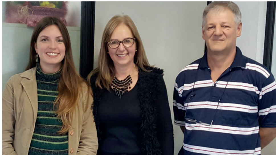
Representantes da Emater