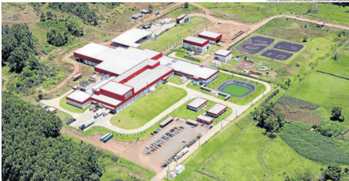
Fotos: Acervo / Divulgação Cooperativa Languiru Frigorífico de Suínos, instalado no município de Poço das Antas

O processo de abate e industrialização é realizado no novo Frigorífico de Suínos, em Poço das Antas. As filiais e departamentos que participam do complexo suinícola são: unidade produtora de leitões (duas granjas); cabanha genética; associados integrados como crecheiros e/ou terminadores; Departamento Técnico do Setor de Suínos; Fábrica de Rações; e Frigorífico de Suínos.