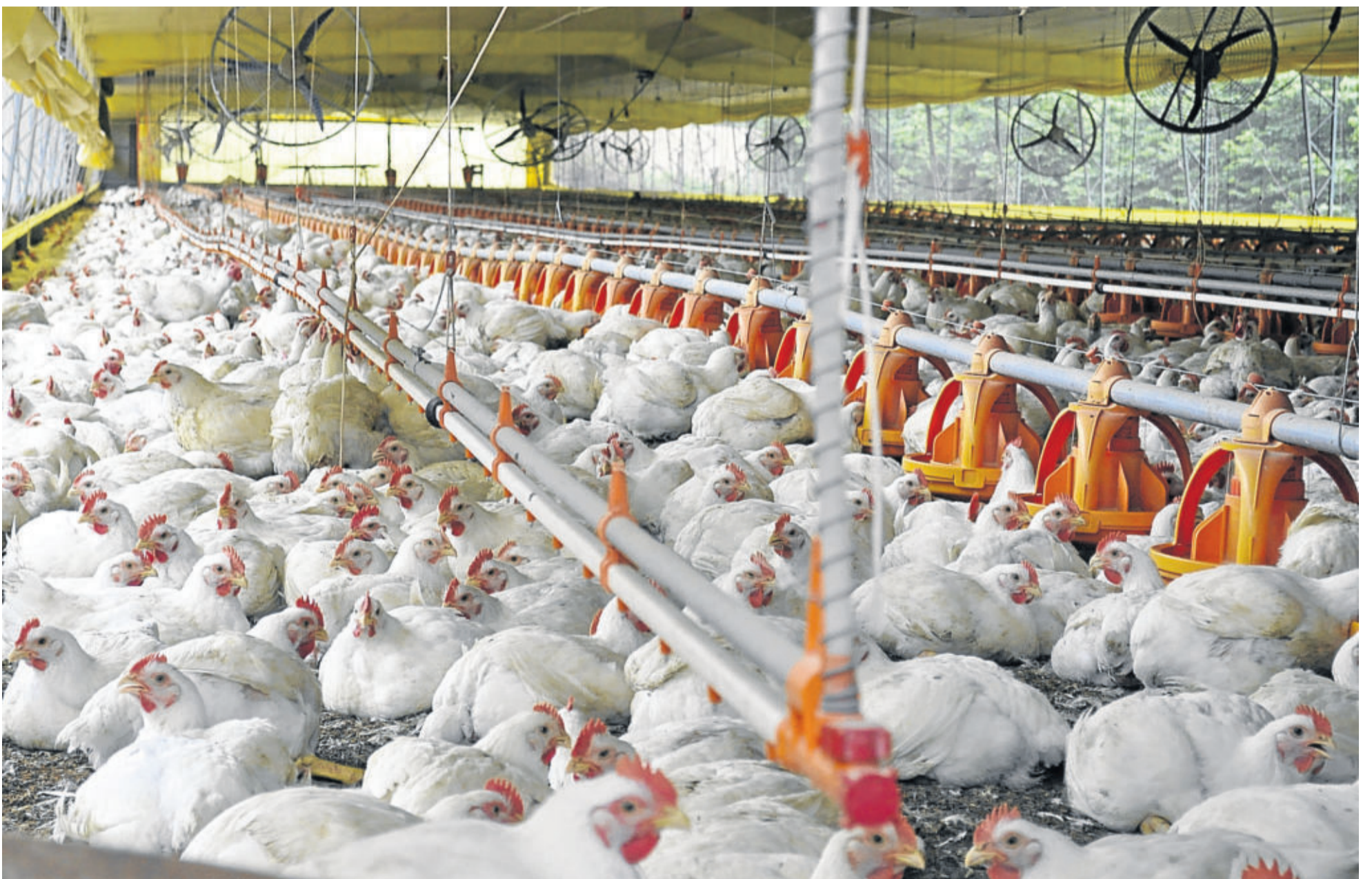
Produção de frangos de corte foi a opção de família Gutjahr