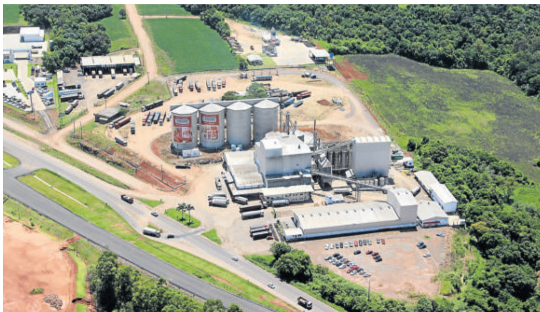
Fábrica de Rações, instalada no município de Estrela