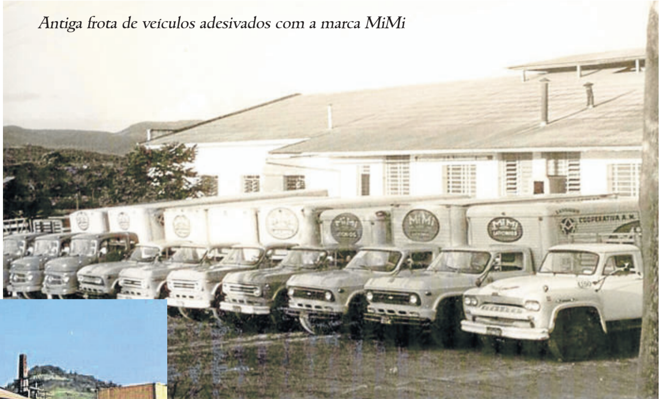
Antiga frota de veículos adesivados com a marca MiMi