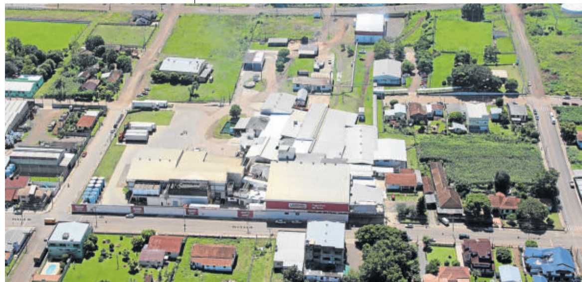
Frigorífico de Aves, instalado no município de Westfália

A importância socioeconômica da cooperativa é fato. Seu quadro social é composto por mais de 6.100 associados, cujas propriedades rurais estão localizadas em mais de 70 municípios nos Vales do Taquari, Caí, Rio Pardo e região da Serra. Suas granjas e unidades industriais, comerciais e administrativas empregam em torno de 3.000 colaboradores em 13 municípios do