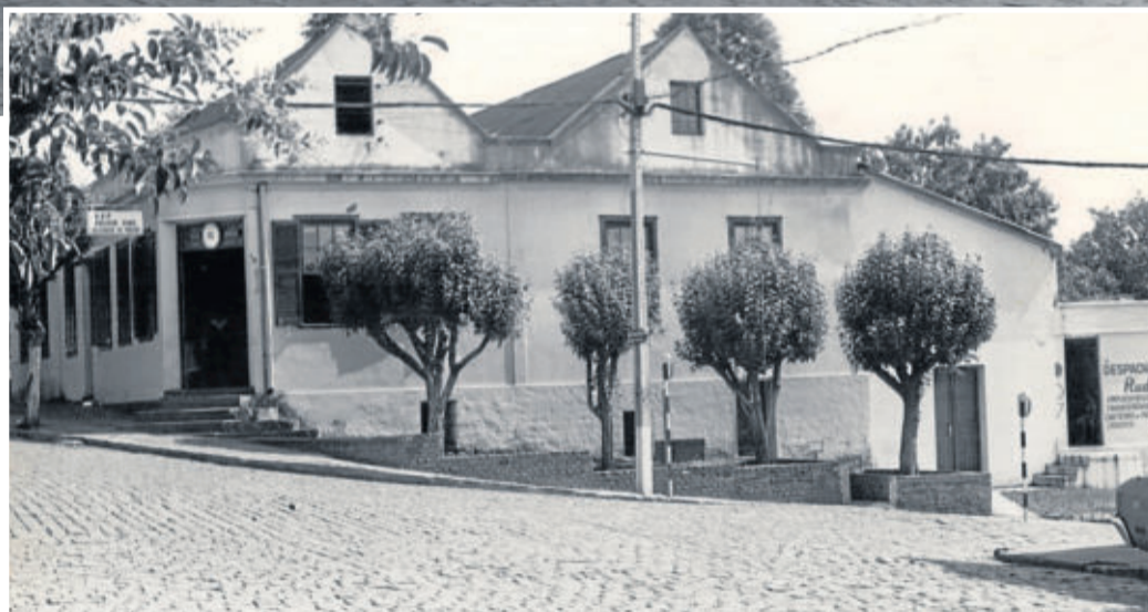
Prédio que foi a terceira sede da Languiru. Até o início da década de 70 o prédio também abrigou a Casa Comercial da Languiru. No local, hoje, está construído o Edifício Imperador, no Bairro Languiru