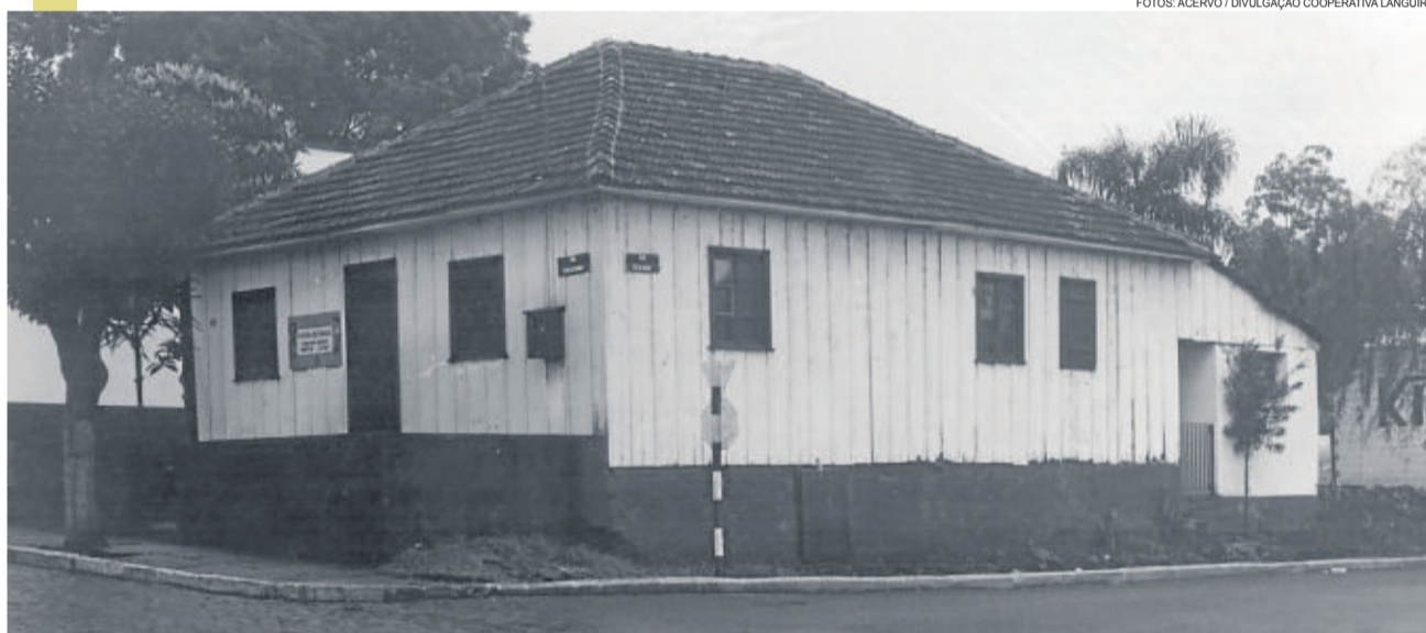
Primeira sede da Cooperativa Languiru e, no início da década de 70, primeira sede do Departamento Técnico, na esquina das ruas 25 de Julho e 03 de Outubro, no Bairro Languiru