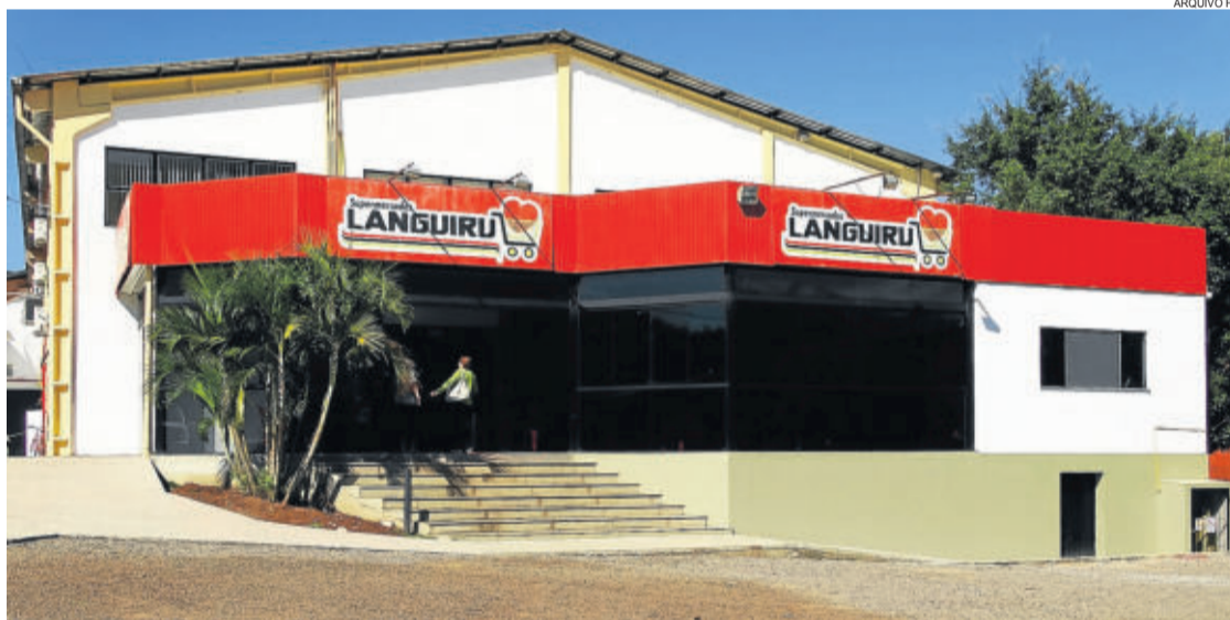
Poço das Antas sedia um dos quatro Supermercados Languiru

A cooperativa possui nove Centros de Distribuição dos produtos da marca Languiru, oito deles no Rio Grande do Sul (Cachoeirinha, Santa Cruz do Sul, Farroupilha, Ijuí, Pelotas, Passo Fundo, Santa Maria e Teutônia) e um no município de Penha, no Rio de Janeiro. Esses locais são equipados com câmaras frias para o acondicionamento de produtos refrigerados da Languiru, facilitando a reposição de mercadorias nos pontos de venda. As exportações de produtos de frango têm destino para mais de 40 países, dos cinco continentes.