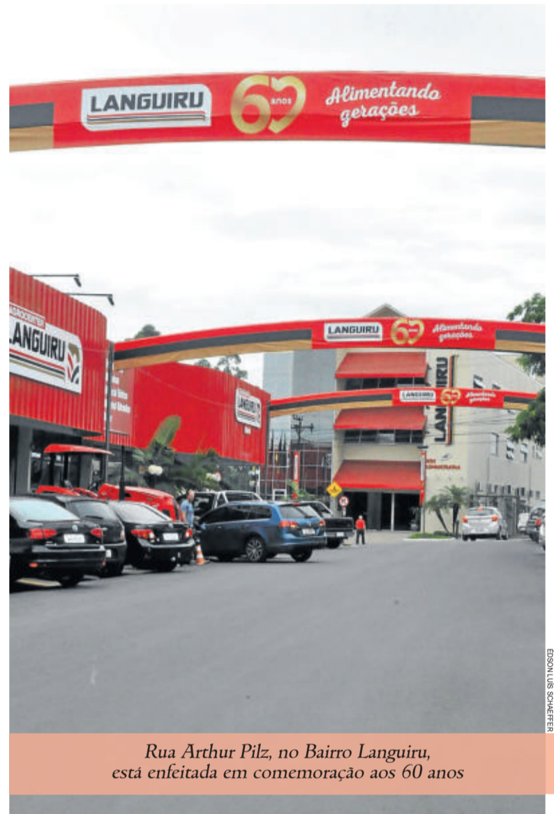
Rua Arthur Pilz, no Bairro Languiru, está enfeitada em comemoração aos 60 anos

Além da rentabilidade e do patrimônio líquido da cooperativa, a Languiru segue trabalhando pela viabilidade da pequena propriedade rural, com a aplicação de recursos e investimentos no Vale do Taquari.