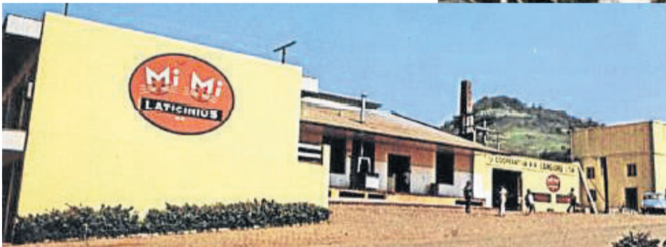
Indústria de Laticínios da Languiru construída em 1963