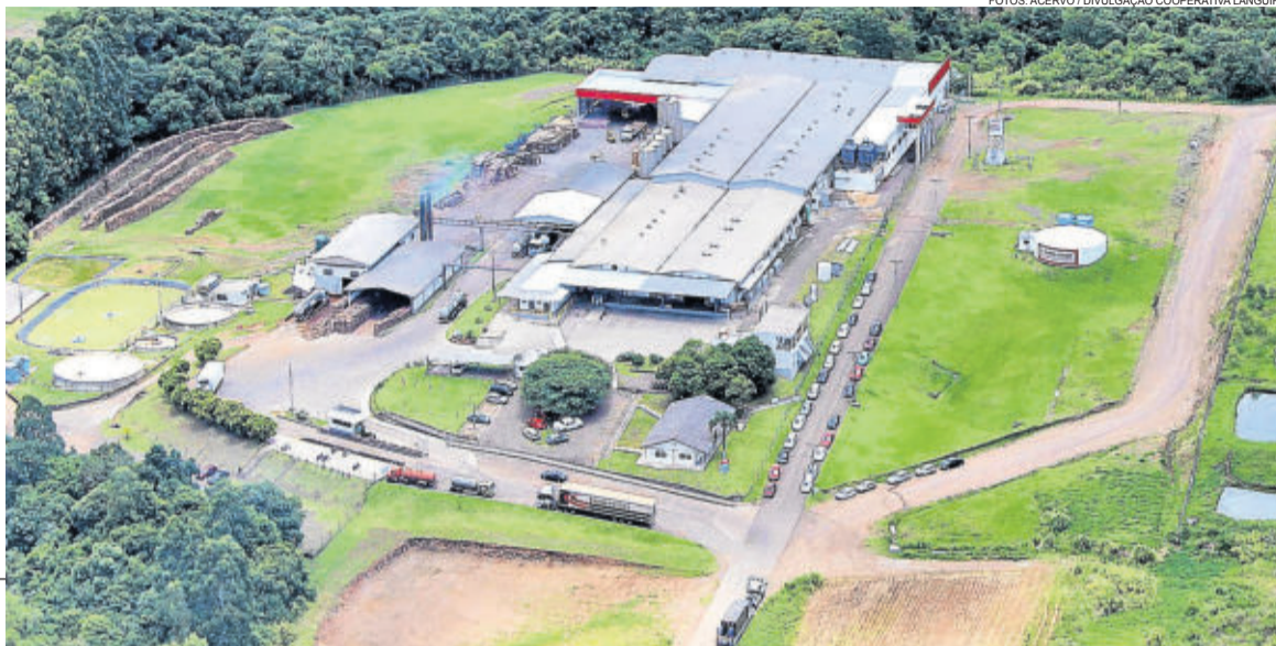
Indústria de Laticínios, instalada em Teutônia. Ao fundo, em área doada, será implantada uma queijaria

O ano de 2008 foi marcado pela volta da industrialização de embutidos no Frigorífico de Aves em Westfália. Já em 2009, ocorreram uma série de inaugurações. Projetando a expansão da suinocultura, a cooperativa inaugurou mais uma Unidade Produtora de Leitões em Bom Retiro do Sul. Com o intuito de oferecer um ambiente mais acolhedor e confortável aos clientes, a cooperativa inaugurou o novo prédio do Supermercado Languiru em Teutônia. Da mesma forma, no município de Cruzeiro do Sul foi