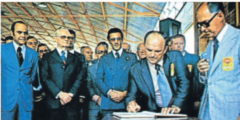
Visita do Presidente da República, Ernesto Geisel (2º da esquerda para a direita), em 13 de novembro de 1975, por ocasião das comemorações de 20 anos da Languiru

[ Quando cuidamos dos outros, todos crescemos juntos. ]