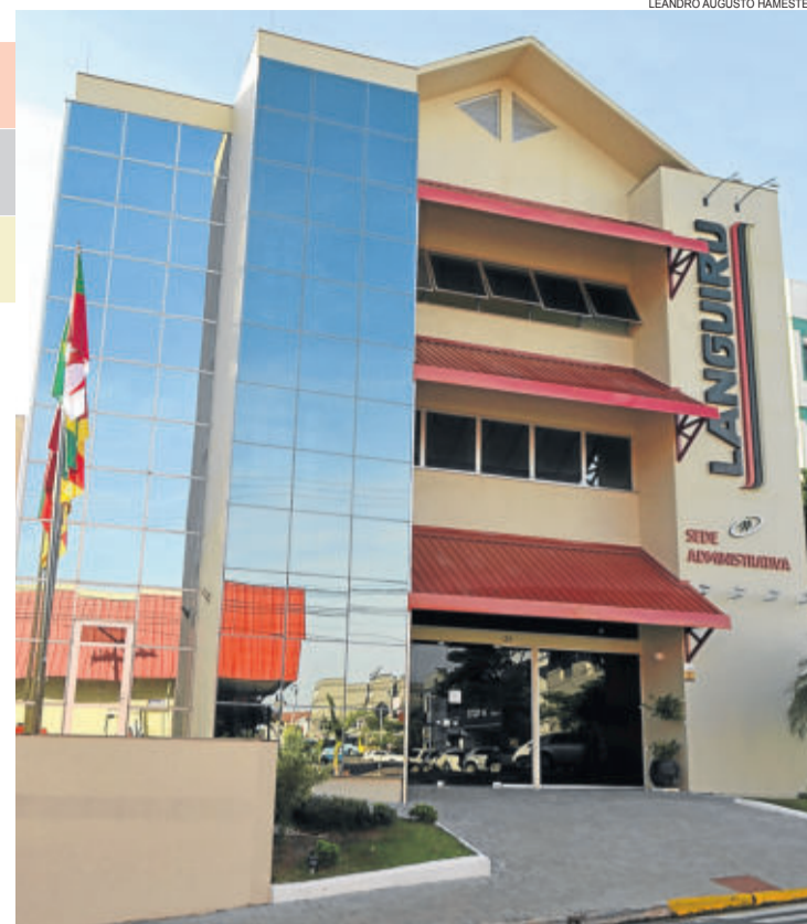
Nova Sede Administrativa da Languiru, inaugurada em abril de 2015