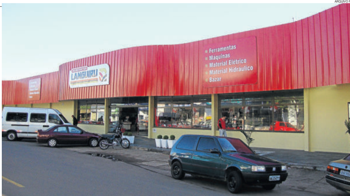
Agrocenter Languiru do Bairro Languiru foi inaugurado em 2010

fevereiro daquele ano foi inaugurado o posto de combustíveis do Bairro Languiru, município de Teutônia. Um ano depois, em fevereiro de