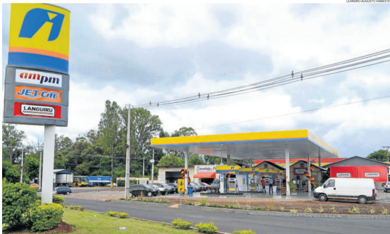
Primeiro Posto de Combustíveis Languiru, inaugurado no Bairro Languiru em fevereiro de 2014