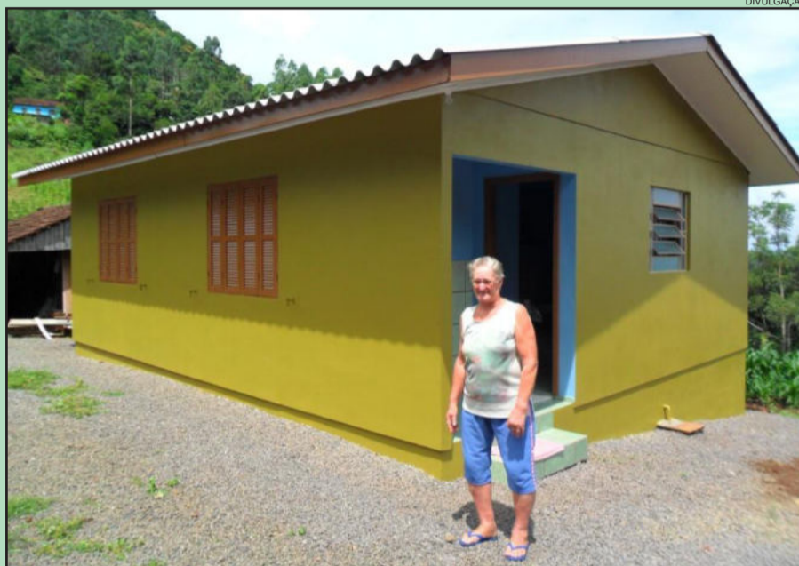
Associados de casa nova através do Programa de Habitação

cuidar do planeta é uma responsabilidade de todos e o agricultor não merece ser tratado como vilão, como único responsável pela questão ambiental e ter uma agricultura viável.