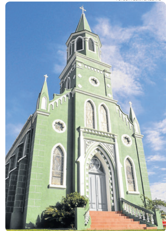
A tradição religiosa dos imigrantes é preservada nas igrejas da cidade

Em Santa Catarina encontra-se não apenas uma cidade com fortes raízes alemãs, mas a cidade mais alemã do Brasil. Pelo menos, este é o título que recebe a cidade catarinense de Pomerode. Localizada no Médio Vale do Rio Itajaí-Açú, a pequena cidade tem cerca de 28 mil habitantes, 90% descendentes de alemães, preserva e