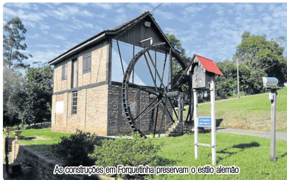
As construções em Forquethina preservam o estilo alemão

“Colono, que o trabalho de suas mãos se transforme em bênçãos a todos que receberem os alimentos que cultivas.”