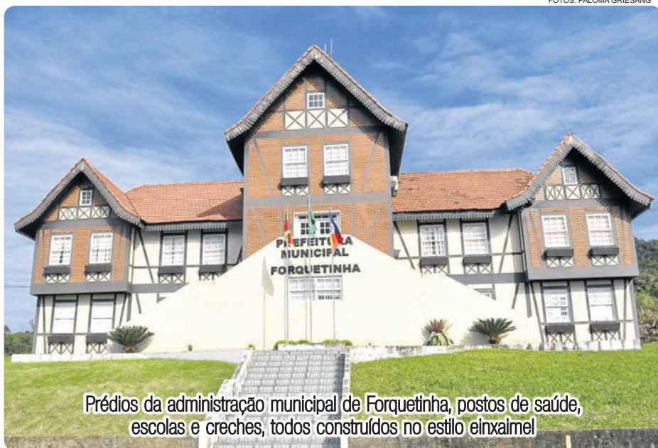
Prédios da administração municipal de Forquethina, postos de saúde, escolas e creches, todos construídos no estilo einxaimel