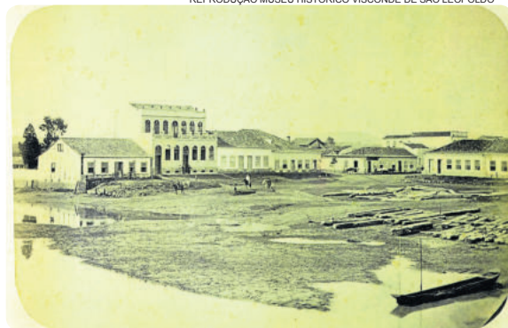
As margens do rio se espraiavam para dentro da cidade. Este local é hoje a praça do Imigrante

Os imigrantes aos poucos foram recebendo seus lotes de terras (foto não datada)