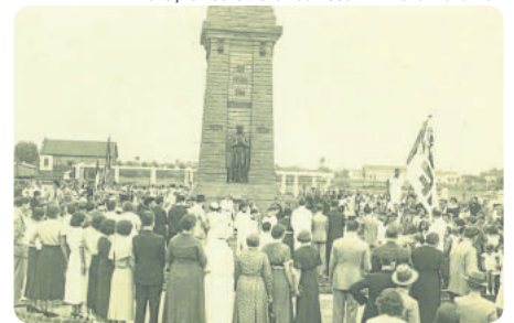
No centenário da colonização, em 1924, foi inaugurado o monumento em homenagem aos primeiros colonizadores

de julho daquele ano, desembarcaram no Porto das Telhas, cuja localização hoje não é sabível, mas que estava localizada entre a atual Praça do Imigrante (local que simboliza a chegada dos primeiros imigrantes), no Centro de São Leopoldo, e a antiga casa da Feitoria Real do Linho-Cânhamo (hoje Casa do Imigrante), no Bairro Feitoria, também em São Leopoldo.