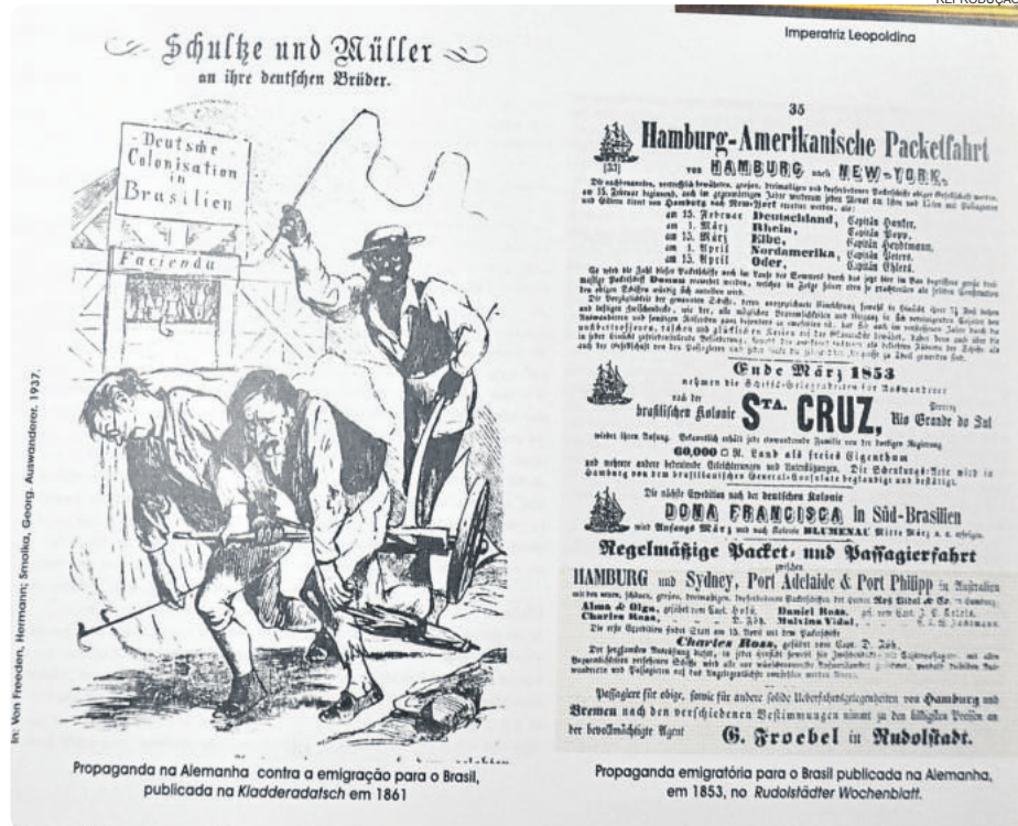
In: Von Freeden, Hermann; Smolik, Georg. Almanachzeit. 1937.

Praça e Monumento do Centenário, no início do século passado, local que simboliza a chegada dos primeiros imigrantes