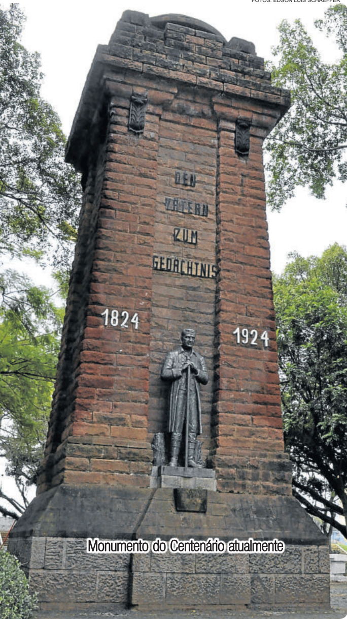
Monumento do Centenário atualmente

(Linha Germano). Entre 1868 e 1872, a colônia recebeu aproximadamente 500 famílias da região de Westfália, na Alemanha.