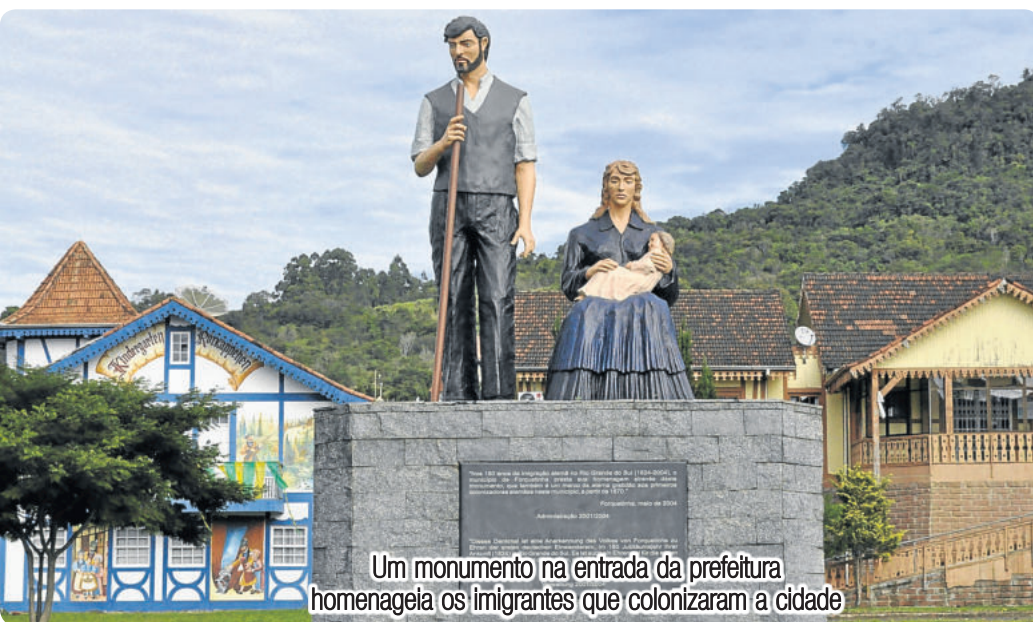
Um monumento na entrada da prefeitura homenageia os imigrantes que colonizaram a cidade

Começando pela arquitetura das casas e ruas da cidade, o município preserva e preza muito pelas construções em estilo enxaimel. A cidade possui o maior acervo de construções enxaimel fora da Alemanha: são cerca de 240 edificações. A rota tem em torno de 100 casa tombadas como patrimônio histórico em nível municipal, estadual ou federal. Chama a atenção o bom estado de conservação de casas construídas ainda no período da imigração.