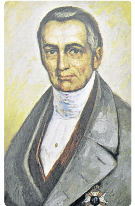
Visconde de São Leopoldo

tras, estão a queda e majoração dos preços dos cereais, invernos rigorosos, motivos econômicos e políticos. E no Brasil, o governo estava incentivando a entrada de imigrantes, para colonizar áreas como o sul do país. Na Alemanha, havia campanhas pró e contra imigração ao Brasil.