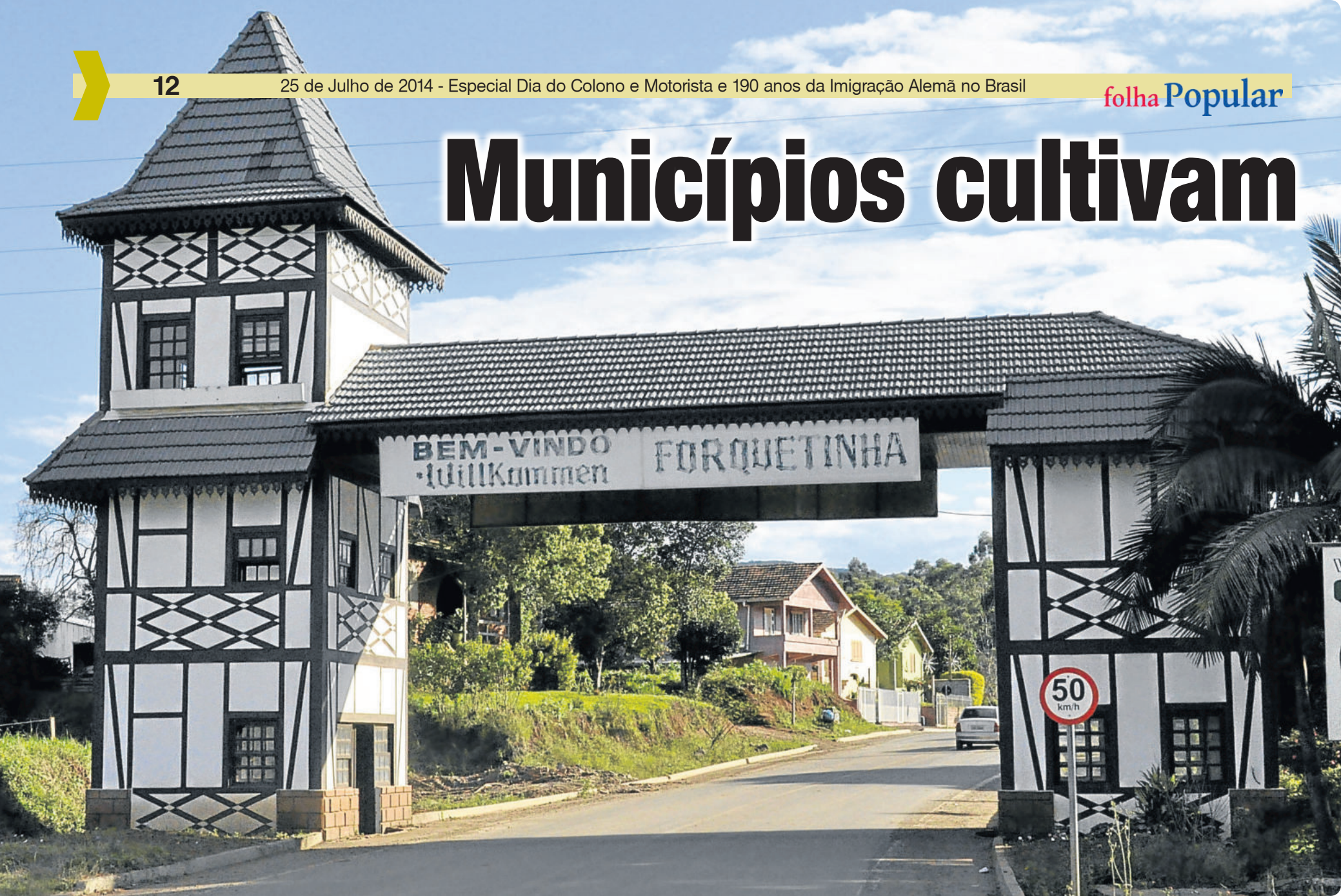
Logo na entrada de Forquethinha percebe-se a influência e deixada pelos imigrantes