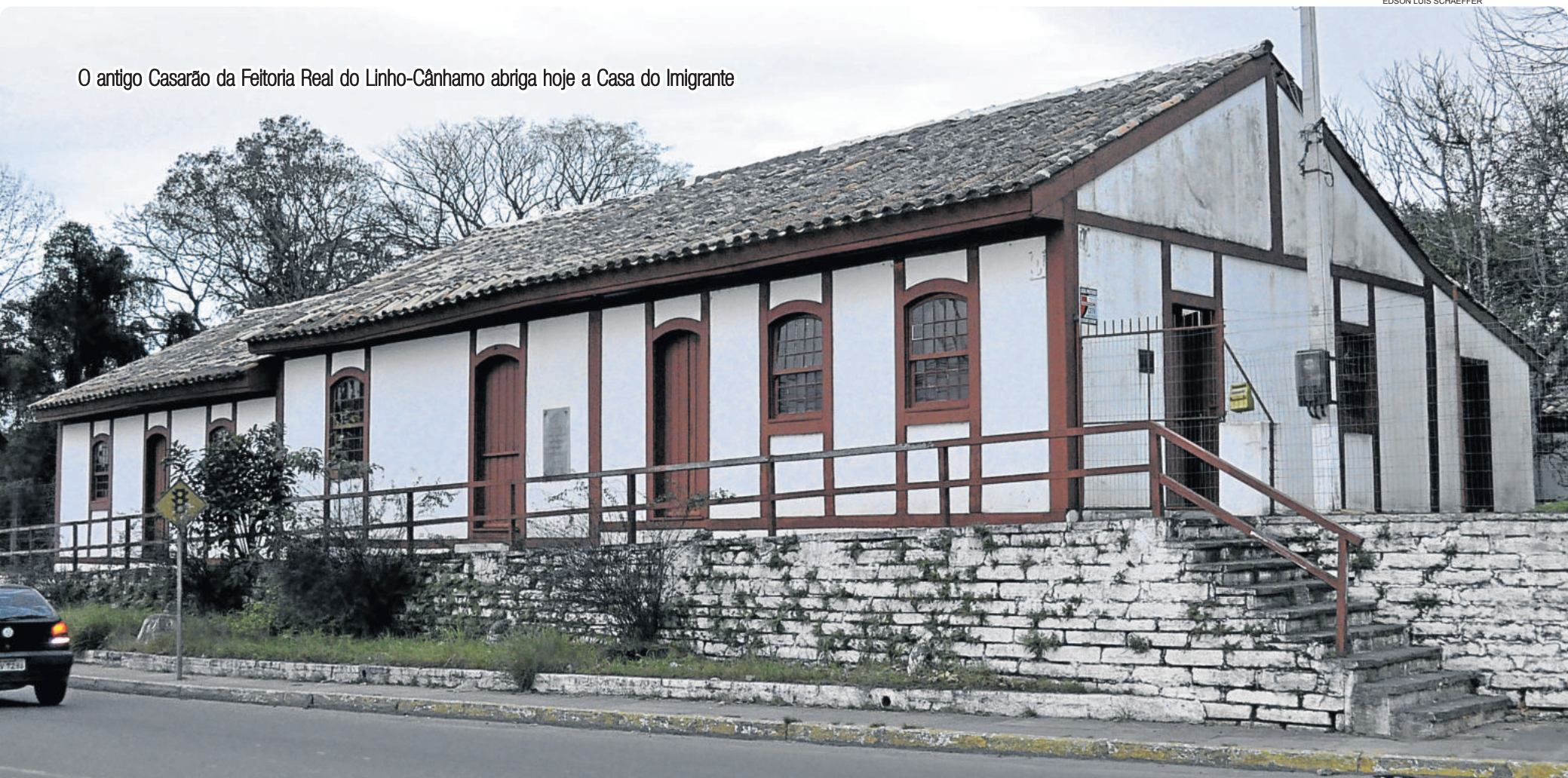
O antigo Casarão da Feitoria Real do Linho-Cânhamo abriga hoje a Casa do Imigrante