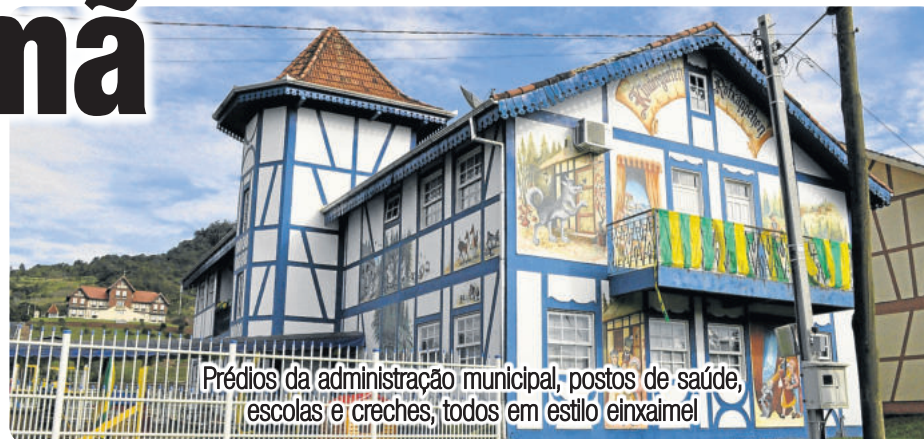
Prédios da administração municipal, postos de saúde, escolas e creches, todos em estilo einxaimel

Muitas outras cidades espalhadas pelo país receberam a contribuição da imigração alemã. A maioria encontra-se na região Sul, sobretudo no Rio Grande do Sul e em Santa Catarina, mas há também cidades de outras regiões que possuem influência da colonização germânica. Confira alguns exemplos, divididos por região e Estado.