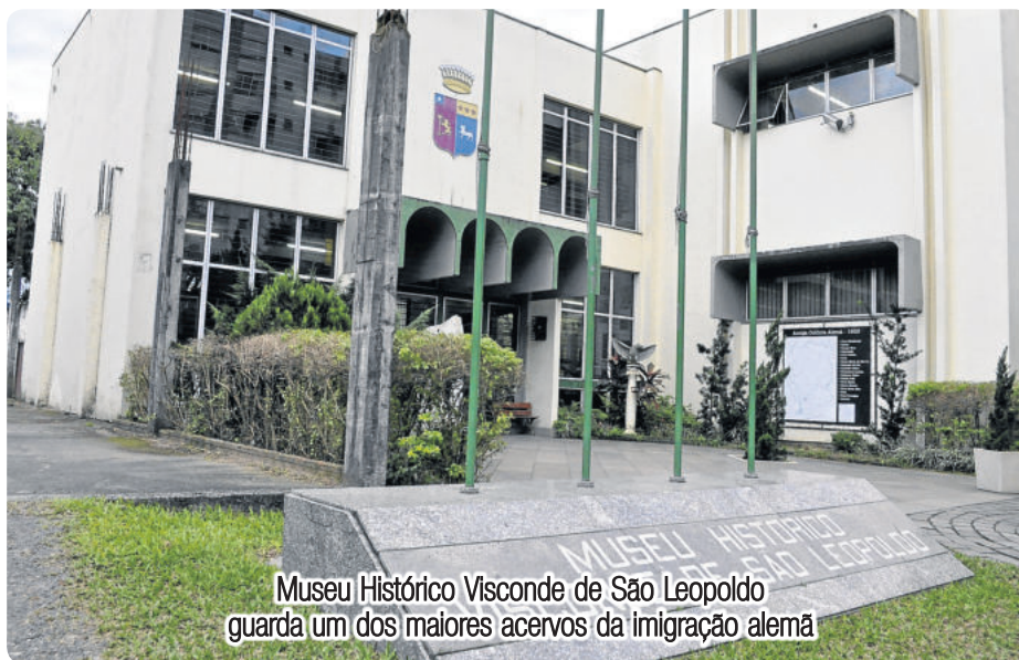
Museu Histórico Visconde de São Leopoldo guarda um dos maiores acervos da imigração alemã

A Praça do Imigrante também simboliza o local de desembarque dos primeiros imigrantes, mesmo que a localização exata seja desconhecida.