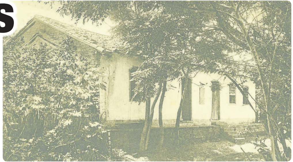
Casarão da Feitoria Real do Linho-Cânhamo, local em que foram abrigados os primeiros 39 imigrantes alemães em 1824

Após quatro meses velejando, passaram pelo Rio de Janeiro e por Porto Alegre, os 39 imigrantes, em 25