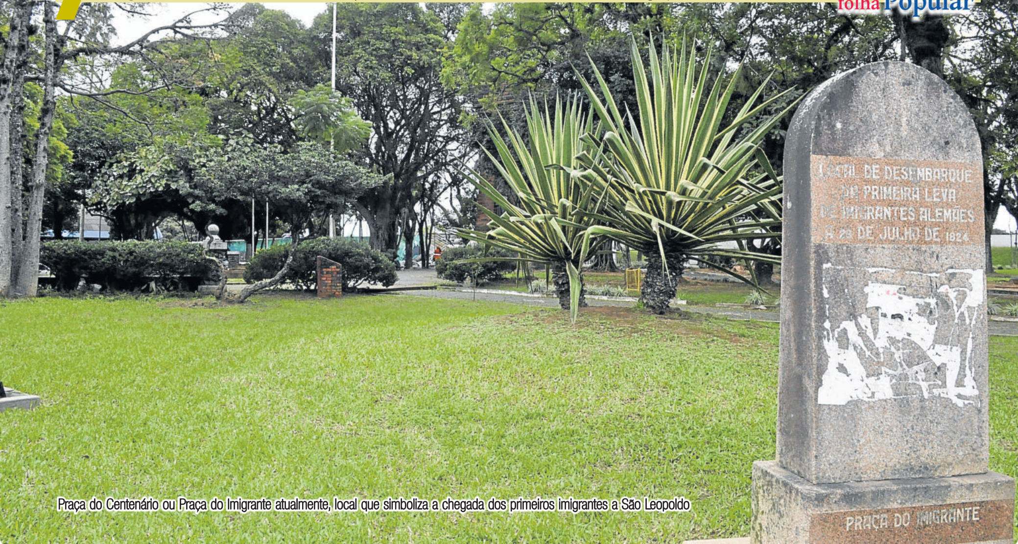
Praça do Centenário ou Praça do Imigrante atualmente, local que simboliza a chegada dos primeiros imigrantes a São Leopoldo

Teutônia, que inicialmente foi povoada com excedentes populacionais de São Leopoldo, provenientes, principalmente, da região de HunsRück. As primeiras picadas criadas foram a de Glück Auf (hoje Bairro Canabarro) e Hermann