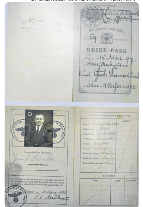
Passaportes utilizados pelos primeiros imigrantes