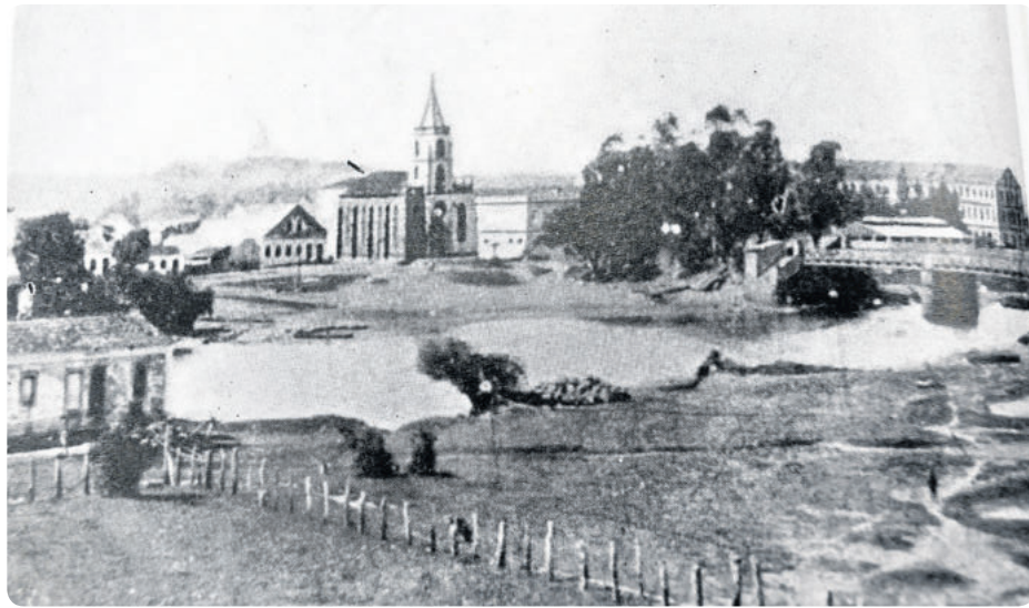
São Leopoldo antes de 1900

No ano seguinte, mais alemães chegam a São Leopoldo: 12 de fevereiro de 1825, 62 imigrantes; 9 de março, 77; 21 de maio, 112, e assim por diante. Em 29 de dezembro de 1825, já eram 903 imigrantes chegados a São Leopoldo, nos dois primeiros anos de imigração. Em 31 de dezembro de