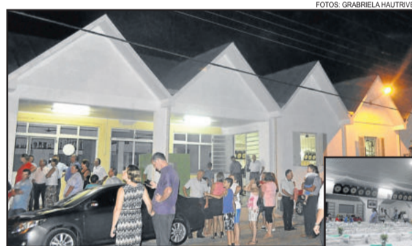
A fachada do local foi refeita

O local atualmente têm capacidade para 600 pessoas e a fachada foi reformada