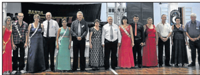
Melhores atiradores de 2015 foram coroados no início de 2016

A competição que elegeu a nova corte ocorreu no dia 4 de outubro de 2015. A forma de disputa acontece com direito a três tiros não sequenciais para cada atirador. A corte é formada pelos competidores que chegarem mais próximos ao centro do alvo, ou seja, com os melhores tiros do dia. Já os melhores atiradores são aqueles que fizeram a maior soma de pontos, contando os três tiros.