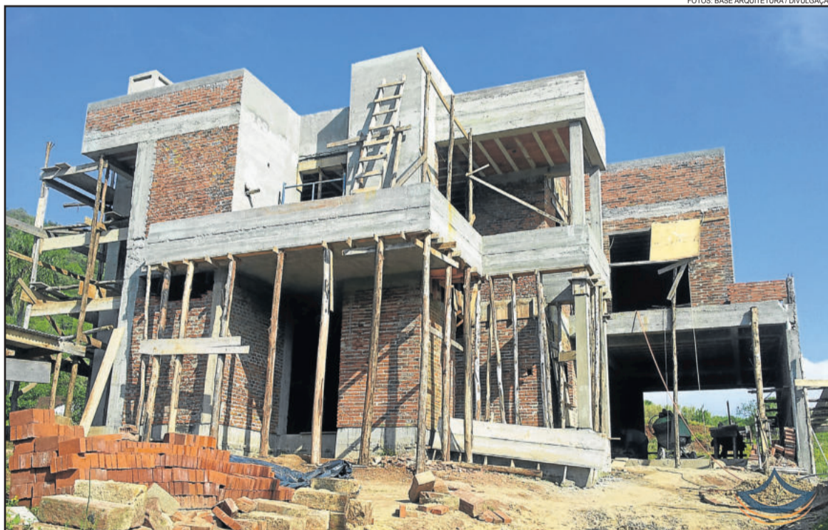
Um passo importante é saber qual dos métodos construtivos adotar na estrutura da casa