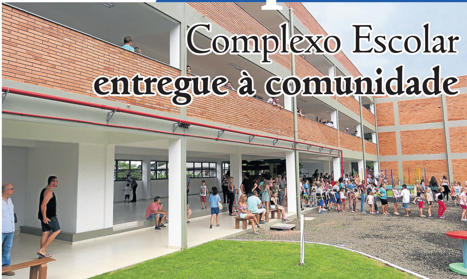
PALOMA ORIENREYER VALANDRO

Obras representaram investimento superior a R$ 2 milhões. WESTFÁLIA > 2 E 3