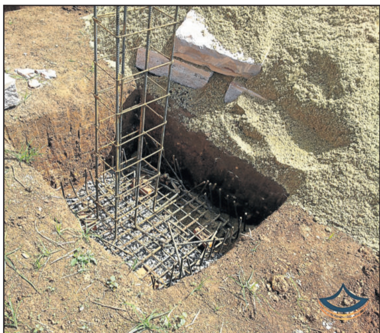
Fundações estabelecem a segurança da obra