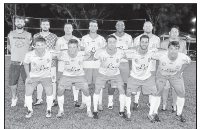
Real Madruga Futebol e Amizade perdeu e não conseguiu a classificação para a semifinal