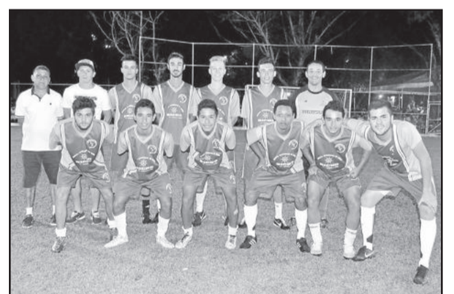
Rudibar precisa vencer o ECAS para conquistar a vaga na final do Sub-20