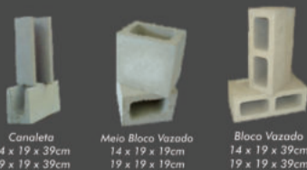
Canaleta 14 x 19 x 39cm 19 x 19 x 39cm