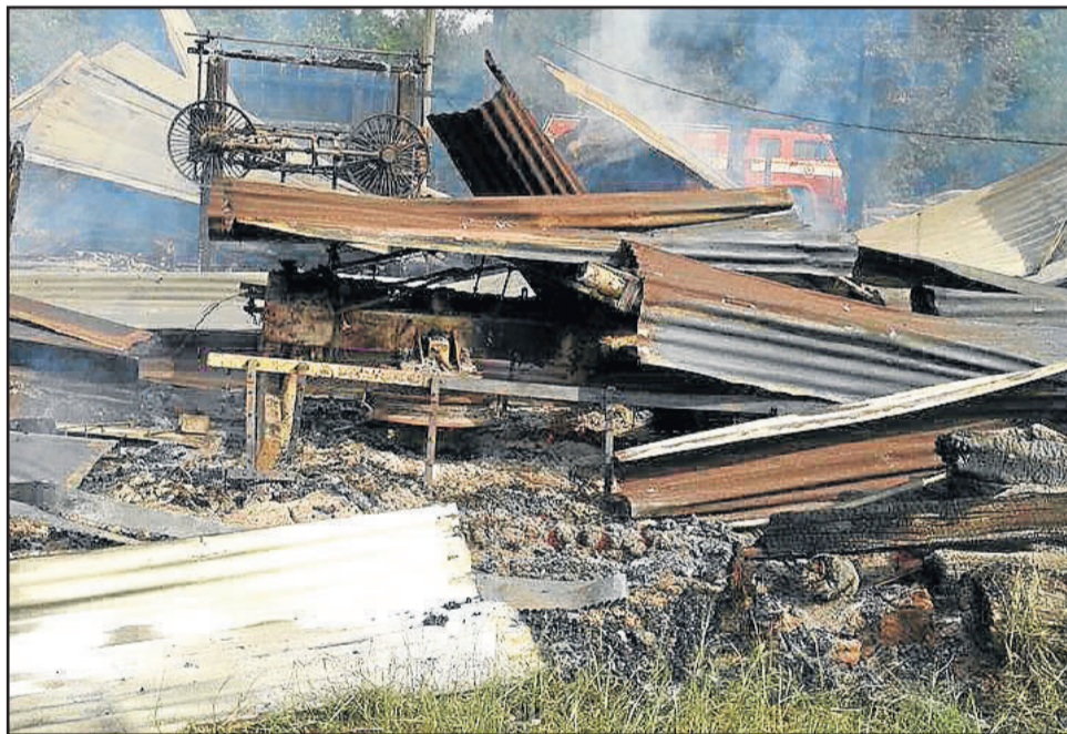
Serraria Steffens não possuía seguro e proprietários decidirão futuro da empresa

“Eu vou porque é a oportunidade de me reunir com os outros associados, conversar e participar.”