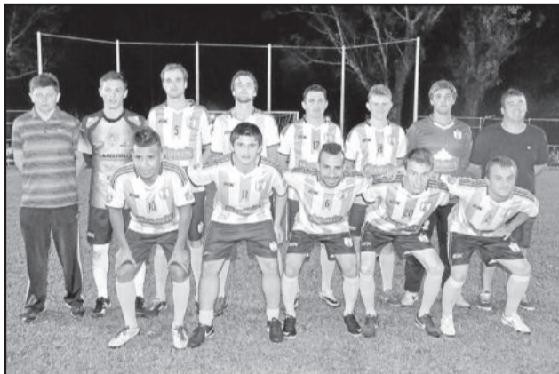
Saidera entra em campo na próxima sexta