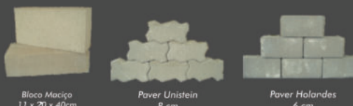
Bloco Maciço 11 x 20 x 40cm