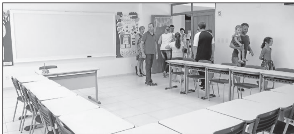
Crianças levaram os pais para conhecerem as novas salas de estudos