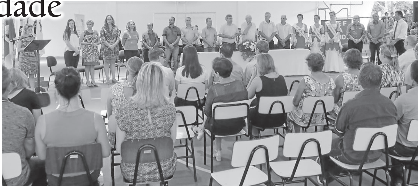
Autoridades municipais, regionais e estaduais participaram da inauguração