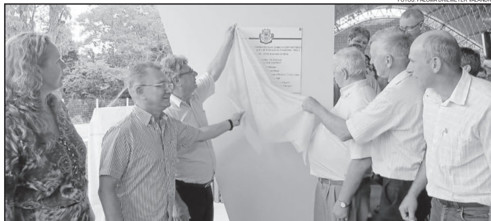
Autoridades fizeram o descerramento das placas inaugurais