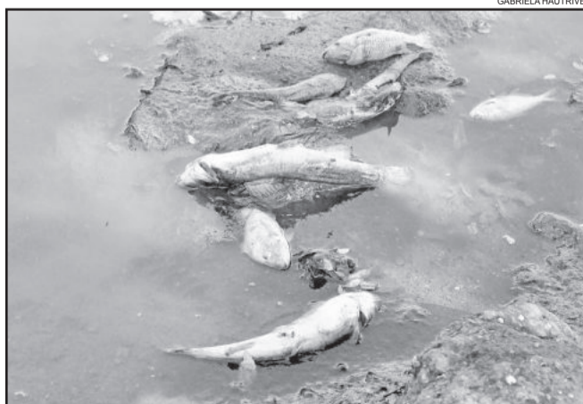
Peixes mortos dentro do arroio

A Secretaria de Agricultura e Meio Ambiente de Teutônia disse não estar por dentro do caso. A única informação que eles tinham é de que o fato havia ocorrido. Entretanto, não são responsáveis pela situação.