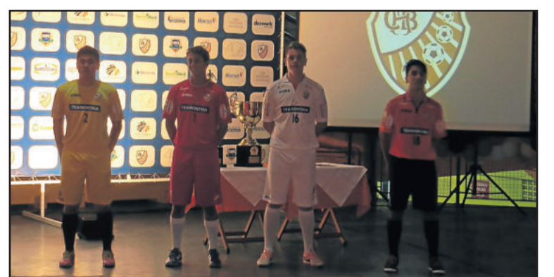
Novos fardamentos foram apresentados na noite de domingo