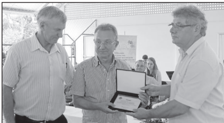
Município prestou homenagem ao deputado federal Luiz Carlos Busato pelo apoio prestado

Segundo Sieben, todas as obras são importantes para o desenvolvimento de um município. No entanto, as escolas merecem atenção especial. “Escola é fruto que colhemos ano a ano. Estou muito emocionado deste dia, que tanto aguardamos, ter chegado”, salientou o secretário, frisando que, nos últimos anos, todos os prédios escolares municipais foram restaurados e ampliados.