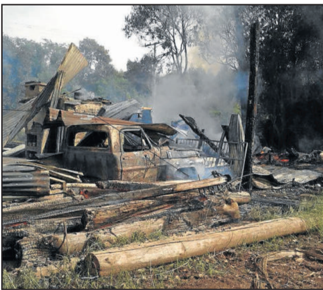
Fogo consumiu caminhões e instalações

O Corpo de Bombeiros de Estrela teve fechamento parcial na quinta-feira, dia 25, e também no sábado, dia 27, por conta dos cortes de horas extras por parte do governo estadual. Nessas duas datas foi antecipadamente noticiado que o primeiro atendimento caberia ao quartel de Lajeado, ficando Estrela no reforço nos casos de incêndio. O grupamento de Estrela contava apenas com dois homens de plantão na sede da corporação. Para a realização de atendimentos normais são necessários pelo menos quatro: um para atendimento telefônico, um motorista e outros dois para atenderem aos chamados. O tenente explicou que a realização da Operação Golfinho retira seis homens de serviço do município entre janeiro e fevereiro. A suplementação de horas extras esperadas para fevereiro não foi aprovada pelo Estado. A partir deste mês, com o retorno dos agentes da operação Golfinho, o serviço estará regularizado.