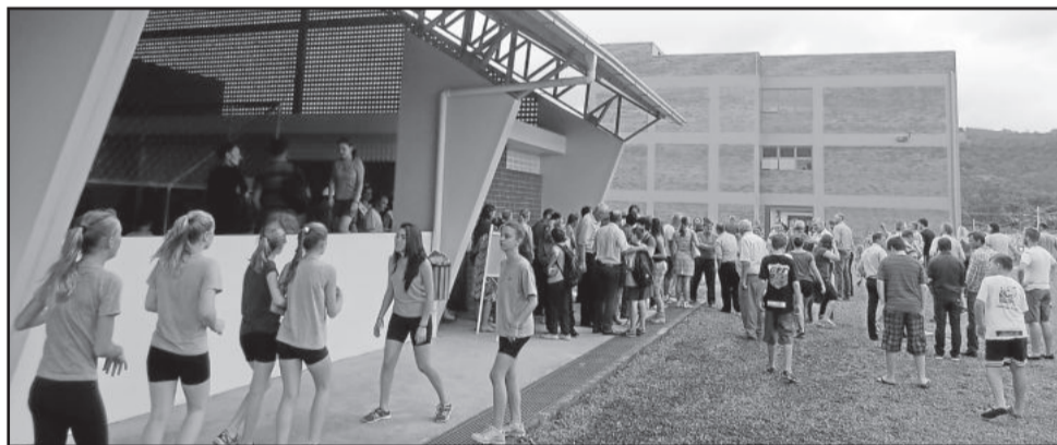
Comunidade escolar prestigiou inauguração do Complexo Escolar

Ao final dos pronunciamentos, as autoridades fizeram o descerramento das placas de inauguração da quadra esportiva e da segunda etapa do bloco escolar da EMEF Vila Schmidt.