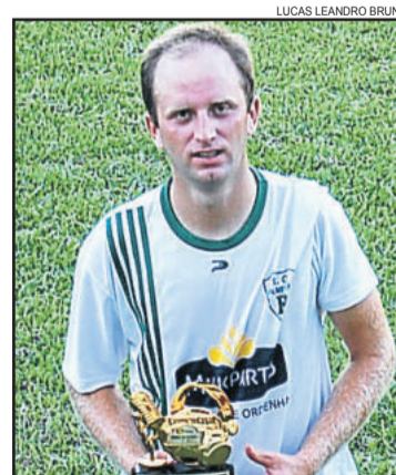
Chaveco, do Palmeiras, craque dos Titulares