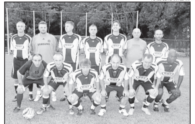
Ta'Lentos DMF perdeu, mas conquistou a classificação no Master