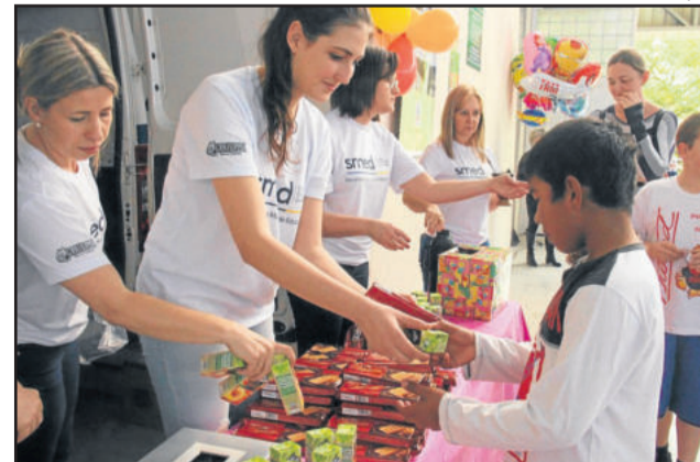
Atividades ocorreram no Ginásio Municipal de Esportes