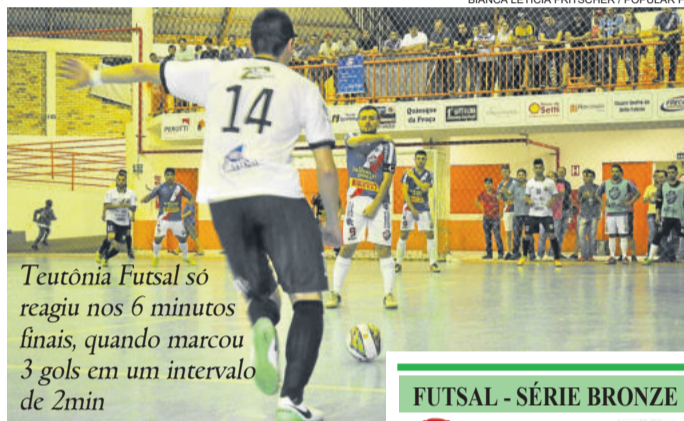
Teutônia Futsal só reagiu nos 6 minutos finais, quando marcou 3 gols em um intervalo de 2min