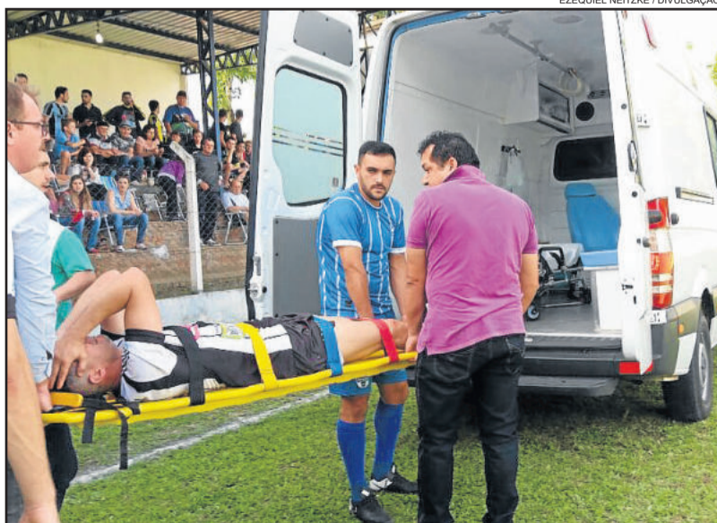
Atleta PC, do ECAS, deixou a partida na maca em Marques de Souza, com suspeita de grave lesão no Tendão de Aquiles