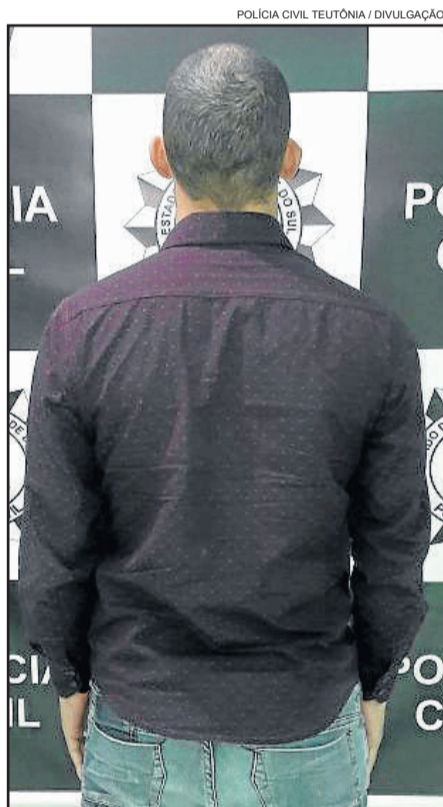
Homem se apresentou na Delegacia de Polícia na manhã desta segunda-feira (09/10)