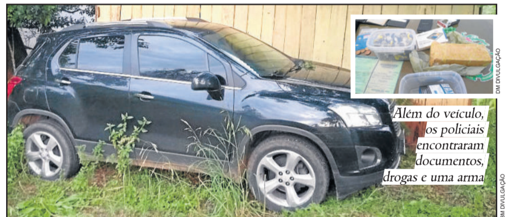
A Brigada Militar foi até uma residência na localidade de Posses e encontrou o carro no pátio de uma casa

Depois disso, o homem pegou uma arma de fogo e disparou contra o vendedor, atingindo ele com alguns disparos de arma de fogo. O vendedor teve ferimentos e foi levado para atendimento no Hospital Ouro Branco. O suposto comprador, autor dos disparos, fugiu com o veículo.