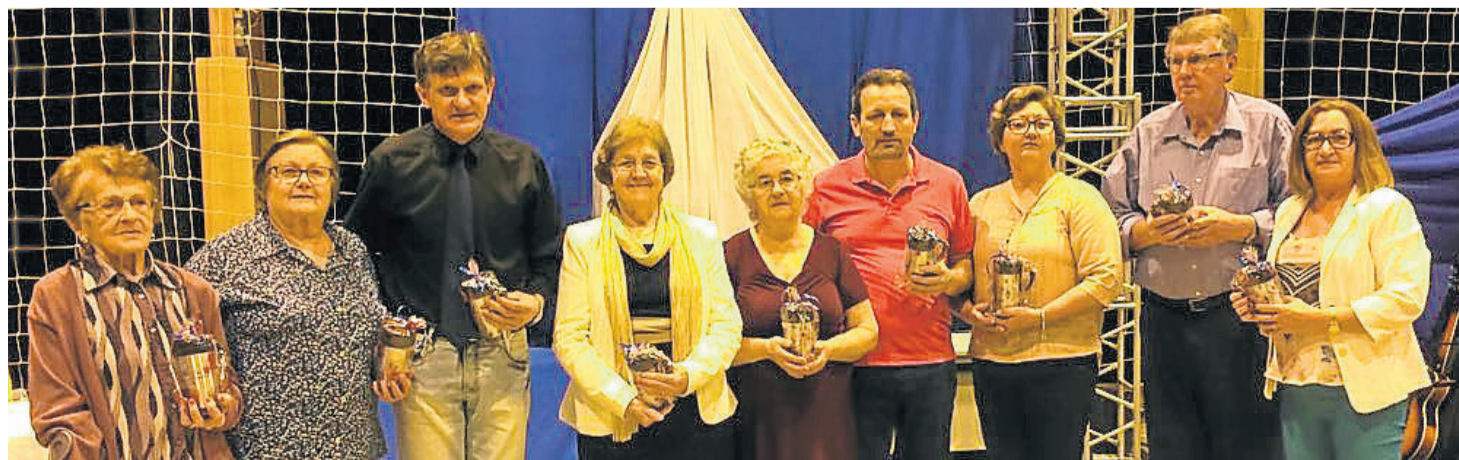
Ex-diretores foram homenageados