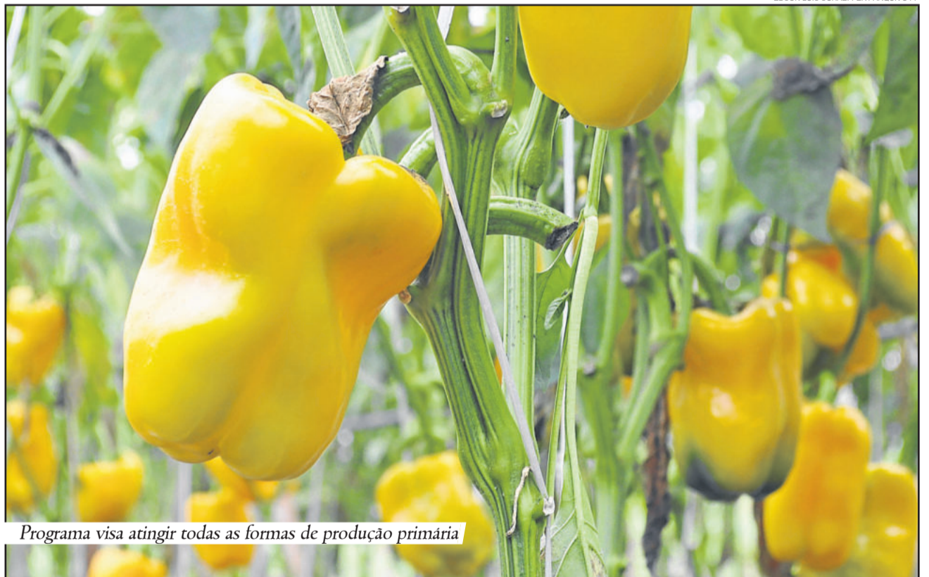
Programa visa atingir todas as formas de produção primária