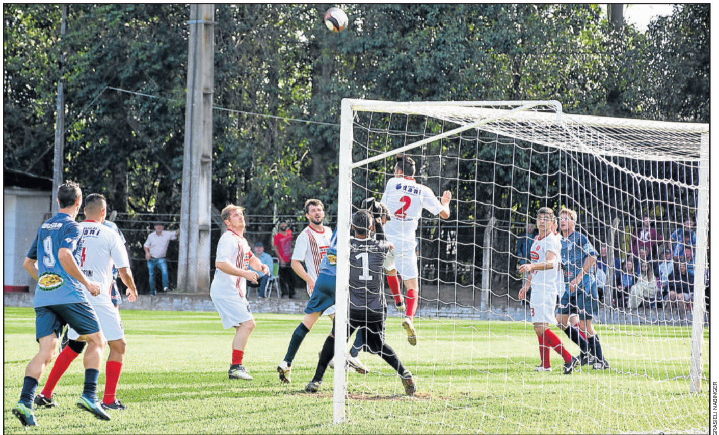
Equipe de Venâncio Aires chegou mais vezes ao ataque durante o primeiro tempo

Com esse resultado, a Assespe tem a vantagem de um novo empate para a partida de volta, em Venâncio Aires. O Gaúcho precisa vencer, ou então estará eliminado da Copa Certel Sicredi.