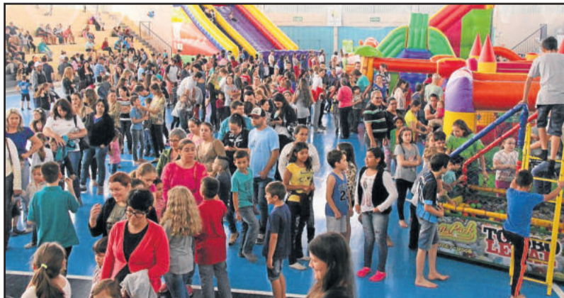
A ação alusiva ao Dia da Criança reuniu mais de mil participantes