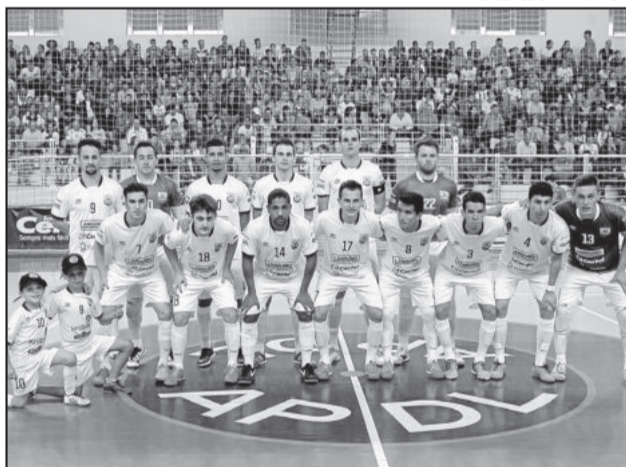
Liga Sul - Teutônia Futsal pode levar vaga na Liga Sul se ASIF perder em Carlos Barbosa, amanhã

O torneio anual envolve equipes do Rio Grande do Sul, Santa Catarina e Paraná que não jogam a Liga Nacional de Futsal e são da elite de seus estados. A ALAF já participou de edições do torneio e foi campeã da Liga Sul em 2014, no dia 8 de novembro. O campeão da Liga Sul garante vaga para disputar a Super Liga, envolvendo campeões de todas as regiões do país.