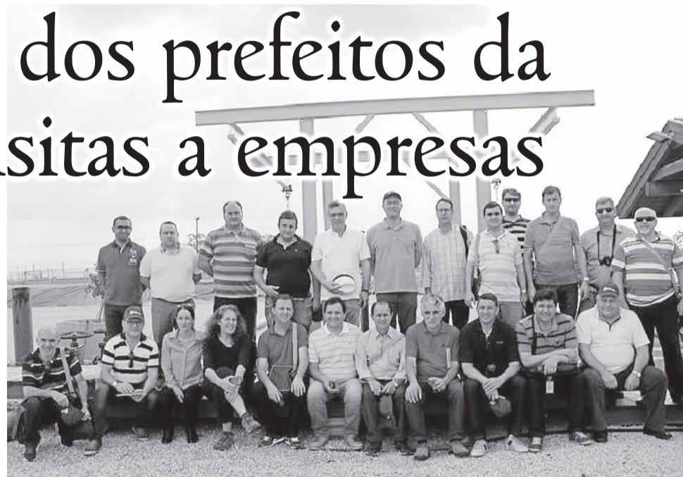
Prefeitos da Serra estão em missão técnica a Israel

Finalizando a programação do primeiro dia, o grupo esteve na Odis Filtering, empresa fundada em 1987, e que faz parte do Odis Group. A Odis produz tecnologias, equipamentos e sistemas que são exportados para 50 países e visam levar