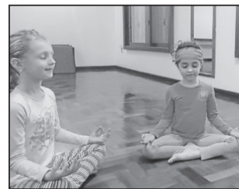
Meninas meditando no CYTT