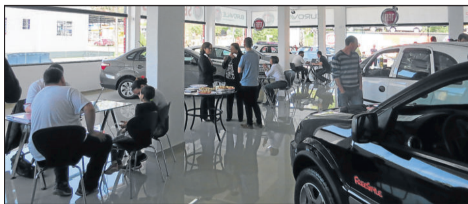
Público conferiu nova loja e aproveitou para buscar negócios

VALE DO TAQUARI &gt; PARCERIA CIC, SEBRAE E BRDE