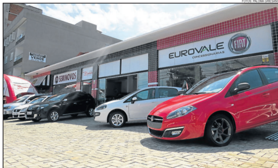
Loja é nova opção em Teutônia