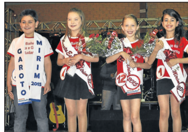
Os vencedores nas categorias Garota e Garoto Estudantil Mirim