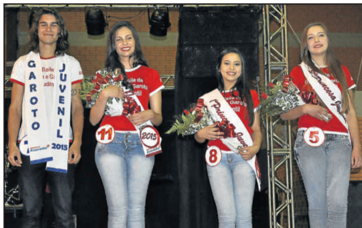
Ganhadores nas categorias Garota e Garoto Estudantil Juvenil

Depois do desfile, a comunidade escolar festejou ao som da Banda Arte Livre. A promoção foi dos formandos do 3º Ano do Ensino Médio e do Círculo de Pais e Mestres do educandário, que aproveitaram para agradecer a todos que fizeram da festa um sucesso em mais uma edição.