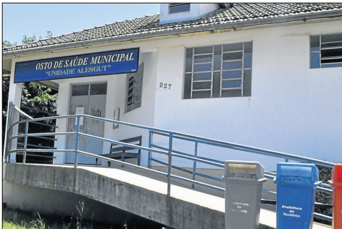
Posto de Saúde do Bairro Alesgut

resultam em insegurança das pessoas, principalmente idosos e crianças.