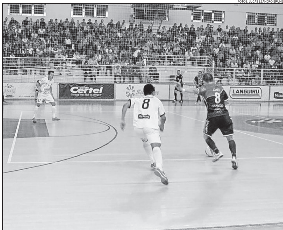
Cerca 2 mil torcedores compareceram ao jogo, mas Teutônia não conseguiu confirmar a classificação