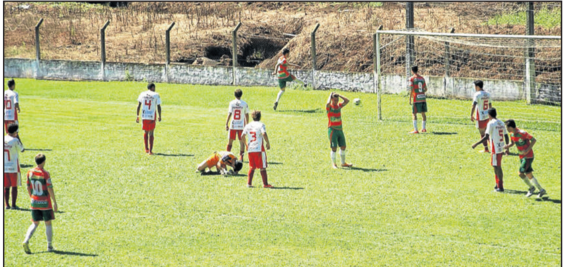
No domingo, pela Copa dos Vales, Juvenil da Juventus venceu o Guarany de Bagé