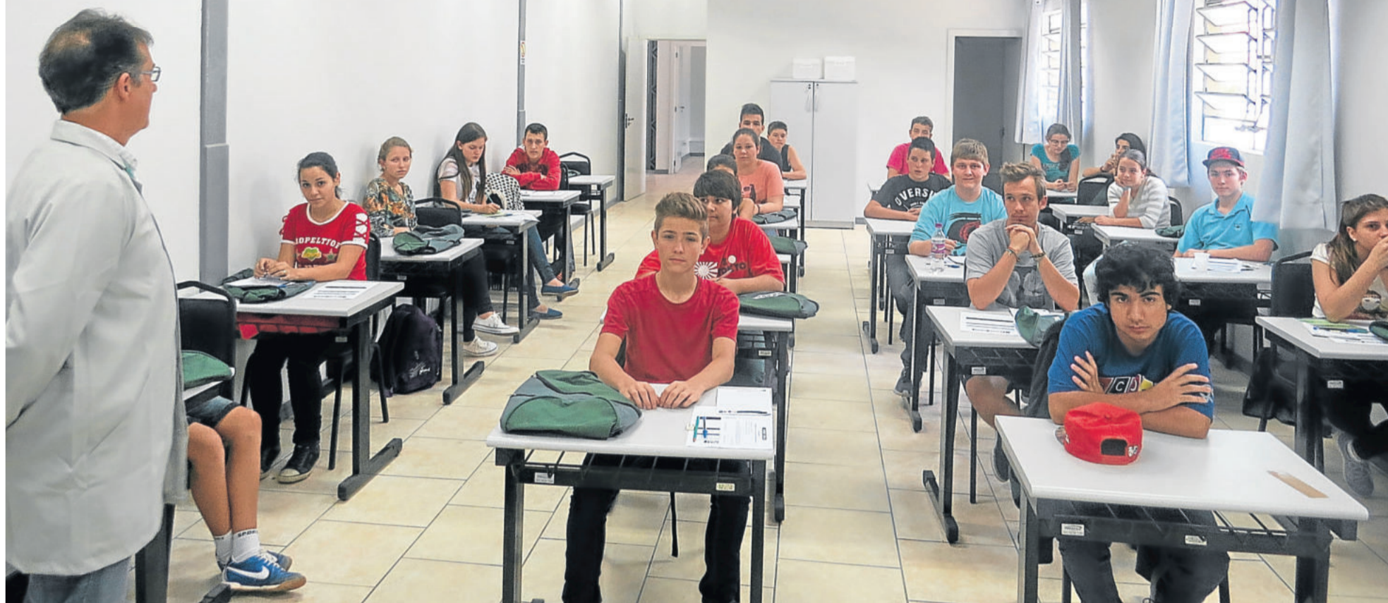
O projeto é uma parceria da Administração Municipal, CIC, Senai e empresas apoiadoras. Aulas iniciaram na terça-feira passada. TEUTÔNIA > 5