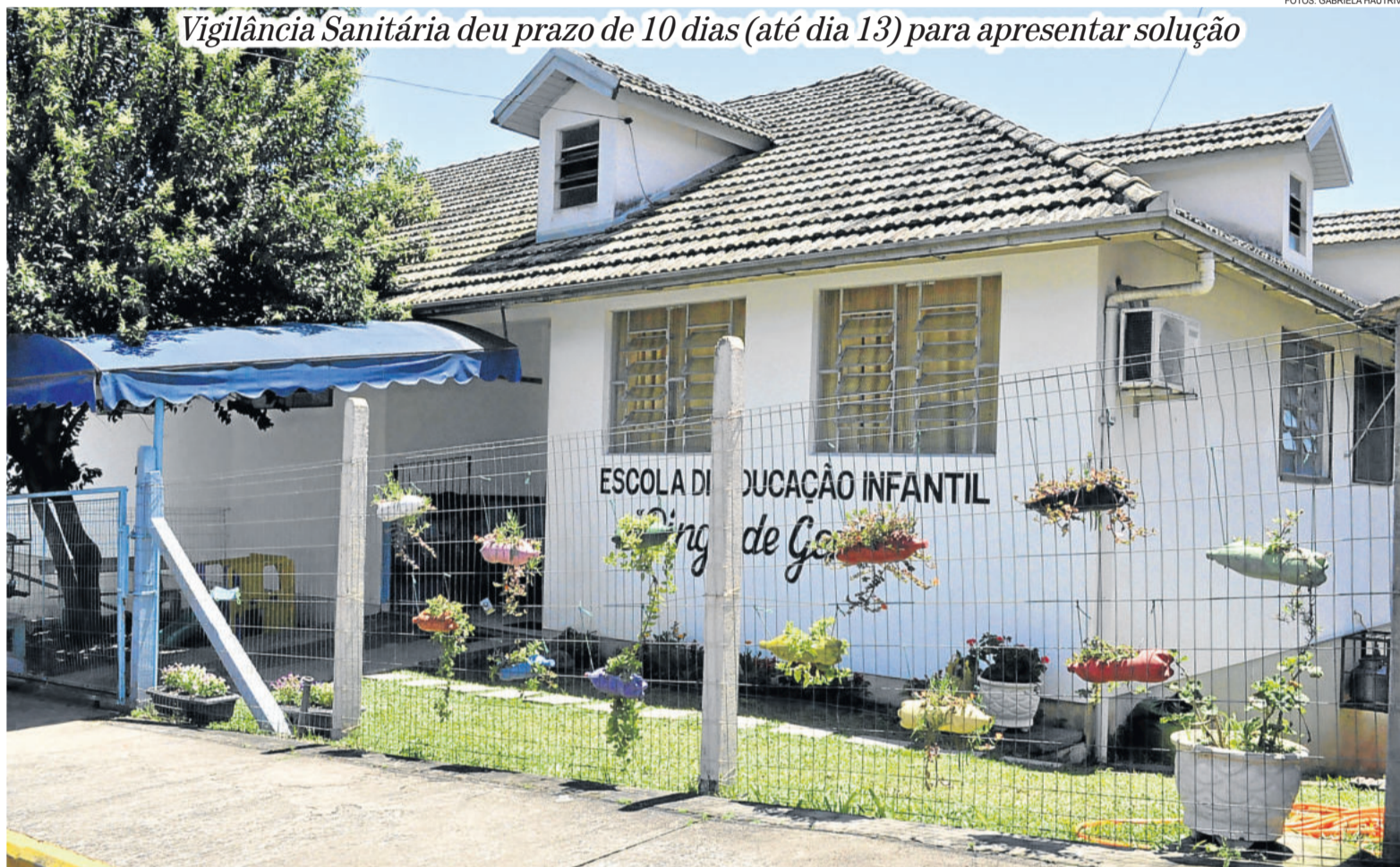
Escola de Educação Infantil Pingo de Gente

Entre as irregularidades, segundo Cardoso, existem diversos problemas no prédio, como: infiltrações no telhado e nas paredes, o que gera muita umidade e falhas na rede elétrica, causando risco de curto