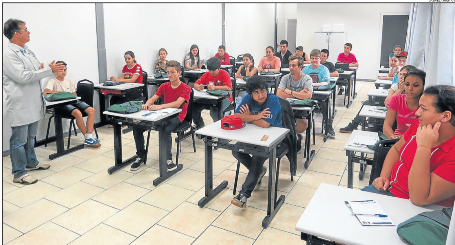
Aulas iniciaram na semana passada para 50 adolescentes do Jovem Aprendiz

A Escola Técnica do Senai também teve a parceria da Câmara de Indústria, Comércio e Serviços (CIC) Teutônia, e das empresas Couros Bom Retiro, Grupo Krabbe, Elebat (ex-BRF), Cooperativa Languiru e Calçados Beira Rio.