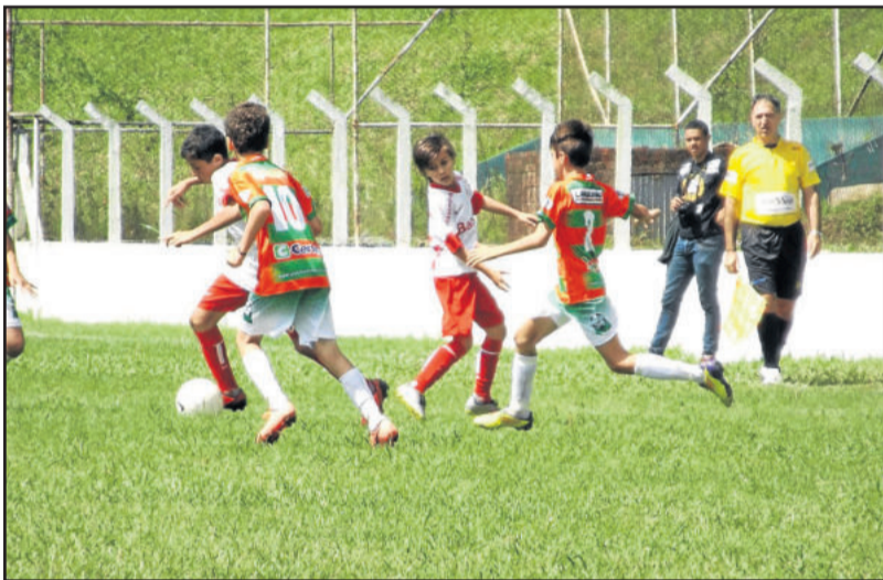
Diante do Inter, categoria 2004 da Juventus perdeu o primeiro jogo por 3 a 0