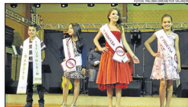
Corte Mirim também repassou os títulos