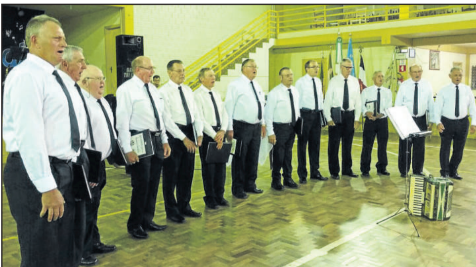
Coro de Homens Frosing de Boa Vista realizou seu encontro de corais em 25 de novembro, em Boa Vista, Teutônia