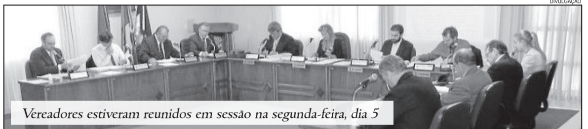
Vereadores estiveram reunidos em sessão na segunda-feira, dia 5

apresentado, que norma como Indicação de Projeto de Lei, o proponente terá o prazo de cinco minutos para falar acerca da proposta, e os demais edis podem discuti-la por três minutos. O que difere dos projetos de lei é que nestes não haverá votação, por tratar-se de um projeto que está sendo indicado ao Prefeito, que, por sua vez, precisa analisar a proposta e verificar a viabilidade de implantação. O Projeto de Resolução ficará em análise dos vereadores até que os proponentes entendam pela apreciação da matéria.