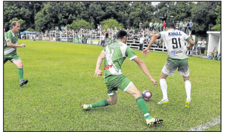
São Cristóvão terá que vencer no tempo normal para levar às penalidades

A mobilização do time "Santo" de Lajeado é intensa, com treinamentos nas terças e quintas com o objetivo de chegar ao segundo título regional. O clube deve voltar a se concentrar na véspera do jogo para manter o grupo totalmente focado, assistindo o vídeo da primeira partida, com ênfase nos erros e acertos. Presente em outras quatro finais, o São Cristóvão levantou a taça uma única vez, em 1995, e de forma invicta. Nos outros três anos, foi vice-campeão. Por isso, o atual grupo quer quebrar a sina de vices.