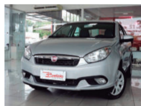
Fiat Grand Siena Attractive 1.4 Flex 2015 Prata, 4 portas, IVU-5271

De: R$ 41.900,00 Por: R$ 37.900,00 COMPLETO