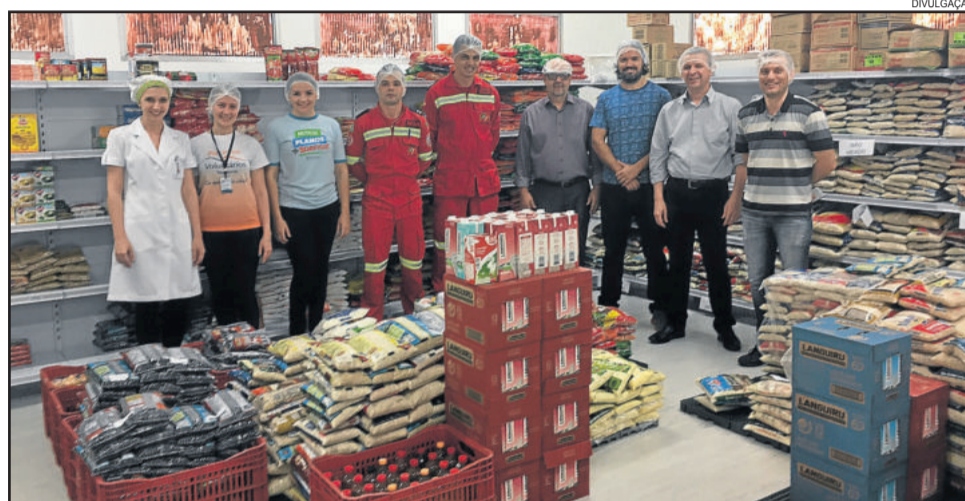
Parceria do Grupo Popular, Bombeiros, Hospital, Sicredi, Languiru e Diersmann garantiu doações para as entidades