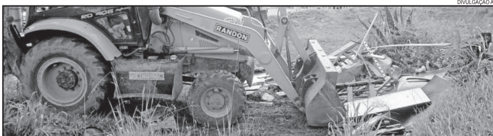
Mutirão terá início na próxima semana

O planejamento poderá sofrer alterações em virtude do mau tempo.