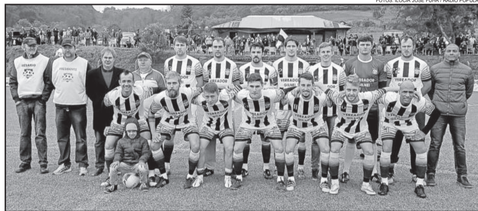
ECAS, de Imigrante, é o atual campeão da Taça da Amizade