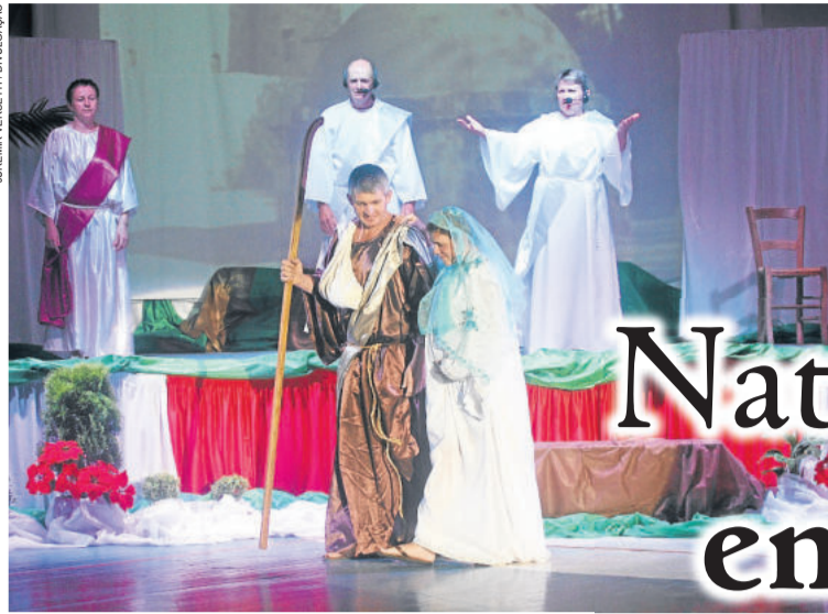
Encenação sobre o nascimento de Jesus deve reunir 180 atores