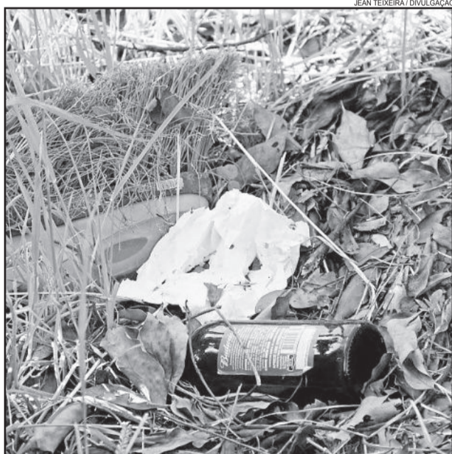
Ação da sexta-feira passada recolheu materiais que podem ser criadouros do mosquito

A Prefeitura de Garibaldi, através das secretarias municipais da Saúde e de Educação, realizou na sexta-feira passada, dia 2, uma ação especial para o Dia Nacional de Mobilização contra o mosquito Aedes Aegypti, lembrado nesta data, em todo o País. Os agentes de Controle da Dengue, coordenaram, neste dia, a visitação nos domicílios para orientação quanto aos possíveis criadouros, multiplicando, com isso, as informações sobre os cuidados que devem ser tomados. As escolas municipais e unidades básicas de saúde realizaram atividades de vistoria nos arredores de suas repartições para eliminação de possíveis focos.