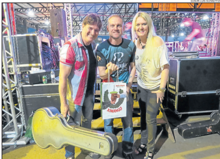
Erva-mate Ximango disponibilizou água quente e erva para o chimarrão das famílias