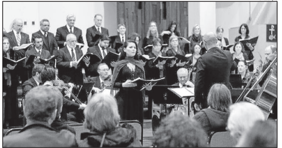
Grupo Cantabile se apresentará em Teutônia

O evento é gratuito, aberto à toda a comunidade teutoniense e regional.