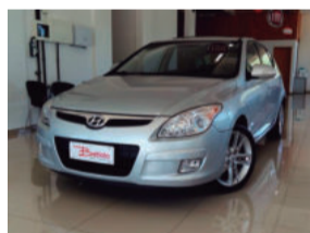
Hyundai i30 2.0 MPI 16V 2010 Prata, 4 portas, Automático, Gasolina, IPY-4972