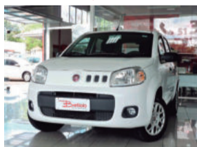
Fiat Uno Vivace 1.0 8V Flex 2014 Branco, 4 portas, 45.000Km, IWV-5125

De: R$ 29.900,00 Por: R$ 28.900,00 COMPLETO