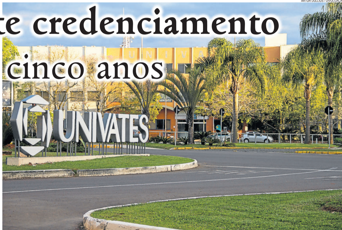
Univates recebeu nota 4 em uma escala de 1 a 5

que é ser uma instituição de ensino, com produção e disseminação de conhecimento científico. Fomos muito bem avaliados, o que nos dá fôlego e ânimo para novos desafios”, sinaliza Júlia. Conforme a pró-reitora, o resultado também evidencia o cuidado no planejamento pedagógico institucional. “Recebemos conceito de excelência em nosso projeto pedagógico, o que se revela nas nossas avaliações de curso. A qualidade do ensino, das práticas pedagógicas, a participação da comunidade acadêmica na avaliação da instituição também foram pontos que se sobressaíram na avaliação in loco .