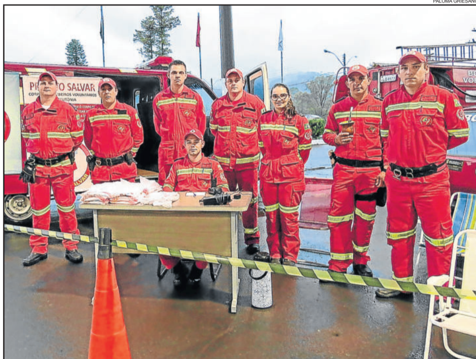
Bombeiros Voluntários estiveram presente e prestigiaram o evento