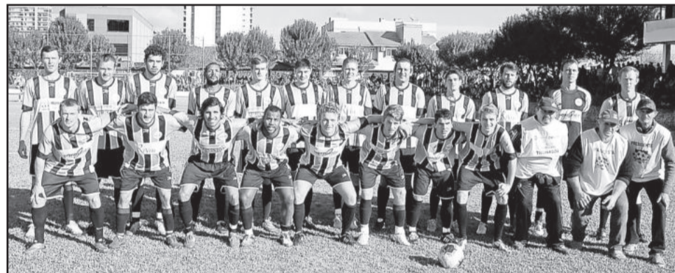
Catarinense é o atual campeão do Municipal de Teutônia

para você encontrar lideranças que se colocam a disposição está cada vez mais difícil, então por que a gente vai montar uma fórmula onde lá na frente você pode se incomodar?”, ressaltou Diedrich.