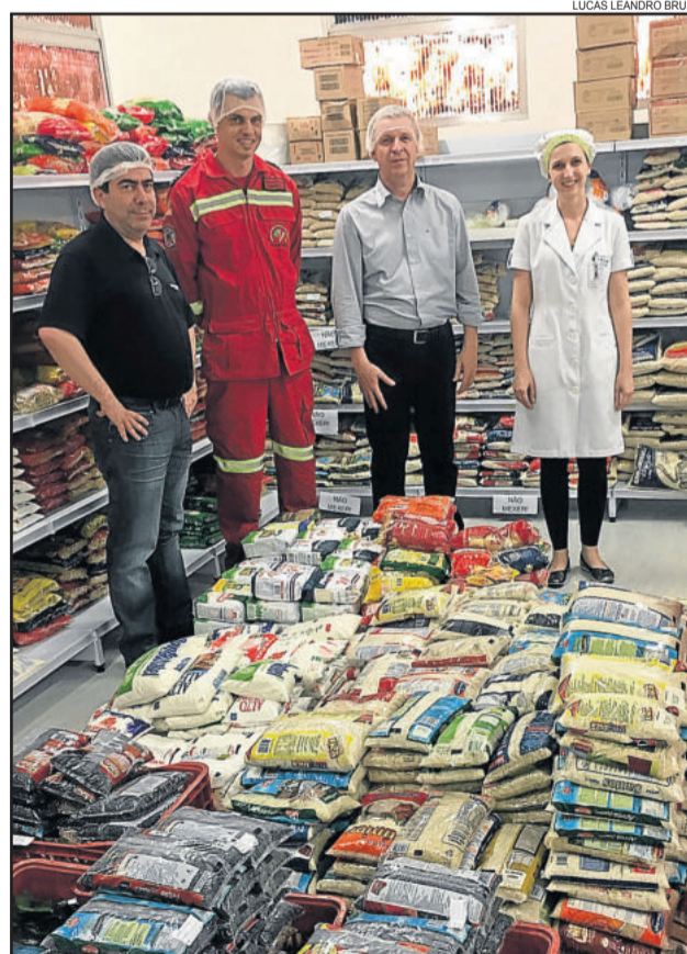
Hospital e Bombeiros recebem alimentos