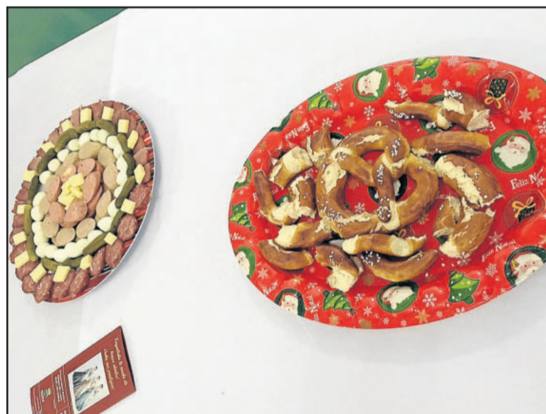
Prato típico será servido aos finais de semana no Restaurante Bierhaus - pretzel da Alemanha (d) e tábua de frios (e)