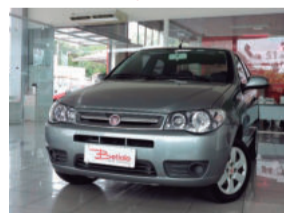
Fiat Palio Economy 1.0 8V Fire Flex 2012 Cinza, 2 portas, ISR-3736