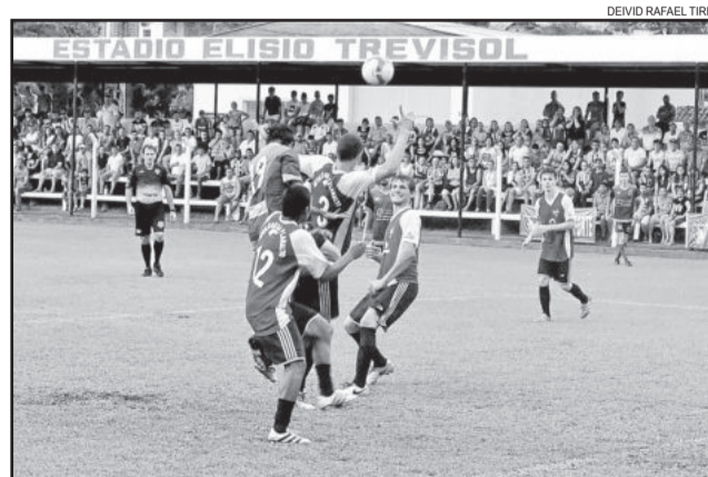
Não haverá disputa de pênaltis na final dos aspirantes