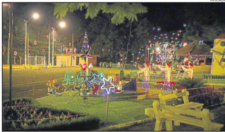
Concurso vai premiar as melhores decorações para o Natal de 2016

Nas residências, a ornamentação pode ser instalada na fachada ou nos jardins ou pátios. Nas lojas, pode estar na fachada, vitrine ou no interior. Nos edifícios e nas entidades, poderá ser instalada na fachada e/ou jardim. A decoração deverá conter obrigatoriamente luzes ou