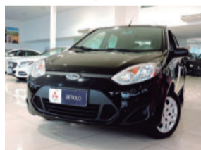
Ford Fiesta 1.0 8V Flex 2013 Preto, 4 portas, 44.000Km, ITK-2218