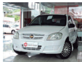
Chevrolet Celta Spirit 1.0 MPFI 8V Flexpower 2007 Branco, 2 portas, INH-4120