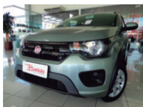
Fiat Moby Way 1.0 Flex 2017 Cinza, 4 portas, 3.873Km, IXK-1292