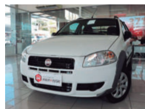
Fiat Strada Working Cabine Dupla 1.4 MPI 8V Flex 2013 Branco, 2 portas, ITS-0766

De: R$ 41.900,00 Por: R$ 37.900,00 COMPLETO