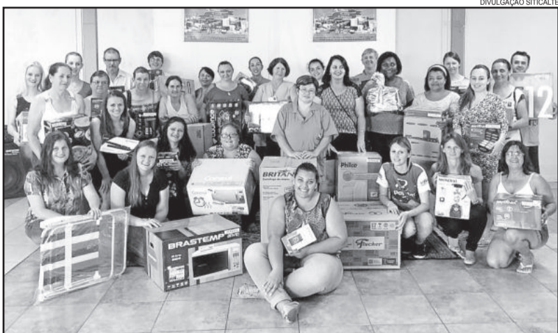
Prêmios foram entregues na segunda-feira, dia 5, no Sitalte

A relação de ganhadores pode ser conferida no quadro.