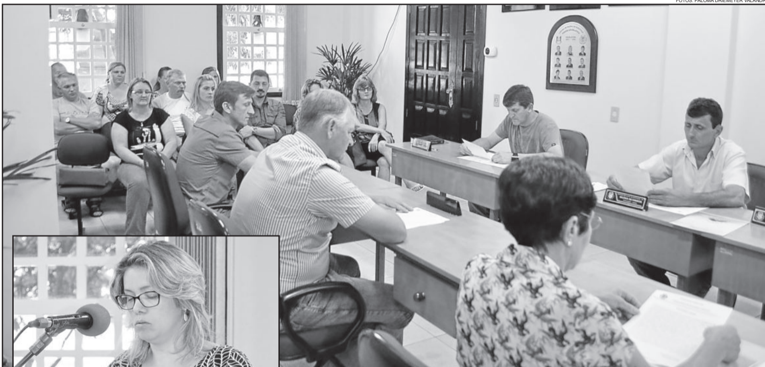
Comunidade de Linha Berlim fez sua manifestação na Câmara de Vereadores