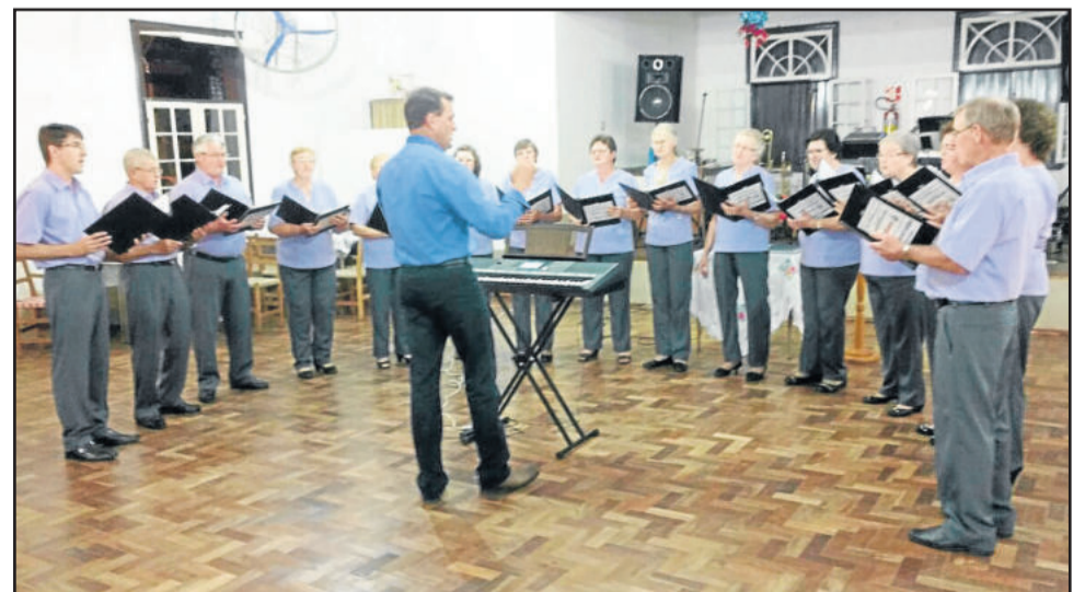
Coral Misto de Linha Harmonia realizou seu encontro de corais no dia 3 de dezembro, em Linha Harmonia, Teutônia