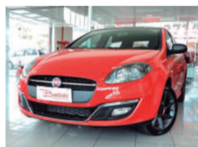
Fiat Bravo Sporting Dualogic 1.8 16V Flex 2016 Vermelho, 4 portas, Automático / sequencial, 1.000Km, IXL-4148

R$ 79.990,00 COMPLETO Ou entrada de R$ 43.994,50 + 36x de R$ 1.259,00.( 1 )