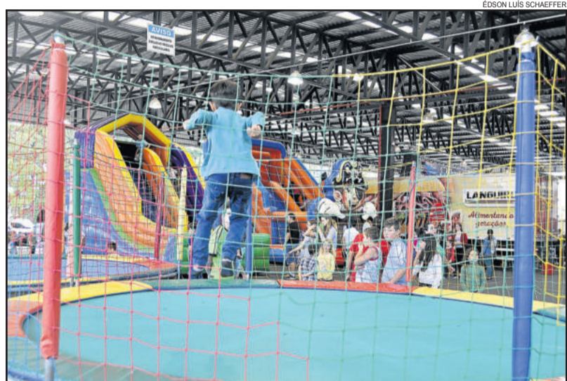
Mega Park - parceria em oferecer brinquedos infláveis gratuitos para as crianças