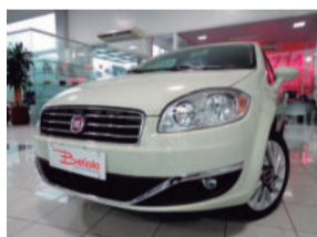
Fiat Linea Absolute Dualogic 1.8 16V Flex 2016 Branco, 4 portas, Automático, 800Km, IXM-0067