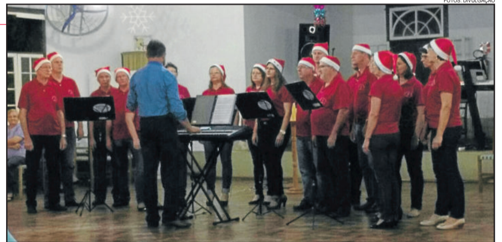
Coral Cristo Rei, de Languiru, apresentou mensagem natalina no encontro de corais em Linha Harmonia