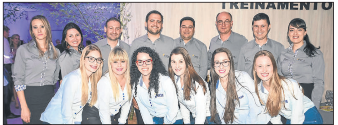
Equipe Laboratório Forla

nhando ares de empresa internacional também em seu material de divulgação, traz um conceito pensado exclusivamente para ressaltar toda a singularidade de cada produto. “Em um mundo de iguais sua lente para nós é única”, mostra, sem restrições, o forte posicionamento da marca perante o mercado e destaca, de forma objetiva, que a FreeLife3D trabalha sempre pensando e cuidando de cada cliente com a exclusividade que ele merece, atrelada ao slogan, “THE BEST. LIKE YOU!”