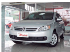
Volkswagen Voyage Trend 1.0 Mi 8V Total Flex 2011 Prata, 4 portas, IRE-6206

De: R$ 29.900,00 Por: R$ 27.900,00 COMPLETO