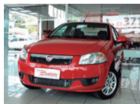
Fiat Siena EL 1.0 8V Flex 2013 Vermelho, 4 portas, ITW-8772

De: R$ 29.900,00 Por: R$ 28.900,00 COMPLETO