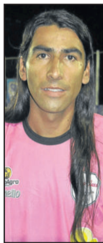
Pipoca foi um dos destaques na vitória do Kaxa Baxa