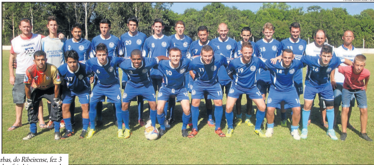
Depois de terminar o primeiro tempo perdendo por 3 a 2, o Alto Taquari voltou para a segunda etapa e buscou a virada por 6 a 3