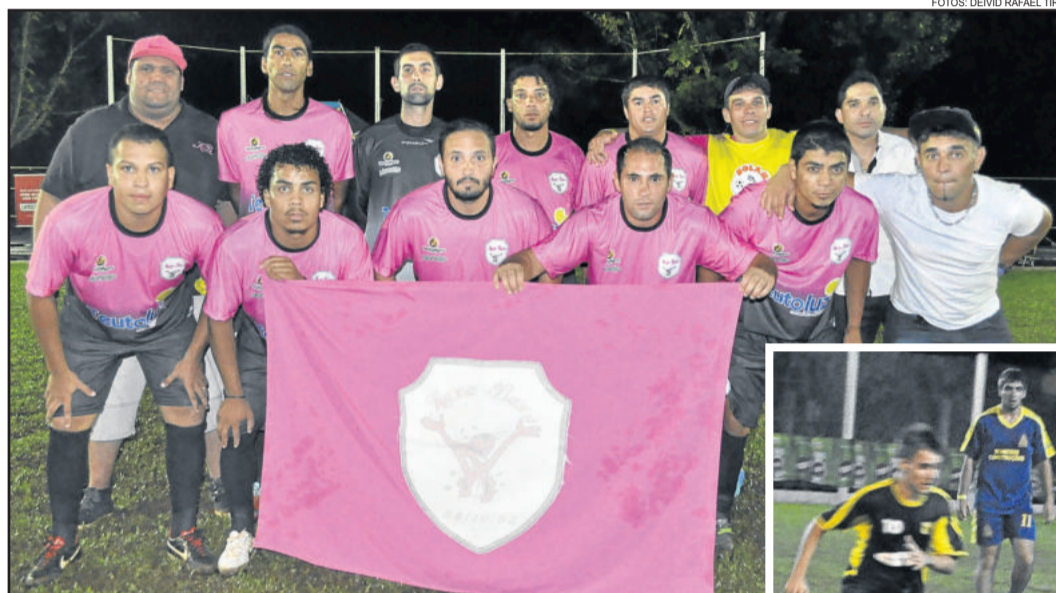
Kaxa Baxa venceu e conquistou a classificação na sexta-feira

A próxima rodada será realizada na sexta-feira, dia 13, e terá confrontos decisivos nos últimos jogos da primeira fase de competição.