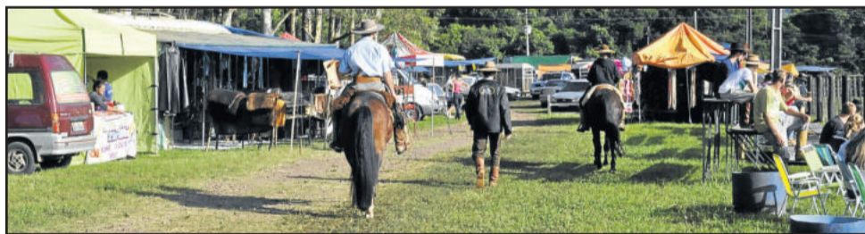
A estrutura oferecida em Colinas atraiu cerca de cinco mil pessoas

A infraestrutura oferecida no Parque de Rodeios, além das condições climáticas favoráveis, foi um dos chamarizes: vasta área de sombra e para acampamento, três banheiros com chuveiros de água quente, espaço para lavar os cavalos, serviços de copa e co-