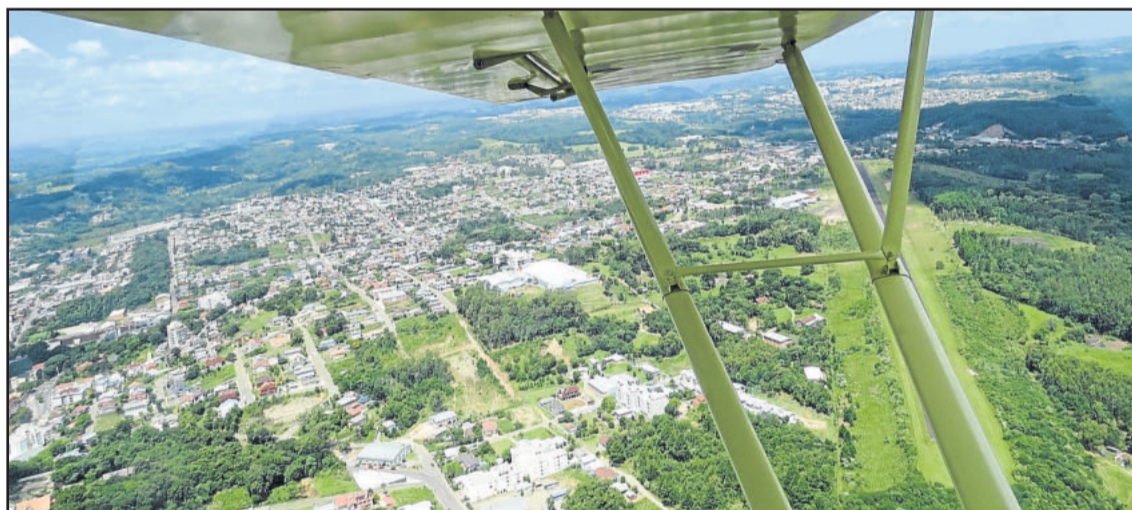
Garibaldi vista do alto

O Aeroclube possui dois aviões. Os demais que ficam no hangar são particulares, de sócios do clube. A manutenção, para cada um, chega em média a R$ 6 mil anuais. Para manter a entidade, são necessários R$ 500 mensais. Para fazer o curso de piloto privado, o aluno deve investir R$ 15 mil, para 40 horas de voo. Atualmente, o clube conta com 60 sócios que fazem voos particulares, utilizando seus próprios aviões. Quem não possui avião e quer ter a sensação de estar nas alturas, basta o investimento de R$ 300 por hora.