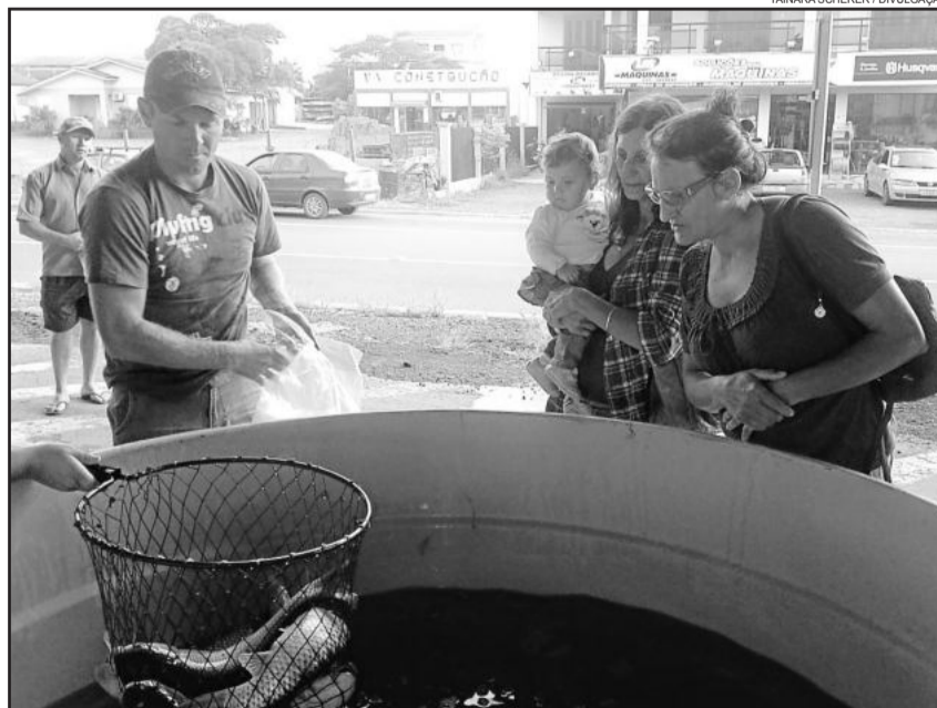
Foram comercializados cerca de 450 quilos de peixe

Primeira Feira do Peixe Vivo de 2015 ocorreu no sábado passado