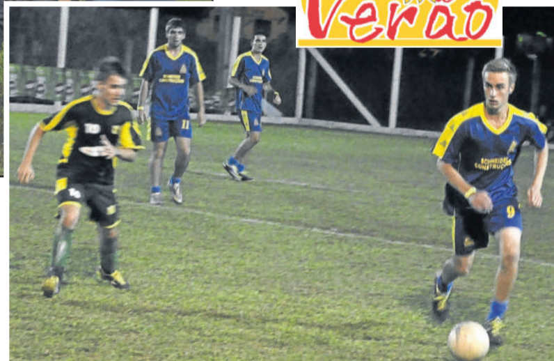
Schneider Construções na vitória diante do Amigos do Pedro