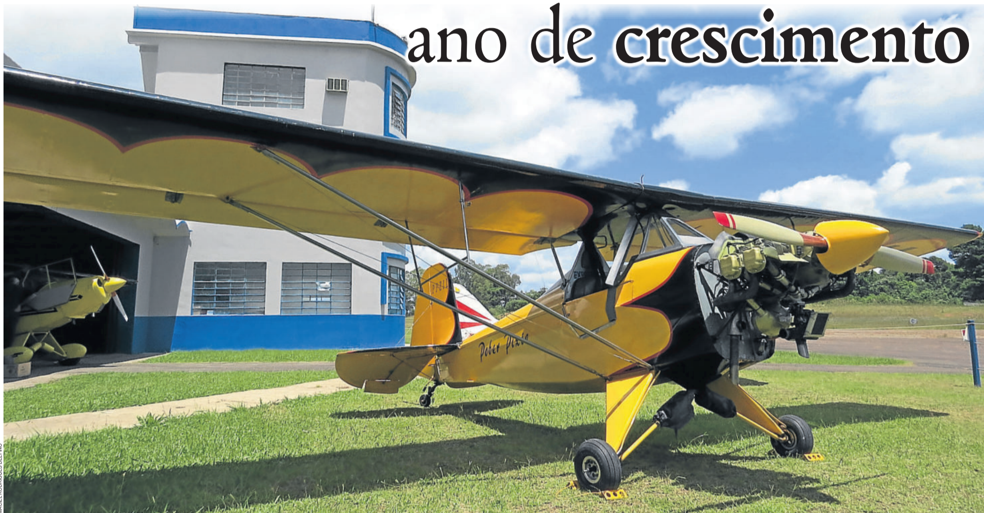
MACIEL RODRIGUES DELFINO

Aeroclube é ponto de partida e chegada de aviões e serve de instrução para novos pilotos. Expectativa para este ano é reativar a escola e tornar a entidade novamente funcional. REPORTAGEM ESPECIAL > 8