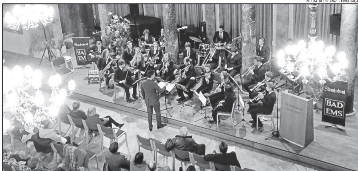
Apresentação em Marmorsaal, em Bad Ems, um belíssimo salão de mármore, um dos lugares mais bonitos que o grupo se apresentou até então

Nas fotografias e relatos dos estudantes, percebe-se que as cidades estão cobertas de neve. Em algumas delas, há três anos não nevava como agora. "Segundo os alemães, é um