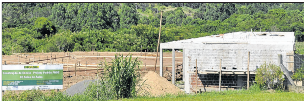
Escola está tomando forma