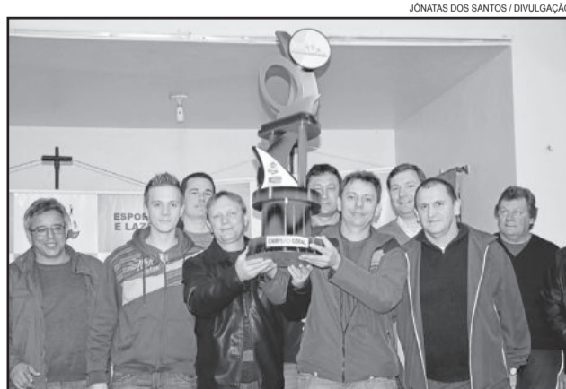
A comunidade de São Jacó foi a campeã geral dos Jogos Intercomunitários em 2014