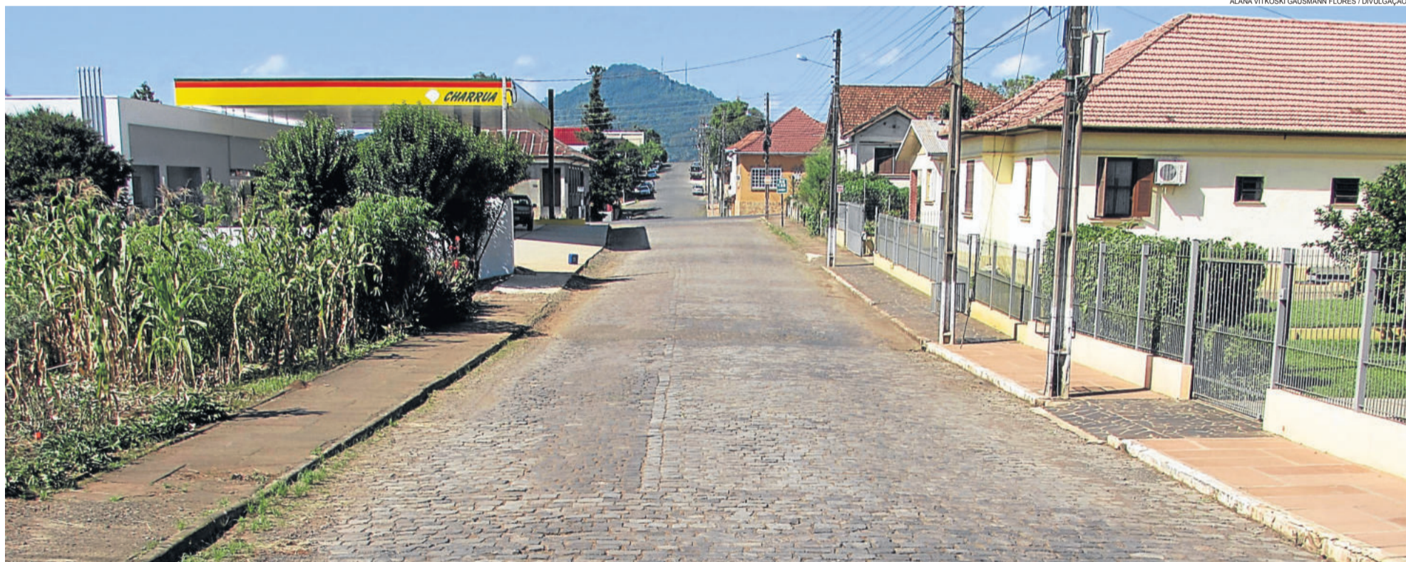
Obras somam R$ 2,4 milhões com recursos próprios e podem começar logo após audiências públicas. TEUTÔNIA > 2