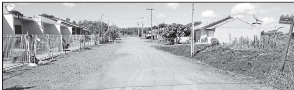
Pavimentação também ocorrerá na Rua das Laranjeiras

* Rua das Laranjeiras, entre a Rua 17 de Junho e a Rua Princesa Diana.