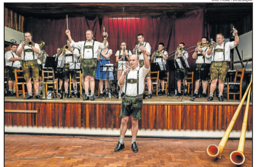
Musikkapelle tocou em Imigrante na semana passada

Outra questão que impressionou os alemães foi de que muitos imigrantenses ainda se comunicam pela língua alemã, mantendo as tradições dos antepassados.