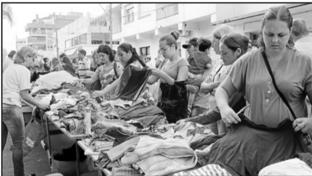
Muita gente foi ao brechó no domingo

O Multimulher é promovido pela Liga Feminina de Combate ao Câncer; Oase; Emater/Ascar; Associação de Mulheres Estrelense (Ame) e prefeitura. Conta com o apoio de Lions Clube Estrela, Câmara de Vereadores e Faculdade La Salle.