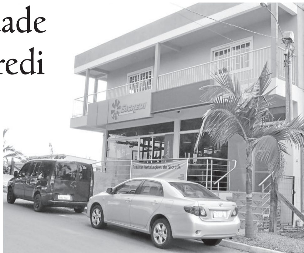
Unidade de atendimento de Fazenda Vilanova será inaugurada hoje