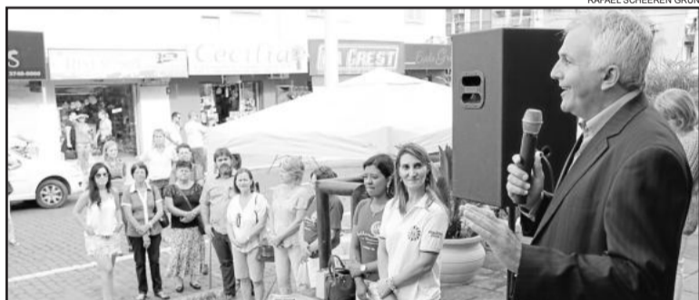
Schmidt afirmou que concepção de mulher ficar à sombra dos homens está ultrapassada

- 25 de março: 2ª Seminário Municipal de Agroecologia Lajeado no Caminho da Sustentabilidade, sobre o direito à alimentação saudável e sustentável, na Associação Atlético Municipal, 14h