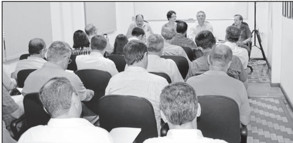
Assamblea da Amvat foi realizada ontem em Estrela

A próxima assembleia geral ocorrerá no dia 26 de março, às 16h, em Boqueirão do Leão. Paralelamente, haverá encontro dos secretários municipais de Agricultura e Meio Ambiente.