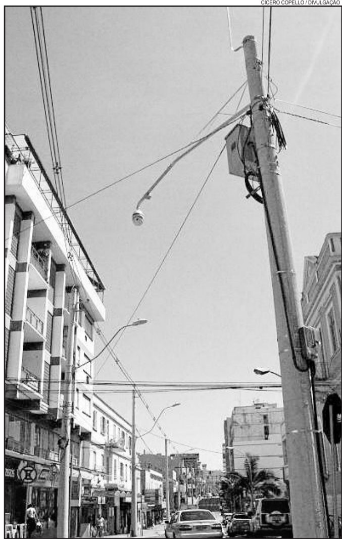
Câmera de videomonitoramento será instalada na Avenida Pirai

Além disso os equipamentos possuem canhão infra vermelho, o que possibilita a captura de imagens em escuridão absoluta em até 100 metros de distância.