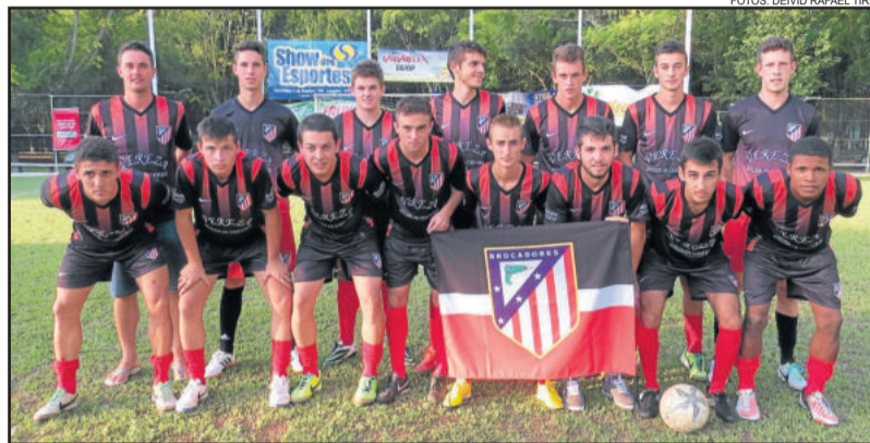
Brocadores venceu o Saidera Milkparts na semifinal pelo Sub-20

Nesta semana, serão realizadas oito partidas entre amanhã, quarta-feira, e sexta-feira, dia 13. Serão realizadas as partidas de semifinal do Força Livre, final de Master e Veterano e ainda disputas de 3º lugar.