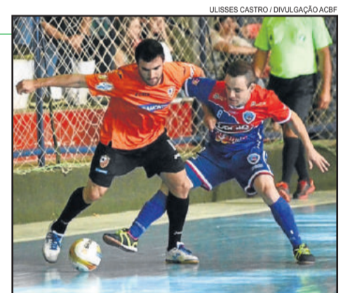
Time do ala Murilo foi derrotado por 3x0

Nesta quinta, a ALAF faz amistoso diante do Juventude, em Caxias. No próximo domingo, dia 15, a ALAF estreia na Copa dos Vales de Futsal. A rodada de abertura será em Teutônia, no Ginásio da Água. Às 19h30min, a ALAF enfrenta a ASSAF, de Santa Cruz do Sul.