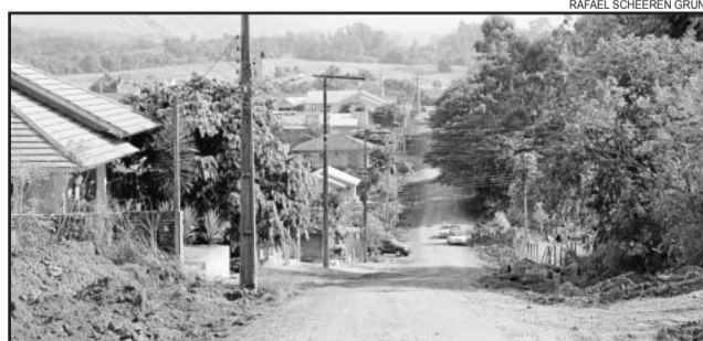
Obra de pavimentação da Rua Clara Ivone Ruschel terá investimento de R$ 345 mil

na entrada do bairro pela BR 386, e se estendeu por um longo trecho da Rua Leopoldo Ritter. Contabilizando os canos e mão de obra terceirizada para instalação, foram investidos 50 mil reais na obra. Nesta segunda-feira (09), a equipe de asfalto iniciou a pavimentação do trecho aberto da Rua Paulo Emílio Thiesen.