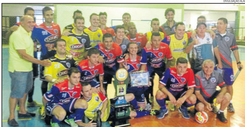
ALAF festejou vitória sobre ACBF e conquistou o Troféu Rudy Vieira