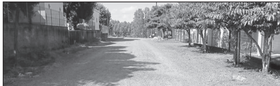
Pavimentação de trecho da Rua Leopoldo Klepker também está no pacote