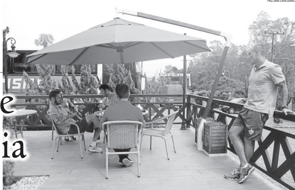
Jogadores aproveitaram a tranquilidade de Teutônia para descansar antes do confronto contra o Lajeadense

O Novo Hamburgo enfrentou o Lajeadense na noite de sábado em partida válida pelo Campeonato Gaúcho. No confronto o time de Lajeado se saiu melhor e conquistou a vitória por 2 a 1 sobre o Novo Hamburgo.