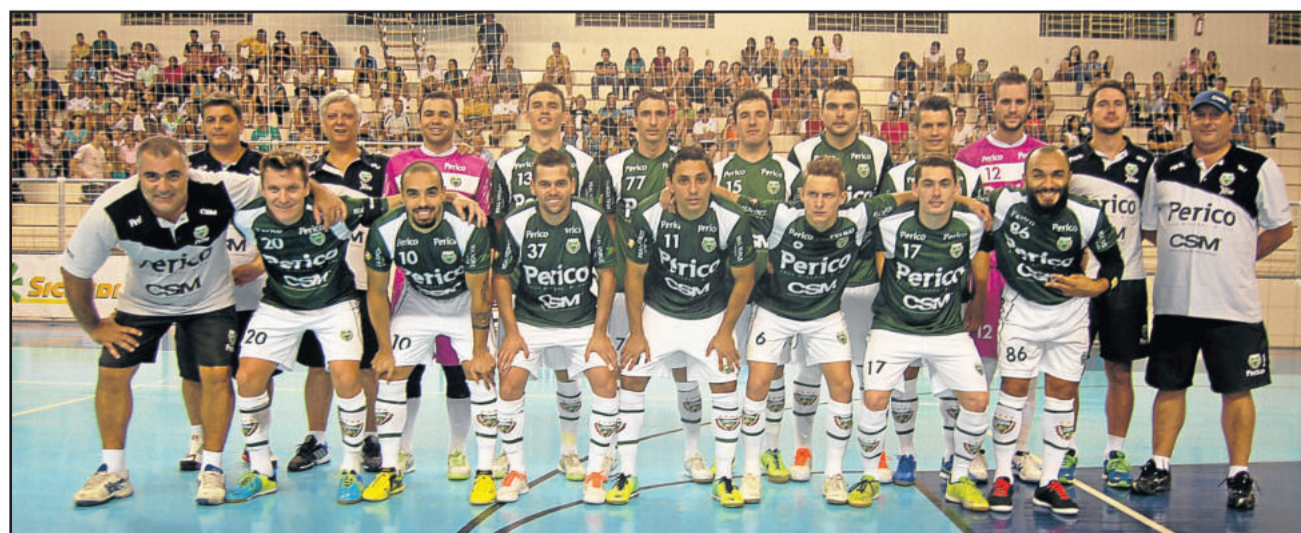
Jaraguá Futsal estreia amanhã no Torneio de Gramado, ao lado de ACBF, Atlântico e Seleção da Costa Rica