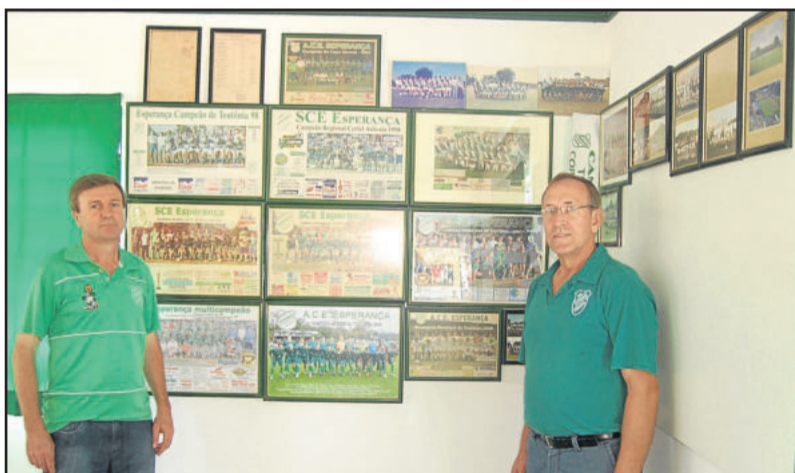
Dirigentes orgulham-se do Memorial do clube