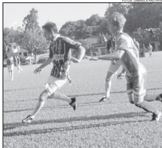
Fluminense fez uma grande partida diante do Ouro Verde