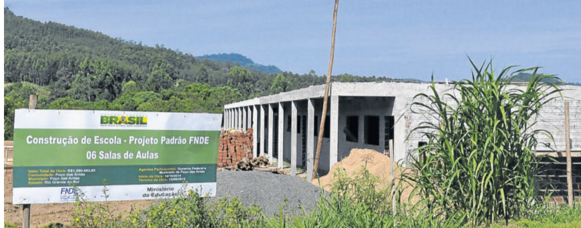
O bloco maior, onde estarão as salas de aula, está com as obras mais avançadas

Do valor total da obra, R$ 1.090.683,95 são oriundos do Fundo Nacional de Desenvolvimento da Educação. A Administração Municipal entrou com uma contrapartida de aproximadamente R$ 420 mil, sendo R$ 320.500,00 para a aquisição de oito mil metros quadrados e cerca de R$ 100 mil para