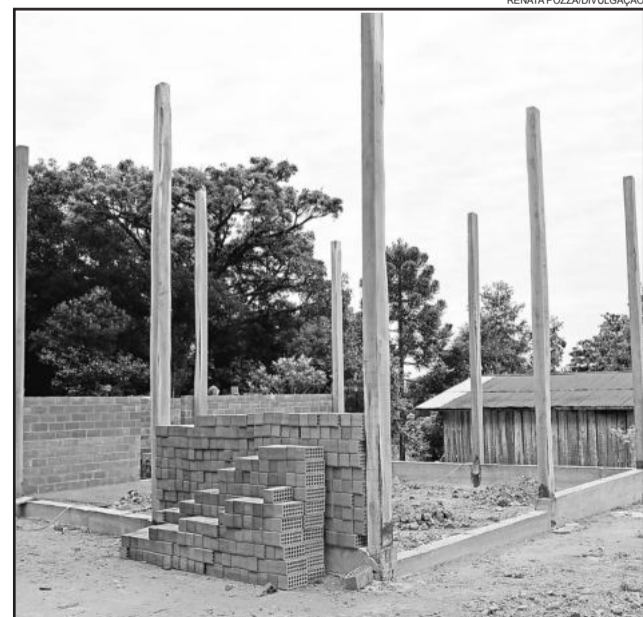
Nova estrutura está tomando forma