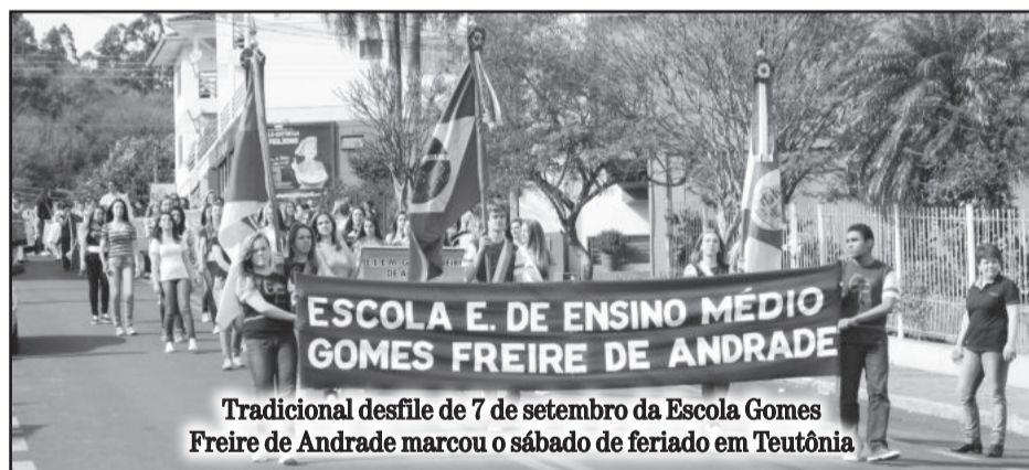
Tradicional desfile de 7 de setembro da Escola Gomes Freire de Andrade marcou o sábado de feriado em Teutônia