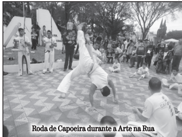
Roda de Capoeira durante a Arte na Rua