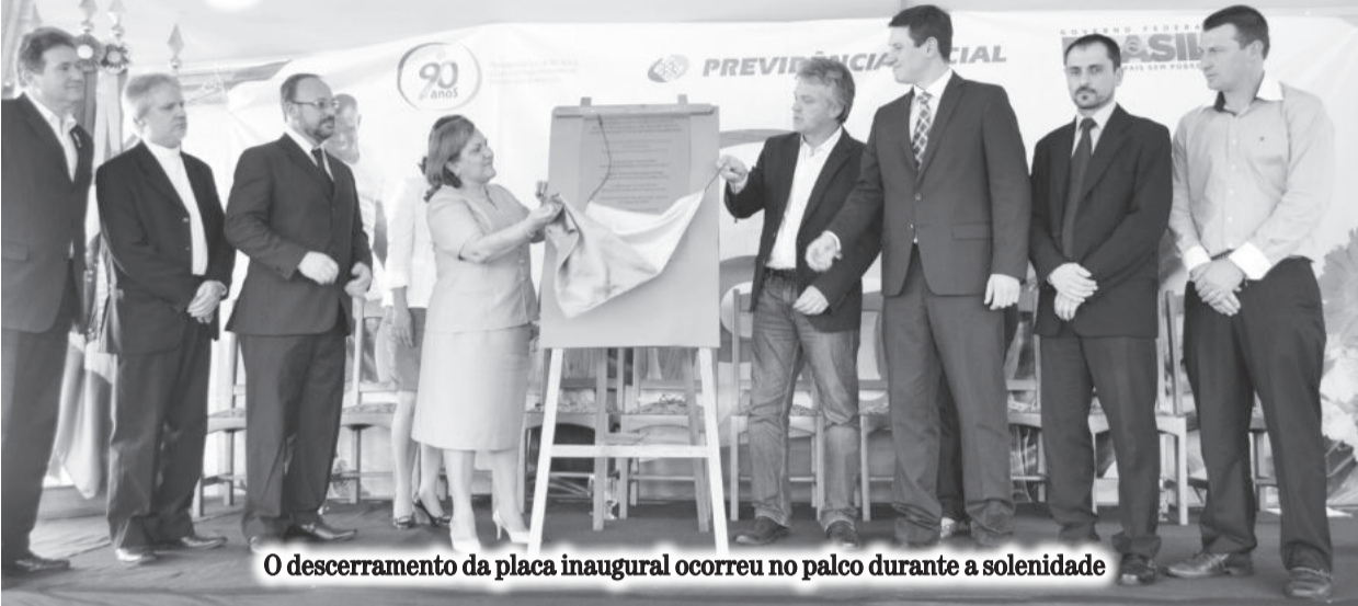
O descerramento da placa inaugural ocorreu no palco durante a solenidade

O Instituto Nacional do Seguro Social inaugurou na tarde de ontem, dia 9, as novas instalações da Agência da Previdência Social (APS) em Teutônia. A solenidade reuniu autoridades e comunidade e ocorreu defronte ao novo prédio, localizado na Avenida 1 Norte, 315, esquina com a Rua 2 Leste, no Bairro Centro Administrativo.