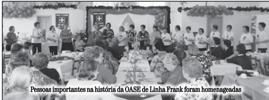
Pessoas importantes na história da OASE de Linha Frank foram homenageadas