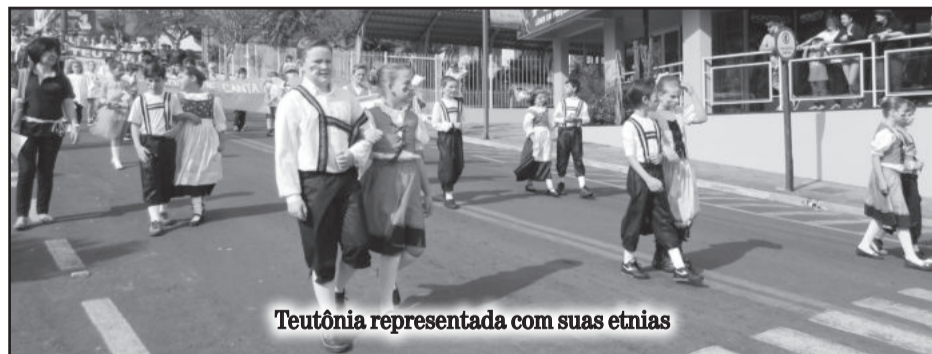
Teutônia representada com suas etnias