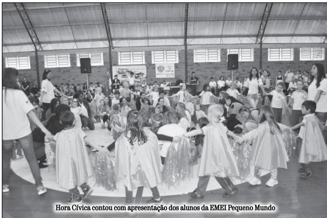
Hora Cívica contou com apresentação dos alunos da EMEI Pequeno Mundo

As ruas de Colinas ganharam um colorido a mais na manhã de sábado, dia 7 de setembro. Escolas e entidades do município realizaram o tradicional Desfile Cívico pelas ruas General Osório (desde o cruzamento com a Rua Parobé) e Fernando Ferrari (até o ginásio municipal).