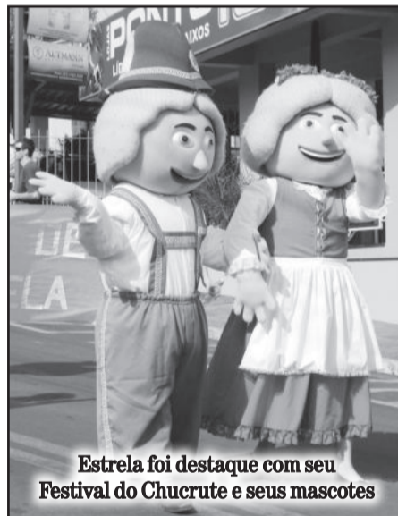
Estrela foi destaque com seu Festival do Chucrute e seus mascotes