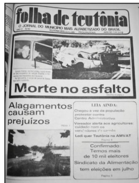
Ortografia mantida conforme edição da época

Confirmado: Temos mais de 10 mil eleitores