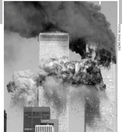
O ataque às Torres Gêmeas marcou o mundo em 11 de setembro de 2001

Junto com a One World Trade Center, o novo World Trade Center contará com outros três edifícios de escritórios, além do Museu e Memorial Nacional do 11 de Setembro. A construção é parte de um esforço para lembrar e reconstruir o complexo original do World Trade Center, que foi destruído durante os ataques. Após a conclusão, o One World Trade Center será o mais alto edifício exclusivo para escritórios do mundo.