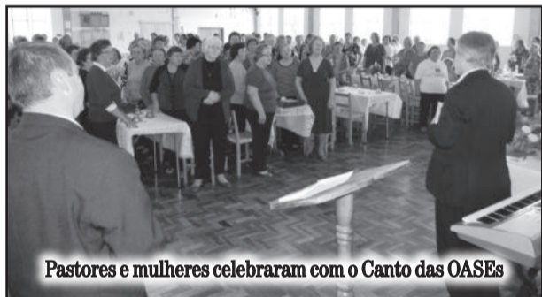
Pastores e mulheres celebraram com o Canto das OASEs