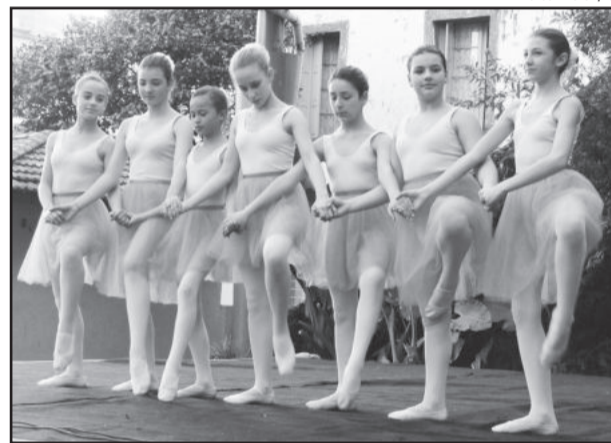
Meninas apresentaram-se com toda a leveza e suavidade características do balé