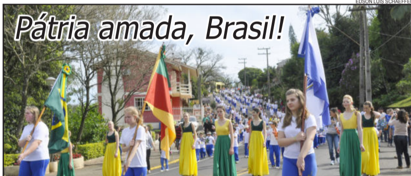
Veja cobertura nas páginas 9 a 14