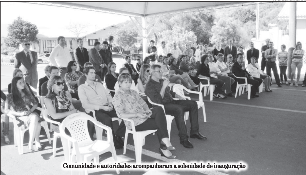
Comunidade e autoridades acompanharam a solenidade de inauguração