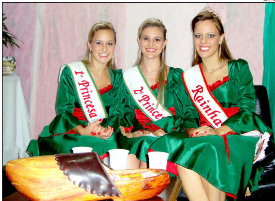
Atuais soberanas de Teutônia entregam as faixas em novembro

Para o julgamento das fotos inscritas será formada uma comissão especial, nomeada pelo Executivo. Para as fotos vencedoras serão conferidos os seguintes prêmios: R$ 300,00 para o primeiro colocado; R$ 200,00 para o segundo colocado; e R$ 100,00 para o terceiro colocado. Além disso, cada um desses três primeiros colocados receberá um troféu.