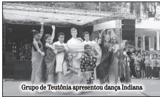
Grupo de Teutônia apresentou dança Indiana