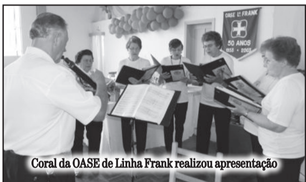
Coral da OASE de Linha Frank realizou apresentação