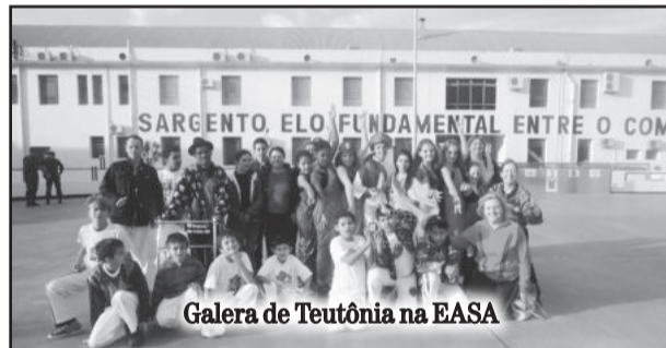
Galera de Teutônia na EASA