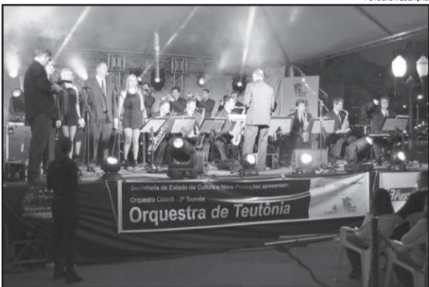
Orquestra de Teutônia empolgou público

A Estação Primavera é uma realização da Prefeitura, através da Secretaria de Turismo, com apoio de entidades, associações, do trade turístico e de empreendedores. O evento segue até o dia 17 de novembro.