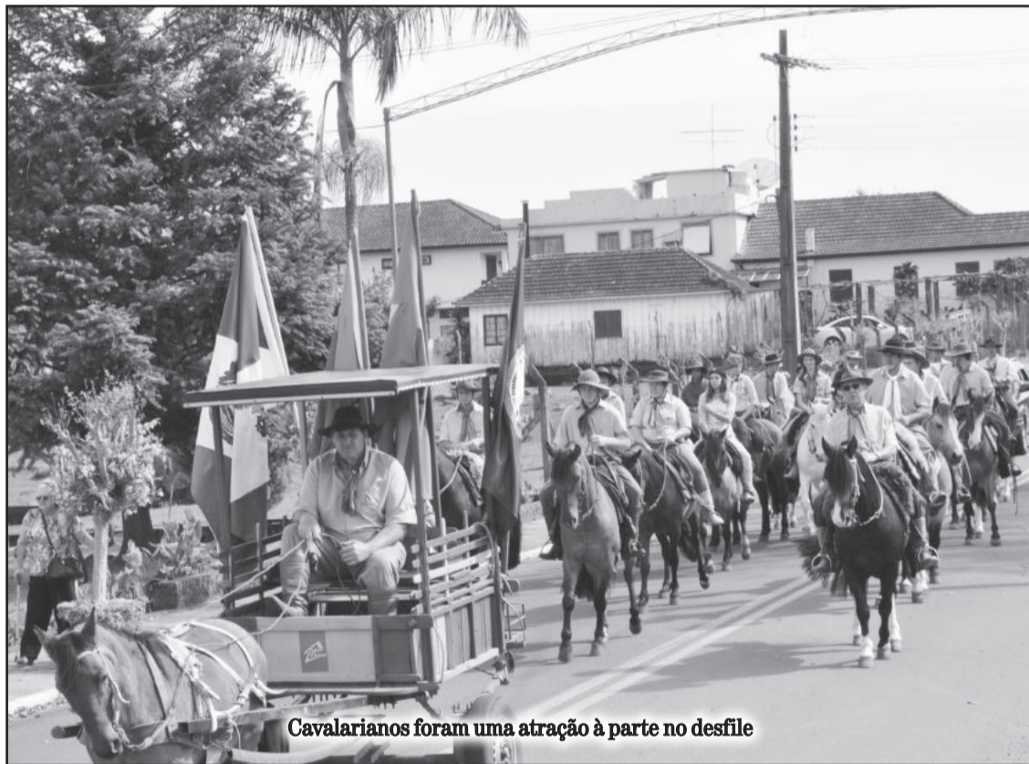
Cavalarianos foram uma atração à parte no desfile