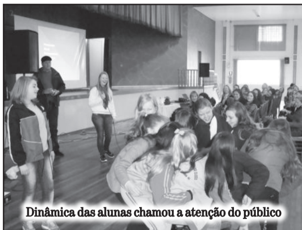
Dinâmica das alunas chamou a atenção do público