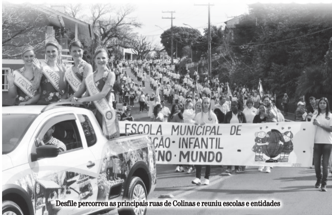
Desfile percorreu as principais ruas de Colinas e reuniu escolas e entidades