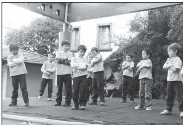
Projeto ensina dança de rua aos meninos

A iniciativa está aberta à participação de outros apoiadores. Mais informações podem ser obtidas junto à APEME, pelo fone (54) 3462-2755 ou pelo e-mail projetos@apeme.com.br.