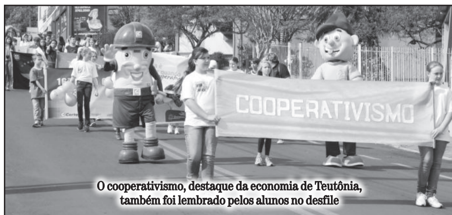
O cooperativismo, destaque da economia de Teutônia, também foi lembrado pelos alunos no desfile