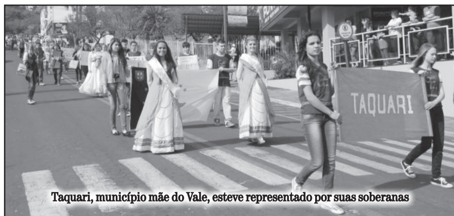
Taquari, município mãe do Vale, esteve representado por suas soberanas