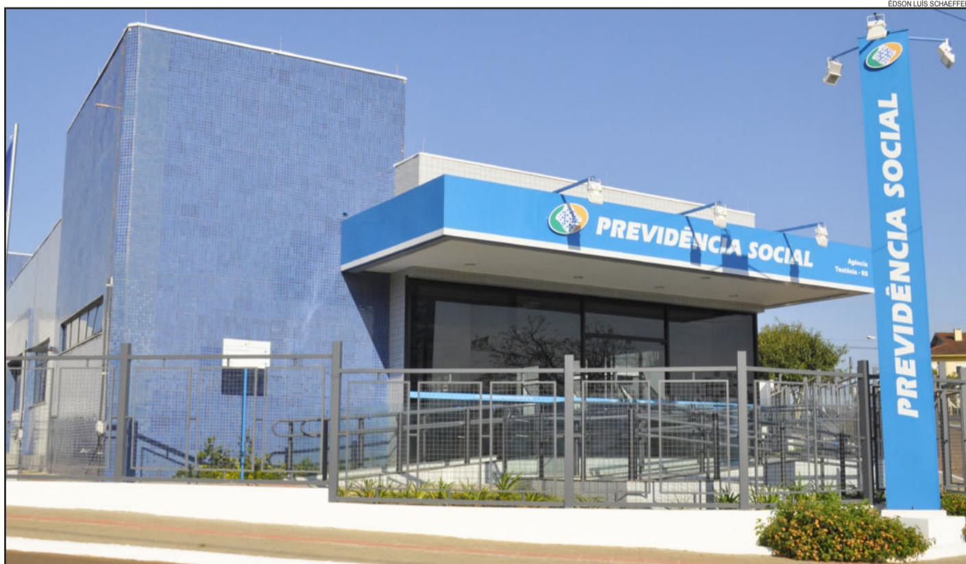
Novas instalações foram inauguradas na tarde de ontem, segunda-feira, em solenidade que reuniu autoridades, colaboradores e comunidade. Novo prédio fica próximo à Promotoria de Justiça. Página 2