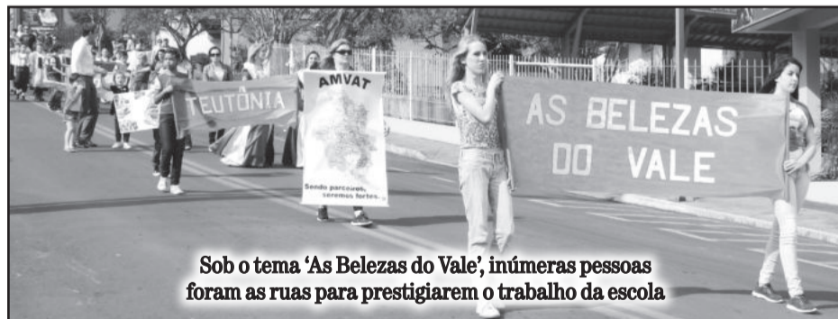
Sob o tema 'As Belezas do Vale', inúmeras pessoas foram as ruas para prestigiarem o trabalho da escola