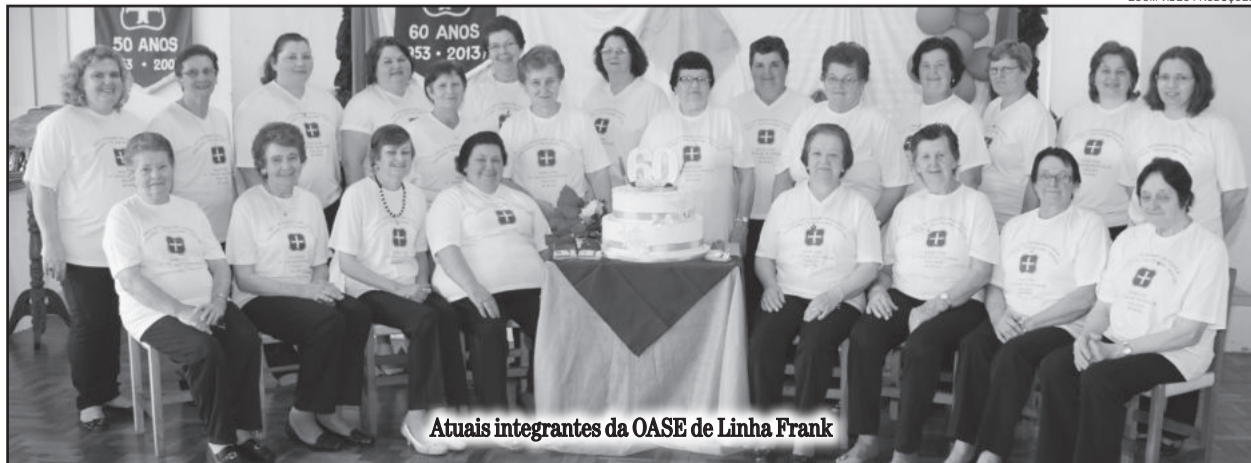
Atuais integrantes da OASE de Linha Frank