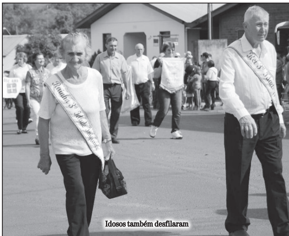
Idosos também desfilaram