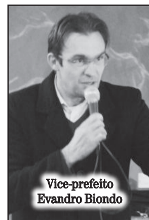
Vice-prefeito Evandro Biondo