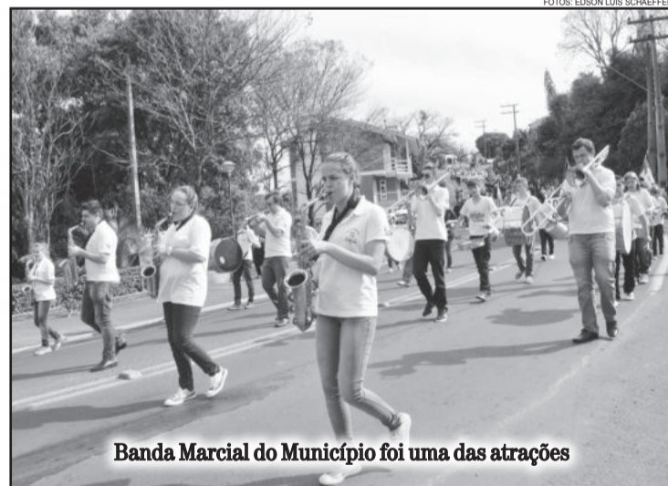
Banda Marcial do Município foi uma das atrações