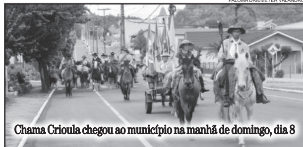
Chama Crioula chegou ao município na manhã de domingo, dia 8