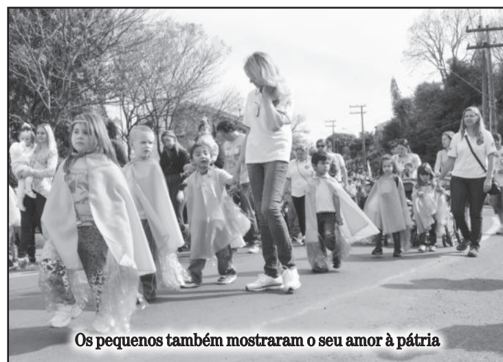
Os pequenos também mostraram o seu amor à pátria