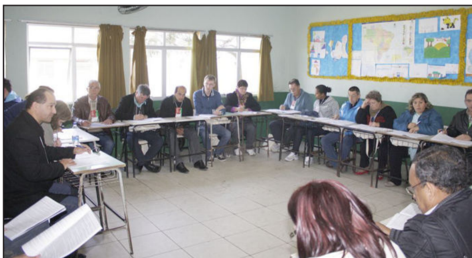
Grupos de discussão trabalharam no sábado