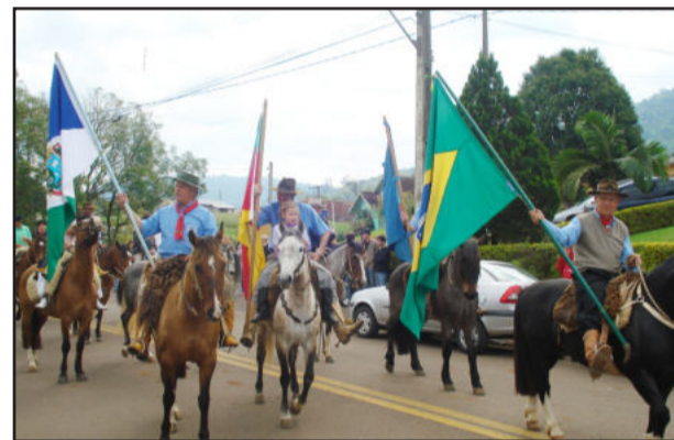
CTG garante culto às tradições