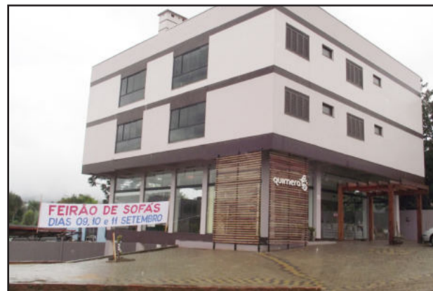
Loja localizada na entrada do bairro Canabarro