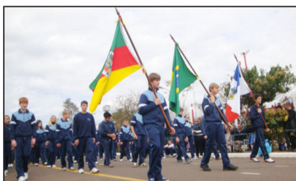
Desfile teve a presença de mais de 5 mil pessoas