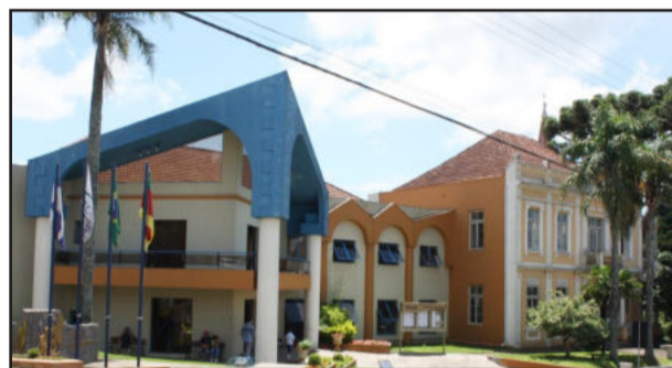
Prefeitura de Garibaldi