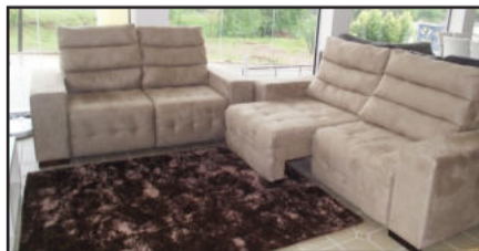
Modelos para todos os gostos

Hoje, sábado, e neste domingo, a empresa fica de portas abertas até às 18 horas, propiciando assim que as famílias possam vir com calma conhecer os produtos que a loja traz para Teutônia.