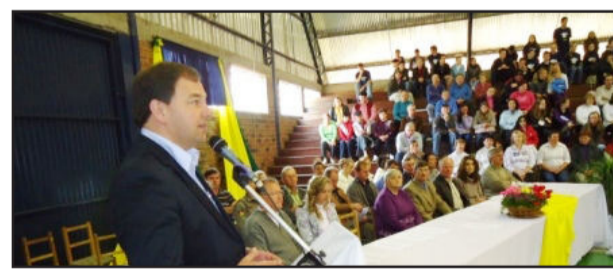
Hora Cívica reuniu autoridades