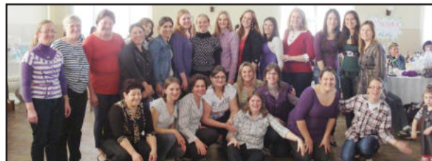
Toda direção e professoras