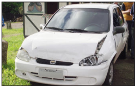
Acidente na Via Láctea nesta sexta-feira resultou em danos materiais

A manobra obrigou o caminhão a frear para evitar a colisão frontal. Com isso, o Corsa não conseguiu parar e bateu na traseira do caminhão. Apenas danos materiais foram registrados no veículo.