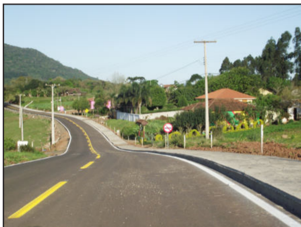
Pintura também foi realizada