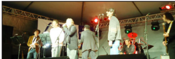
A primeira banda a se apresentar foi Die Klassiker Rock Band, de Estrela