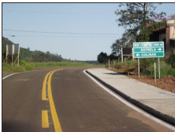
Sinalização foi concluída

Esta semana foi finalizada, na Linha Santo Antônio, a pintura do asfalto e a sinalização do trecho. Moradores estão muito contentes com a obra realizada e destacam que foi uma obra bem feita, pois além do asfalto, a população tem calçada para caminhar com segurança. A pintura e a sinalização agora completam a obra, garantindo a segurança e orientação necessários para a segurança de todos que trafegam por este trecho do interior de Colinas.