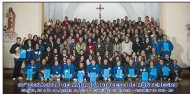
Cenáculo de Maria