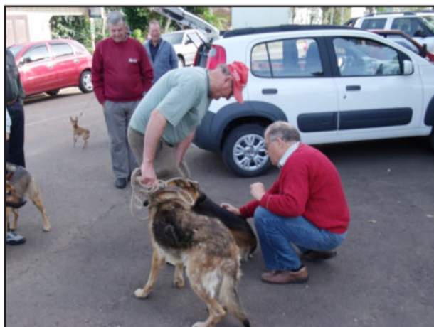
Vacina em cães

Mais uma etapa de vacinação contra raiva canina no Município de Colinas no último sábado, dia 3. A Prefeitura, através da Secretaria da Agricultura, informa que marcará nova data para mais uma etapa da vacinação. Pois neste dia as vacinas não foram suficientes para atender a demanda de cães existentes em Colinas.