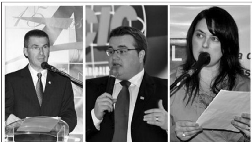
Entidades empresariais iniciam mobilização contra aumento no número de vereadores