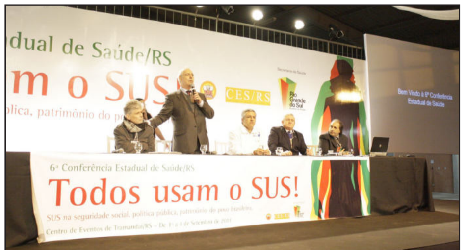
Abertura da Conferência Estadual de Saúde foi na quinta-feira