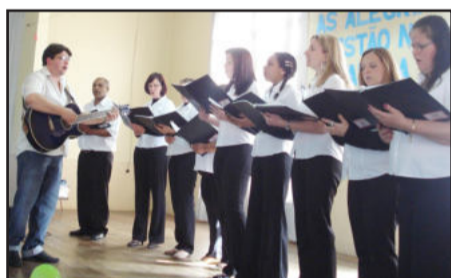
Apresentação de canto