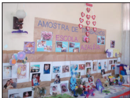
Mostra de trabalhos

Por vezes, muitos, homens e mulheres não conseguiam segurar a emoção e deixavam escapar lágrimas de emoção que escorriam em seus rostos. Isso prova que o amor existe e que a cada evento desses cresce dentro de cada um de nós.