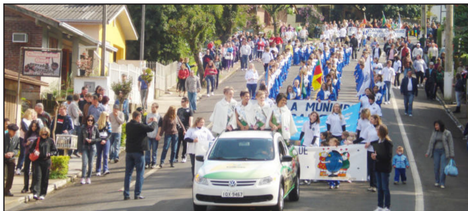
Desfile pelas ruas do Município

O Município realizou na quarta-feira o seu tradicional desfile cívico, onde todas as escolas e entidades participaram, com organização da Secretaria da Educação, juntamente com professores e funcionários das escolas. Como já é de praxe no Município, cada entidade e escola trouxe alguma mensagem e destaque especial.