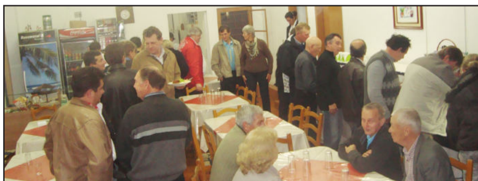
Encontro nesta quinta reuniu lideranças do PTB e aliados para a eleição de 2012