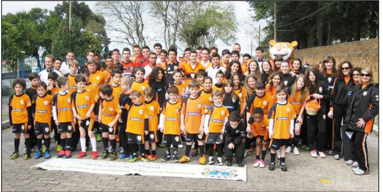
Atletas, alunos e professores posam antes do Desfile Cívico do Dia da Independência, em Carlos Barbosa

As equipes de Base da Associação Carlos Barbosa de Futsal (ACBF) participaram nesta quarta-feira, 7 de setembro, do Desfile Cívico do Dia da Independência, na cidade. Ao todo, cerca de 160 jovens e crianças vestiram as cores do clube Campeão do Mundo de Futsal, para prestigiar o evento junto com a comunidade.