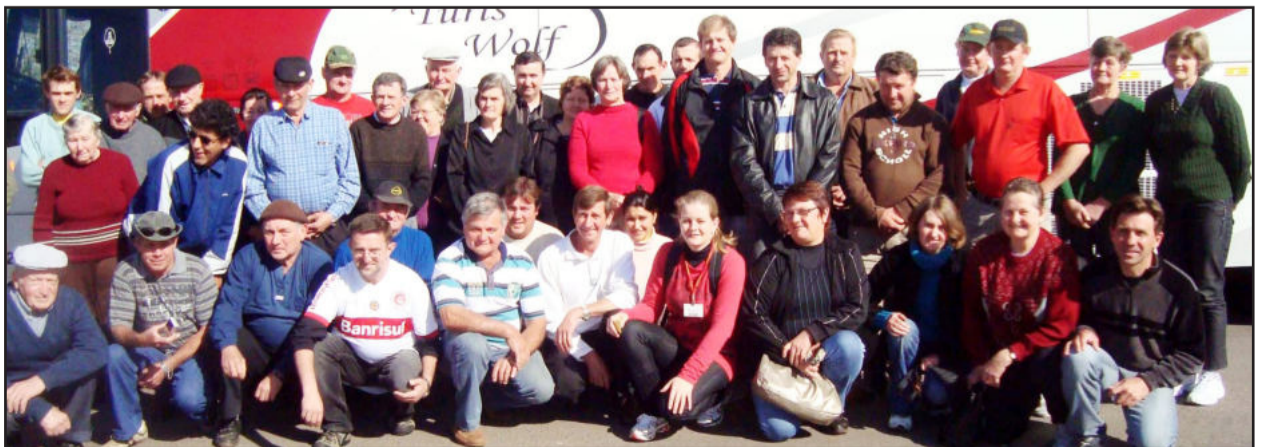
Imigrantenses conheceram a Expointer