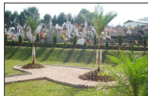
Mais um local com ajardinamento em Colinas

O Município está trabalhando pela preservação do meio ambiente, e com essa ação visa proporcionar satisfação e auto-estima à população, através de momentos de lazer que podem ser usufruídos no novo espaço.