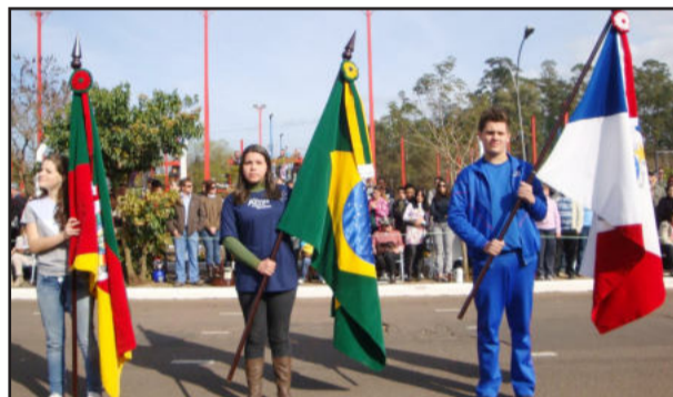
Representantes das escolas do Município conduziram as bandeiras