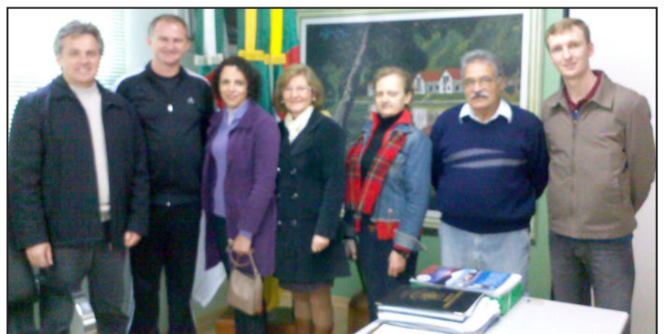
Delegados de Teutônia participam da Conferência Estadual de Saúde