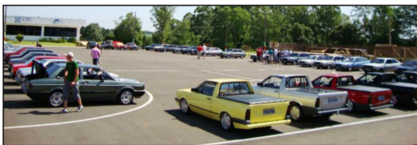
Quadrado Clube será uma das atrações

Apoio: Administração Municipal de Teutônia e Brigada Militar.