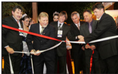
Corte da fita

Hoje a exposição abre às 10 horas. Ao meio-dia haverá café colonial. Vários shows estão previstos: às 15 horas, show Infantil "A Turma do Pirulito"; às 16 horas, show Banda Zangaia; às 17h15min, show Banda Zephyr; às 18h30min, Banda Auto Reverse; às 19h45min, show Conrado Vier e Banda; às 21 horas, show Banda Vão Noturno; às 22h15min, show U2 Cover.