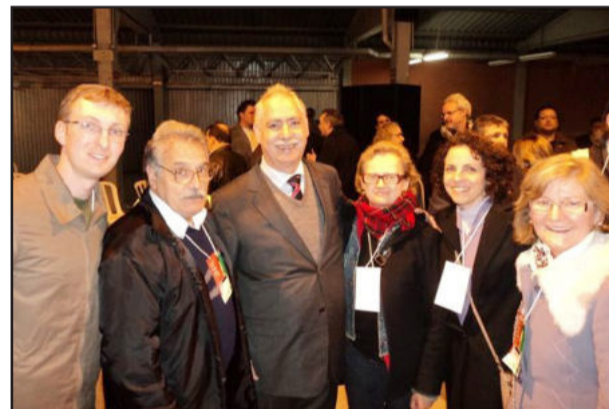
Comitiva de Teutônia com o secretário estadual de Saúde Ciro Simoni (c)