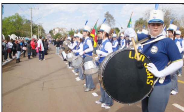
Banda da Escola Municipal Leo Joas encantou o público com sua apresentação