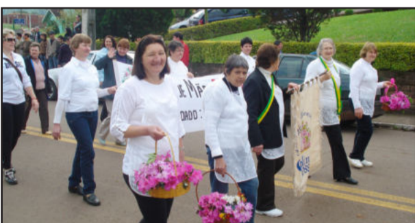
Flores de Colinas em destaque