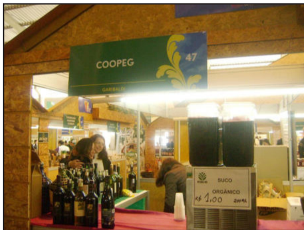
Coopeg expôs seus produtos e serviços na Expointer

Além de apoiar as agroindústrias garibaldenses que participaram da Expointer, a Prefeitura de Garibaldi, através da Secretaria Municipal de Agricultura e Pecuária, ofereceu aos agricultores do município a oportunidade de visitar o evento. A visita foi realizada na quinta-feira, dia 1º, reunindo mais de 50 agriculto-