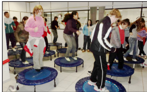
Na Academia Mega, alunos tiveram miniaula de jump