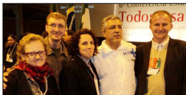
Comitiva de Teutônia com o ministro Alexandre Padilha