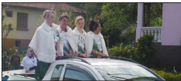
Soberanas participaram em carro aberto