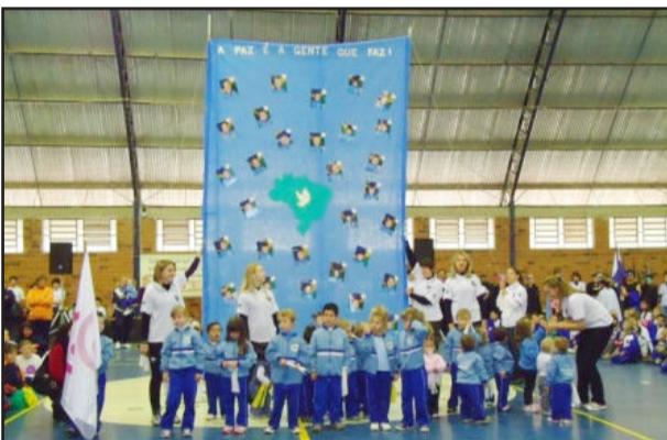
A paz é a gente que faz: mensagem da Educação Infantil

O desfile ocorreu pelas principais ruas do Município, encerrando no ginásio municipal, onde autoridades fizeram uso da palavra em sessão cívica. Neste momento, as escolas também realizaram apresentações especialmente ensaiadas para o dia. Ao meio-dia houve almoço e após o sorteio da rifa com promoção pela APM da Escola Ipiranga e CPM da Escola Estadual.