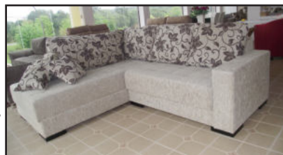
Sofás com valores e condições especiais neste final de semana