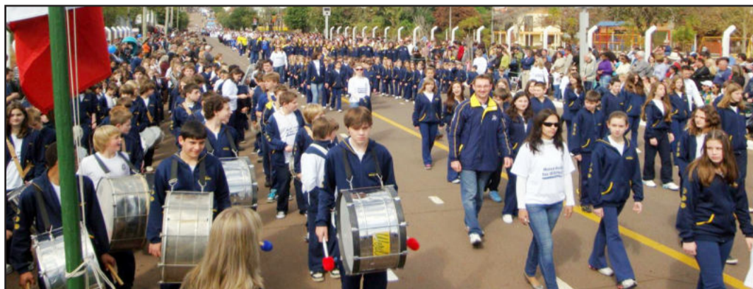
Desfile contou com a participação de 7,6 mil alunos

No feriado nacional do dia 7 de setembro, comemorado nesta quarta-feira, mais de cinco mil pessoas prestigiaram o Desfile Cívico Estudantil, realizado na rua Júlio de Castilhos, em frente ao Parque Princesa do Vale.