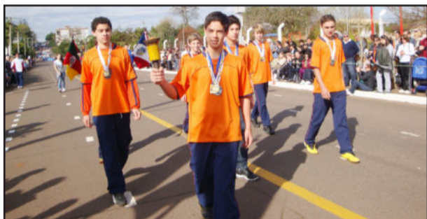
Athletas e alunos da Escola Municipal Pedro Jorge Schmidt conduziram o fogo simbólico

Confira no site www.estrela-rs.com.br todas as imagens do desfile.