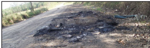
Restos da queima do carro em Estrela

Um automóvel Ka foi localizado totalmente queimado, às 7 horas da manhã de terça-feira, dia 6, às margens da RS-129, em Estrela. O carro foi encontrado nas proximidades da ponte entre os bairros São José e Boa União, em Estrela. Devido ao estado do veículo, não foi possível identificar sua procedência.