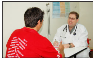
Profissionais comprometidos e trabalho para bem atender a população

O prefeito Renato Airton Altmann comemorou o resultado. “Isso demonstra que investimos pesado em Saúde desde o primeiro ano de governo, com ações importantes, preventivas e diferenciadas”, ressalta. “Ao contrário do que muitos andam semeando por aí, nossa Administração Municipal manteve e aumentou o investimento em saúde, fato comprovado pela média dos últimos cinco anos”, salientou