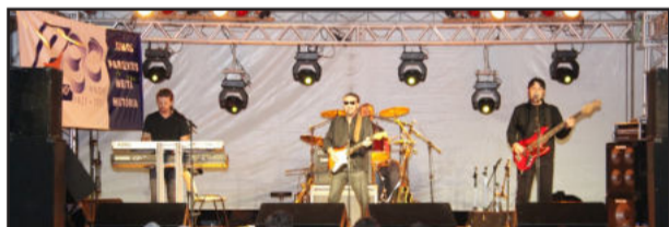
A Banda Sunset Riders, de Porto Alegre, foi a segunda atração

A Banda Sunset Riders, de Porto Alegre, foi a segunda atração, com uma homenagem ao grupo inglês Bee Gees, que teve seu sucesso comparado ao de grandes nomes da música mundial. No show, denominado Especial Bee Gees, foram lembrados, com fidelidade, todos os clássicos deste grupo que emplacou sucessos desde a década de 60 até seu último álbum, em 2001.