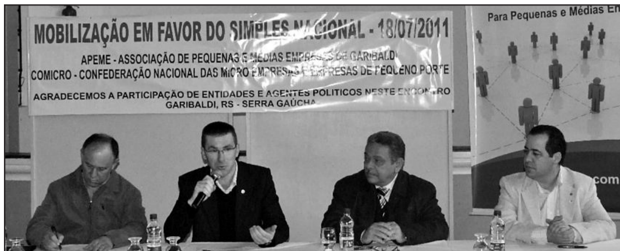
APEME comemora aprovação do simples nacional

Outra conquista do segmento foi a aprovação, pela Comissão de Desenvolvimento Econômico, Indústria e Comércio (CDEIC), da criação da Secretaria da Micro e Pequena Empresa, com status de ministério. O presidente também reforça que "com a criação desta Secretaria, nós representantes dos empresários teremos encurtado nosso caminho de reivindicações e teremos pessoas que vão pensar especificamente nossas políticas".