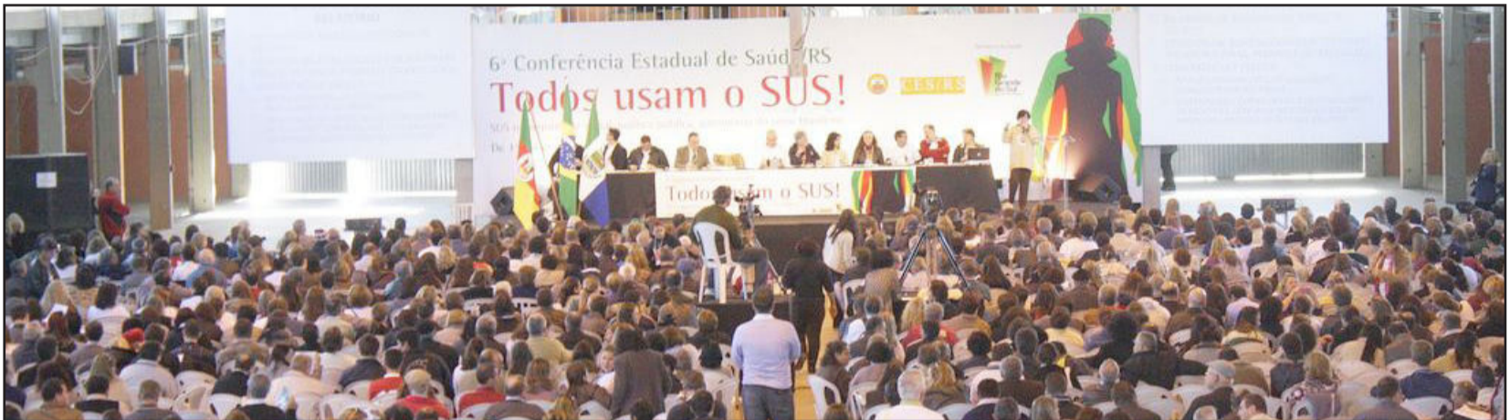
Conferência deliberou sobre as prioridades para a saúde pública

Os seis delegados titulares de Teutônia participaram da 6ª Conferência Estadual de Saúde, realizada em Tramandaí, de 1º a 4 de setembro. O grupo teutoniense saiu na quinta-feira ao meio-dia, para participar do evento e levar as reivindicações e resoluções da 4ª Conferência Municipal, realizada no dia 15 de junho.