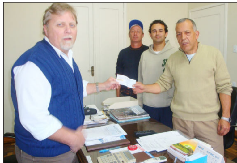
Prefeito Celso Brönstrup (e) entrega cheque à direção do Estrela FC

Os recursos se destinam à manutenção das atividades das escolinhas das categorias de base do Estrela Futebol Clube.