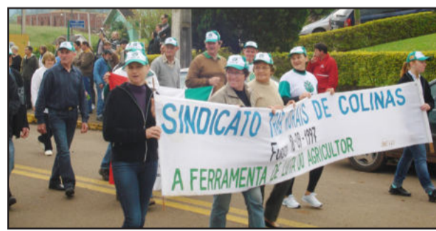
Entidades são presença no desfile