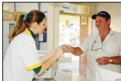
Atendimento diferenciado à população