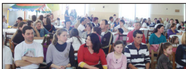
Festa da Família da Escola Azaléia