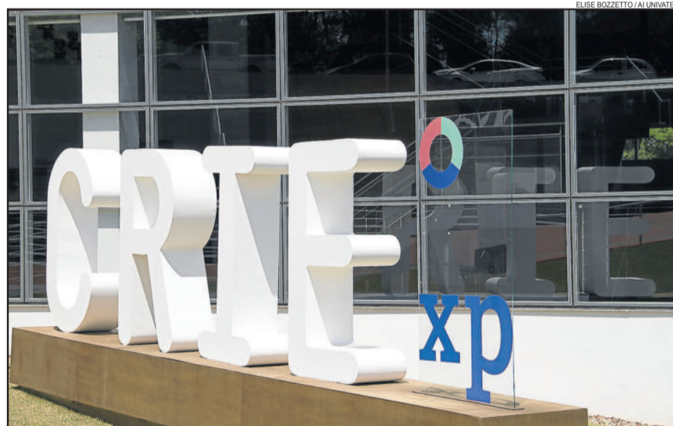
CRIExp consolidou-se como maior evento do gênero no sul