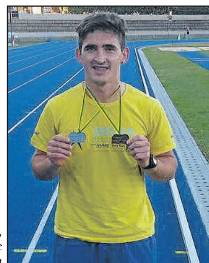
No Estadual de Atletismo, Kommer ficou com prata e bronze nas disputas realizadas na Sogipa

Feliz com os resultados do final de semana, Kommer se prepara agora para etapa de Gramado, no próximo domingo, do Circuito Sesc de Corrida.