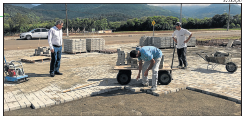
Obras iniciaram na semana passada

A empresa LED Construtora e Urbanizadora LTDA é responsável pela Implantação da academia ao ar livre, na Rua Leopoldo Fiegenbaum, área de 557,74m² e valor licitado de R$ 119.017,55.