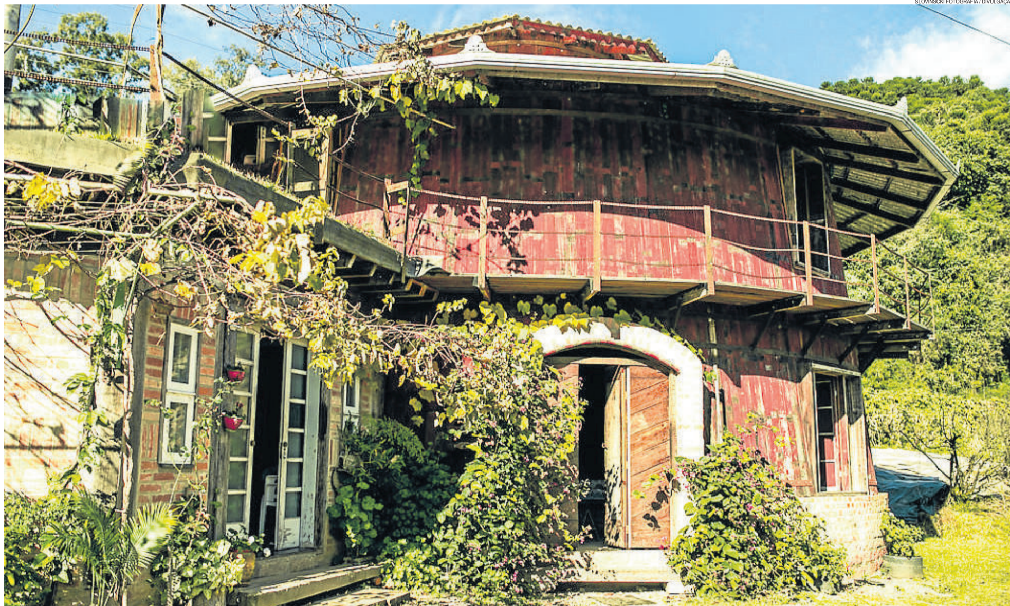
Novo roteiro turístico será lançado no dia 18 de outubro, no Sítio Crescer. Econatura (foto) é um dos dez empreendimentos da rota. GARIBALDI > 11

1º TEUTOFIGHT MOBILIZA ATLETAS NO PRÓXIMO SÁBADO TEUTÔNIA > 12