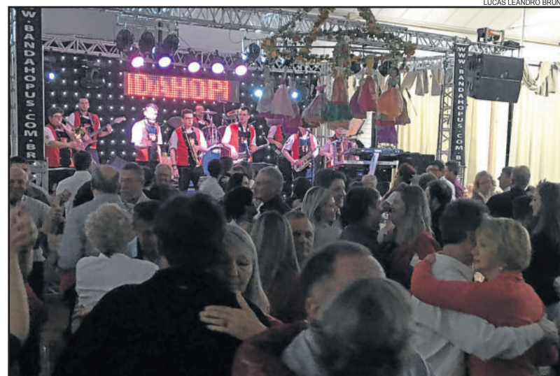
Banda Hopus animou o baile de Kerb

Às 22h30min, a Banda Hopus abriu o baile e manteve a pista sempre cheia e animada até as 2h30min da madrugada de domingo. Durante a noite, também havia as tradicionais cuca, linguíça, batata frita e gildas. O Baile de Kerb do Martin Luther teve a transmissão da Rádio Popular FM.