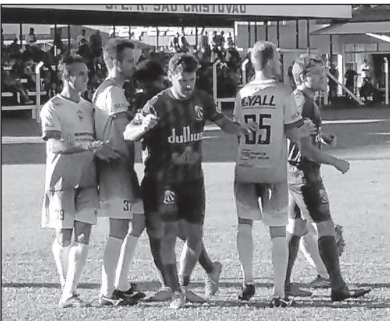
Forte marcação das duas equipes no empate entre SER São Cristóvão e Forquetense

Novo empate, no jogo da volta, classificará time de Lajeado