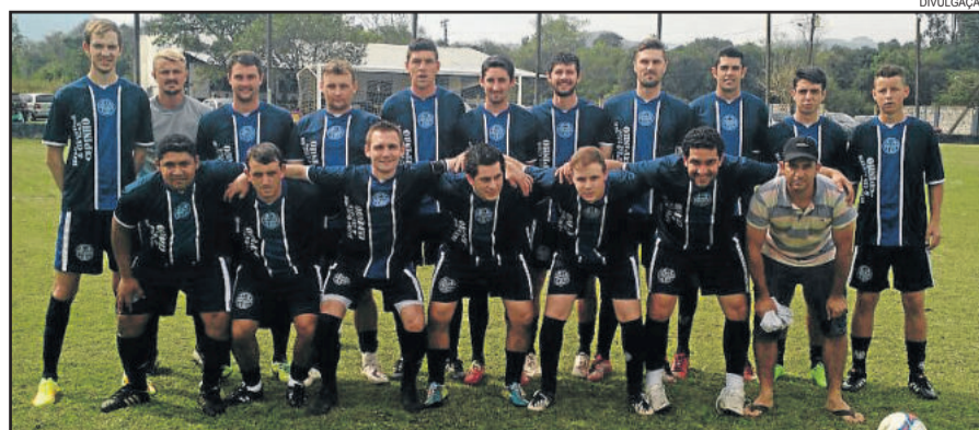
Alto Taquari de Teutônia

Para fechar a primeira fase, Atlético Gaúcho e Independente, que voltaram a vencer neste domingo, se enfrentam na rodada restante e vão definir a primeira colocação. O primeiro colocado pegará o quarto na semifinal, enquanto que segundo e terceiro se enfrentam na outra semifinal.