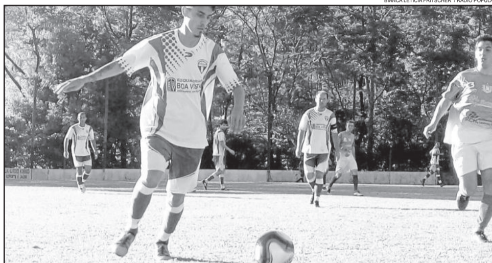
11 Amigos e 7 de Setembro ficaram no empate sem gols e vaga será decidida nos 90 minutos em Capitão

No segundo tempo, o 7 de Setembro pressionou mais, pois precisava vencer pa-