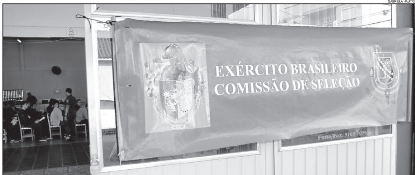
Seleção ocorreu na quinta e sexta-feira, no Bairro Languiru

Os candidatos que forem considerados aptos na seleção geral vão ser distribuídos em organizações militares da Marinha, do Exército e da Força Aérea. Após mais uma seletiva, os que permanecerem serão incorporados a uma das três Forças Armadas.