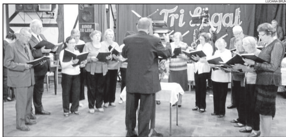
Coral Misto União festejou 121 anos de história

ções em bailes, cultos, festas e também cantam nos velórios de seus associados.