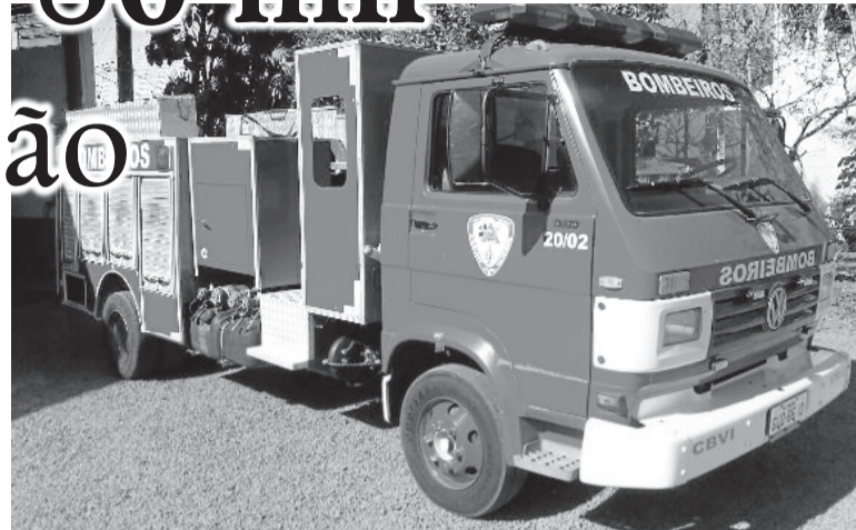
Veículo é menor e mais rápido que o atual caminhão da corporação

O caminhão a ser adquirido é um Volkswagen, ano 1998, mais rápido e menor do que o atual veículo usado pela corporação. Nele cabem 1.200 litros de água. No caminhão antigo, ano 1977, é possível carregar 5 mil litros, porém, para se locomover demora muito mais tempo. "A primeira coisa é que teremos um atendimento mais rápido e com isso acredito que estamos entrando em uma nova era e a tendência é só melhorar", pondera Marques.