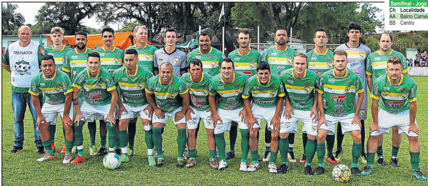
Palanque conquistou a vaga na semifinal e enfrentará o invicto União Carneiros

Oito diferentes comunidades estarão envolvidas nas semifinais de Aspirantes e Titulares