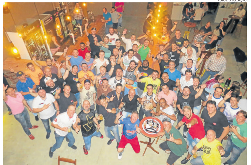
Comunicadores de 13 emissoras presentes