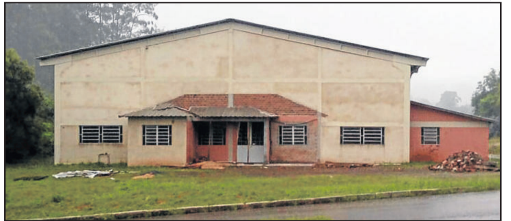
Barracão Industrial fica localizado na Avenida Um Leste, próximo a Associação de Funcionários da Prefeitura

Para o prefeito Jonatan Brönstrup, o espaço é uma forma de contribuir com toda a comunidade. “Em um momento delicado da economia, precisamos oferecer oportunidades para gerar emprego e renda. Se as pessoas estiverem felizes, teremos uma comunidade com melhor qualidade de vida,” atesta.