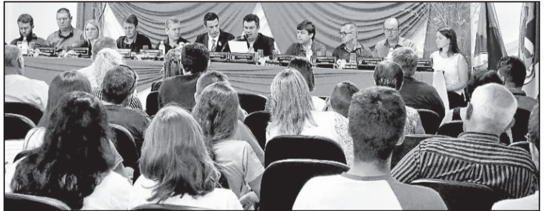
Sessão da Câmara foi realizada no Iecceg