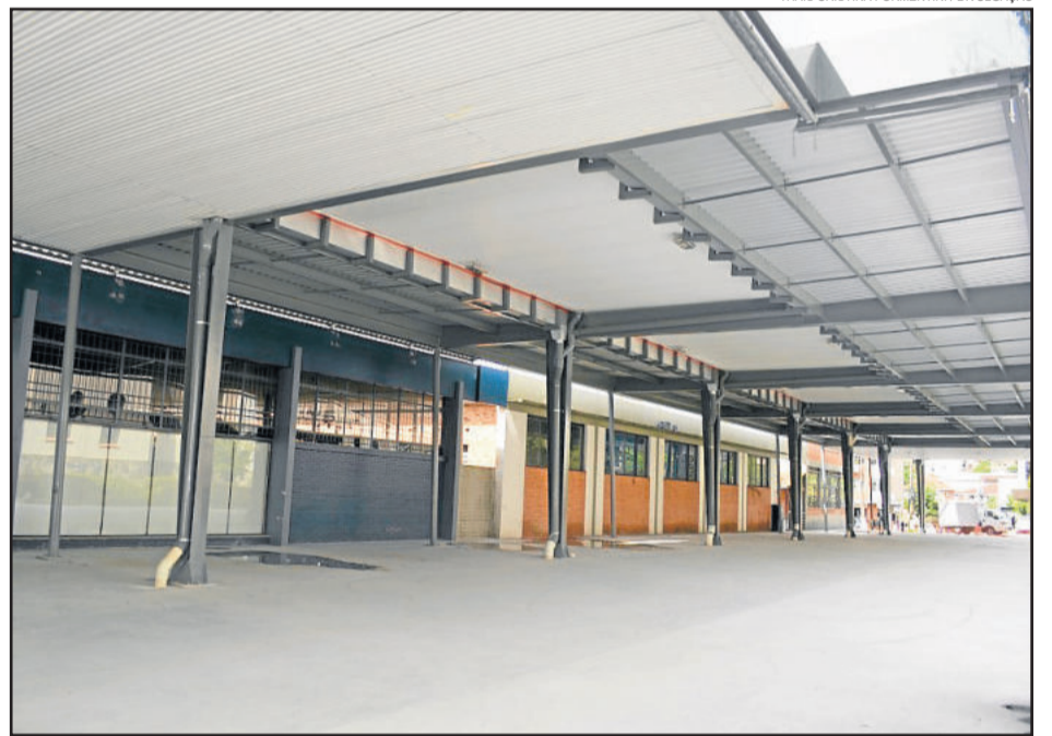
Melhorias visam proporcionar conforto para a comunidade barbosense

O evento é realizado pela Prefeitura de Carlos Barbosa, através da Fundação de Cultura e Arte - Proarte, em parceria com o Serviço Social do Comércio - SESC e a S&S Eventos. Além disso, tem patrocínio de Skill Idiomas e Siredi e apoio do Grupo Adylnet Telecom, Dokeno Móveis, Hotel São Carlos e Tramontina.