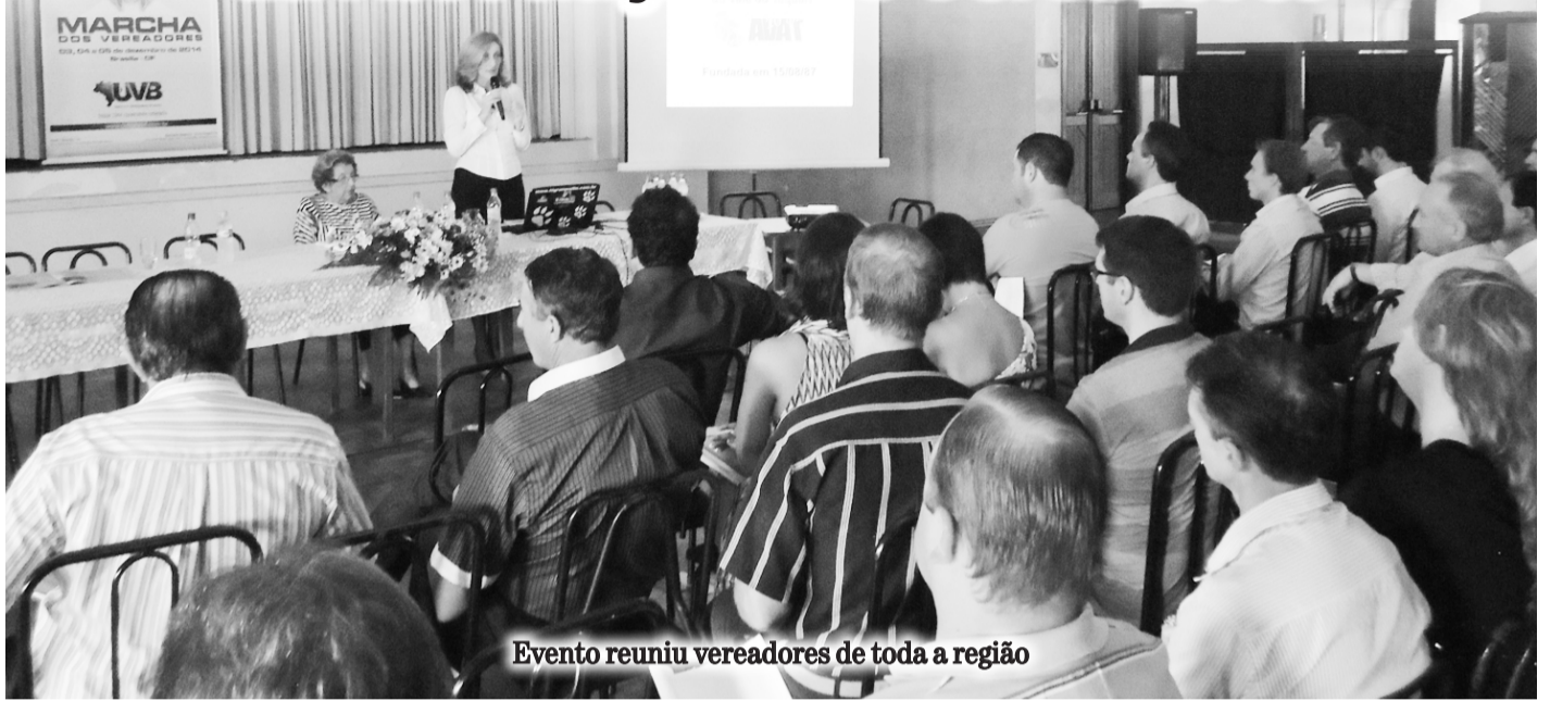
Evento reuniu vereadores de toda a região