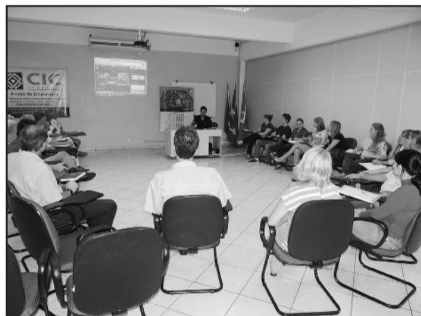
Reunião da comissão geral da Festa de Maio