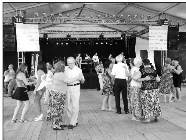
Baile da Terceira Idade animou os idosos