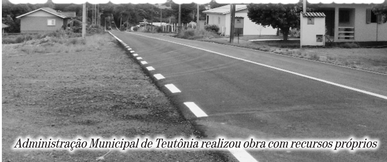
Administração Municipal de Teutônia realizou obra com recursos próprios

A equipe de obras da Conpasul concluiu no dia 28 de fevereiro a penúltima etapa das obras de recuperação da Estrada de Linha Wink. A colocação da capa final de 3,5 centímetros de asfalto deixou o trajeto de 5,2 Km totalmente recuperado. Na sexta-feira passada, dia 7, iniciou a etapa de sinalização horizontal e vertical, com a instalação dos quebra-molas. Por isso, os motoristas ainda devem ter muito cuidado.