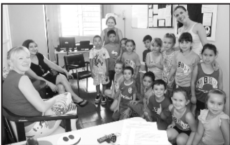
Na volta às aulas, alunos da EMEF Guilherme Sommer tiveram ambiente renovado