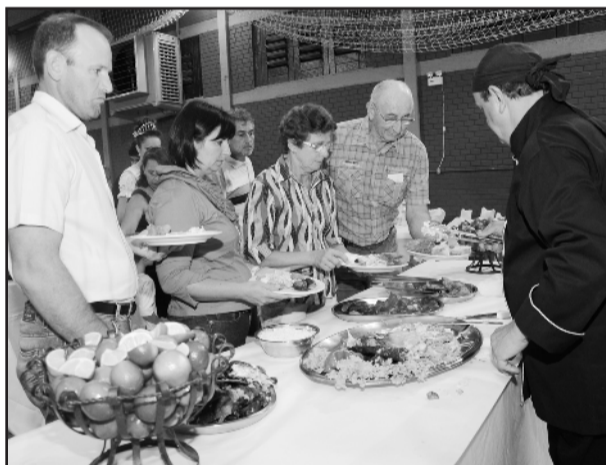
Três toneladas de peixe foram consumidas no evento