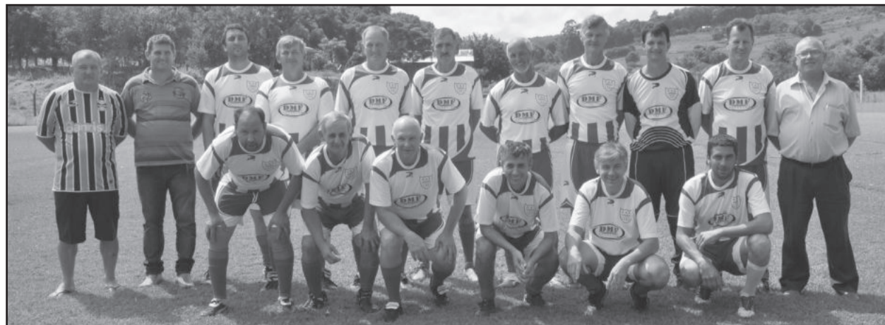
Parte do time do União campeão da Segunda Divisão do Campeonato de Futebol Amador de Teutônia de 1988