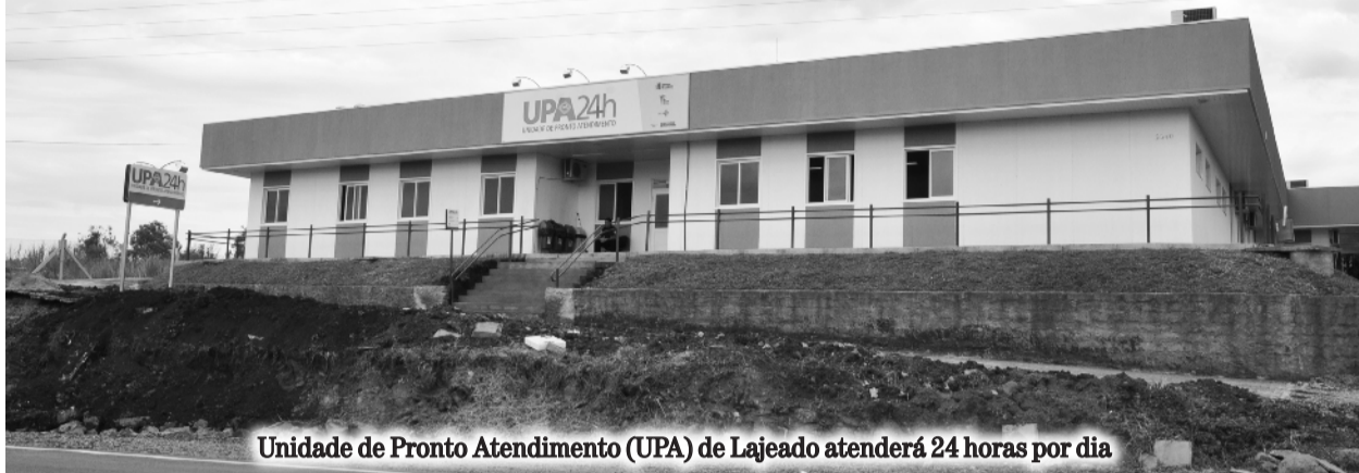
Unidade de Pronto Atendimento (UPA) de Lajeado atenderá 24 horas por dia

Lajeado conta desde ontem, dia 10, com a Unidade de Pronto Atendimento (UPA) 24 horas. A solenidade de inauguração ocorreu na tarde de ontem e reuniu autoridades e comunidade. A UPA, que é a nona inaugurada no Estado, já passa a realizar atendimentos a partir de hoje, dia 11.