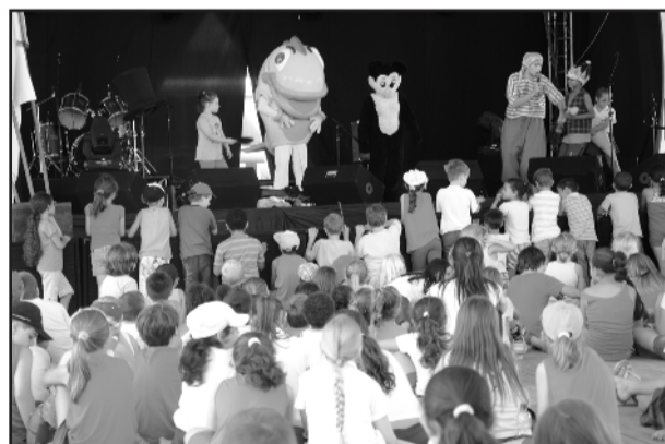
Sexta-feira à tarde foi de programação para a criança