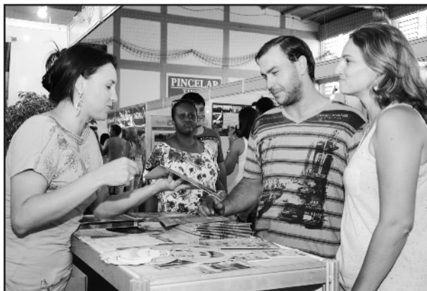
Mais de mil pessoas informaram-se sobre os roteiros da região