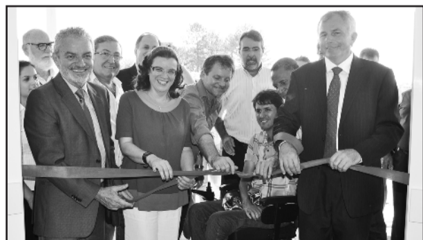
UPA Lajeado foi inaugurada na tarde de ontem

O processo de implantação da UPA, que custou mais de R$ 3,7 milhões (mais de R$ 2 milhões estaduais), iniciou com a obra física. O Estado licitou a obra e acompanhou a construção. Os recursos empregados foram federais e estaduais, ficando a cargo da Prefeitura a destinação do terreno e a preparação do mesmo.