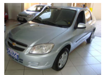
Prisma LT 1.4 R$ 27.800,00

Aberto de segunda a sexta das 8h às 18h30min. Sem fechar ao meio dia e nos sábados das 8h às 16h.