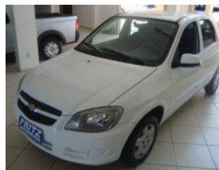
Celta LS 1.0, 4PI R$ 23.500,00