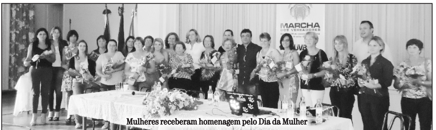
Mulheres receberam homenagem pelo Dia da Mulher