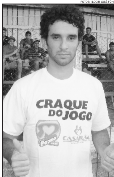
Robinho foi o craque do jogo