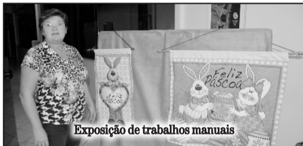
Exposição de trabalhos manuais