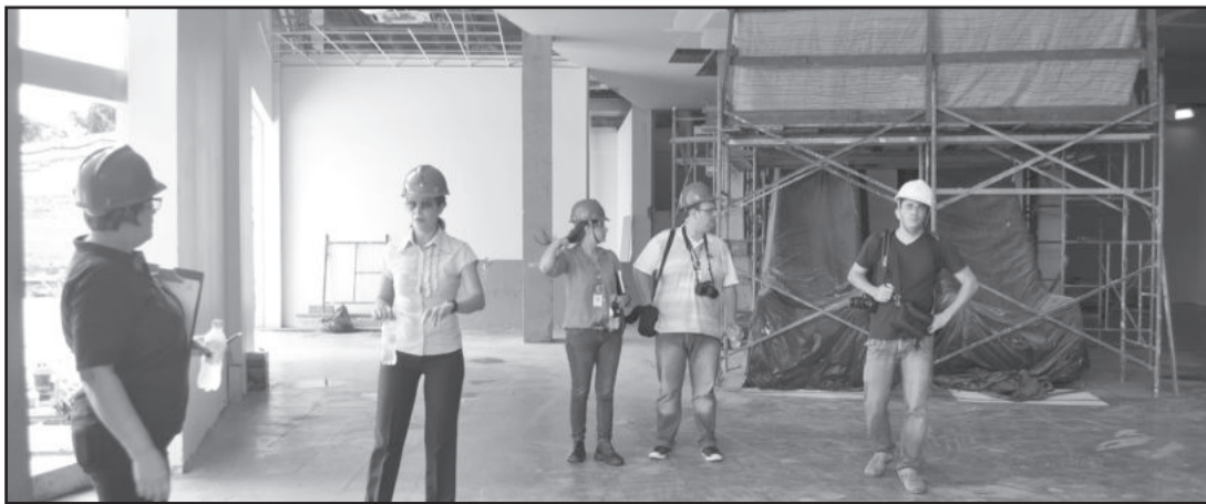
Nova biblioteca também contará com exposições culturais

Monitores serão treinados para atender os visitantes. Eles estarão no local de segunda a sexta-feira, durante os três turnos, e nos sábados pela manhã. Escolas e grupos - de até 20 pessoas - interessados em visitar a mostra terão a oportunidade de agendar dia e horário com o Núcleo de Cultura da Instituição. Além disso, a exposição estará aberta para visitação individual, onde não se faz necessária a presença de um monitor. O agendamento de grupos e mais detalhes podem ser obtidos através do e-mail nucleodecultura@univates.br.