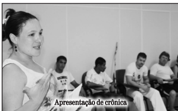
Apresentação de crônica