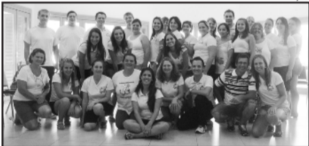
Professores e funcionários da EMEF Guilherme Sommer realizaram encontro de preparação