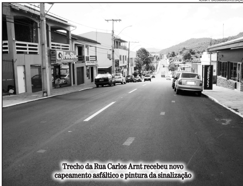
Trecho da Rua Carlos Arnt recebeu novo capeamento asfáltico e pintura da sinalização

A empresa Conpasul concluiu no final de fevereiro a recuperação e a colocação da nova capa asfáltica no trecho da Rua Carlos Arnt, no Bairro Canabarro. São 1.174 metros (1,1 Km) de extensão, por 9,20 metro de largura, desde a ponte sobre a ferrovia até a Rua Osmino Hunsche. Na semana passada, a empresa realizou a pintura da sinalização horizontal de pista e também implantou o restante da sinalização vertical no trajeto.