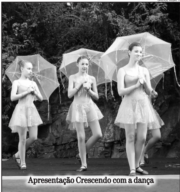
Apresentação Crescendo com a dança

As ações contaram com apoio da Livraria Lappel, Clube 31 de Outubro, Carla e Rosângela Arquitetura e Urbanismo e Rádio Garibaldi. A programação completa do Mês da Mulher pode ser vista no site www.apeme.com.br . Mais informações pelo fone (54) 3462 2755 ou pelo e-mail apeme@apeme.com.br .