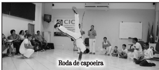
Roda de capoeira