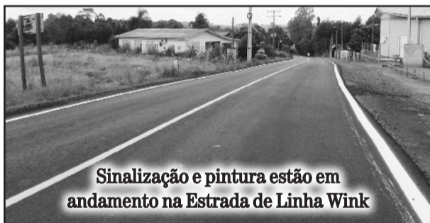
Sinalização e pintura estão em andamento na Estrada de Linha Wink