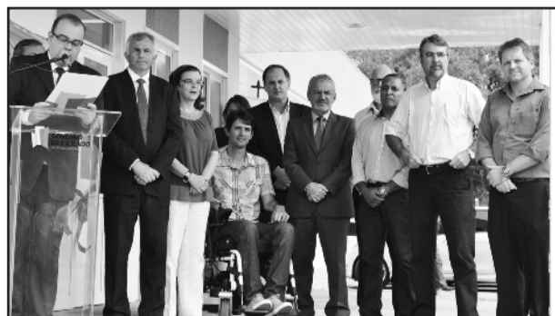
Autoridades acompanharam a solenidade de inauguração

Após os pronunciamentos, houve o descerramento da placa, desenlace da fita inaugural e os presentes puderam conhecer a estrutura da UPA Lajeado.