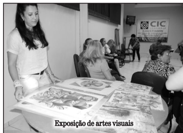
Exposição de artes visuais