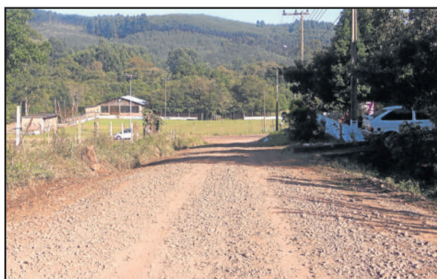
Rua José Luiz da Silva

Secretaria de Estado da Cultura apresenta