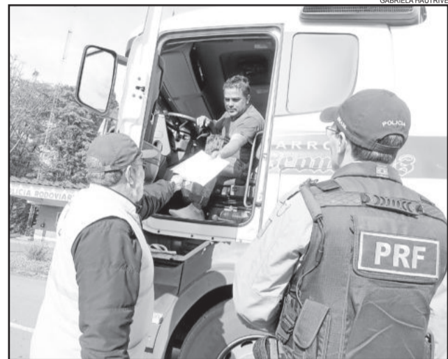
Fiscalização nesta sexta-feira foi realizada na BR-386, em Lajeado

Também são vistoriados os equipamentos de emergência e segurança. “O conhecimento da carga transportada nós também averiguamos. Se o veículos estiverem irregular, é feita uma multa administrativa de responsabilidade das empresas. Após registro, veículo e motorista são liberados.” Segundo Carvalhal, o caminhão e condutor só são detidos caso as irregularidades coloquem em risco a vida de alguém. “Se tiver algo errado que possa causar um acidente de trânsito, a PRF tem autoridade para reter o veículo. Se for apenas multa administrativa, preenchemos o