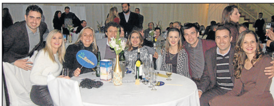
Turma da Sicredi fazendo a festa no Baile do Rotary