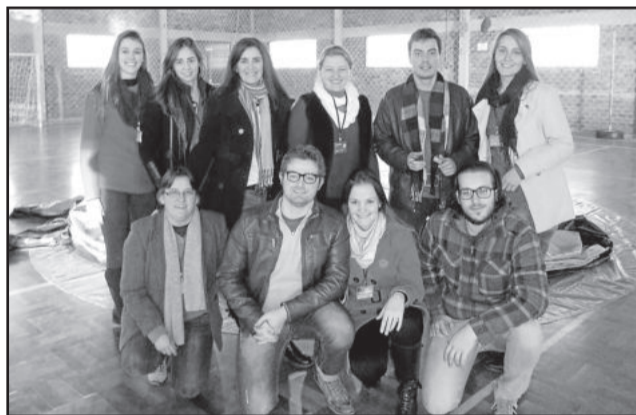
Equipe da Univates que trabalhou com os alunos