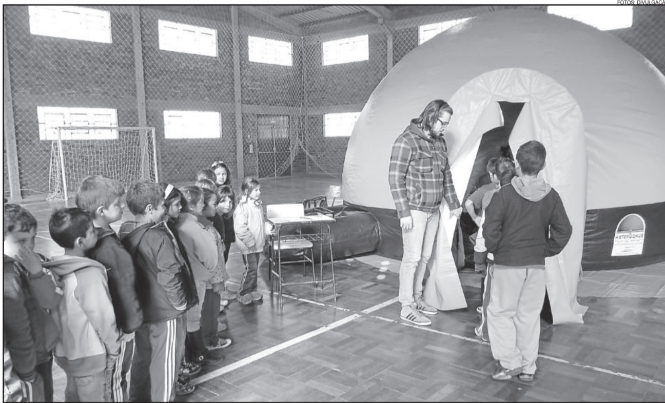
Crianças conheceram o planetário que foi montado no ginásio da escola