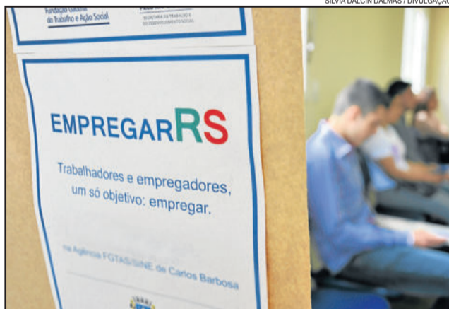
Evento acontece na próxima sexta-feira, dia 17