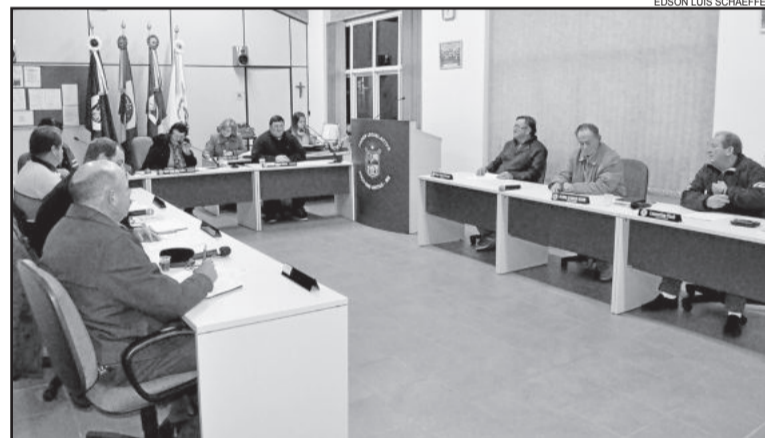
Durante sessão do dia 6, projeto foi rejeitado por todos os vereadores

Os vereadores voltam a se reunir dia 20 de junho, às 19 horas.