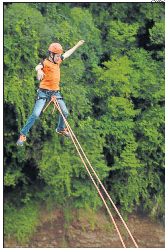
Pêndulo humano será o esporte de aventura oferecido neste domingo

A K2 Aventuras do Vale é uma equipe de esporte de aventura, registrada e devidamente treinada. O objetivo é possibilitar a outras pessoas a oportunidade de se aventurarem na natureza, explorando seus mais diversos terrenos, respeitando a fauna e a flora do local.