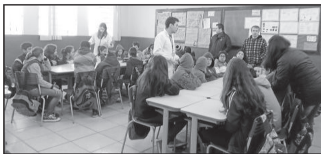
Alunos participaram de oficinas

escolar básico e corroborando com ações que a escola já vem realizando a anos nas áreas de Ciências e Tecnologia”, avalia. Segundo ela, os alunos receberam muito bem as oficinas. “Os alunos ficaram encantados, envolvidos e instigados com os desafios propostos e os conhecimentos práticos adquiridos, atingindo plenamente o objetivo proposto pela escola ao tomar essa iniciativa e evidenciando o compromisso da educação com uma aprendizagem significativa”, conclui.