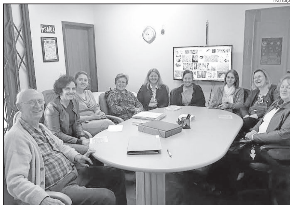
Reunião do Conselho Consultivo da Arca