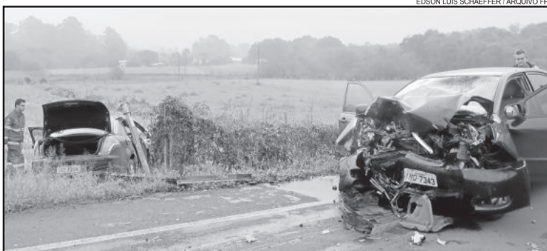
Acidente na Estrada Velha dia 24 de julho resultou em uma morte

Segundo a Brigada Militar, o Corolla vinha de Canabarro, perdeu o controle, invadiu a pista contrária e bateu de frente com o C4. O Toyota rodopiou e ficou virado no sentido a Canabarro. O C4 foi projetado para fora da pista, em uma área rural.