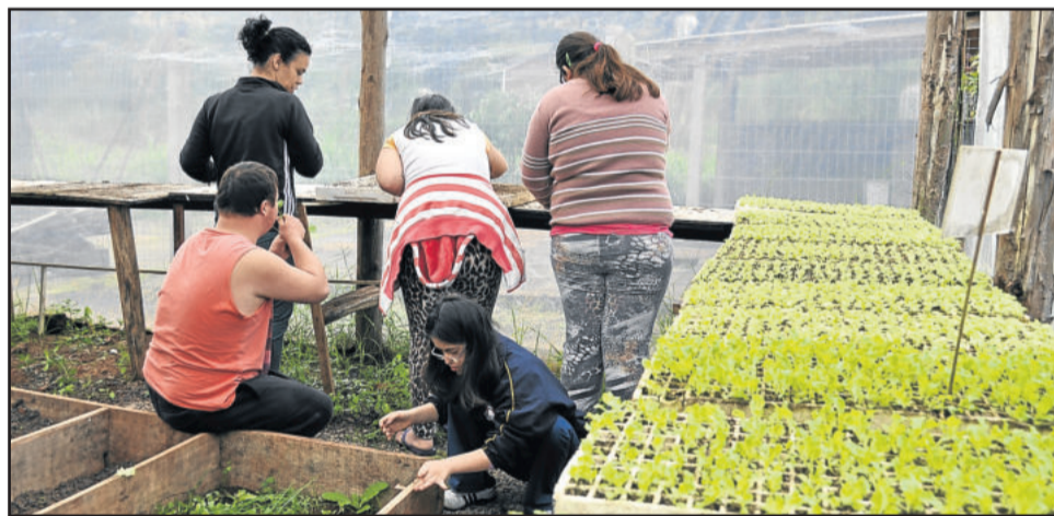
Produção de mudas é feita pelos próprios alunos da Apae