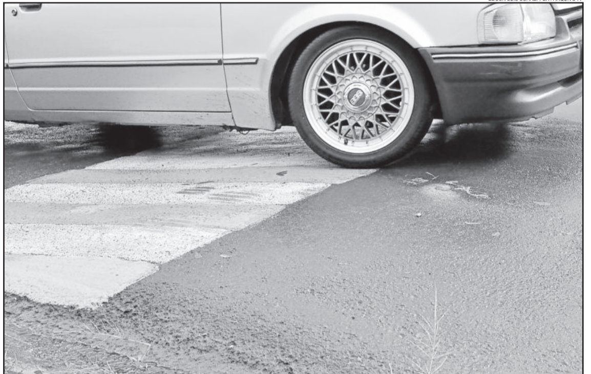
Nos últimos 12 meses, 15 travessias elevadas foram instaladas. Apesar disso, seis mortes