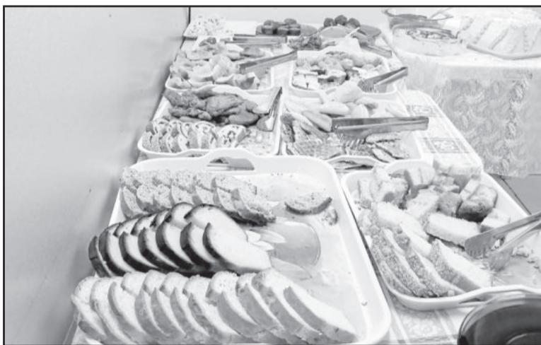
Delícias coloniais estavam à disposição dos visitantes