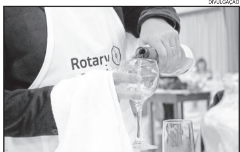
9ª edição do evento

Os valores arrecadados com o evento serão revertidos à Fundação Rotária.