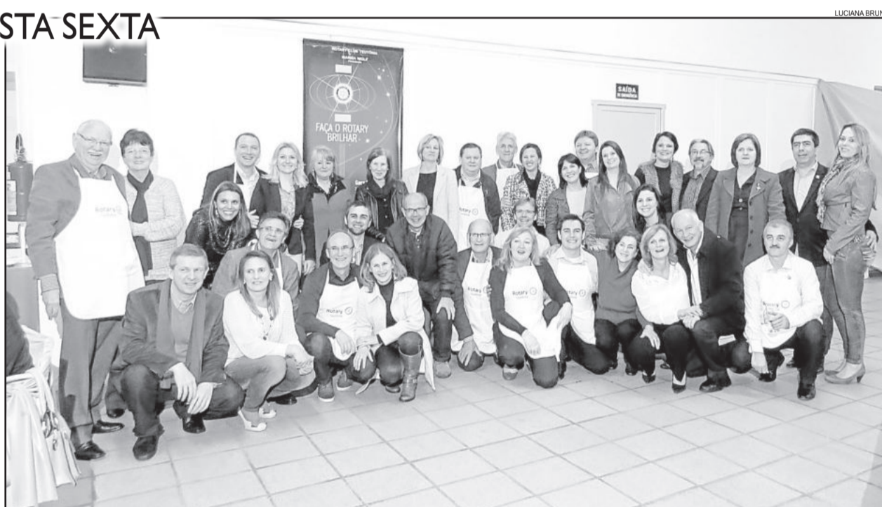
Grupo de rotarianos de Teutônia no evento do ano passado