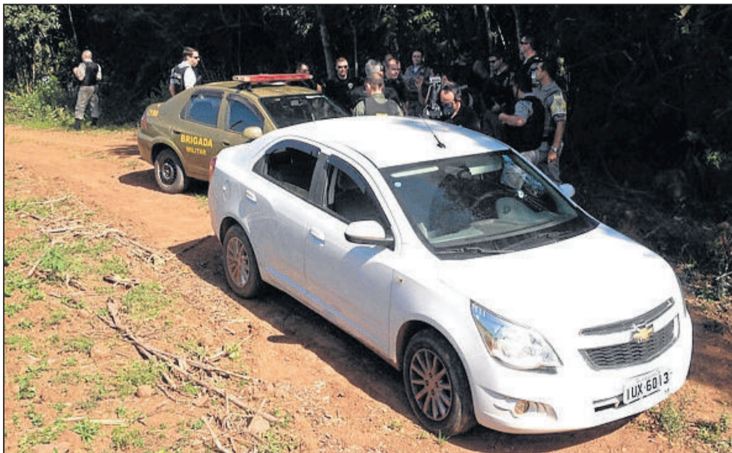
Veículo Cobalt foi encontrado nas proximidades de Boa Vista 37 Policiais planejam tática de campo

A ação ocorreu entre 11h30min e 12 horas de ontem, dia 10, quando bandidos entraram atirando nos bancos Bradesco e Banrisul, além de uma lotérica no Centro do Município. Um cordão humano foi formado com funcionários e moradores para bloquear a rua central enquanto os assaltantes agiam. Momentos de tensão com centenas de tiros em diferentes direções. A ação criminosa teria durado 30 minutos.