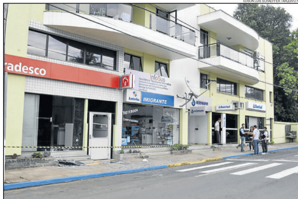
As duas agências bancárias ficam no mesmo prédio

O acusado foi levado até a Delegacia de Polícia de Teutônia e, após o flagrante, conduzido ao Presídio Estadual de Lajeado. A ocorrência foi registrada na Delegacia de Polícia de Teutônia, que responde por Imigrante.