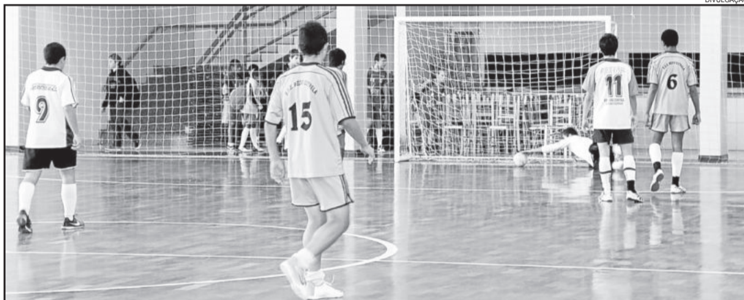
Nesta semana jogam as categorias mirim e juvenil masculino e juvenil feminino

No infantil masculino são três chaves, com nove equipes. A chave A tem as equipes do Colégio