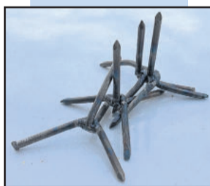
Polícia encontrou touca, miguelitos, armas, munições, cartuchos deflagrados e dinheiro