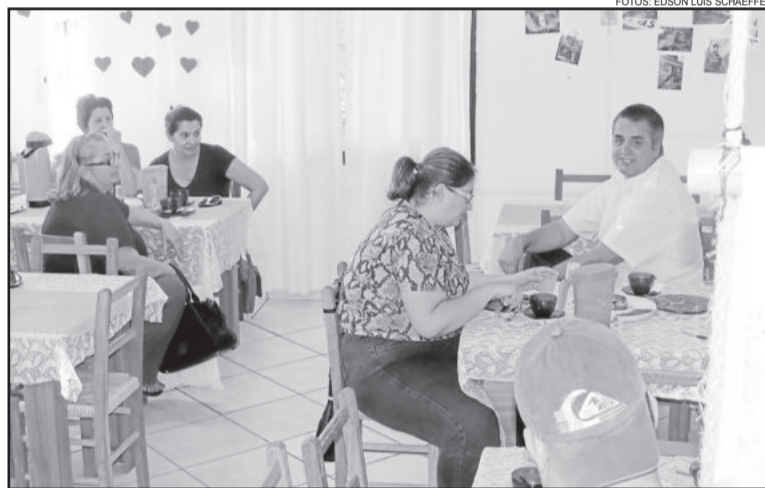
Comunidade local e turistas puderam degustar o Café da Colônia