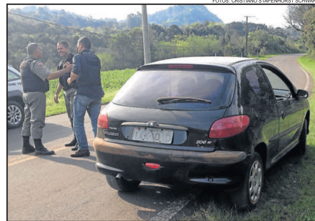
No Peugeot 206, mulher de 22 anos foi presa