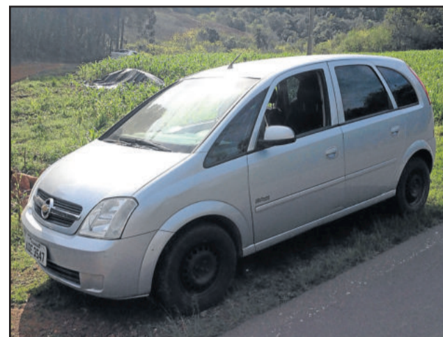
Meriva também foi abordada e homem preso