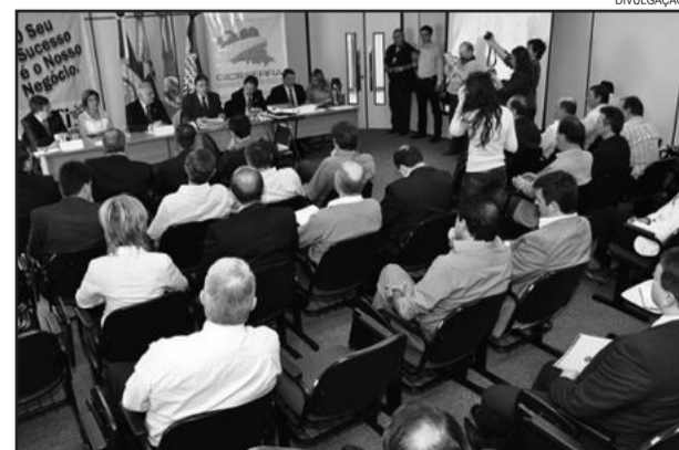
Estradas da região não devem receber grandes investimentos a curto prazo

disse que existe um grande descompasso entre o desenvolvimento econômico, social e cultural da região e sua estrutura viária. “Temos índices de desenvolvimento de 1º mundo rodando em estradas africanas e não sei se as estradas africanas não são melhores que as nossas. Para os próximos 15 ou 20 anos temos que nos preparar, porque vamos sofrer e perder espaço para Estados do Norte e Nordeste. Isso tudo por desmandos dos governos dos últimos anos”, comentou.