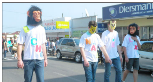
Extinção de animais é outro grande problema ambiental enfrentado atualmente