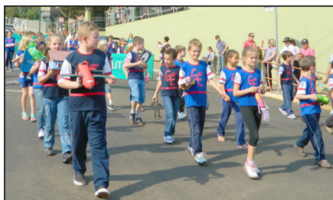
Alunos produziram brinquedos com lixo