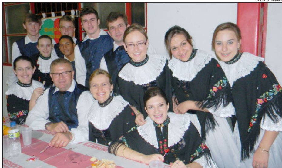
Westfälische Tanzgruppe representou Westfália no Encontro Folclórico em Maratá

População - 2.546 habitantes Área - 80,354 Km² Gentílico - Marataense Mesorregião - Montenegro Mesorregião - Metropolitana de Porto Alegre Distância de Porto Alegre - 80 Km