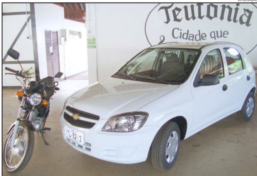
Carro e Moto para o sorteio da campanha Teutônia Encanta

Adquirido via pregão eletrônico da empresa J.A. Spohr (apresentou o menor preço), de Lajeado, o veículo será sorteado no dia 27 de dezembro, em evento especial a partir das 20 horas, no Centro Administrativo. Nesta mesma noite também haverá o sorteio de uma motocicleta, 150 cilindradas, zero quilômetro. As empresas que tiverem fornecido as cautelas sorteadas com a motocicleta e o automóvel recebem, cada uma, um netbook.