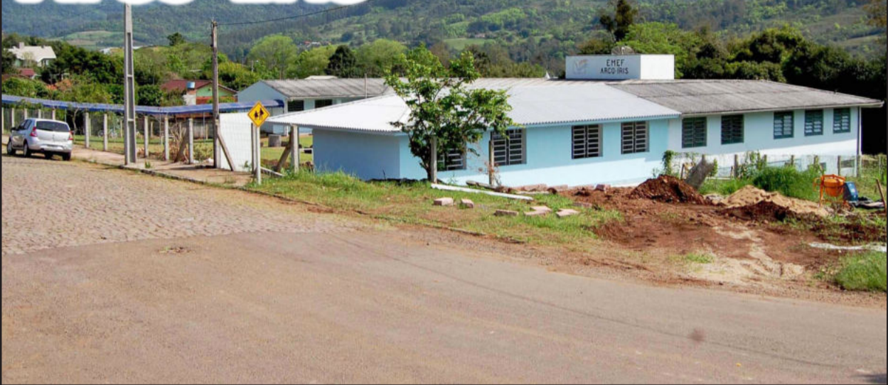
Escola Arco-Íris na sede do município

P ara atender a demanda, a ampliação da Escola Municipal de Ensino Fundamental Arco-Íris, da sede, em Imigrante, está em fase de conclusão. A obra, que esta sendo executada pela empresa Gegê Construções, consta de mais duas salas de aula, totalizando essa melhoria 129 metros quadrados. O investimento é de R$ 118.368,88 com recursos de R$ 100 mil da União, através de emenda da deputada Maria do Rosário, do PT, e hoje conduzindo as ações da Secretaria de Direitos Humanos da Presidência da República. A contrapartida de R$ 18.368,88 é da Prefeitura Municipal de Imigrante.