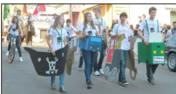
Meios de transportes sustentáveis foram apresentados ao público como uma alternativa para diminuir o efeito estufa