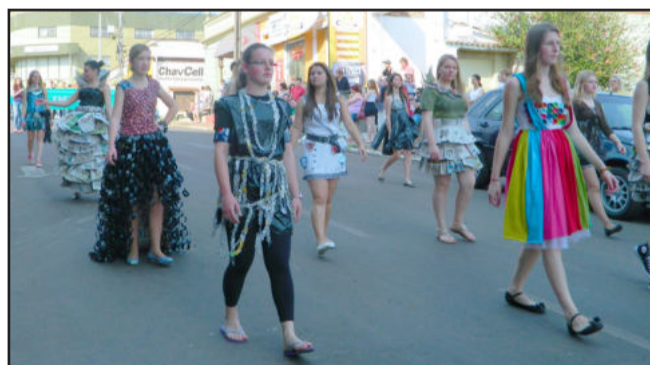
Equipes da gincana foram desafiadas a produzirem peças de roupas com lixo