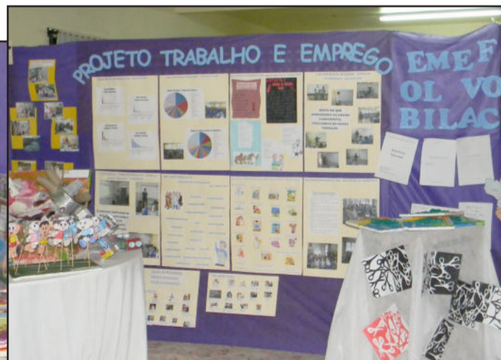
Exposição de trabalhos das escolas do município também fez parte da 4ª Feira do Conhecimento