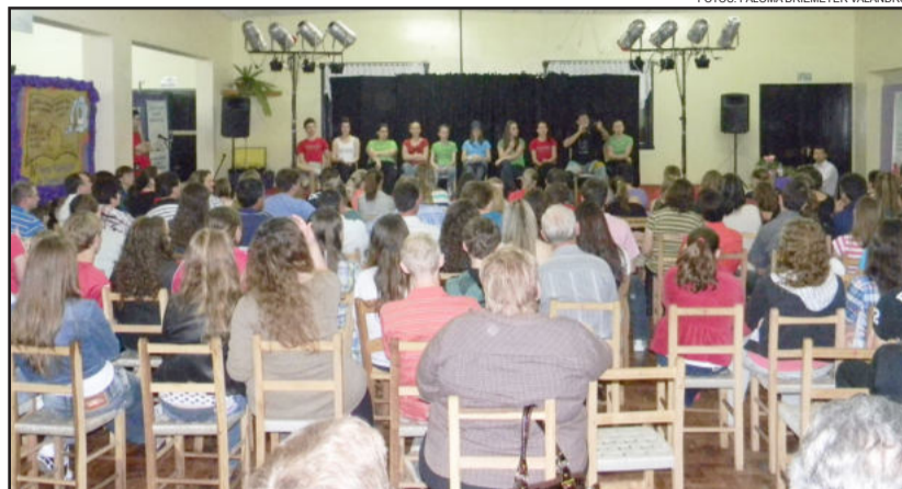
Momento de diálogo entre integrantes do grupo teatral e comunidade

A peça teatral já foi assistida por mais