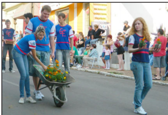
Mudas de plantas foram entregues ao público que acompanhou o desfile