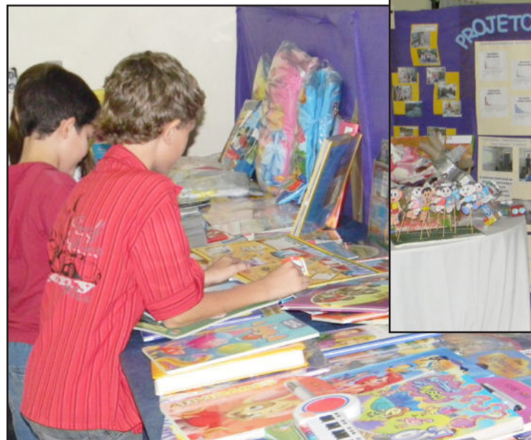
Evento também contou com Feira do Livro, que encantou as crianças