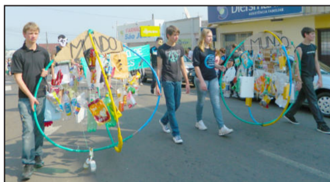
Produção de lixo foi lembrada pelos alunos como um dos problemas ambientais enfrentados atualmente