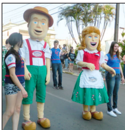
Mascotes Tê e Tônia participaram do desfile