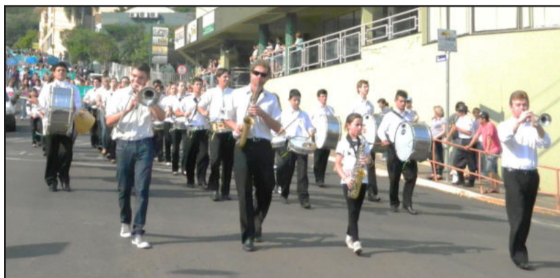
Uma das atrações do desfile foi a Banda Marcial da escola

"Com o nosso desfile queremos saudar a nossa natureza e ao mesmo tempo cobrar de nós uma melhor preservação dos recursos naturais. Esse pode ter sido o desfile menos sem brilho que já realizamos, mas, com certeza, foi o desfile mais consciente que já fizemos, já que