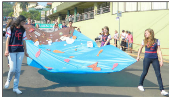
Poluição da água foi lembrada pelos alunos