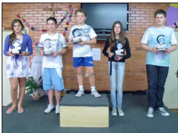
Vencedores da categoria até 14 anos