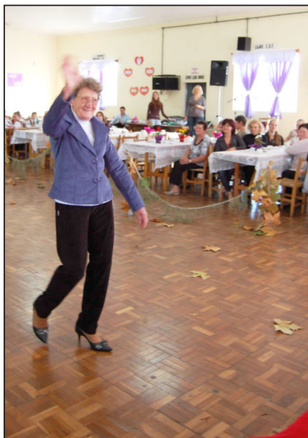
A "Super Rita" desfila em homenagem às mães

E no final desse bate-papo já enumerava verbalmente os próximos compromissos: sábado, dia 8, trabalhar no jantar-baile do Centro Comunitário da Seca Baixa; domingo, dia 9, cantar no Encontro de Corais, na Fazenda Lohmann; dia 15, cantar no Encontro de Corais, na Linha Germano; dia 22, cantar no Encontro de Corais, em Roca Sales.