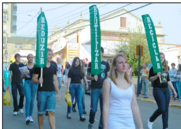
Consumo consciente foi mostrado pelos alunos