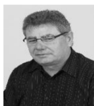
Situação do Registro APTO (Deferido)

Nome para urna eletrônica: Nome completo: Data de nascimento: Nacionalidade: Grau de instrução: End. do site do candidato: