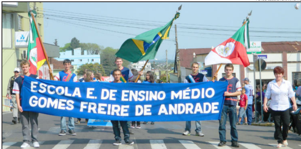
O tempo colaborou e o Desfile Cívico de 7 de Setembro da Escola Gomes Freire de Andrade foi um sucesso

O céu azul, o sol radiante e o calor agradável da manhã de 7 de setembro, feriado nacional da Independência, fizeram um grande público prestigiar o tradicional Desfile Cívico de 7 de Setembro da Escola Estadual de Ensino Médio Gomes Freire de Andrade, do Bairro Languiru, em Teutônia. Pontualmente às 9h30min, como estava programado, a Banda Marcial da escola deu o tom e iniciou o desfile que durou cerca de uma hora.