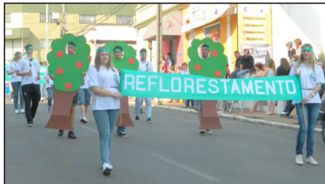
Reflorestamento foi apresentado como uma alternativa ao problema do aquecimento global