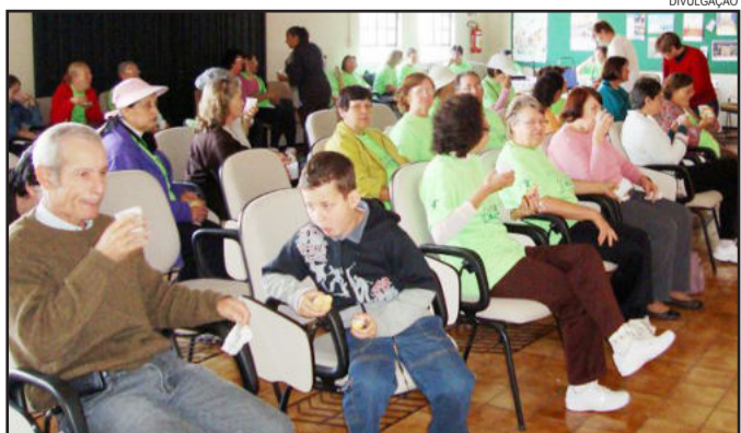
Participantes do projeto Viva Melhor tiveram encontro de integração