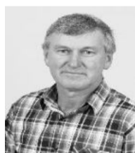
Situação do Registro APTO (Deferido)

Partido: Partido dos Trabalhadores - PT - (13) Coligação: TODOS POR WESTFÁLIA Composição da coligação: PP / PT / PMDB Cargo a que concorre: Prefeito (WESTFÁLIA) No. Processo/Protocolo: 67-67.2012.6.21.0125 / 366242012