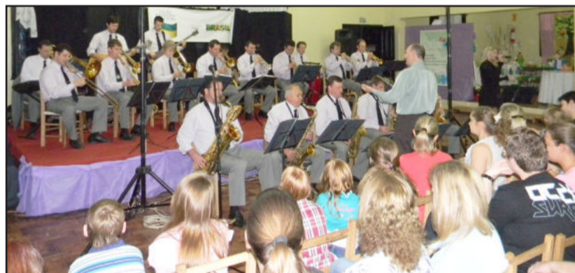
Orquestra Municipal de Imigrante abriu apresentações na noite de quinta-feira

Sieben ainda elogiou a peça encenada pelo Grupo RUAH. "É um exemplo. O teatro sobre drogas, que é uma grande problema hoje, foi ótimo. Agradeço a presença de toda a comunidade, alunos do Ensino Médio de Westfália e Imigrante, que vieram prestigiar a feira, e demais estudantes, para que o nosso evento tenha se tornado, de novo, um sucesso", encerrou o secretário.