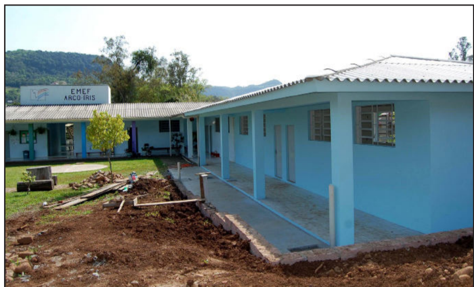
Arco-Íris amplia com mais duas salas de aula

No setor de fundos dessa mesma escola será construída uma quadra de esportes, com investimento no valor de R$ 52.664,62. A quadra será