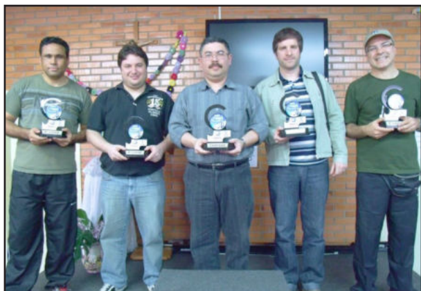
Vencedores categoria Livre