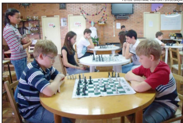
Torneio reuniu 18 competidores