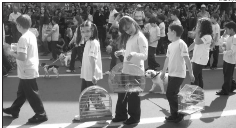
Responsabilidade de se ter um animal de estimação

necessários ao adotar um animal e conscientizar sobre a importância da adoção.