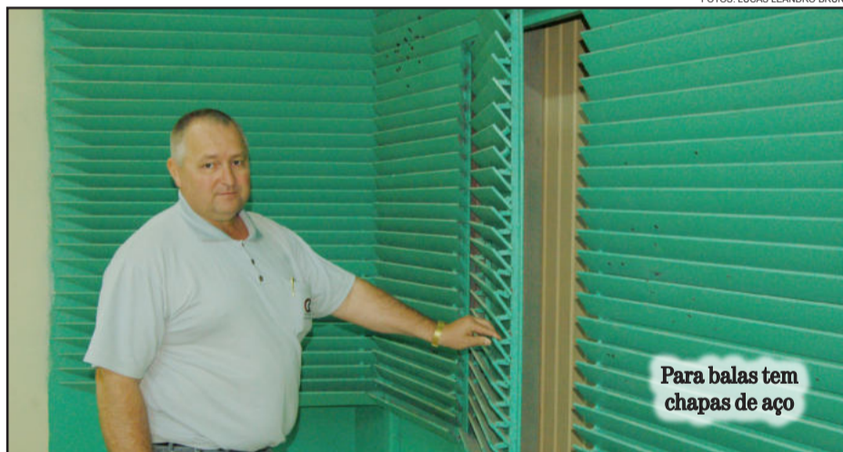
Para balas tem chapas de aço

Ao meio-dia de domingo será servido almoço, na Associação da Água, com a entrega da premiação para os melhores do Torneio de Inauguração do Departamento de Tiro da Associação União. O apoio é do Sicredi e da Rádio Popular FM.