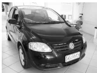
Fox 1.0 Trend R$ 23.900