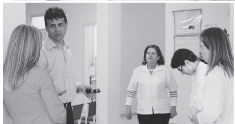
Em visita ao Posto São Francisco, prefeito em exercício conversou com profissionais