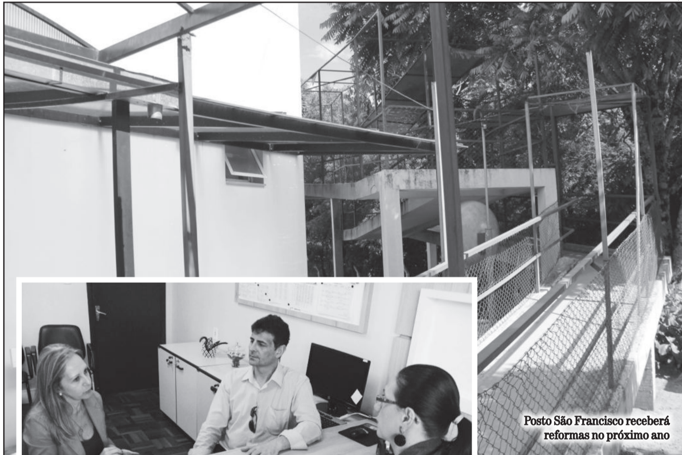
Posto São Francisco receberá reformas no próximo ano