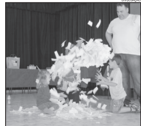
Sorteio da Ação entre amigos CPM EMEF prof. Teobaldo Closs