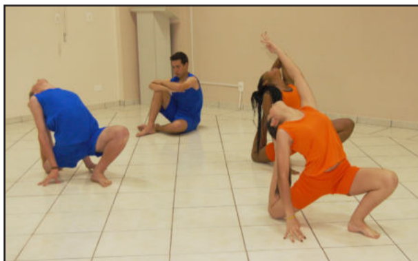
Performance de yôga