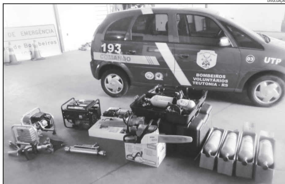
Novos equipamentos auxiliarão no trabalho do Corpo de Bombeiros Voluntários de Teutônia