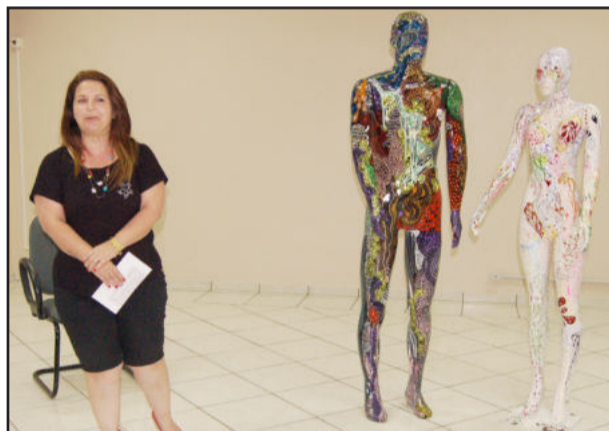
Artista plástica apresentou suas obras