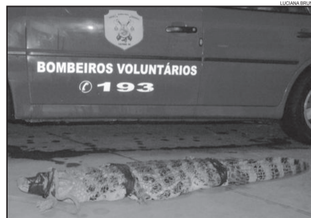
Jacaré após a chegada ao local na noite de domingo

De acordo com o Grupamento Ambiental, não houve outros registros desses na região. “Isso nos leva a crer que realmente tenha tido um cativeiro. O que se sabe é que tem espécies de jacaré entre Taquari e General Câmara, mas no restante da região não.” O telefone da Patram é 3720-1318.