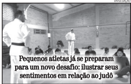
Pequenos atletas já se preparam para um novo desafio: ilustrar seus sentimentos em relação ao judô

As datas de entrega e divulgação do resultado devem ser definidas em breve.