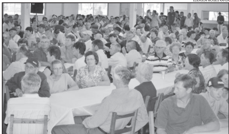
Evento de aniversário é tradicional na Cooperativa Languiru

Nesta quarta-feira, dia 13 de novembro, a Cooperativa Languiru comemora 58 anos. Para marcar a data histórica, a cooperativa realiza evento especial na Associação dos Funcionários. A programação inicia às 10h e o encerramento será após o almoço.