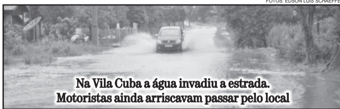
Na Vila Cuba a água invadiu a estrada. Motoristas ainda arriscavam passar pelo local

A comissão da Defesa Civil de Teutônia estava atenta às situações de risco e aos pontos mais vulneráveis. Duas famílias de Posses se negaram a sair de casa. Outras situações do Travessão, da Várzea e da Cuba foram monitoradas. Um grupo está de prontidão para fazer a remoção caso seja necessário. O ginásio da Escola Municipal Guilherme Sommer, na Vila Popular, foi preparado para receber, caso necessário, famílias desabrigadas.