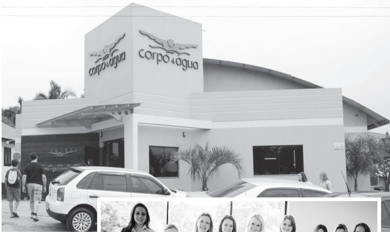
Novas instalações estão situadas na Rua Guilherme Brust, em Languiru

Com uma estrutura moderna e profissionais qualificados, a Corpo e Água oferece a oportunidade de praticar exercícios para garantir saúde e bem-estar. A empresa está localizada na rua Guilherme Brust, 17, Bairro Languiru. Os fones para contato são 3762-2272 e 8138-7910.