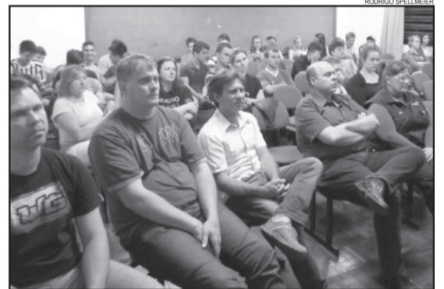
Audiências ocorreram nos dias 6 e 7 de novembro

Para o mês de dezembro estão previstas novas audiências públicas, desta vez para apresentação dos prognósticos, com as propostas de melhorias e ampliações a serem efetuadas a curto, médio e longo prazo (quatro, oito e 20 anos). Os locais, datas e horários das novas audiências ainda não estão definidos.