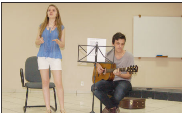
Irmãos Mattiello apresentaram músicas