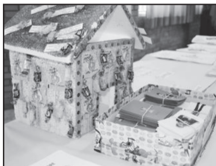
Trabalhos realizados pelos professores foram expostos

O Pacto trata de um compromisso formal dos municípios em assegurar que todas as crianças sejam alfabetizadas até os oito anos de idade. As ações iniciaram com formação de professores alfabetizadores. No ano de 2013 os professores foram capacitados em Língua Portuguesa e no ano de 2014 serão capacitados em Matemática.