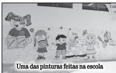
Uma das pinturas feitas na escola