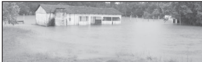
Campo do Bangu, nas Posses, ficou abaixo da água