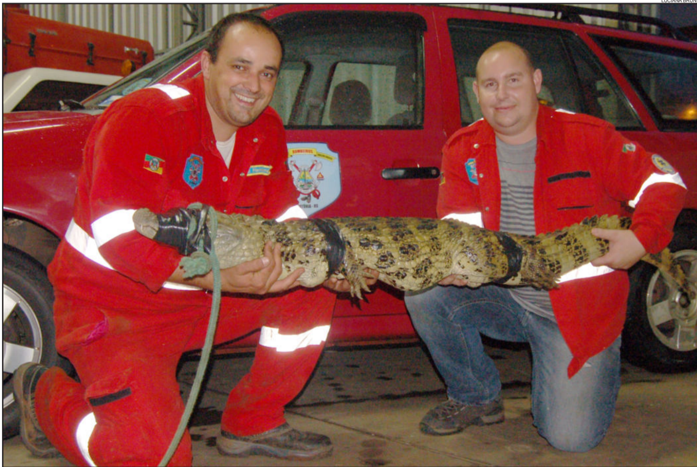
Jacaré da espécie papo-amarelo foi capturado por voluntários no domingo, dia 10, em Linha Gamela, interior de Teutônia. Página 5

Comunicamos que em razão do feriado de Proclamação da República, comemorado na sexta-feira, dia 15 de novembro, a Folha Popular circulará com edição unificada na sexta-feira, dia 15, e sábado, dia 16, com fechamento na quinta-feira, dia 14. Portanto, fotos de homenagens para o Caderno Inclusive devem ser enviadas até as 9 horas da manhã de quarta-feira, dia 13, e publicações legais podem ser encaminhadas até as 17 horas de quinta-feira, dia 14.