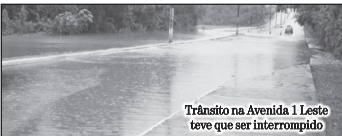
Trânsito na Avenida 1 Leste teve que ser interrompido

Em Lajeado, conforme controle do Centro Universitário Univates, a chuva até as 19 horas de ontem, foram contabilizados 140mm de chuva somente nesta segunda-feira.