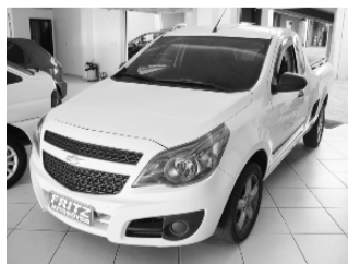
Montana LS 1.4 R$ 31.800