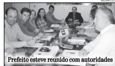
Prefeito esteve reunido com autoridades