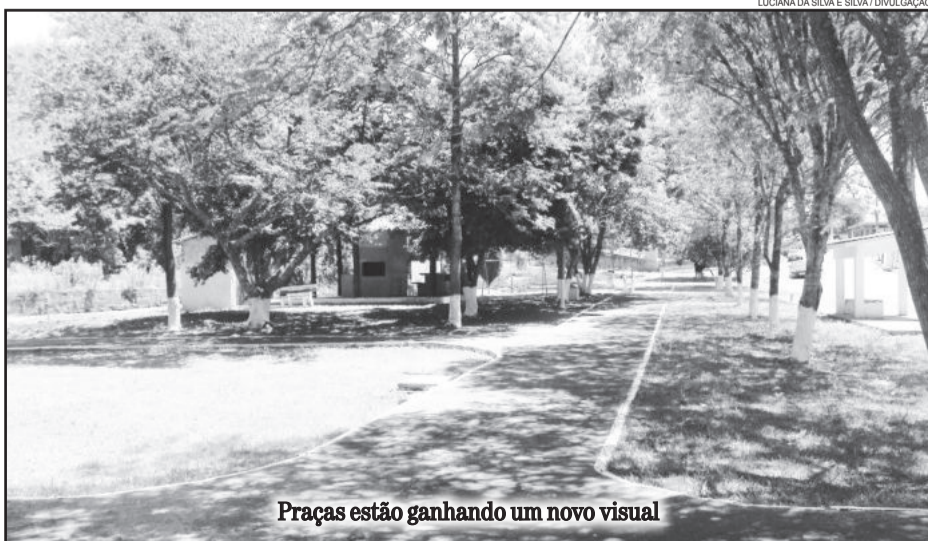
Praças estão ganhando um novo visual

O supervisor agradece a toda a sua equipe pede a compreensão e colaboração dos munícipes. “Todo o trabalho que vem sendo feito só é possível graças ao companheirismo e esforço do nosso grupo, que vem trabalhando para manter nossa cidade sempre linda e bem cuidada. Peço a todos os moradores e frequentadores das nossas praças que também colaborem, plantando flores, árvores, não jogando o lixo no chão. Todos juntos vamos tornar nossa cidade ainda mais bela.”