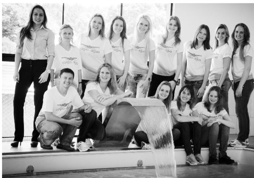
Equipe de profissionais da Corpo e Água