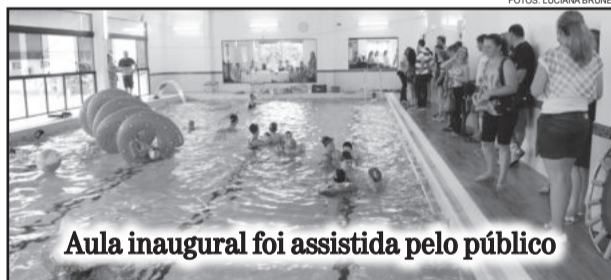
Aula inaugural foi assistida pelo público