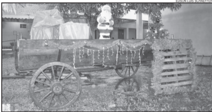
Na Apae, ornamentação já propaga o clima natalino