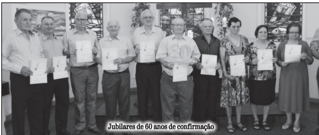
Jubileares de 60 anos de confirmação