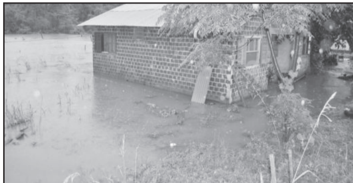
Nas Posses a água também adentrou em residências