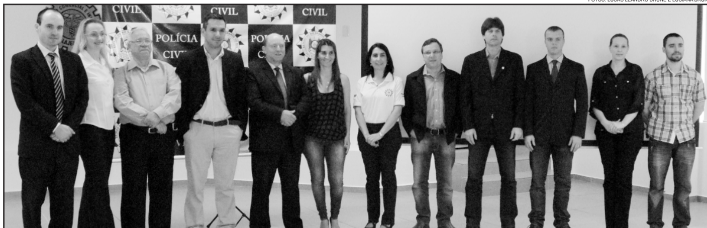
Delegados reunidos ao final do evento