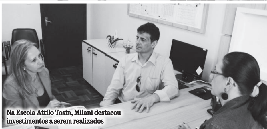
Na Escola Attilio Tosin, Milani destacou investimentos a serem realizados