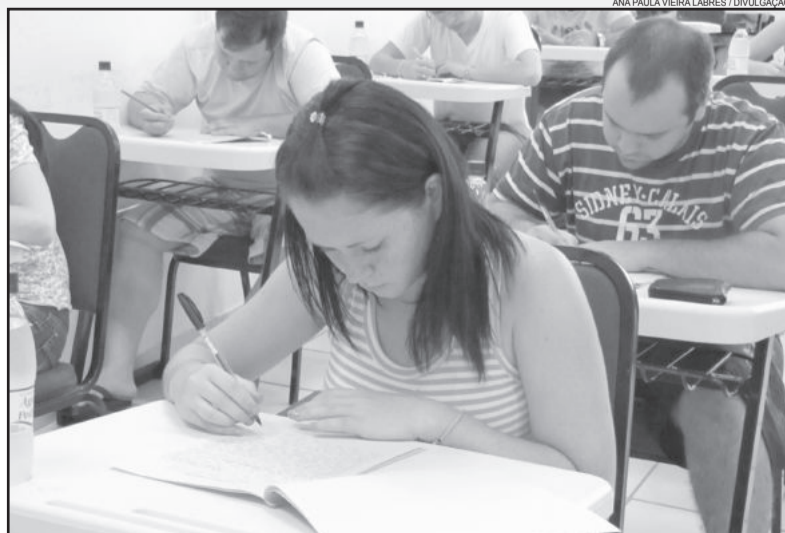
Provas do vestibular da Univates serão dia 1º de dezembro

Mais informações podem ser obtidas pelo telefone 0800 7 07 08 09 ou pelo e-mail vestibular@univates.br .