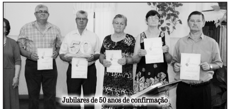
Jubileares de 50 anos de confirmação