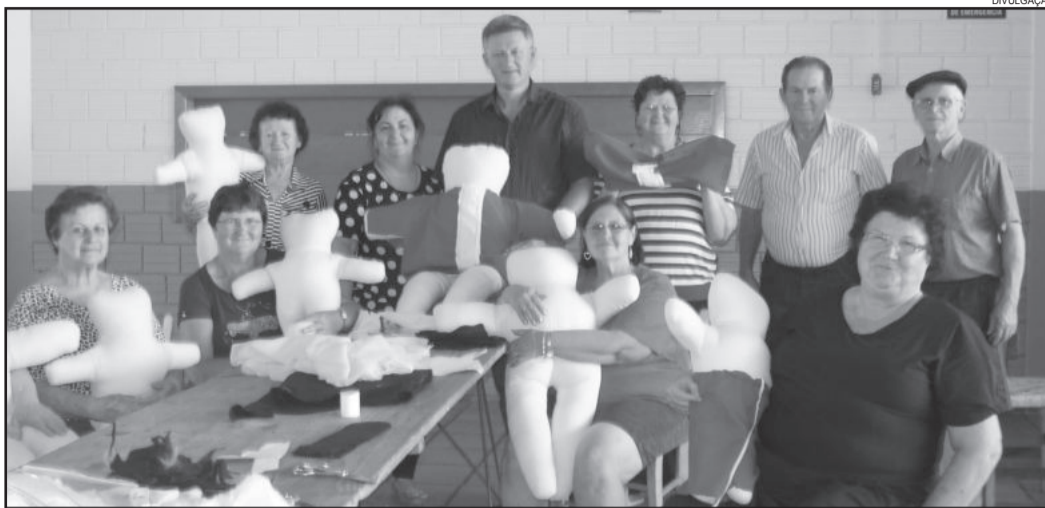
Grupos da Melhor Idade estão engajados com as oficinas para a decoração natalina

A comissão organizadora deste projeto alinhou várias ações que