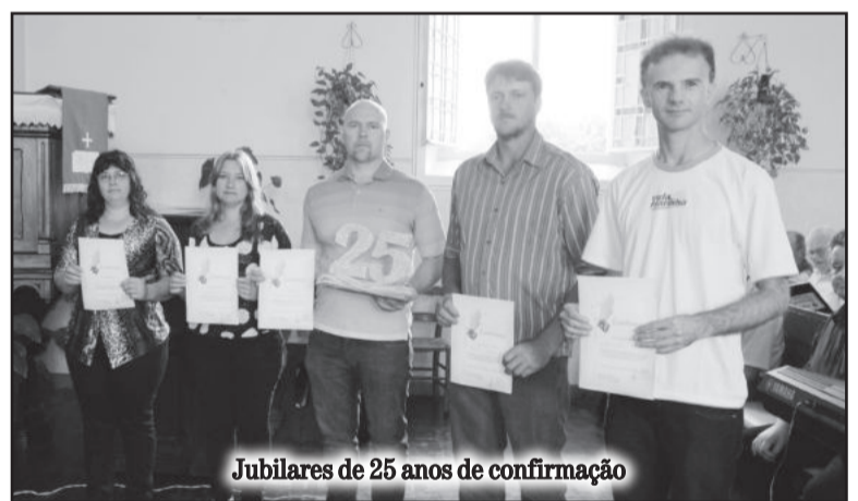
Jubileares de 25 anos de confirmação