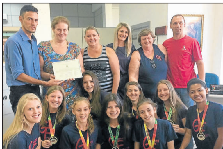
Equipe de vôlei e professores da Escola Gomes Freire receberam a homenagem

Presença - O vereador Marco Quadros (PSDB) pediu para que as pessoas venham até a Câmara e se informem sobre as coisas que estão acontecendo. “Que se informem e repassem os atos da administração, porque é onde vivemos”, avaliou. Conforme anunciado pelo vereador, Teutônia foi escolhida para, nos próximos meses, receber um recurso de R$ 10 milhões a serem aplicados em infraestrutura. “Um recurso muito importante, em um momento de recesso. Diante de tanta informação ruim, uma informação dessas é do agrado de todos”, avalia. Ele destacou ainda a inauguração do CREAS, que segundo ele será importante para diminuir os índices de desestruturação familiar. “A família é a base da sociedade. O poder público precisa apurar imediatamente os direitos violados”, avalia. Ele reforçou mais uma vez que a campanha da administração foi voltada ao ser humano e que esta é a marca do município. “Reclamações diminuiram, sempre vão existir. A resposta é dada com carinho e amor. Aqui [em Teutônia] as coisas são diferentes, existe compromisso; As coisas são realizadas. Somos privilegiados. Não é um paraíso, mas fazemos tudo que podemos”, conclui.