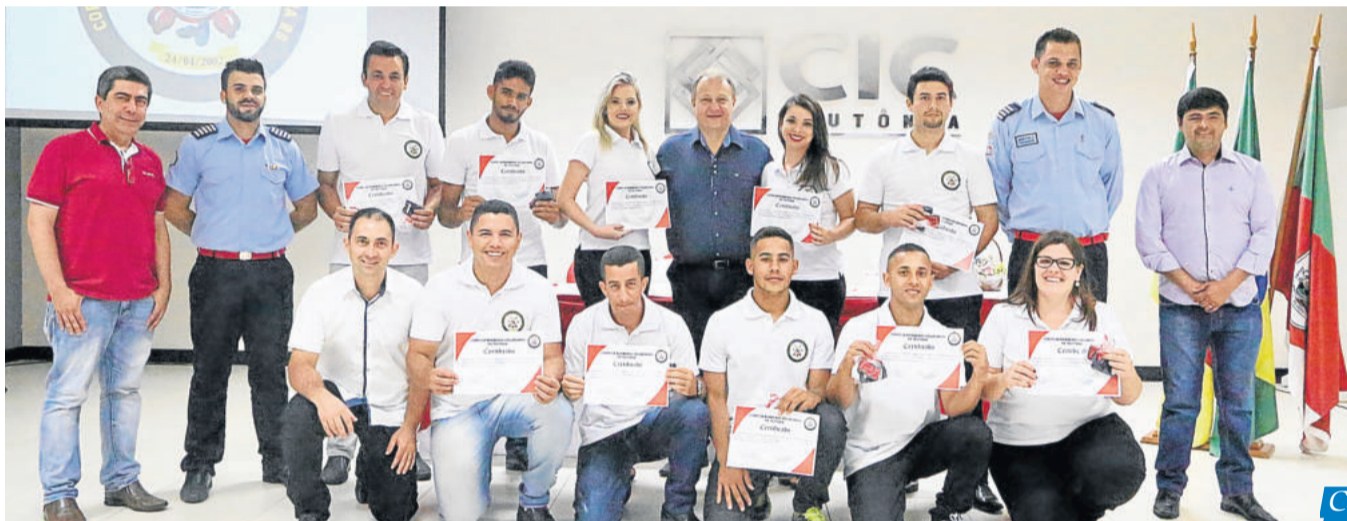
Corporação conta agora com dez novos profissionais

Marques acrescentou que a formatura também serviu como momento de confraternização entre os voluntários. “Oportunidade para podermos agradecer a todos que nos ajudaram neste ano e também projetar nossos próximos desafios. Trazer os familiares dos bombeiros para mais perto”, explica. Durante o evento, os bombeiros mostraram o trabalho que exercem diariamente, fazendo agradecimentos aos voluntários, diretoria e a todos que contribuem com o trabalho da corporação. “Eles merecem essa data especial pelo trabalho que prestam para população durante todos os dias do ano”, destaca o presidente.