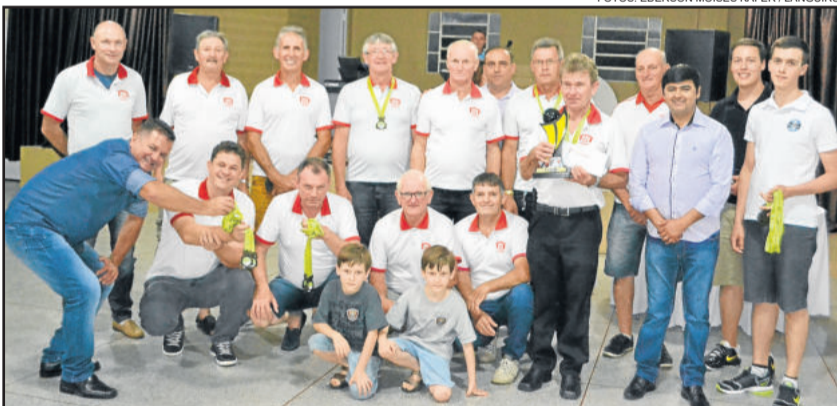
Gaúcho, campeão do Regional de Bolão da ARBAT

Na noite do sábado, dia 09, foi realizada a cerimônia de premiação do Regional de Bolão da Associação Regional de Bolão do Alto Taquari (ARBAT). O encerramento da competição foi realizado na Associação de Funcionários da Languiru, em Teutônia. A rodada final, realizada em Imigrante, decretou o Gaúcho como campeão de 2017.