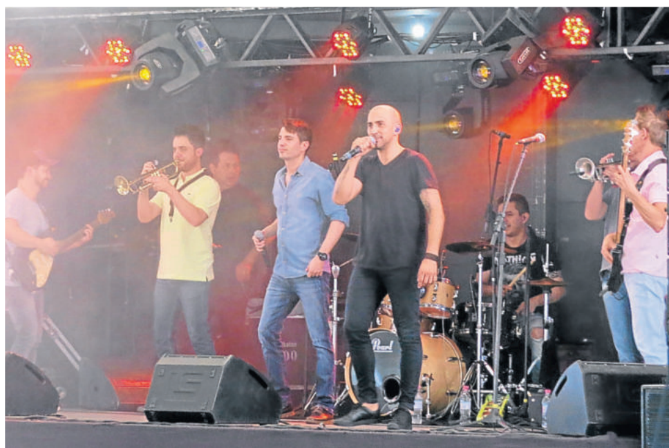
Banda Brilha Som