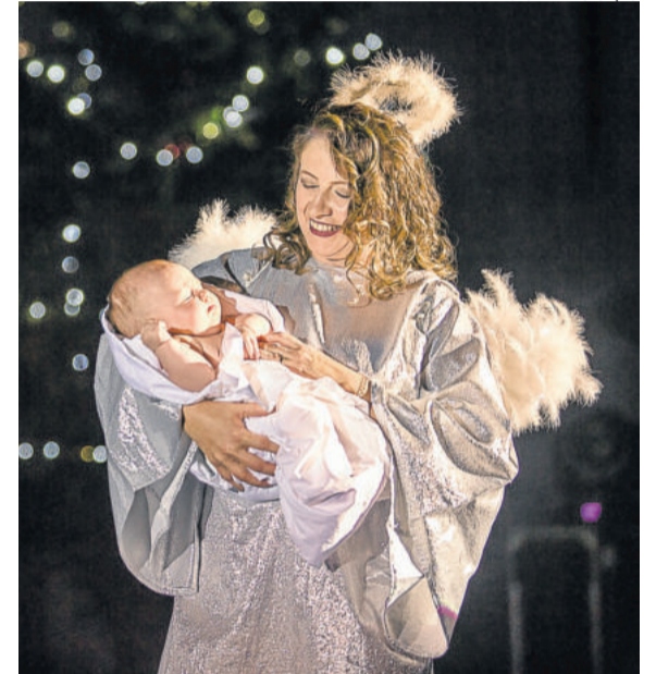
História retratou o nascimento de Jesus Cristo

CONTEÚDO DIGITAL Veja mais imagens do Natal Luz e Vida digital.folhapopular.info