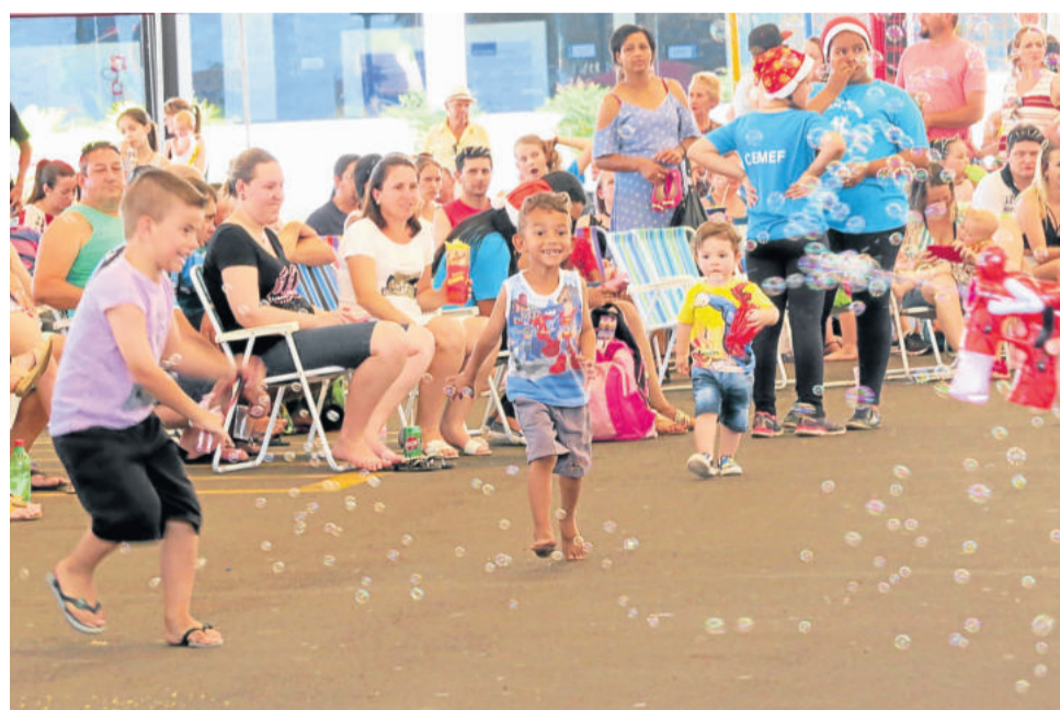
Espaço proporcionou brincadeiras entre as crianças