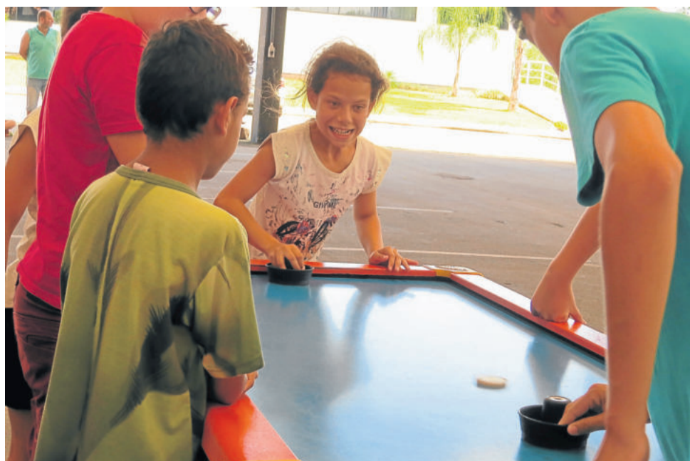
Crianças aproveitaram mesa de jogos para se divertirem