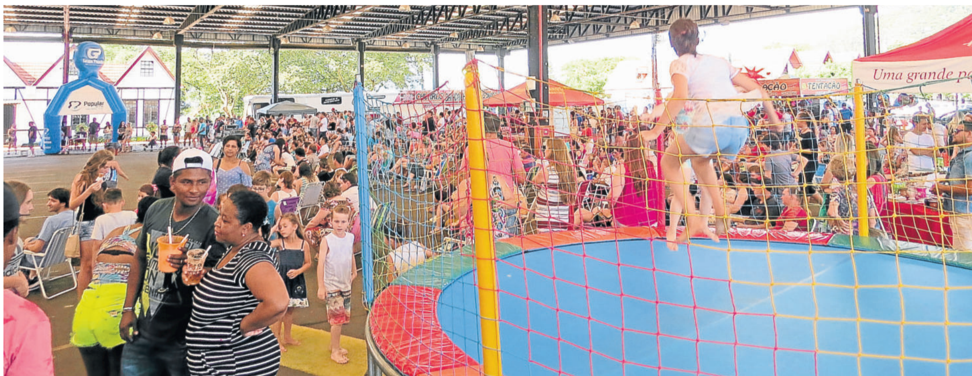
Cama elástica e brinquedos infláveis também foram atrações do evento