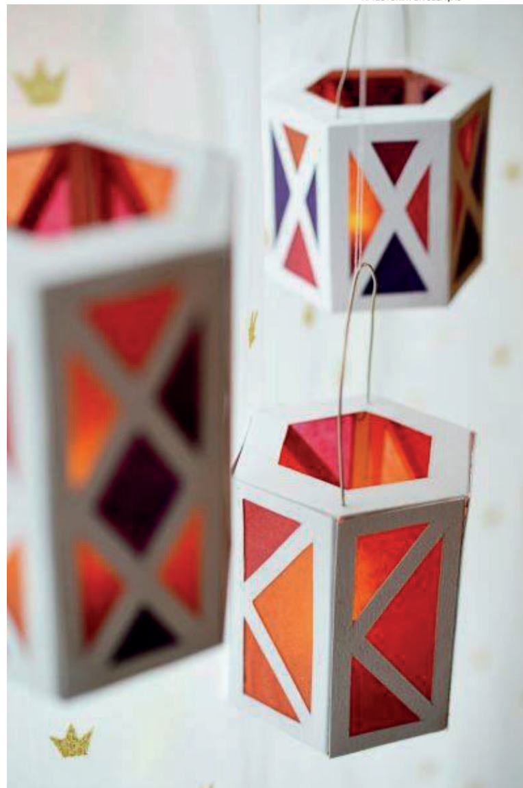
Cada pessoa é responsável por fabricar sua lanterna