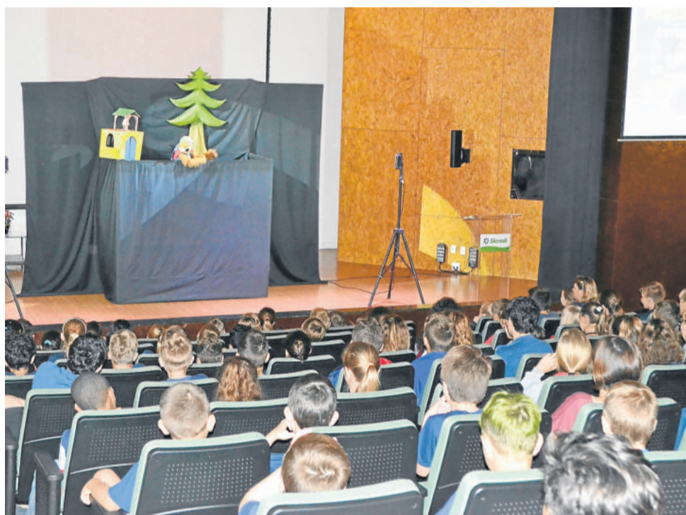
Alunos lotaram o auditório para acompanhar o Natal da Cooperação

de escolas municipais e estaduais do 1º aos 5º anos. Foram dois turnos, durante a manhã e a tarde, que prestigiaram uma peça teatral de bonecos, a chegada do Papai Noel, tiveram um lanche e conheceram a decoração natalina da cooperativa. Amanhã, quarta-feira, dia 13, mais 600 estudantes devem participar das atividades.