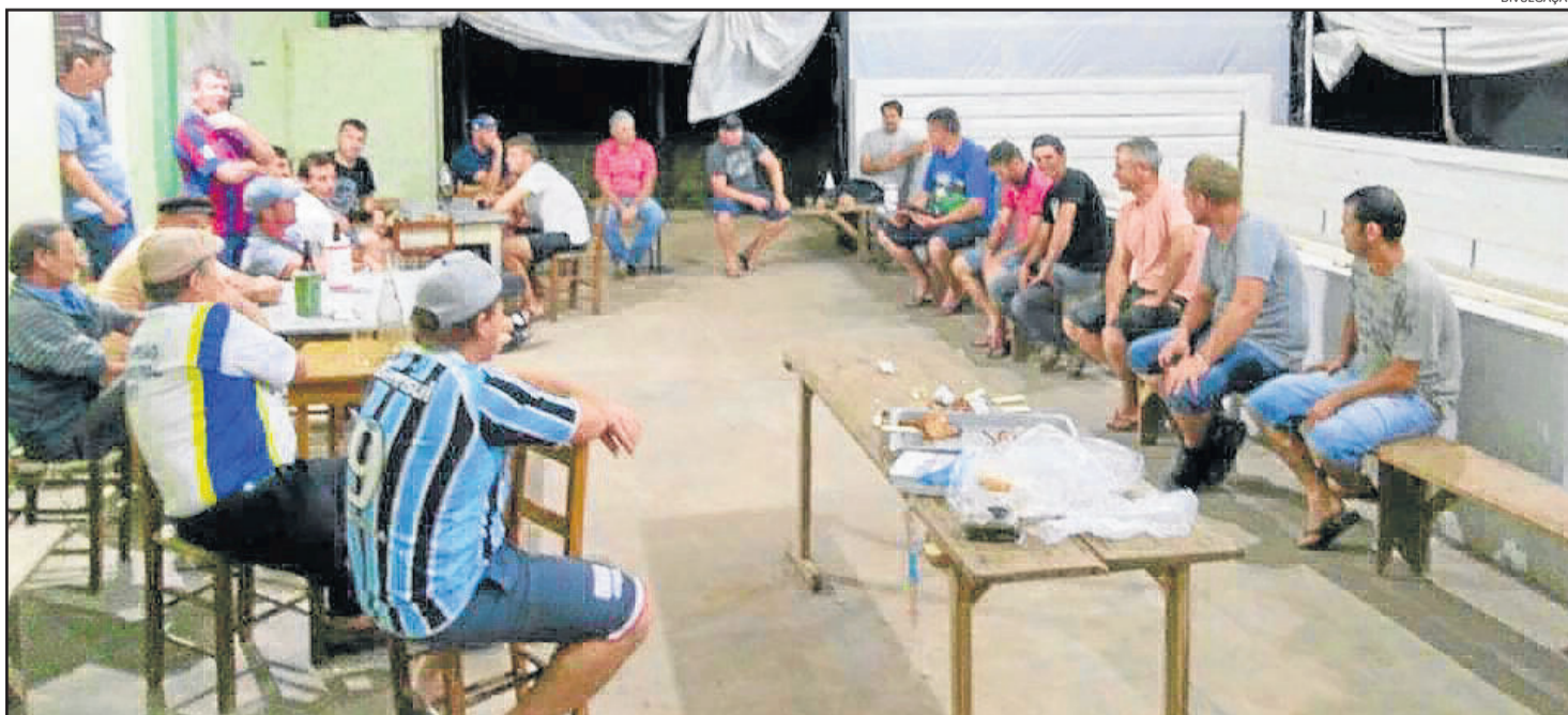
Na primeira reunião, 10 clubes estiveram presentes