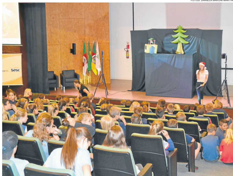
Estudantes ainda conheceram a decoração do Sicredi e acompanharam a chegada do Papai Noel