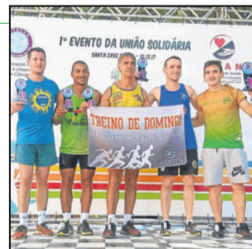
Fim de semana fechou com vitória em Santa Cruz do Sul