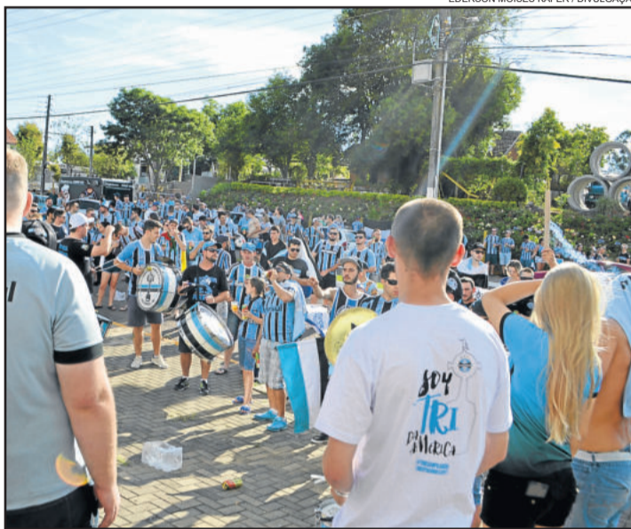
Tricolores encerraram a festa na Avenida 1 Leste