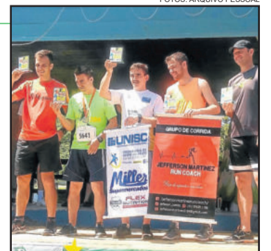
Primeira vitória do fim de semana foi em Paverama