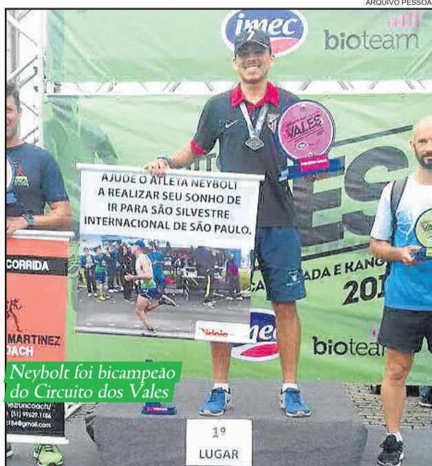
Neybolt foi bicampeão do Circuito dos Vales