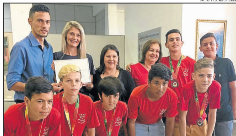
Equipe de futsal da Escola 24 de Maio também recebeu o reconhecimento