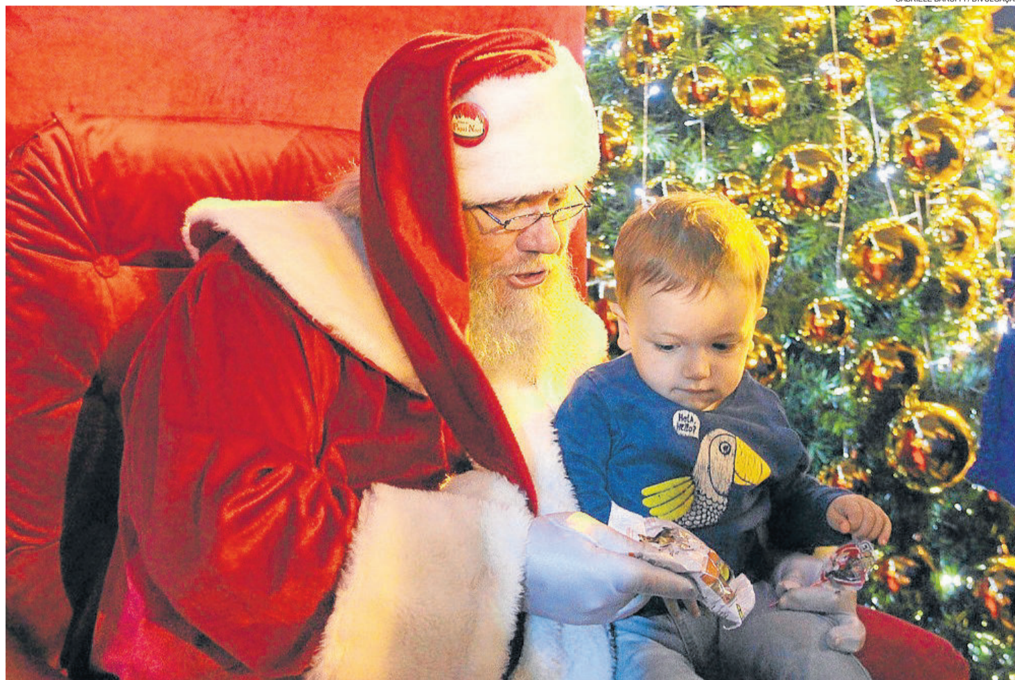
Papai Noel recebe atenciosamente pedidos e cartinhas de criança

A realização do Natal Borbulhante 2017 é do Ministério da Cultura e da Prefeitura Municipal, por meio da Secretaria de Turismo e Cultura. Tem como apoiadores a Associação de Pequenas e