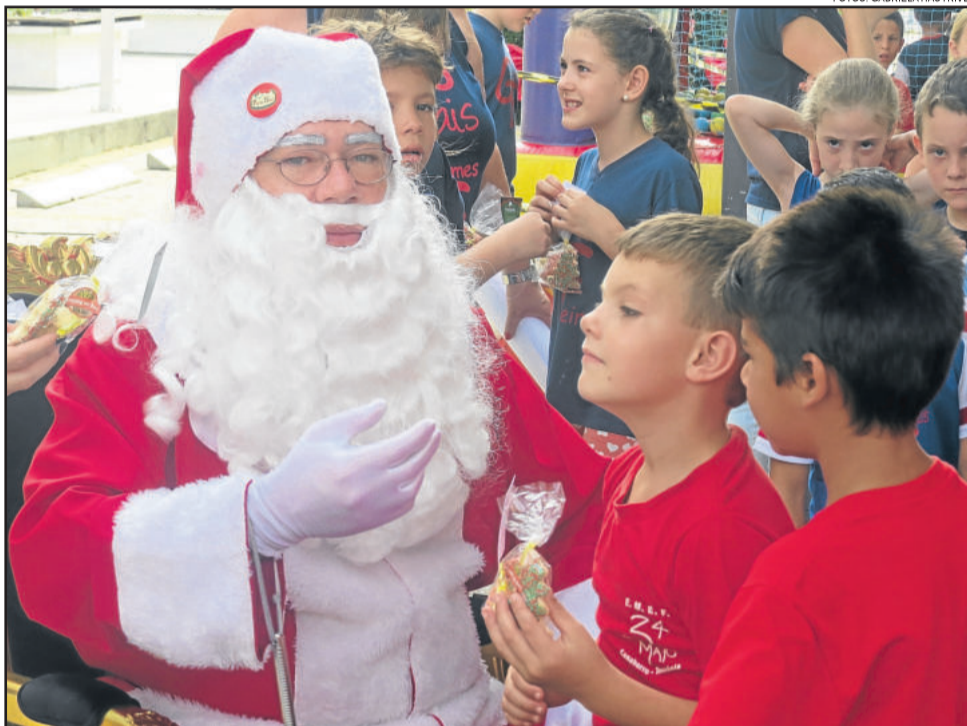
Papai Noel entregou uma lembrança para cada criança