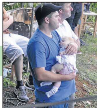
Bebê dormindo no colo e olhar atento ao jogo decisivo

Entre os 2.700 torcedores presentes à final da Copa Certel Sicredi, algumas cenas chamaram a atenção. Um subiu na árvore. Outros usaram a cabine do trator como sustentação. E até um bebê no colo participou da decisão.