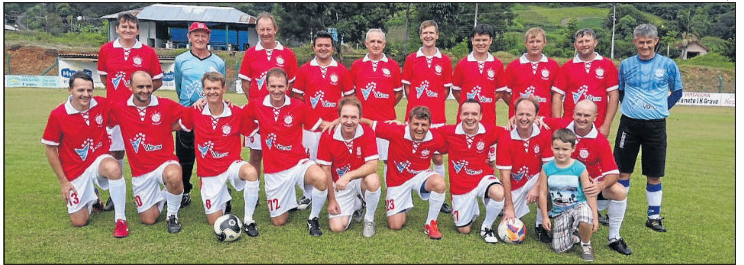
Master do Gaúcho promove jogo amistoso beneficente diante do Inter, neste domingo