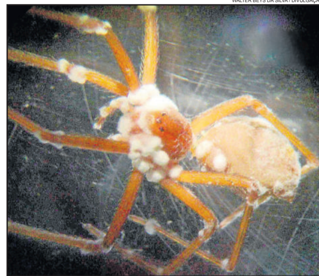
Aranha marrom, praga urbana que causa milhares de acidentes no Brasil e no mundo, pode ser controlada biologicamente por um fungo

Um exemplo de praga que o grupo já comprovou, que pode ser controlada biologicamente por um fungo, é a aranha marrom - Loxosceles sp. Causadora de milhares de acidentes no Brasil e no mundo, a aranha marrom é considerada uma praga urbana e pode ser controlada biologicamente pelo fungo Metarhizium anisopliae .