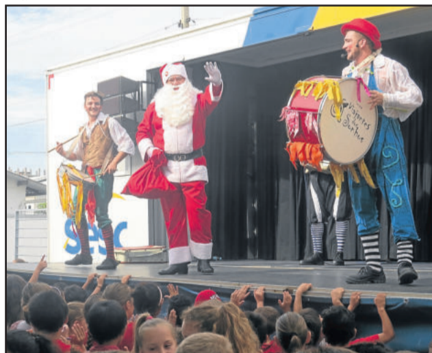
A Trupe Viajante dos Sonhos garantiu a animação dos alunos

A programação contou com a chegada do Papai Noel