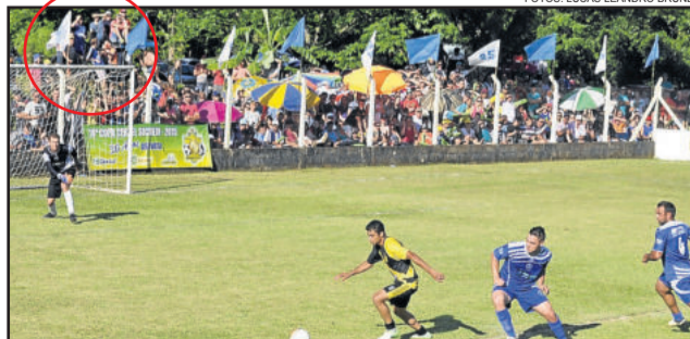
Torcedor viu a final em cima do trator (ao fundo)