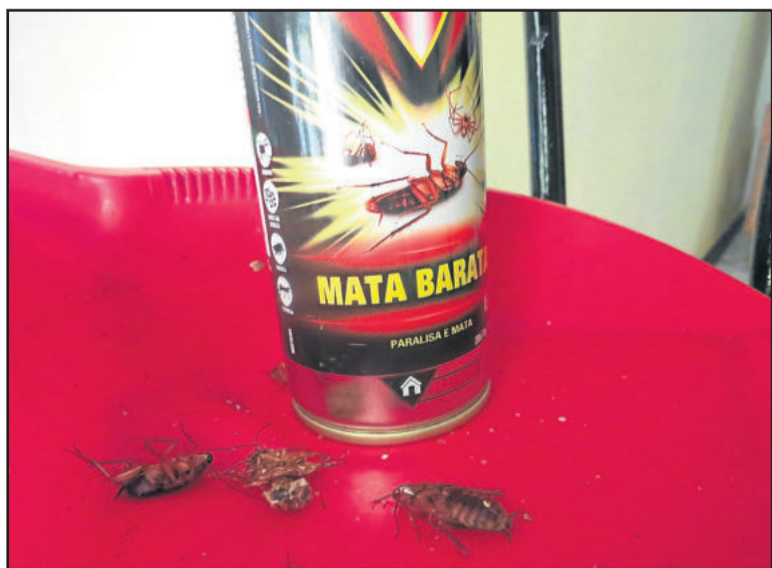
Enquanto fumaceador prometido pela Vigilância Sanitária não vem, população procura alternativas para eliminar baratas