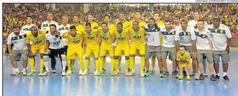
ASSOEVA precisa vencer duas vezes para evitar o quarto vice-campeonato