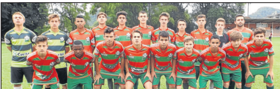
Categoria 2000 (Sub-15) da Juventus disputa o título do Gauchão Noligafi com o Vila Nova

Neste final de semana, a escolinha Juventus, de Teutônia, terá importantes decisões pela frente no Gauchão Noligafi e na Copa dos Vales Juvenil. Hoje, sábado, às 18 horas, a categoria 2000 (Sub-15) faz o primeiro jogo da final do Gauchão Noligafi. O jogo de ida será em Passo Fundo, diante do Vila Nova, que eliminou o Cruzeiro de Porto Alegre. A partida de volta do Gauchão Noligafi, será na próxima terça-feira, dia 15, às 19 horas, no campo da SER Gaúcho, em Teutônia.