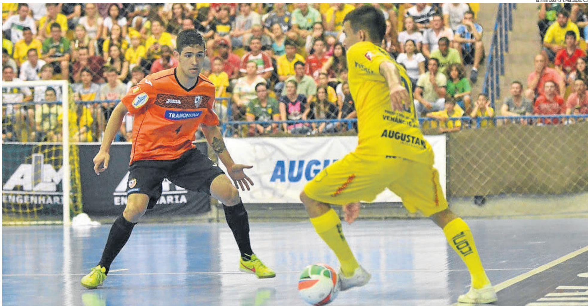
ACBF, de Carlos Barbosa, e Assoeva, de Venâncio Aires, decidem o título amanhã, na Serra. GAUCHÃO DE FUTSAL - SÉRIE OURO > 20