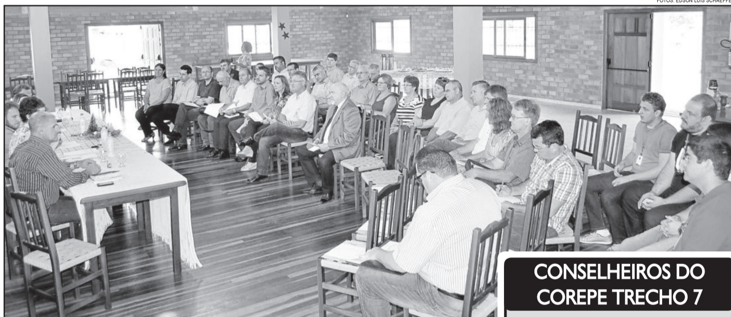
Reunião ocorreu em Boa Vista do Sul

O Corepe volta a se reunir no dia 2 de março de 2016, às 9h30min, em Cruzeiro do Sul. Nestes dois anos de conselho, algumas demandas já foram atendidas pela