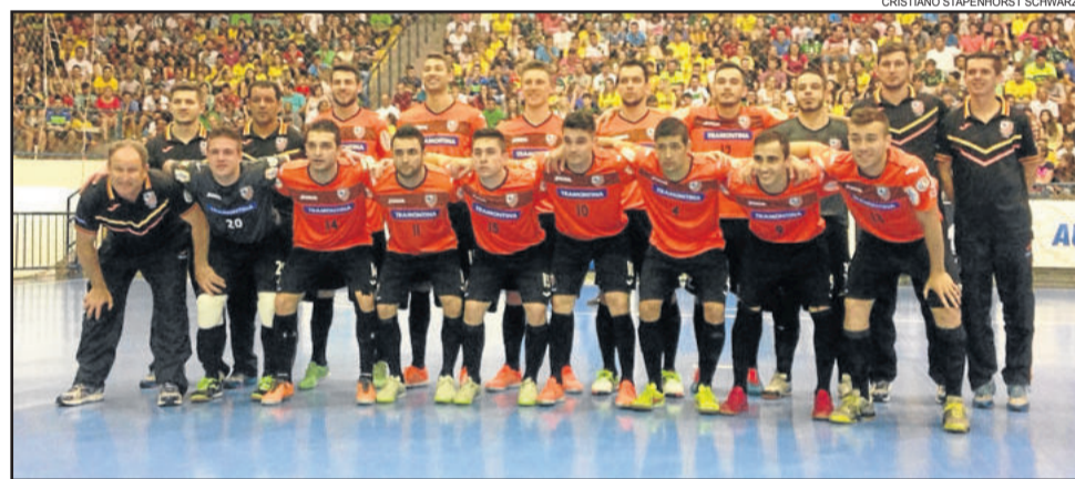
ACBF joga pelo empate no segundo jogo