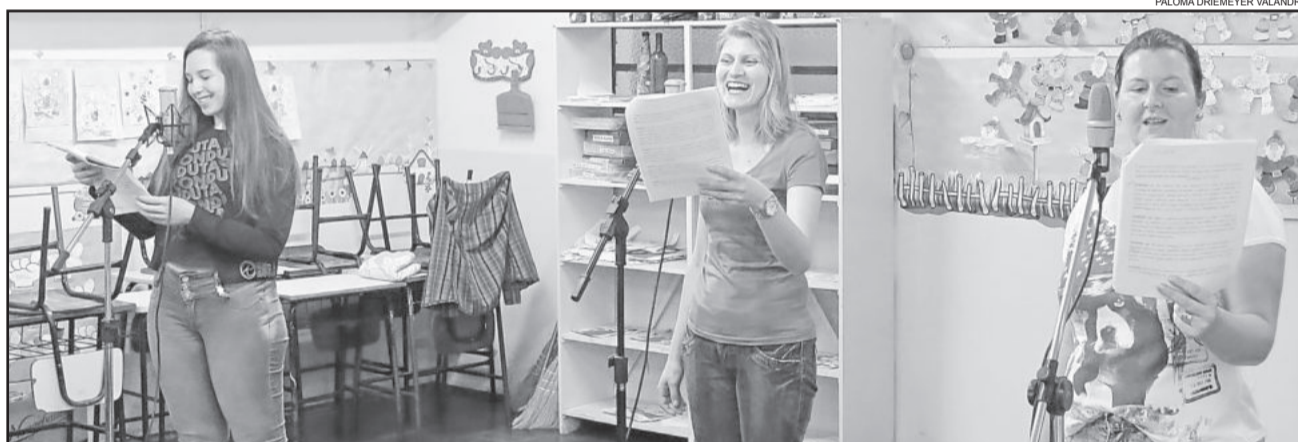
Gravações de vozes já foram realizadas