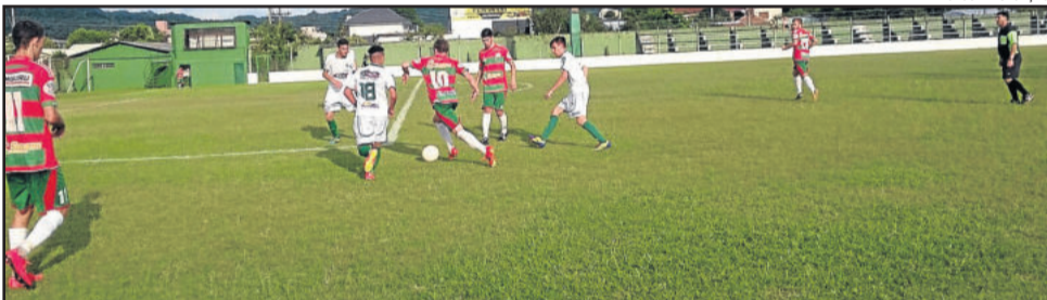
Juvenil da Juventus decide o título da Copa dos Vales com o Lajeadense