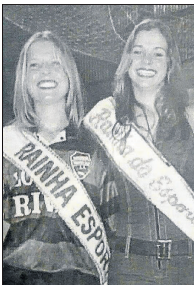
No esporte, as irmãs também trocaram faixas de rainha, em 2003