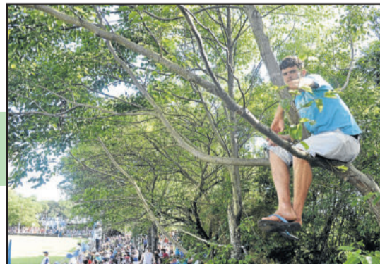
Torcedor subiu na árvore para ver o jogo de outro ângulo