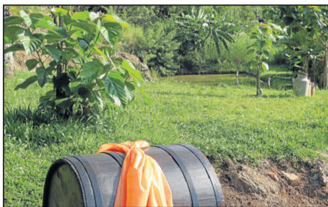
Visitantes poderão transitar em meio a natureza