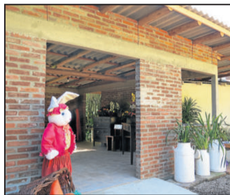
Silvane manteve o estilo rústico

Os contatos para agendar visitas pelo telefone (51) 8186-9815. Mais informações também estão na página de Silvane no Facebook. A empresa sugere ainda a visitação em outros pontos turísticos de Imigrante, como Café Colonial no Restaurante Bella Cantina, em Daltro Filho.