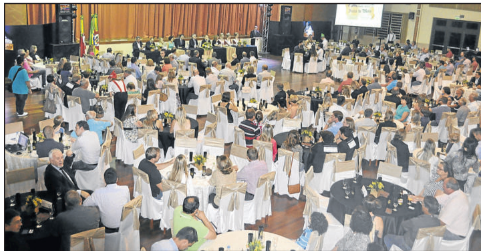
Comunidade, empresários, lideranças e autoridades prestigiaram o lançamento