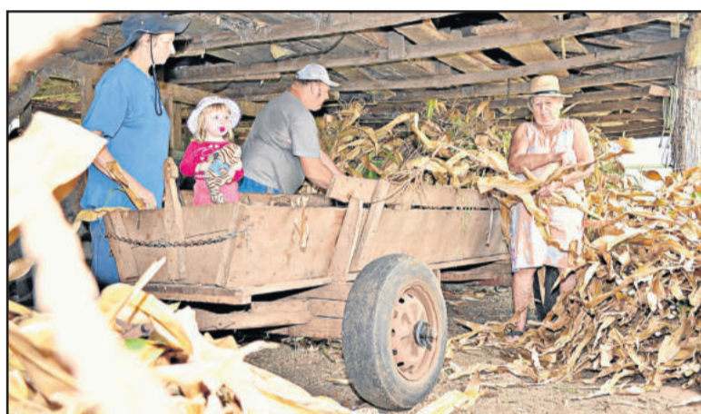
Imagens mostram a força da trabalhadora rural no campo