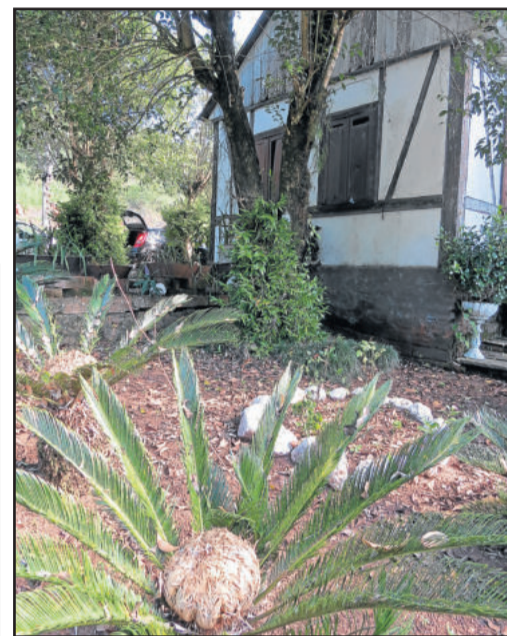
Orquídeas, cycas e casa centenária são atrações