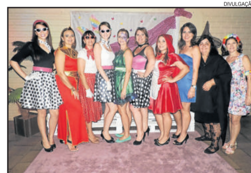
Baile é realizado em comemoração ao Dia da Mulher

A primeira-dama ressalta que a comemoração ao Dia da Mulher gera resultados na comunidade. Além das mulheres se sentirem melhor, outras famílias serão beneficiadas com cestas básicas. Em 2015, o baile reuniu 350 pessoas e ajudou 30 famílias com os alimentos.