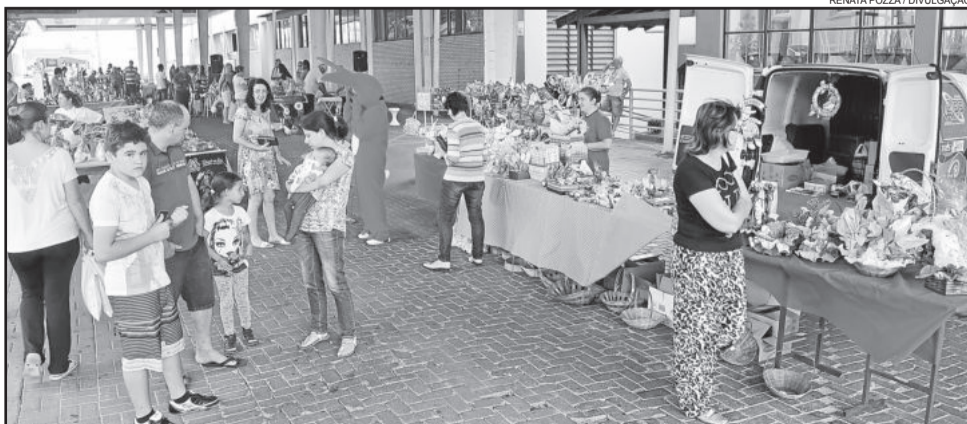
Evento acontece hoje, sábado, e amanhã, domingo, das 9 às 18 horas, na Rua Coberta