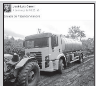
Imagem publicada no Facebook