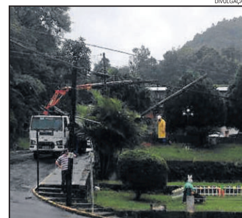
Equipamentos foram instalados na quinta-feira