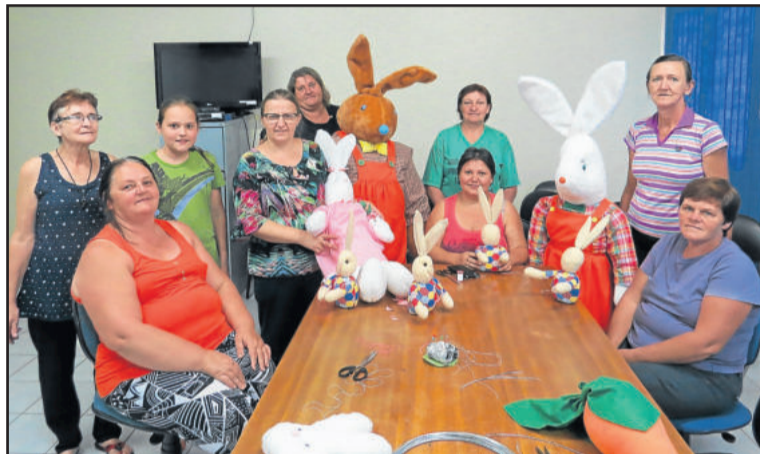
Turma se encontra todas as quartas-feira, na Unidade de Saúde

Até hoje, o grupo já produziu diversos produtos artesanais: caixas, pesos de por-