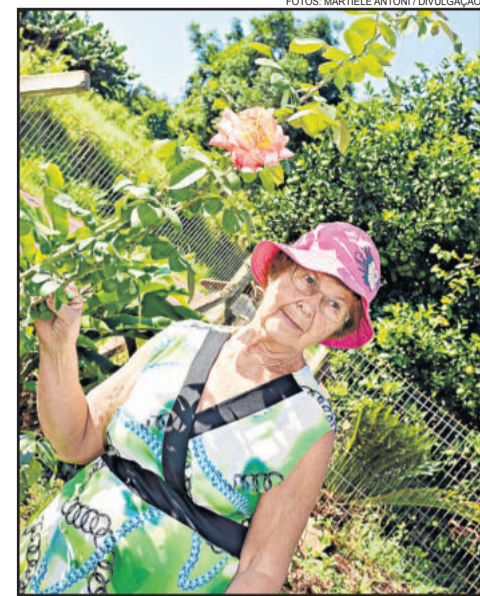
Fotos buscam valorizar e empoderar mulheres rurais

des a partir disso, voltar a fazer as fotos. Fazer outros momentos com essas mulheres a partir do que surgir daí”, conclui.