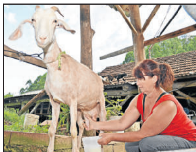
Fotos retratam o dia a dia das mulheres em suas propriedades