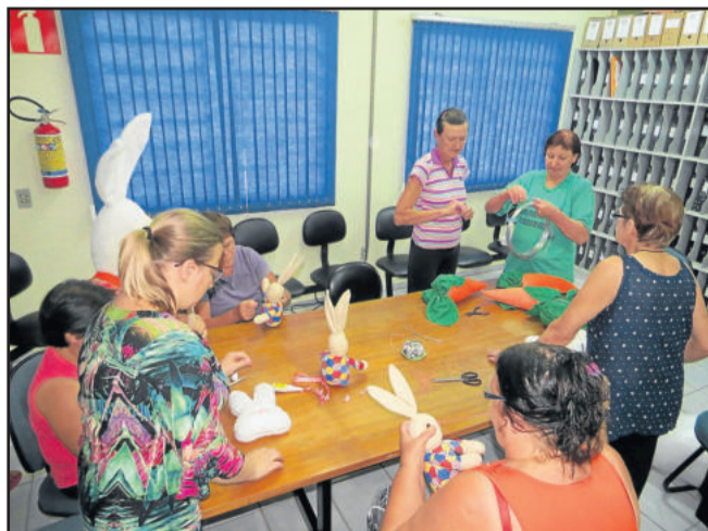
Na terça-feira, grupo finalizava coelhos para a decoração de Páscoa na UBS

Planthold vê o atraso no repasse das verbas como um grande inconveniente, uma vez que os municípios acabam tendo que arcar com as despesas. Westfália tem recursos em atraso ainda do ano de 2014. O valor repassado à Oficina Terapêutica também conta com atrasos. O totalizador em atrasos chega a R$ 125 mil.