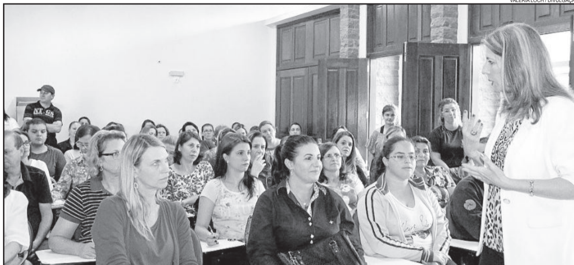
Mais de mil voluntários irão às ruas buscando sensibilizar a população da importância de acabar com possíveis focos do mosquito

Conforme o prefeito de Garibaldi, Antonio Cettolin, serão 1.200 voluntários divididos em 24 grupos que buscam conscientizar as pessoas dos 19 mil domicílios de Garibaldi. "Precisamos da ajuda de toda a comunidade, fazendo uma mobilização educadora para podermos juntos combater este mosquito, eliminando criadouros nos dois muni-