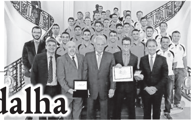
Delegação da ACBF recebeu a homenagem no Palácio Piratini