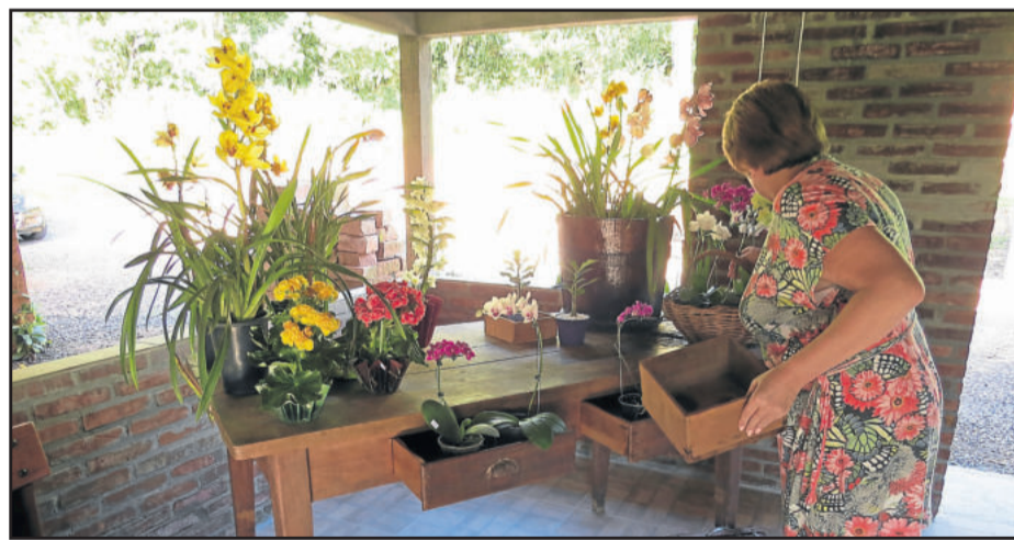
Preparativos são intensos para o momento da inauguração