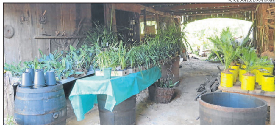
Galpão servirá para a produção própria