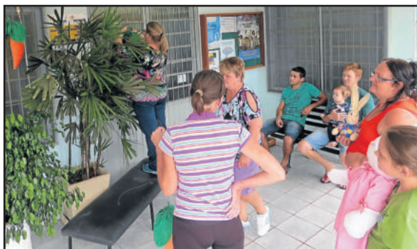
Mulheres decoraram o Posto de Saúde nesta semana