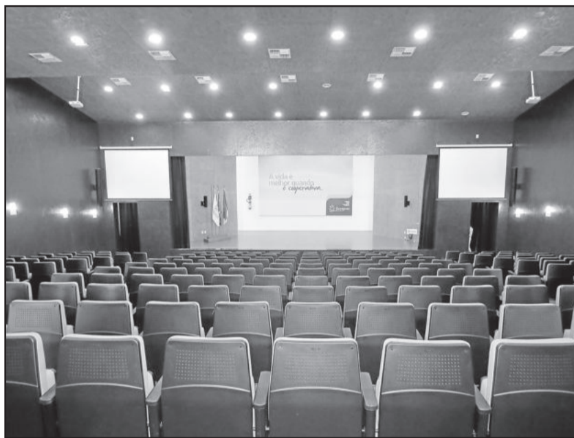
Dependências da unidade de Teutônia também foram conhecidas. Auditório (foto) sedia eventos do Sicredi e também de fora