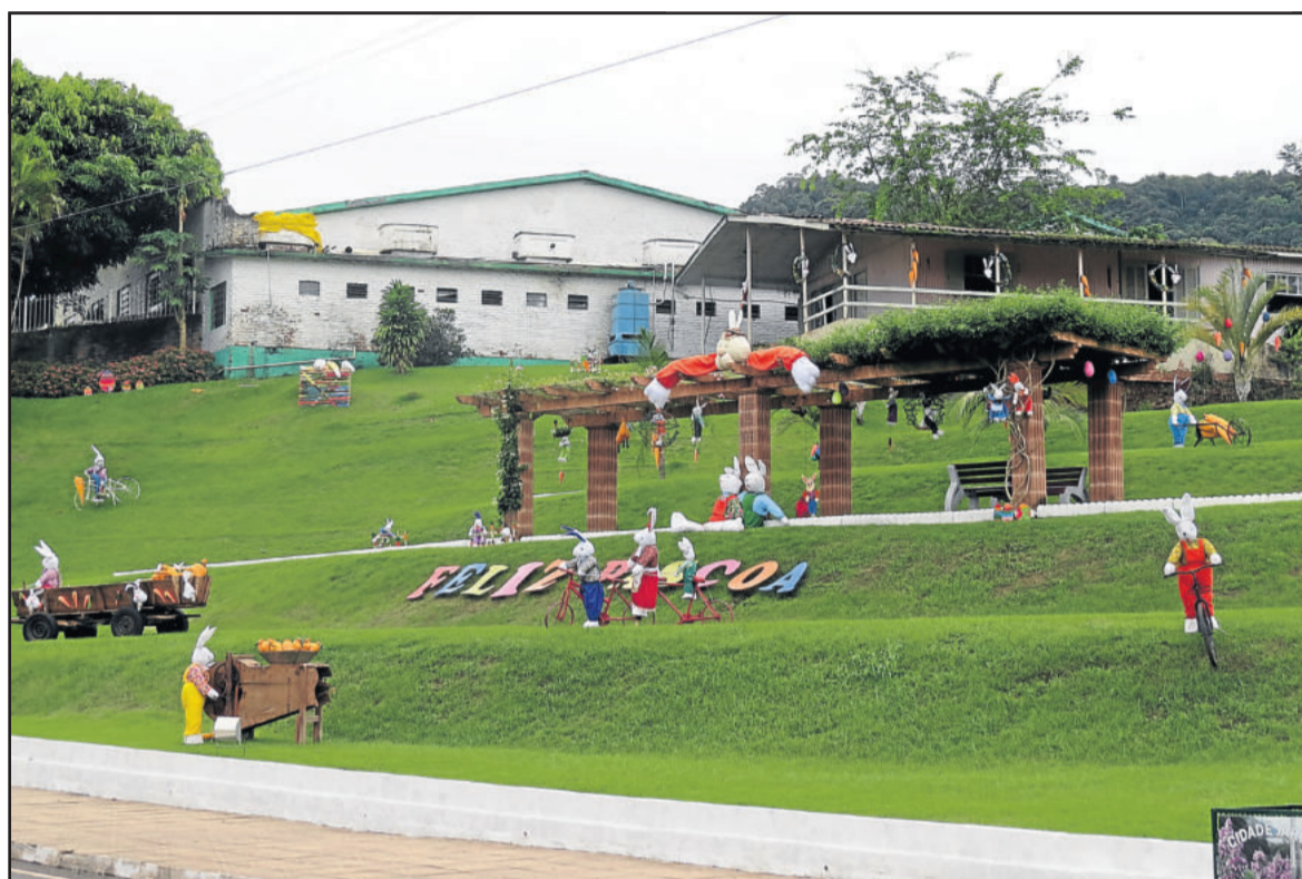
Abertura das atividades de Páscoa começam hoje