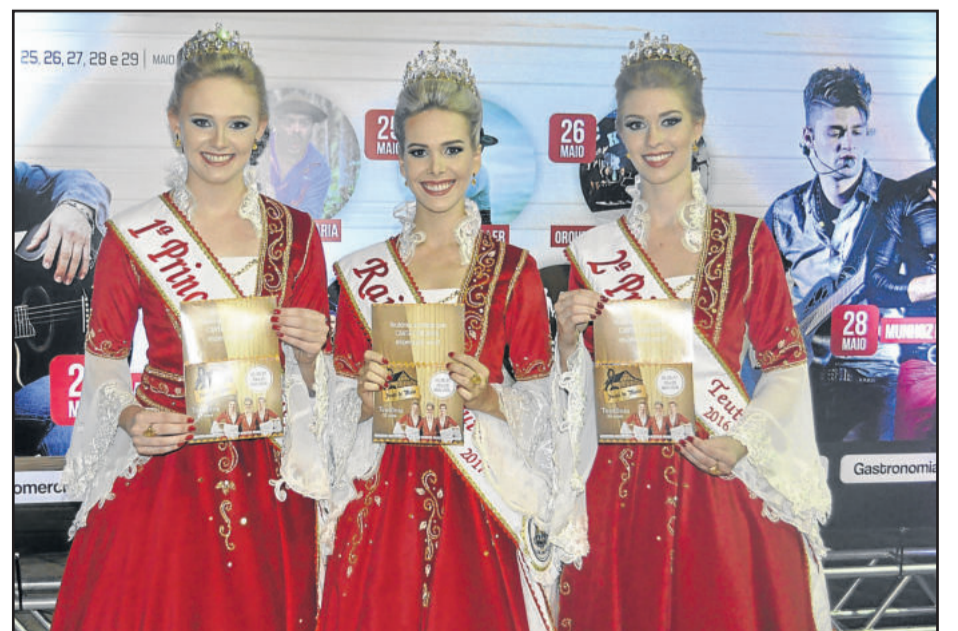
Soberanas apresentaram traje oficial e começam a divulgar o evento