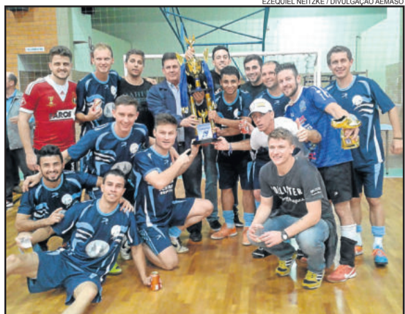
Tiafirma é o atual campeão da competição