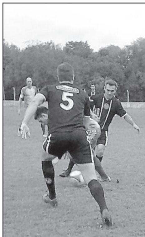
Jogo foi muito faltoso e truncado