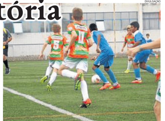
Juventus jogou em Novo Hamburgo, perdeu uma e venceu outra categoria

No sábado, dia 09, a AERC Juventus de Teutônia estreou com bom resultado no Gauchão Noligafi 2016, com as categorias 2002 e 2004. O adversário foi o EC Novo Hamburgo, no Estádio do Vale, em Novo Hamburgo.