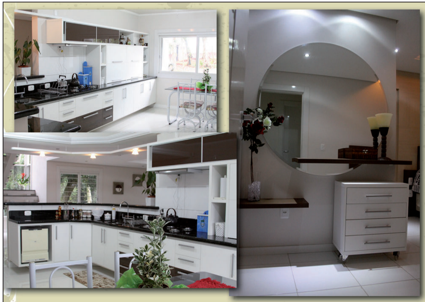
Gosto do cliente deve ser levado em conta na hora da elaboração de um projeto

Já o MDF, por sua vez, é um material uniforme, plano e denso, resultado da aglutinação de fibras de madeira com