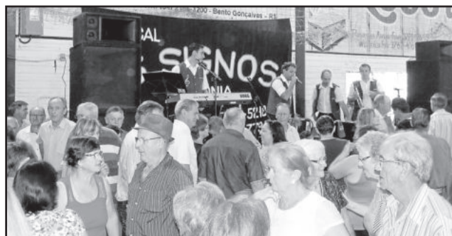
Musical Os Signos animou aos idosos

encontro da terceira idade. Desta vez, a festa acontece em Linha Paissandu, no Ginásio Municipal, a partir das 13 horas. O grupo anfitrião será o Grupo de Idosos Flor de Maio.