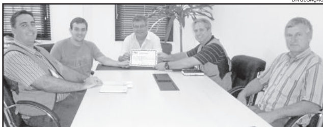
Certificado foi entregue no Gabinete do Executivo