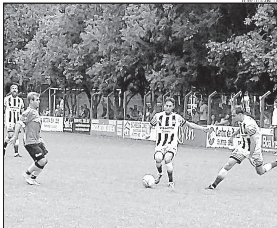
Ecas (camiseta branca) venceu ao 11 Amigos por 2x1 em Poço das Antas