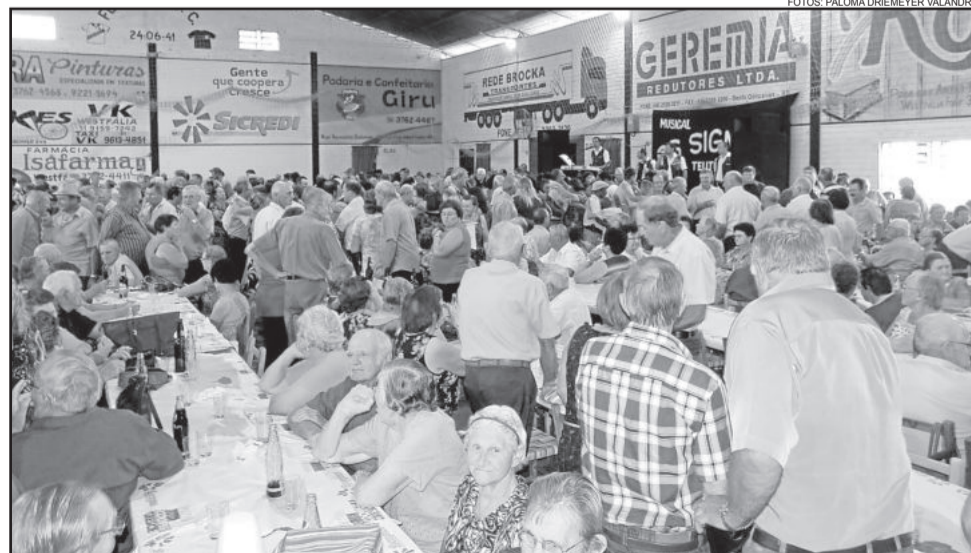
Mais de 1.400 pessoas prestigiaram o baile no sábado