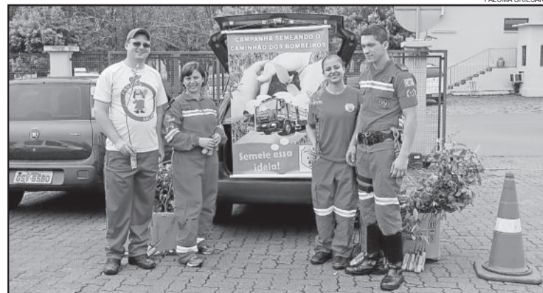
Ação visa obter recursos para novo caminhão

com a entidade. “Ficamos muito felizes e satisfeitos com a comunidade. Percebemos que além da arrecadação, fomos muito elogiados e bem vistos pelo trabalho que fizemos em Teutônia”, afirma. Segundo ele, os voluntários sentiram o reconhecimento da população. “Somos vistos com bons olhos pela comunidade de Teutônia que nos valorizou bastante”, conta. Ele relata que ficou claro que as pessoas estão dispostas a ajudar a corporação. “E nós vamos ajudar da forma que viemos fazendo, que é atendendo da melhor forma possível. Estamos muito felizes e pretendemos continuar com esse troféu da comunidade que é o voto de confiança”, conclui.