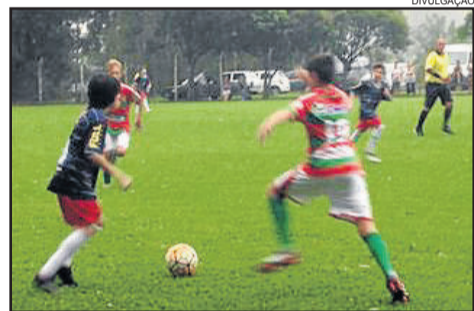
Parceria Serrano e Juventus rendeu vitórias na estreia do Regional Serrano