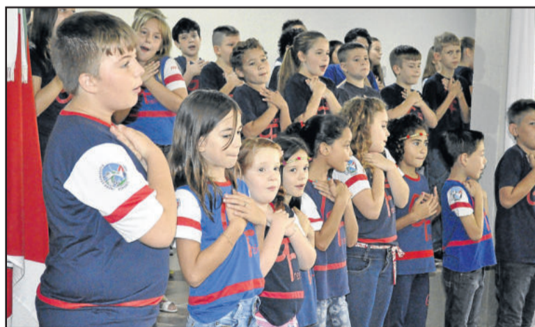
Alunos homenagearam o educandário através de canções