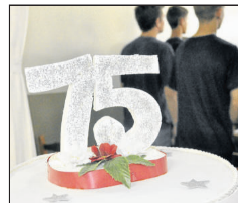
Bolo simbólico marcou os 75 anos do Gomes Freire de Andrade

Diante do cenário em que se encontram Estado e País, Biondo fez uma colocação: “não existe forma melhor de mudarmos esse cenário do que valorizar a educação”. O vice-prefeito ainda parabenizou a todos pelo empenho na construção da história do educandário.