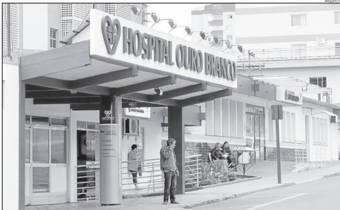
Hospital Ouro Branco de Teutônia também está em situação delicada com os cortes de repasses

O quadro nacional é esse: em 2015, 218 hospitais sem fins lucrativos, 11 mil leitos e 39 mil postos de trabalho foram fechados, tendo como causa direta o subfinanciamento da saúde. Segundo dados da Confederação das Misericórdias do Brasil, a dívida do segmento filantrópico, que hoje representa mais de 50% dos atendimentos do SUS, ultrapassa R$ 21 bilhões no país.