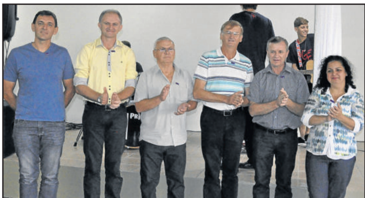
Ex-presidentes do CPM foram homenageados