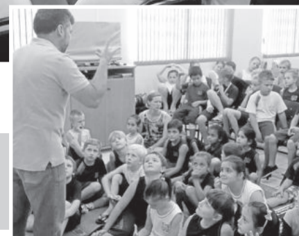
Palestra na Escola Santo Antônio (foto de cima) e na Escola Arco-Íris (foto ao lado)