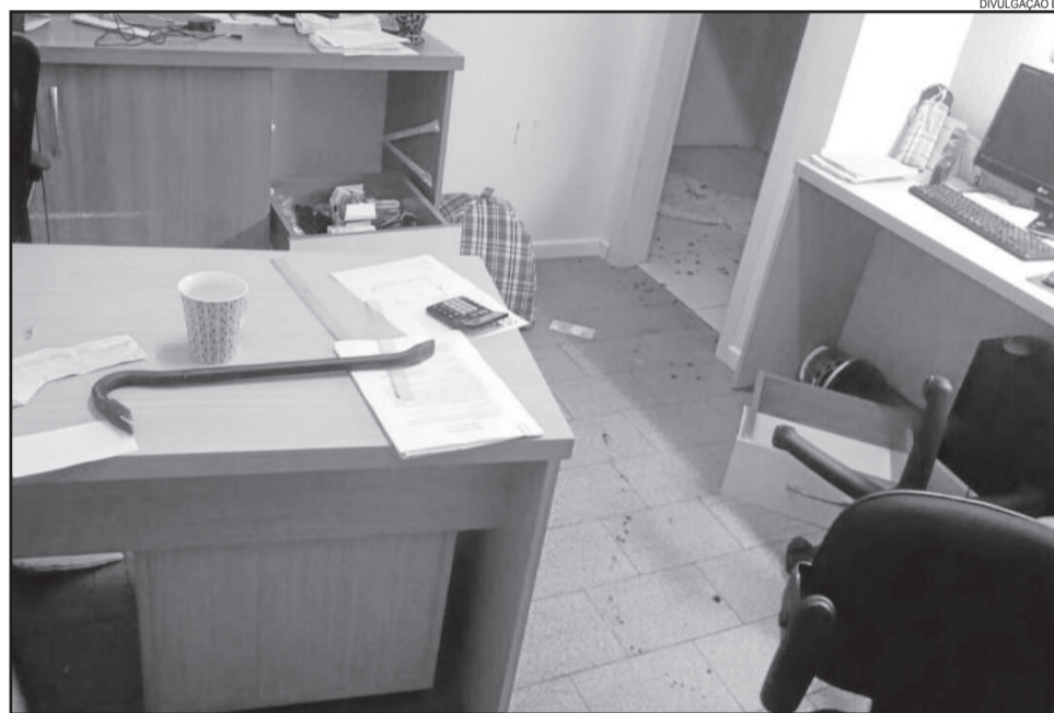
Na ação de sábado, ladrões reviraram o local em busca de dinheiro

Antes disso, em uma noite de terça-feira, dia 22 de março, o empresário e morador do Bairro Canabarro teve sua casa invadida pelos assaltantes. Ele, a esposa e os três filhos foram rendidos pelos bandidos, que estavam armados. Os criminosos reviraram a casa e fugiram levando joias, dinheiro e outros objetos de valor. De acordo com a vítima, não levaram