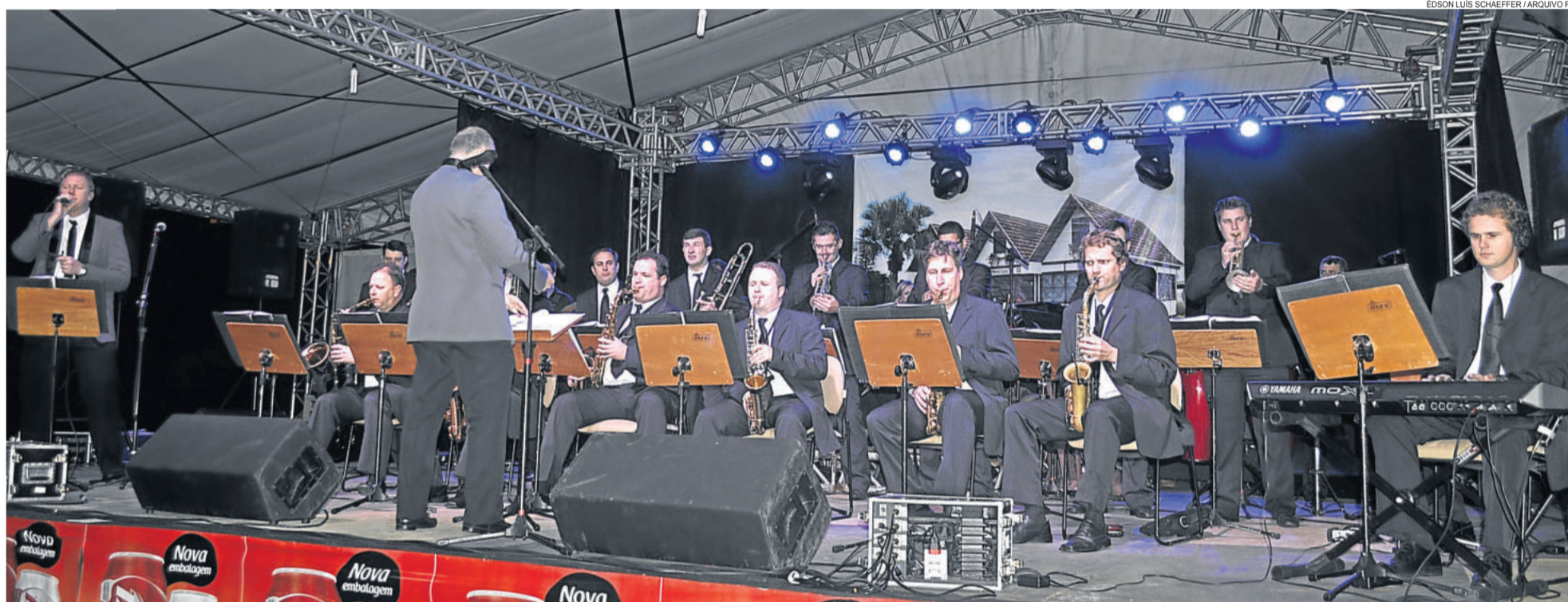
Prefeito lastima atitude e diz não poder pagar mais de R$ 10,5 mil por mês em função do atual quadro econômico do País. TEUTÔNIA > 7

FRUKI SERÁ APRESENTADA NESTA QUARTA À COMUNIDADE