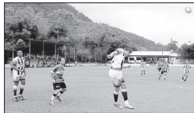
Defesa do Ecas dificultou ações ofensivas do 11 Amigos, que precisava da vitória