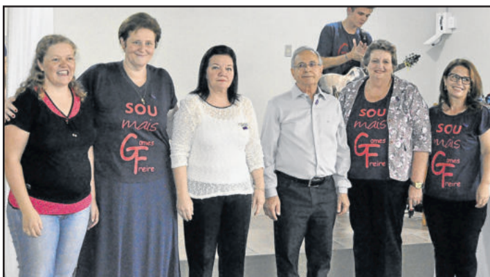
Ex-diretores e atual também foram homenageados