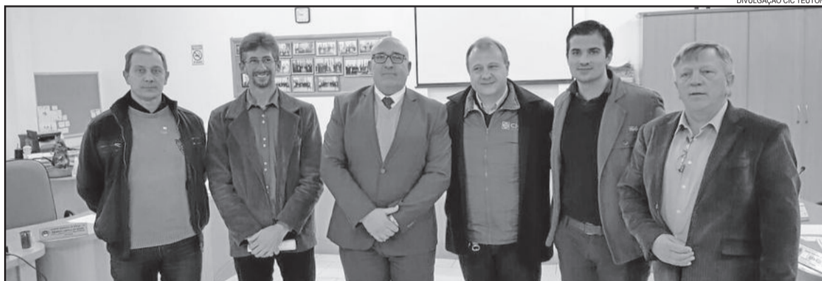
CIC Teutônia esteve representada em reunião no município de Muçum sobre as feiras itinerantes e comércio ilegal

Recente evento do gênero foi realizado em Fazenda Vilanova. Na oportunidade, a CIC, com apoio da Diretoria e assessoria jurídica da entidade, consultou a Receita Estadual, o Ministério Público, a Administração Municipal local e os bombeiros, o que acabou impedindo a realização da feira no estabelecimento anunciado, que não contava com Plano de Prevenção Contra Incêndios (PPCI) para eventos do gênero.