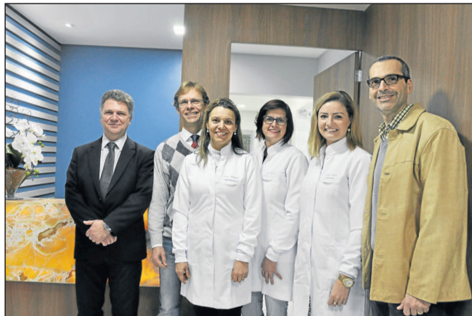
Equipe da Clínica Odontológica

Durante todo o dia, os clientes e a comunidade puderam visitar os novos espaços e foram recebidos por toda equipe, para conferir de perto os novos investimentos e espaços especialmente projetados para atender todas as demandas e tipos de atendimento realizados na Clínica.