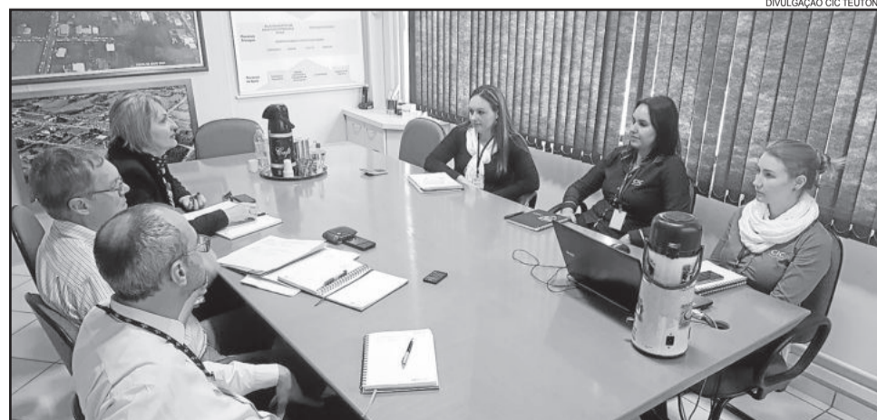
Gerência do Sebrae e CIC estiveram reunidas no final de junho, quando a entidade com atuação nos Vales do Taquari e Rio Pardo anunciou novo modelo de atuação

Na reunião entre CIC e Sebrae ainda foi definida grade de treinamentos, além da próxima Rodada de Negócios, prevista para o mês de setembro. Mais informações podem ser obtidas pelo telefone (51) 3762-1233.