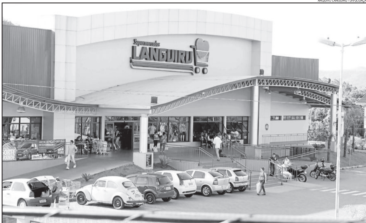
Supermercado Languiru foi alvo de assaltantes no fim da manhã de domingo

Conforme o delegado de Polícia de Teutônia, Humberto Messa Röhrig, foi instaurado um inquérito para investigar o caso e o trabalho agora segue com a coleta dos relatos das vítimas e diligências. Ele destaca que os primeiros indícios apontam para participação de pessoas de fora do Município. E garante que a ocorrência não tem nenhuma relação com os outros crimes semelhantes acontecidos recentemente.