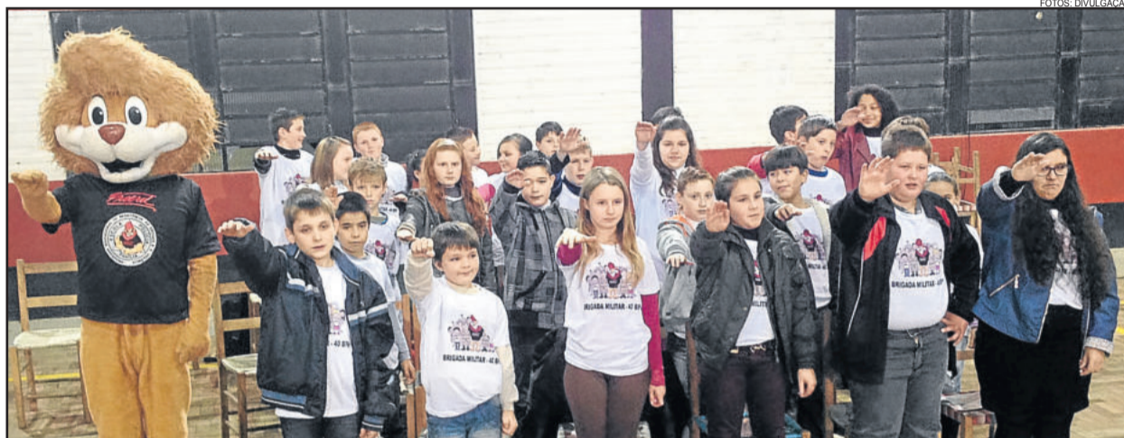
No último ano foram 28 crianças que concluíram o Proerd

O Programa oferece estratégias preventivas para reforçar os fatores de proteção, em especial referentes à família, à escola e à comunidade, que favorecem o desenvolvimento da resistência em jovens que poderiam correr o risco de se envolver com drogas e problemas de comportamento. Esta estratégia concentra-se no desenvolvimento da competência social, habilidades de comunicação, autoestima, empatia, tomada de decisões, resolução de conflitos, objetivo de vida e independência, e alternativas ao uso de drogas e outros comportamentos destrutivos.