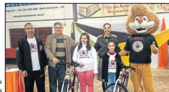
Na edição passada as melhores redações ganharam bicicletas