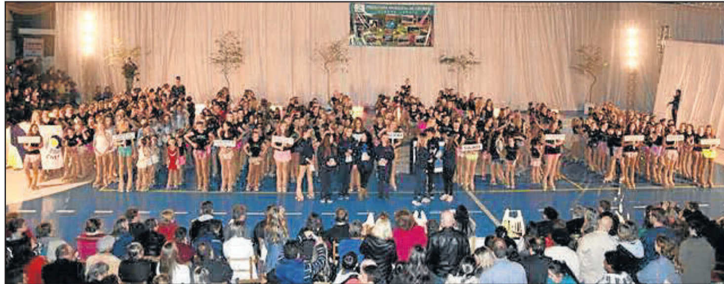
Equipe de professores Arte e Movimento de Patinação