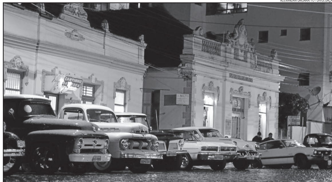
ALEXANDRA UNGARATTO / DIVULGAÇÃO

Carros antigos também estarão em exposição para resgatar a temática das décadas de 20 a 60