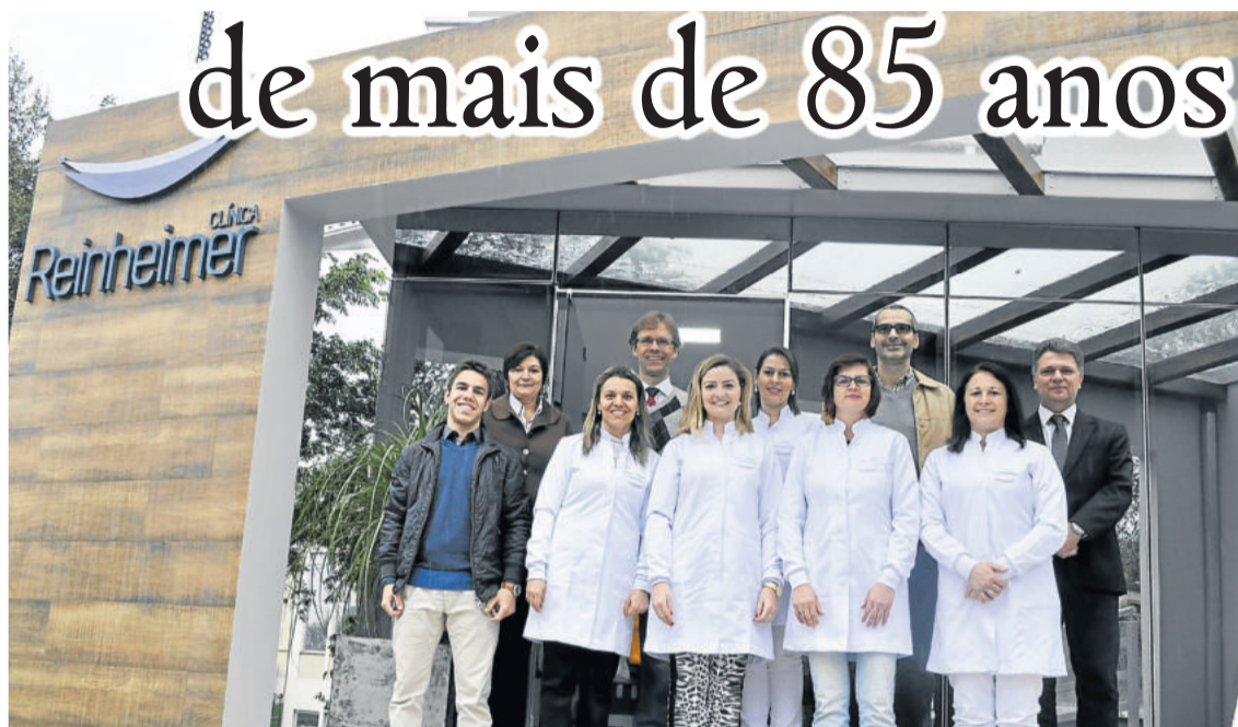
Equipe da Clínica Odontológica Reinheimer