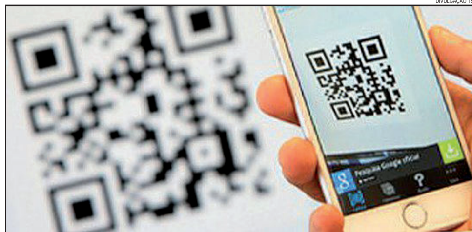
QRCode será uma das novidades - impresso no boletim de urna, via aplicativo permite acesso no smartphone

Outro app que também já está disponível é o "JE Processos". A solução que, não está ligada exclusivamente à eleição, permite o acompanhamento do trâmite dos