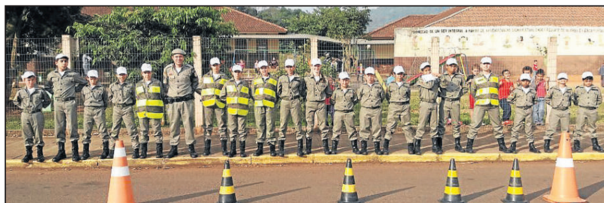
Grupo de alunos da Brigada Mirim

O Projeto "Brigada Mirim", juntamente com a Secretaria de Educação Municipal, organizou uma blitz educativa em frente ao Centro de Educação Municipal de Ensino Fundamental (Cemef) Leonel de Moura Brizola, durante a semana passada. Foi um momento em que os alunos, devidamente fardados e identificados, abordaram os veículos, explicaram aos motoristas questões de segurança e entregaram o adesivo da campanha "Basta de Violência - Campanha por uma Teutônia mais segura. Seja você a mudan-