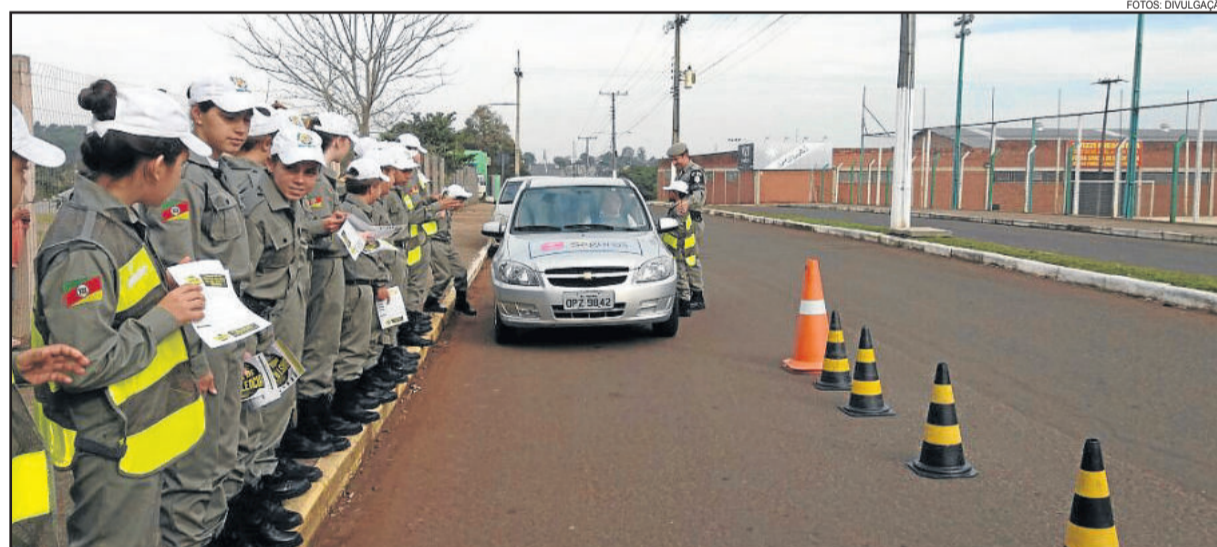
Alunos abordaram veículos para realizar conscientização