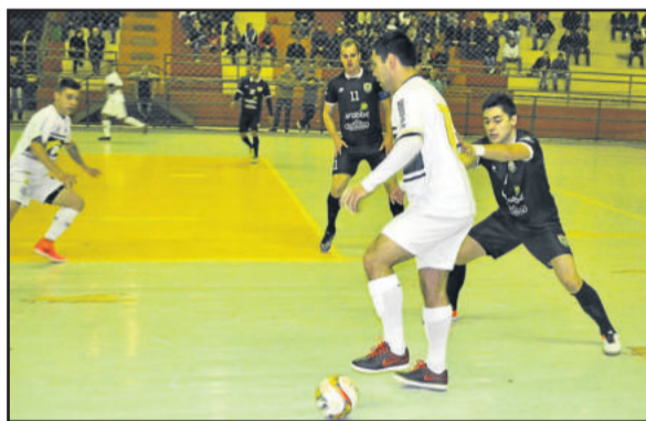
Teutônia Futsal perdeu fora de casa depois de estar vencendo por 3 a 2

go. O gol de empate foi marcado aos 12 minutos, por meio do pivô Pedala. Aos 17min30seg, Ângelo marcou seu segundo e o quarto da ADS-ATF, definindo o placar em 4 a 3. Pelo desempenho das duas equipes, o resultado mais justo seria de empate, na opinião de atletas, comissão técnica e dirigentes da ASTF.