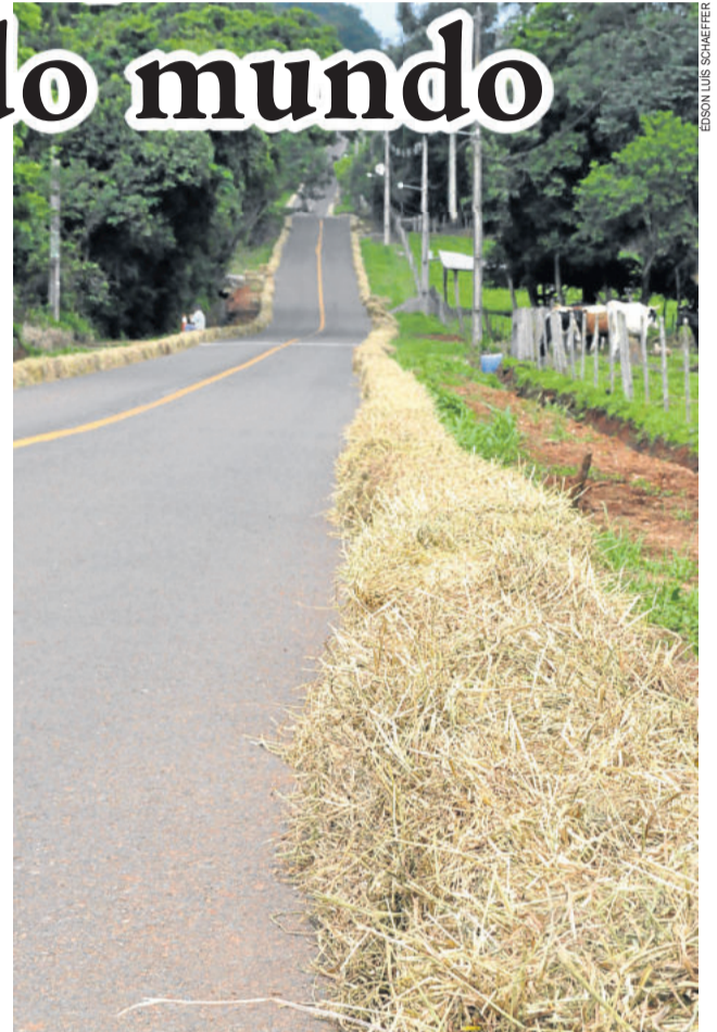
Ladeira da Linha Harmonia recebia os últimos preparativos nesta quinta-feira

O dia mais movimento deverá ser no domingo, quando ocorrem as finais. Para acessar o local, será cobrado o ingresso de R$ 5,00 a partir desta sexta-feira, cujos recursos ficam para a comunidade de Linha Harmonia.