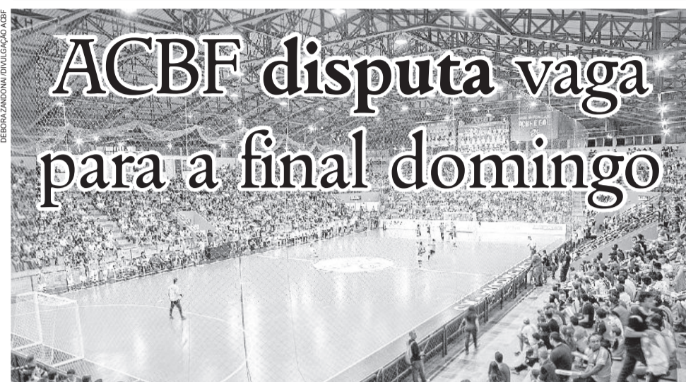
Expectativa é de casa cheia para jogo contra o Brasil Kirin

O Centro Municipal de Eventos Sérgio Luiz Guerra deve ter lotação máxima, às 13 horas de domingo, dia 15, para o jogo de volta da semifinal da Liga Nacional de Futsal. São esperados cerca de 6.500 torcedores para empurrar a ACBF rumo à decisão da competição. Ontem pela manhã, todos os ingressos estavam esgotados.