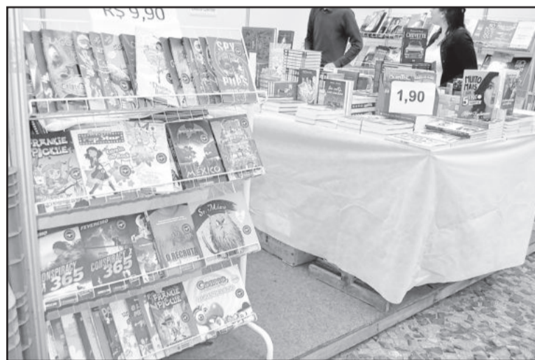
Feira do Livro prossegue até domingo

Os últimos dias da feira reservam atividades especiais: Troca-troca Literário, apresentações de canto, happy hour, jogos literários, apresentações artísticas e espetáculo teatral “Radicci & Genoveva”. A programação é aberta para toda a comunidade.