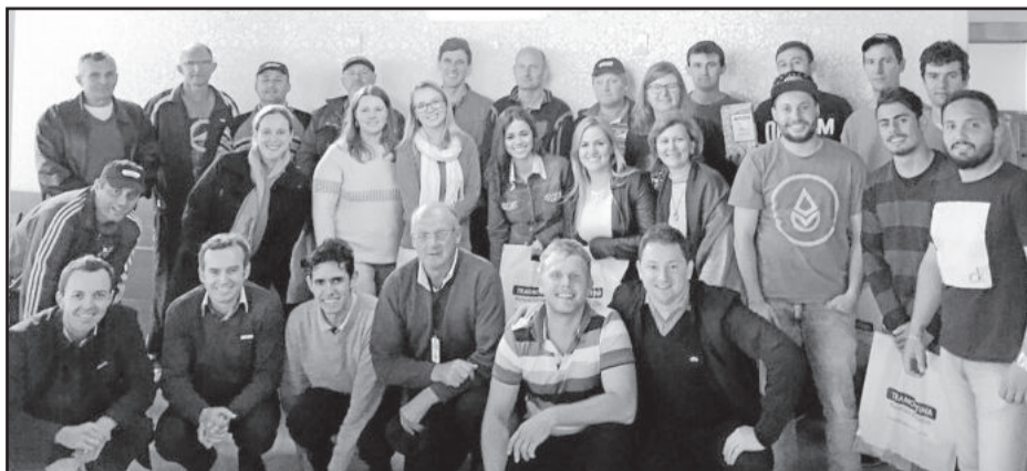
Parceiros realizaram a visita no dia 6 de novembro