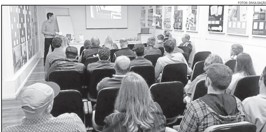
Durante a visita, foi transmitido ao grupo explicação sobre atividades da fábrica

Após a visita, foi proporcionado um almoço, com sorteio de brindes, e, para finalizar a visita, o grupo conheceu o Varejo Tramontina.