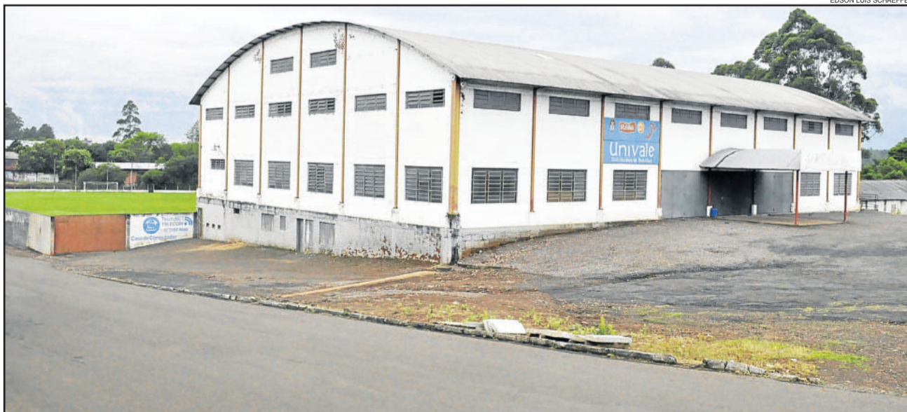
SER Gaúcho comemora 75 anos neste final de semana