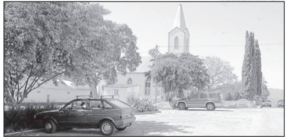
Linha Clara comemora os 79 anos da Igreja Evangélica Cruz