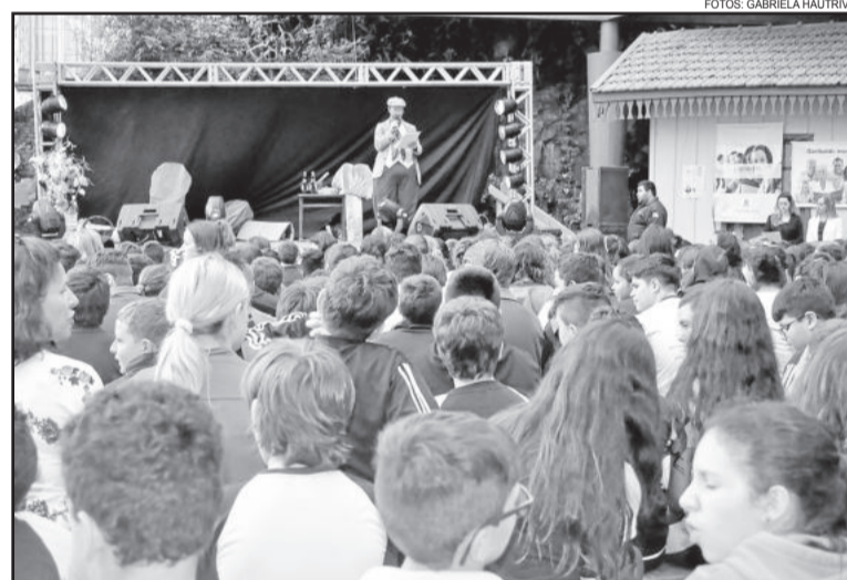
Feira foi aberta oficialmente na manhã de terça-feira