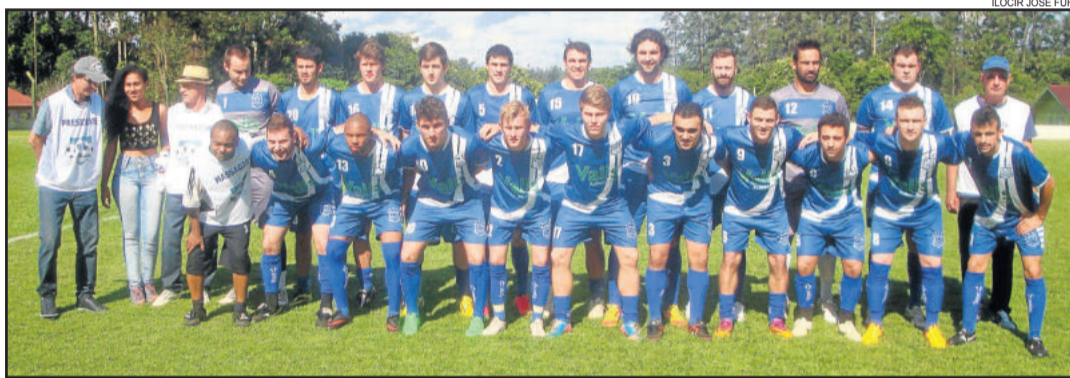
União Campestre, de Lajeado, tem a melhor campanha nos titulares

A Rádio Popular 96,9 FM transmite as duas partidas ao vivo. A cobertura inicia por volta das 15 horas, com o Paparicando a Gorduchinha, que antecipa as informações e emoções das partidas.