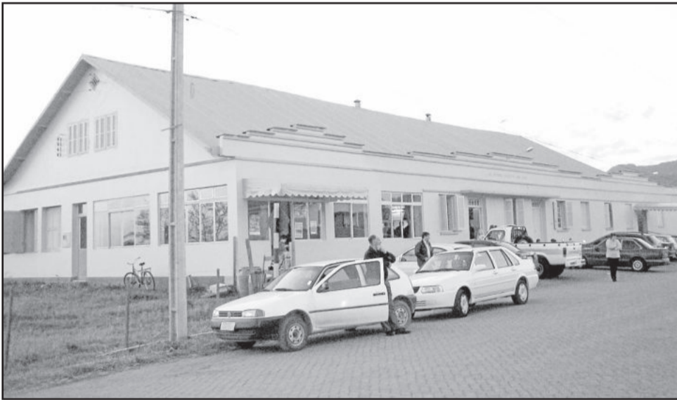
Baile de Kerb será na sociedade de Linha Clara