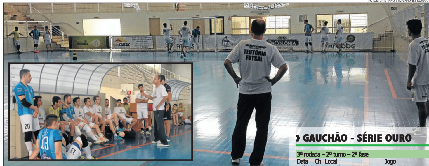
Teutônia Futsal volta a enfrentar a Assoeva pela segunda fase, agora em Venâncio

2016, além de quebrar um tabu histórico de nunca ter vencido a equipe de Venâncio Aires desde 2005. A partida deste sábado inicia às 20 horas no Ginásio Poliesportivo, em Venâncio Aires. A Rádio Popular FM transmite a partir das 19 horas.