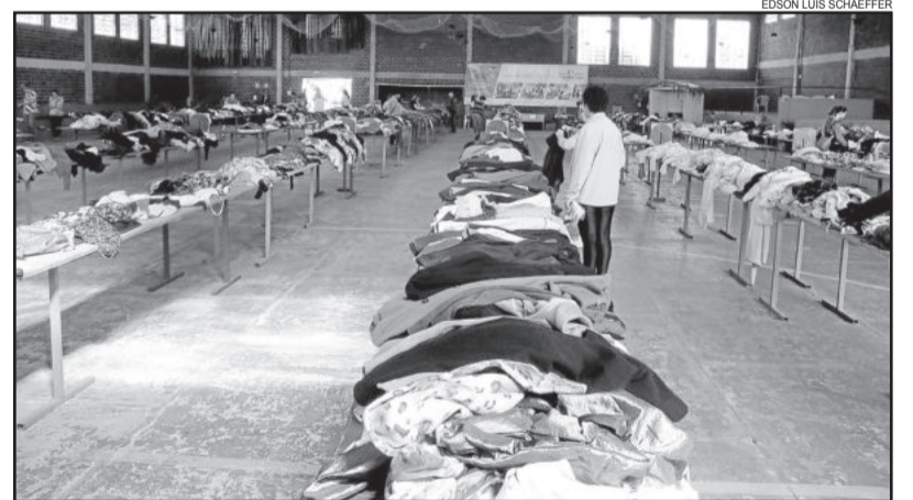
Milhares de roupas foram comercializadas a preços acessíveis

Para dar continuidade ao trabalho desenvolvido ao longo de 123 anos, em manter e oferecer uma estrutura de qualidade, a instituição necessita constantemente de doações em dinheiro, materiais e alimentos. Outra forma de ajuda, que é muito bem vinda, é a visitação ao lares, que deve ser previamente agendada. Mais informações sobre formas de ajudar, pelo telefone (51) 3653-1556.