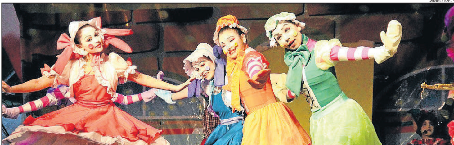
Musical de abertura “Em busca da Fábrica Encantada”

15 - 3ª Noite Branca - noite em que o comércio ficará aberto até às 22h30min com ações especiais. Realização: Rota de Compras, Secretaria de Turismo e Cultura e Apeme.