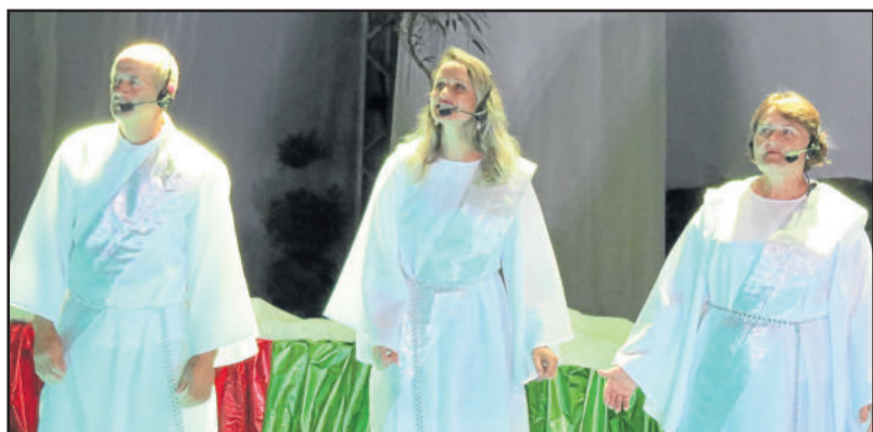
Família Weber interpretando a Oração da Família