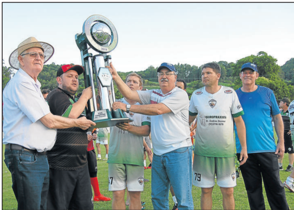
SER São Cristóvão é vice-campeã regional