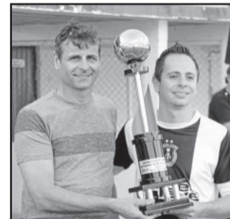
Disciplina - Sexta Livre Categoria Aspirante