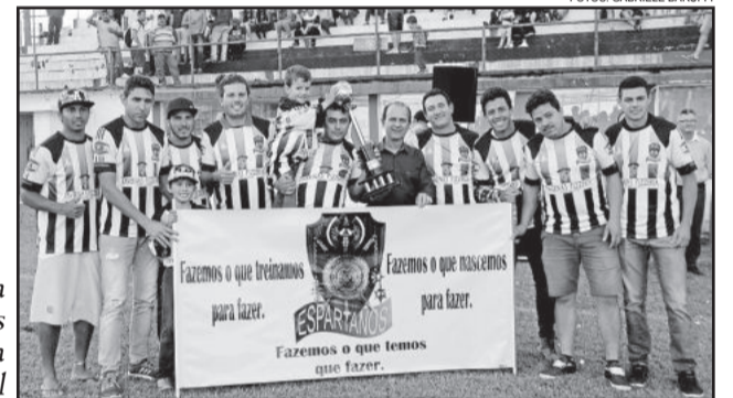
Disciplina Espartanos Categoria Principal