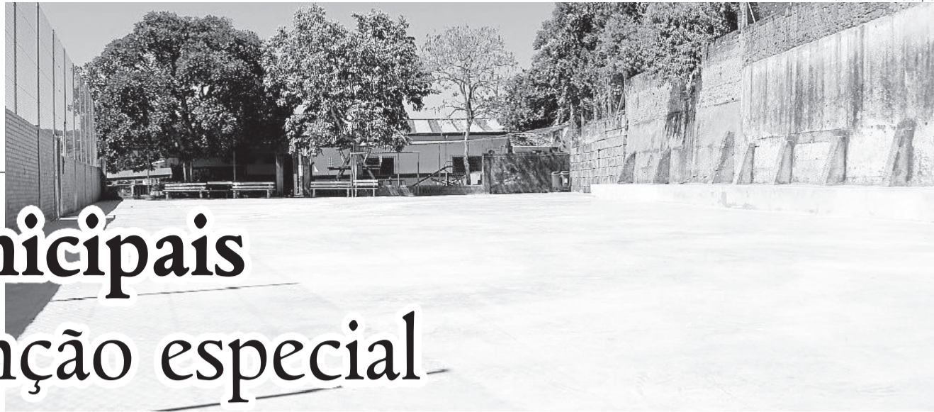
Piso da quadra de esportes da EMEF Nossa Senhora da Glória passou por reforma geral

A Prefeitura de Garibaldi, através da Secretaria de Educação, realiza, durante o ano, melhorias constantes na estrutura física das escolas municipais. Recentemente, foi a vez da escola de Educação Infantil Pingo de Gente, e da escola de Ensino Fundamental Nossa Senhora da Glória.