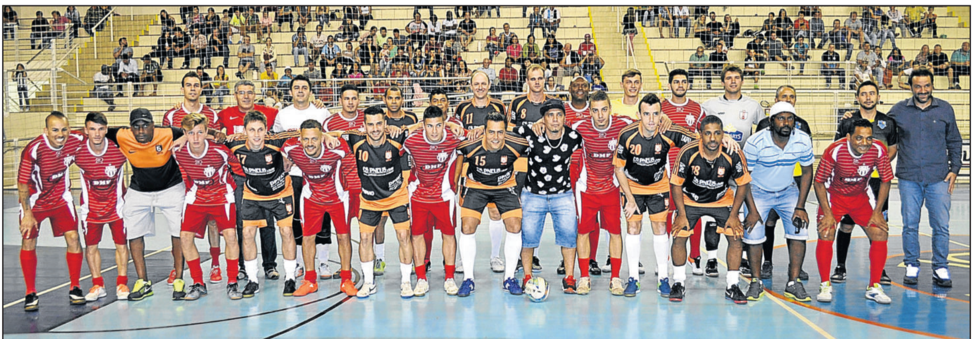
Jogo principal ficou por conta de Força Jovem (Laranja e Preto) e Amigos do Ivo (Vermelho e Branco)