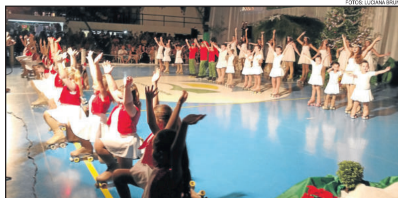
Patinação marcou presença