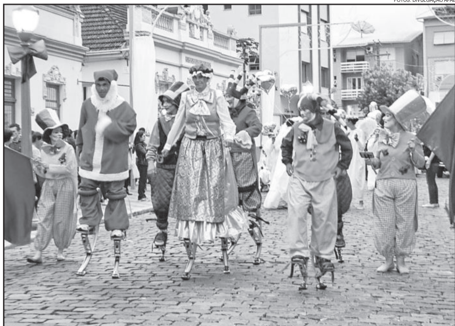
Público aplaudiu cada alegoria apresentada na Buarque de Macedo

Programação emocionou e levou à comunidade mensagens sobre o verdadeiro espírito de Natal