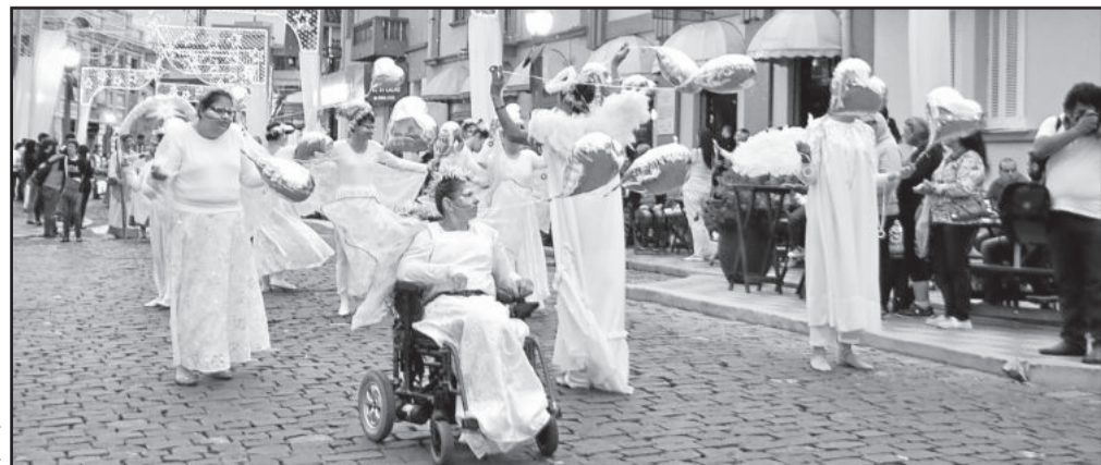
Cortejo Natalino encantou e emocionou a comunidade presente

A comunidade encantou-se e aplaudiu calorosamente cada alegoria do cortejo natalino. Por este motivo, a entidade agradece a todos que se fizeram presentes e a receptividade sempre afetuosa que recebe das pessoas. A APAE aproveita para agradecer o apoio da comunidade garibaldense em todas as apresentações e iniciativas realizadas pela entidade ao longo do ano e deseja um 2017 repleto de solidariedade e conquistas.