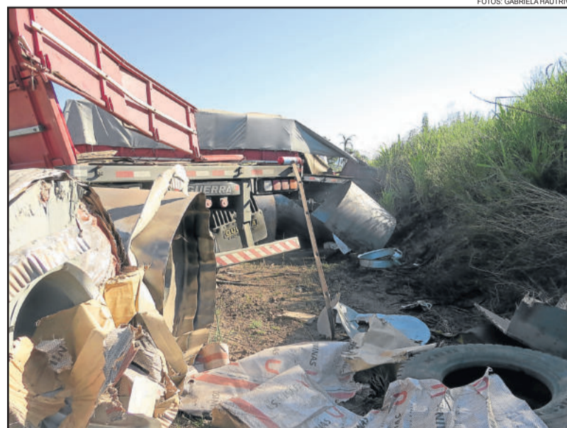
Motorista não sofreu ferimentos

Um acidente de trânsito foi registrado por volta 17 horas desta segunda-feira, dia 12. O motorista, de 37 anos, seguia em um caminhão Bitrem, com placa de Horizontina/RS, pela RSC-453 (Rota do Sol). No trevo de acesso ao município de Westfália, ficou sem freio no veículo e bateu em um barranco. O motorista é natural de Três Passos e seguia no sentido Garibaldi - Estrela. O caminhão estava carregado com bobinas de aço. Apesar do veículo ter sofrido muitos danos, o condutor não teve nenhuma lesão. Ele não precisou de atendimento hospitalar. A ocorrência foi atendida pelo Corpo de Bombeiros Voluntários de Teutônia, Polícia Rodoviária Estadual e SAMU.