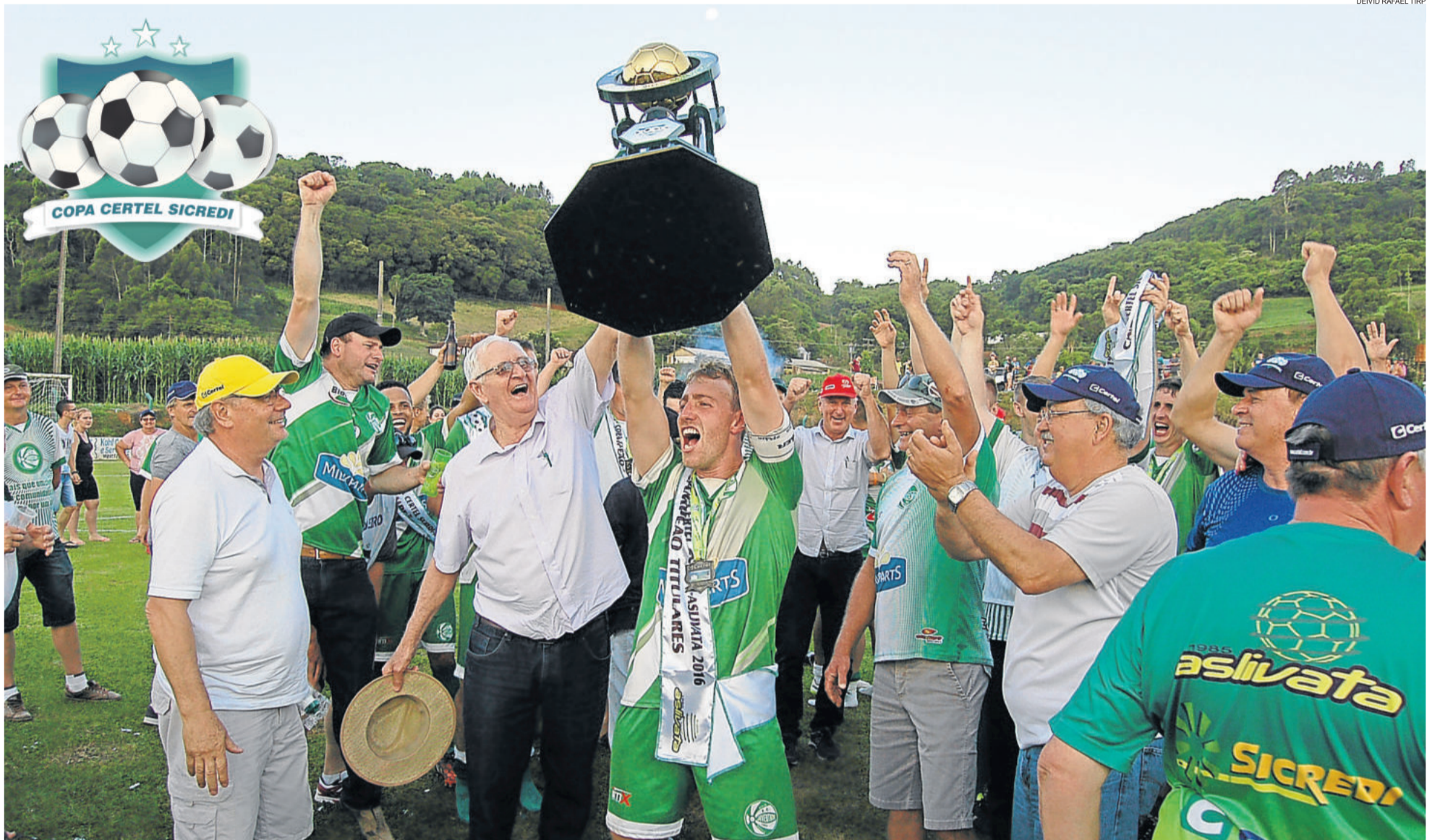
São Cristóvão vence de virada, por 3 a 2, nos 90 minutos regulamentares. Assim, taça foi erguida após disputa de pênaltis. Nos Aspirantes, União Campestre foi campeão. Nos Veteranos, título é do Arroio do Ouro. Confira hoje os pôsteres do Juventude e do Arroio do Ouro. REGIONAL 2016 > 20, 21 E 22