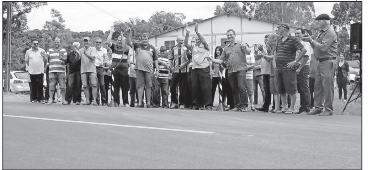
Moradores fizeram o desenlace da fita, simbolizando a entrega da obra