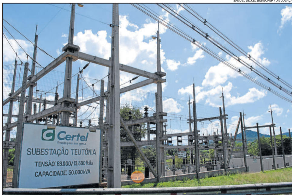
Subestação rebaixadora de Teutônia