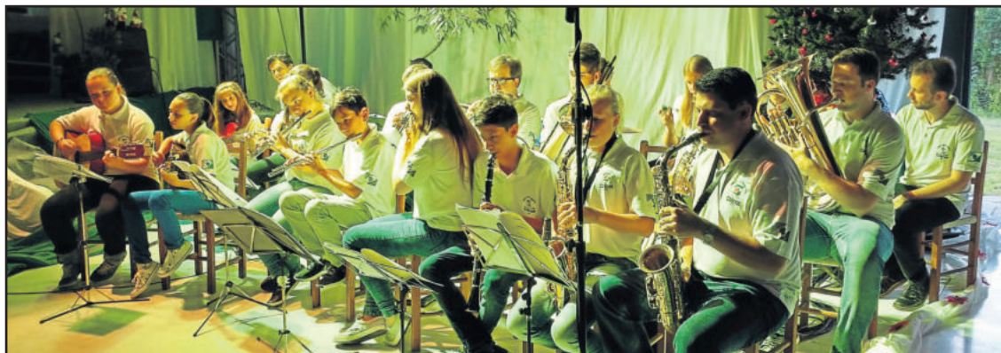
Grupo Instrumental apresentou várias músicas