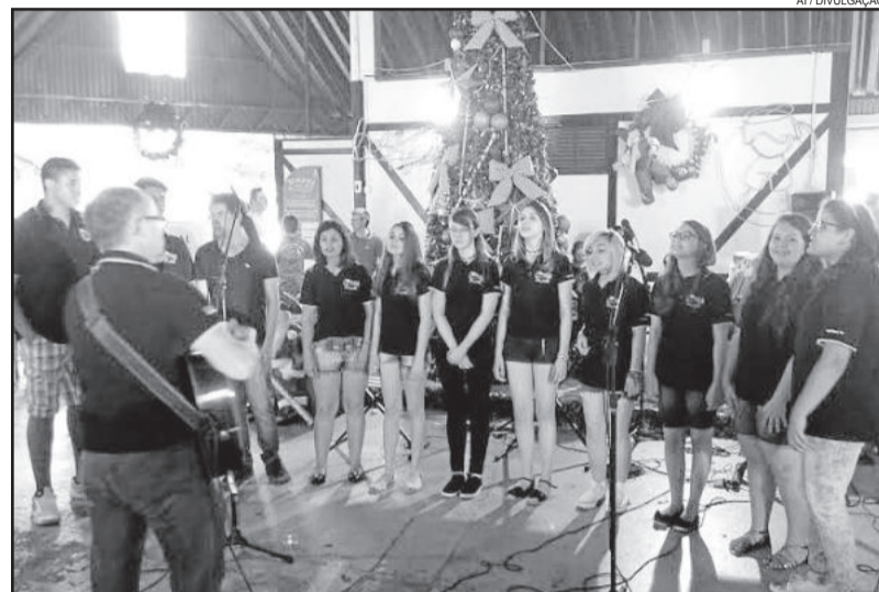
Alunos do Centro Cultural 25 de Julho participaram das apresentações