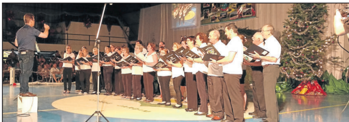
O grande coral do Município