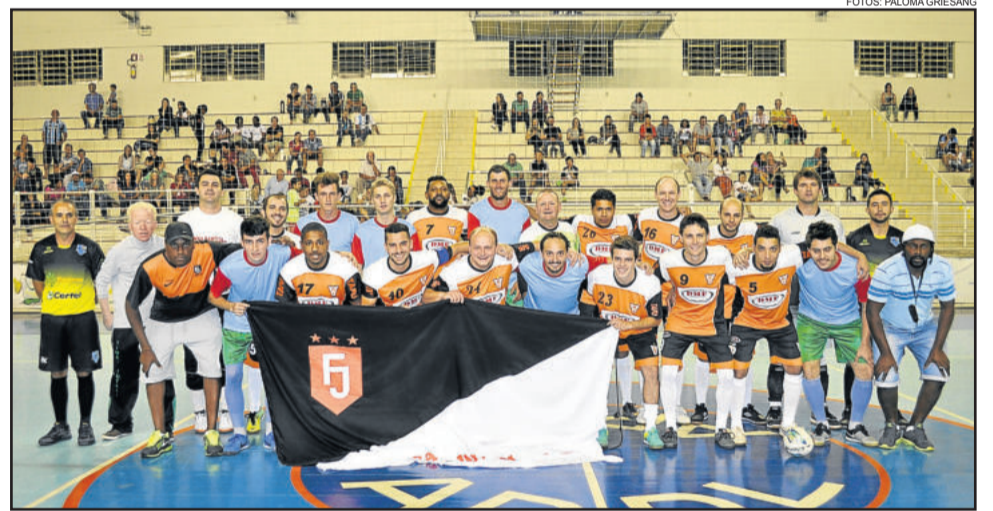
Força Jovem (Laranja e Preto) e Paverama (Azul e vermelho) fizeram segunda partida da noite