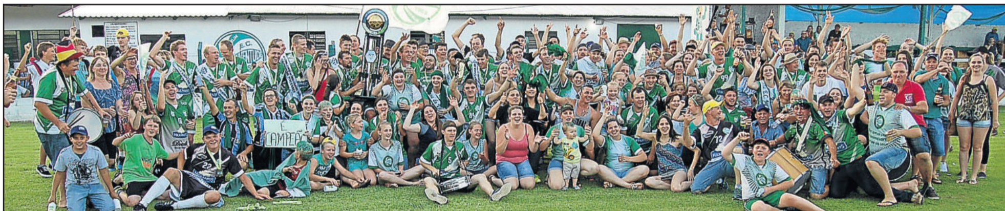
Berlim virou a noite e a madrugada festejando o título regional