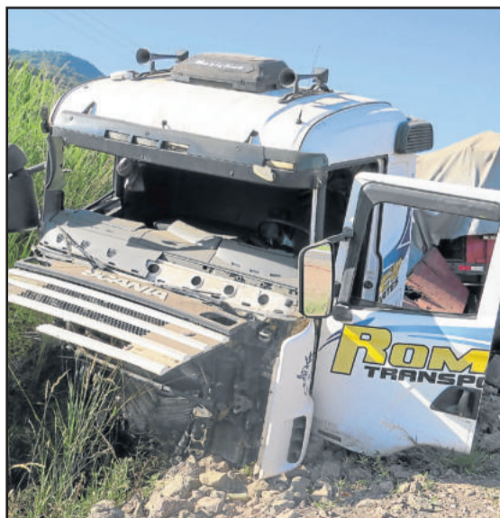
Caminhão ficou totalmente danificado

Homem, de 37 anos, não sofreu nenhum ferimento. Caminhão tinha placa de Horizontina - RS