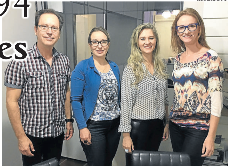
Parte da equipe do Simase

Em média, são atendidos 60 adolescentes por mês.