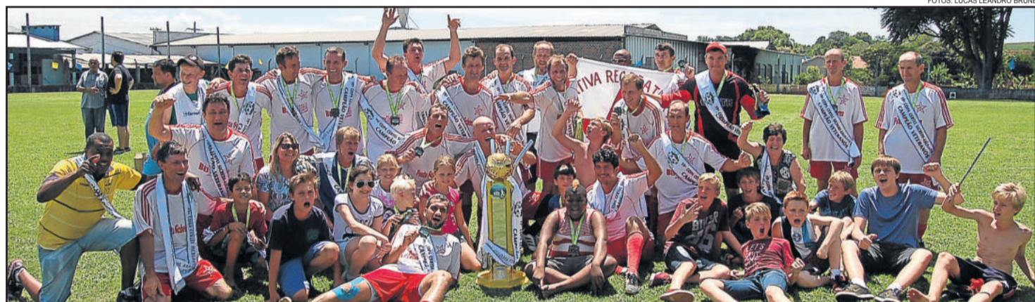
Arroio do Ouro comemorou o título regional de Veteranos