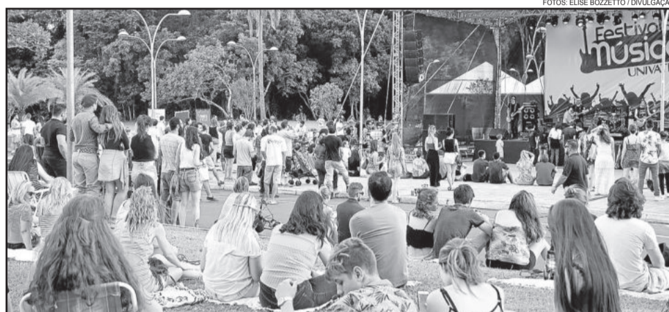
Programação reuniu bom público na avenida em frente à Univates

A programação natalina da Univates segue até o dia 18 de dezembro. Saiba mais em www.univates.br/evento/natalunivates .