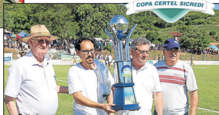
Navegantes de Encantado: vice-campeão dos Aspirantes