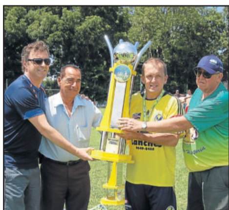
Águia Azul ficou com o vice-campeonato