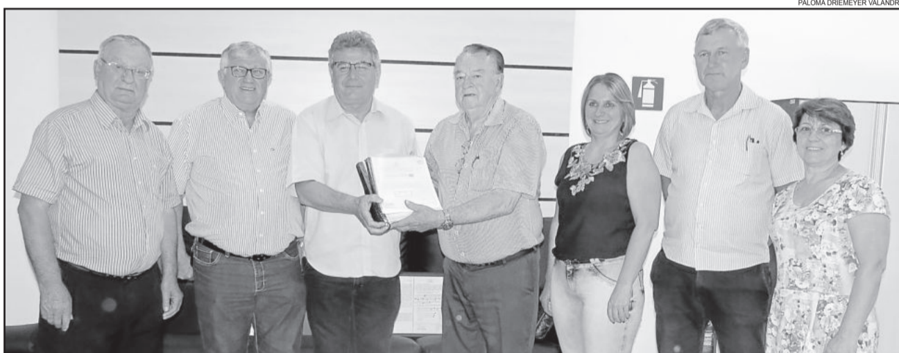
Integrantes da Comissão de Emancipação entregaram documentação à Administração Municipal nesta segunda-feira