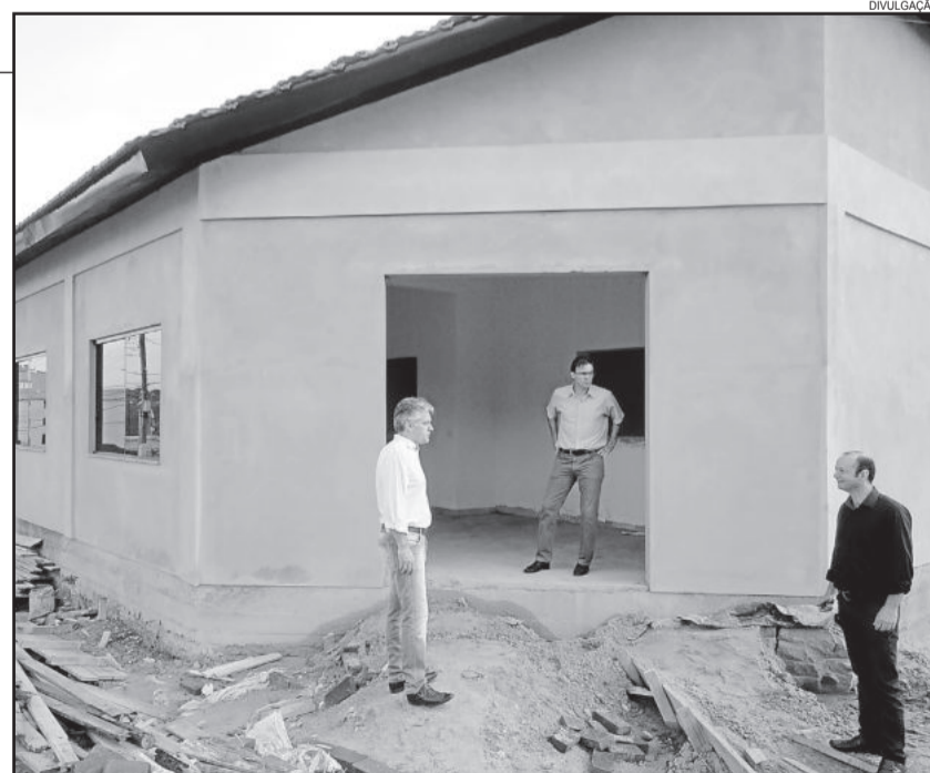
Prédio está tomando forma

A segunda parte da obra é custeada com recursos de custas judiciais, através de Ministério Público e Justiça de Teutônia.