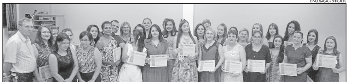
25 mulheres receberam formatura na noite de sábado, dia 10