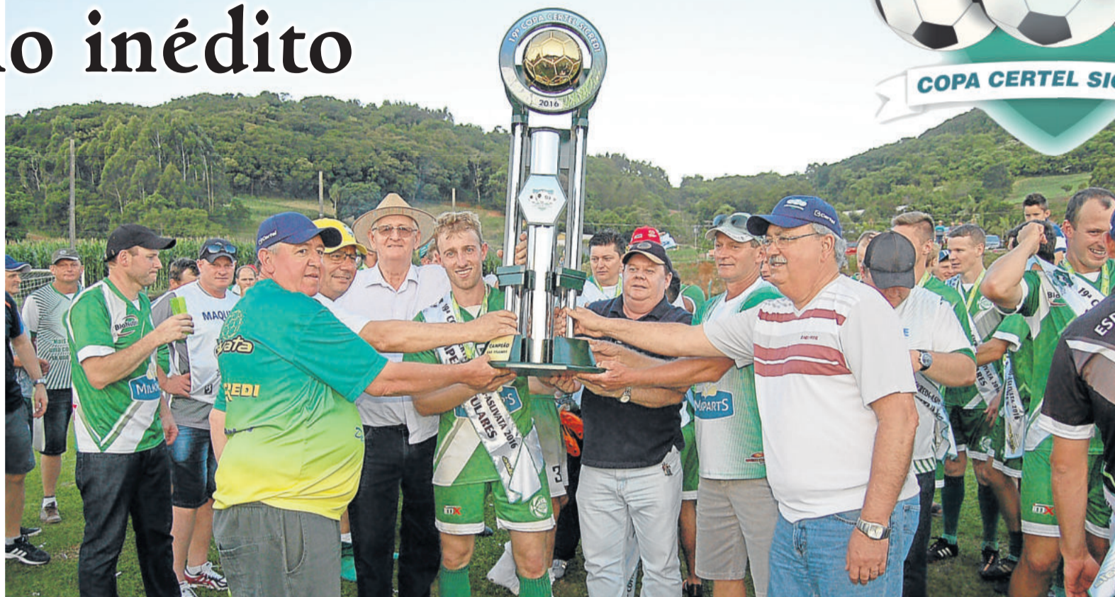
Juventude recebe o troféu de campeão regional